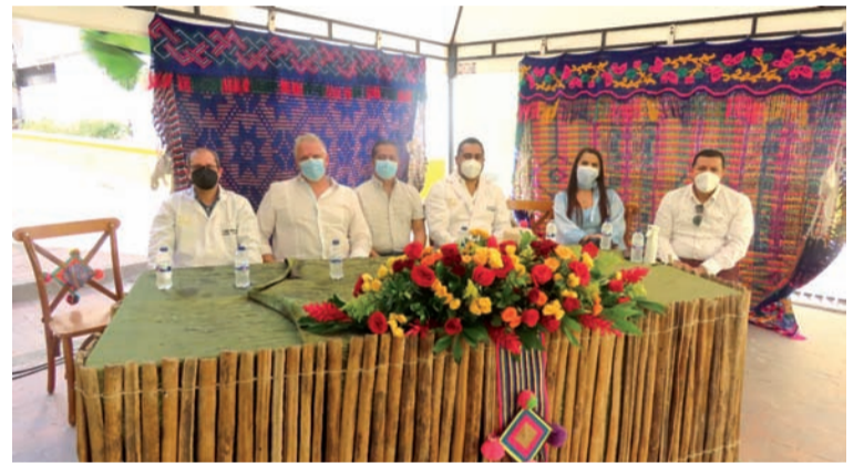
La Clínica Anashiwaya presentó la unidad oncológica, un servicio de alta complejidad para todos los usuarios.

salud, enfocados en la gestión integral y humanizada de los pacientes de este tipo de padecimientos que se encuentran en el departamento de La Guajira.