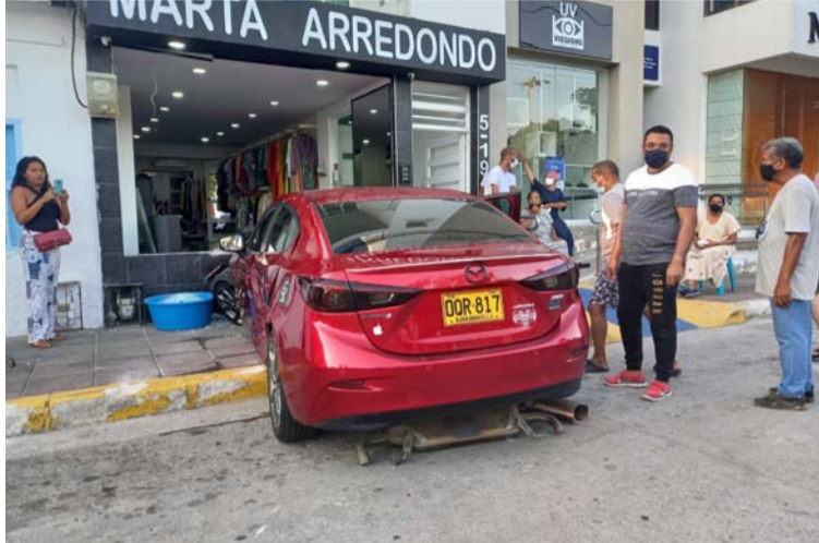
El automóvil involucrado en el accidente en el almacén es de color rojo y placas OQR-817 de Barranquilla.

“Tratamos de dar con el paradero del conductor de este vehículo que generó daños en un establecimien-