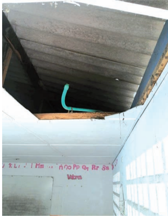
La sede rural El Pozo fue desvalijada en su totalidad por la delincuencia.

Por ello, el rector junto a los docentes a su cargo, elevaron otro oficio al alcalde de Hatonuevo con copia a la Secretaría de Educación para que se pongan al frente de la situación y puedan gestionar el acondicionamiento de las distintas sedes, para un retorno seguro de los estudiantes.