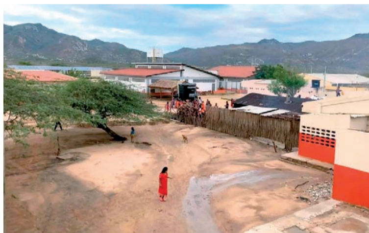
Se aclaró que la sede y toda la edificación fue construida con recursos del Estado y como tal son bienes públicos.

“Si hablamos de autonomía, empecemos entonces por respetar a las demás autoridades que no fueron consultadas”.