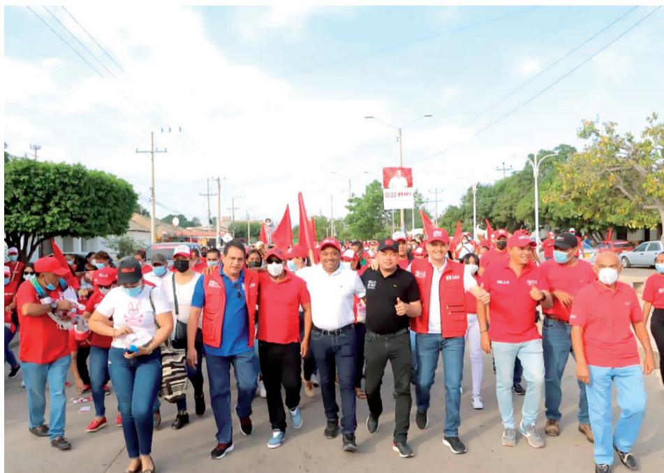
El candidato recorrió las calles del municipio.