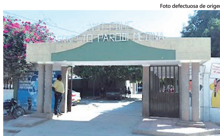
Después de dos años de cierre por la pandemia, las instituciones escolares volverán a las clases presenciales.

En total, se celebró un contrato de dotación por valor de $22.538.088 que impactará en los Centros Educativos Rurales de El Hatico (José Pérez) y Almapoque; la IE Ernesto Parodi Medina, María de los Angeles, El Carmen y Calixto