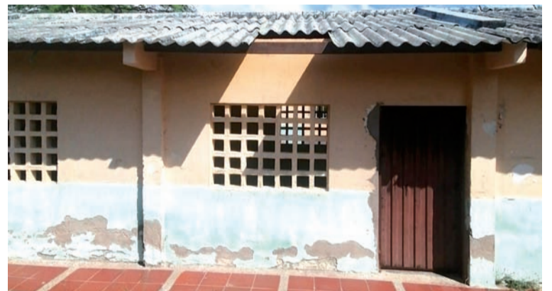
En la sede rural de La Esperanza se llevaron los cables eléctricos y dejaron la institución sin energía.