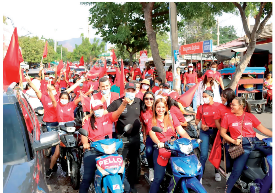
El gremio de transportadores manifestó su respaldo absoluto.