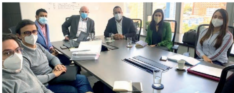
El alcalde de Riohacha, José R. Bermúdez, durante su reunión con el viceministro de Turismo, Ricardo Galindo.

El alcalde también radicó el documento ante la Dimar, para surtir todos los procesos pertinentes del proyecto.