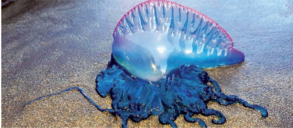
Se le advierte a los bañistas de La Guajira alejarse en caso de ver la fragata portuguesa.

Por su alta toxicidad y naturaleza urticante, esta especie se considera peligrosa para el ser humano, su picadura es dolorosa y