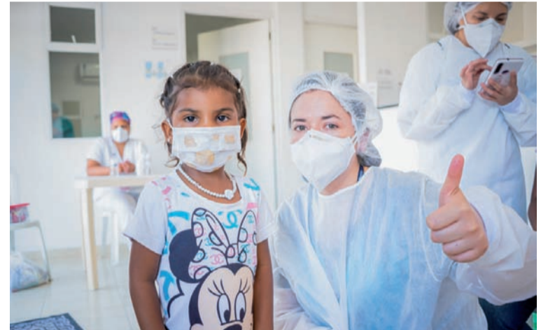
El equipo médico de esta fundación atenderá alrededor de cien pacientes entre niños y adultos.

nados que hicieron parte de la iniciativa ‘Rodando por una Sonrisa’, con la cual realizaron un recorrido desde Bogotá hasta La Guajira, con el fin de recaudar fondos para esta causa y transformar la sonrisa y la vida de más pacientes de la región.