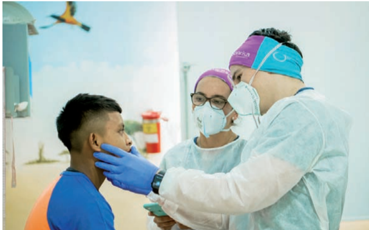
Se atenderán pacientes en las ramas de Fonoaudiología, Nutrición, Cirugía Plástica, Pediatría y Odontología.

El equipo multidisciplinario de 40 profesionales en disciplinas como: fonoaudiología, cirugía plástica, nutrición, pediatría, odontología, trabajo social y psicología a niños, y adultos estudiaron a más de 100 pacientes y adicionalmente, como parte del programa Nutriendo Sonrisas, la Fundación entregó suplementos nutricionales a familias que hacen parte