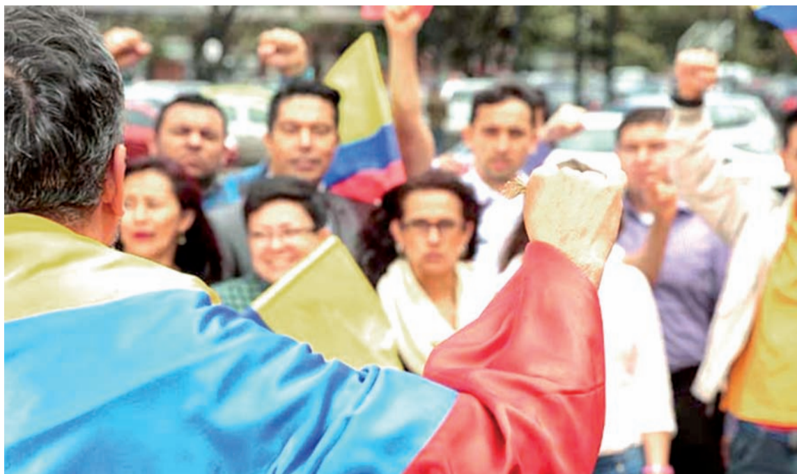
La Registraduría explicó que las candidaturas podrían ser inscritas por partido.

El sábado 29 de enero comenzaron las inscripciones de candidatos a la Presidencia y Vicepresidencia de la República, que participarán en las elecciones del próximo 29 de mayo.