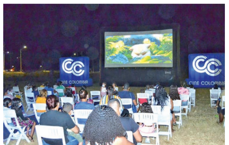
La administración de Maicao logró la llegada al municipio de la compañía cinematográfica Cine Colombia, por medio de su programa Ruta 90, que viene llevando la experiencia del cine a diferentes rincones del país. La noche del pasado viernes fue de alegría y entusiasmo para niños y adultos del barrio Erika Beatriz, puesto que disfrutaron de una función de cine en pantalla gigante y con equipos de última tecnología al estilo de las grandes ciudades.