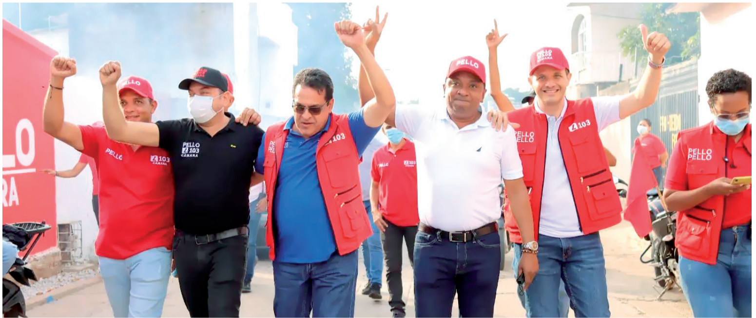
Importantes líderes políticos de San Juan acompañaron al candidato.

Además de enfocar su gestión en la generación de empleos en el territorio, 'Pello Pello' se comprometió