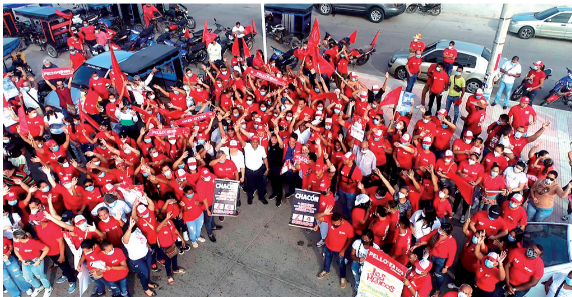
El apoyo de la gente en San Juan del Cesar fue masivo.

gestionar la puesta en marcha de la segunda fase del megaproyecto del río Ranchería, lo que beneficiaría a todos los habitantes de San Juan, especialmente a los agricultores y ganaderos.