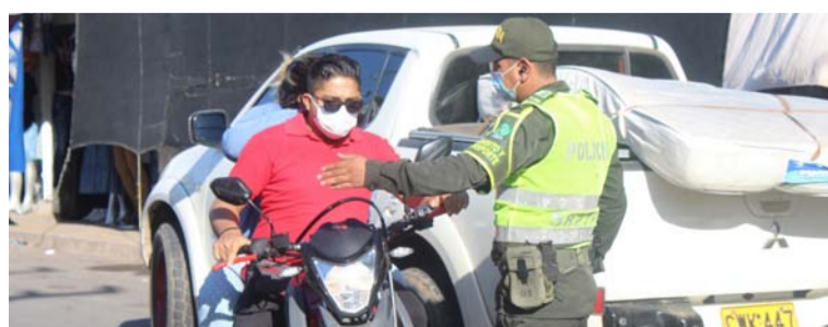
La intención es llevar mensaje a través de las actividades en conjunto con controles de prevención de accidentes.