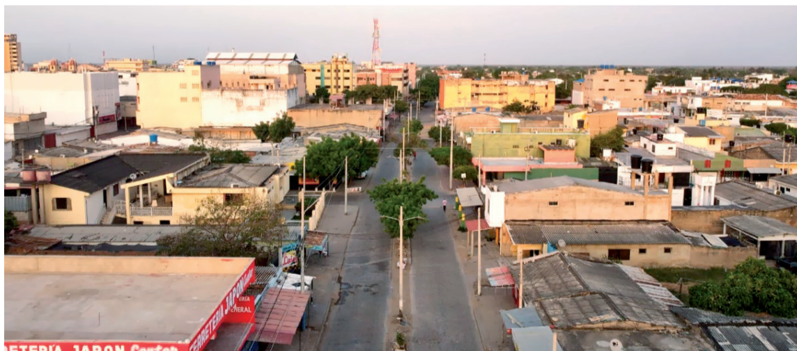
El atraco y lesiones a la pareja ocurrieron en la carrera 8 con calle 5, barrio El Bosque.

“Manifestó la femenina que dos particulares que se movilizaban en una motocicleta (sin más características), los intimidaron para hurtarles. No obstante, las víctimas intentaron correr, cuando los victimarios les dispararon en varias ocasiones”, indicó la Policía.