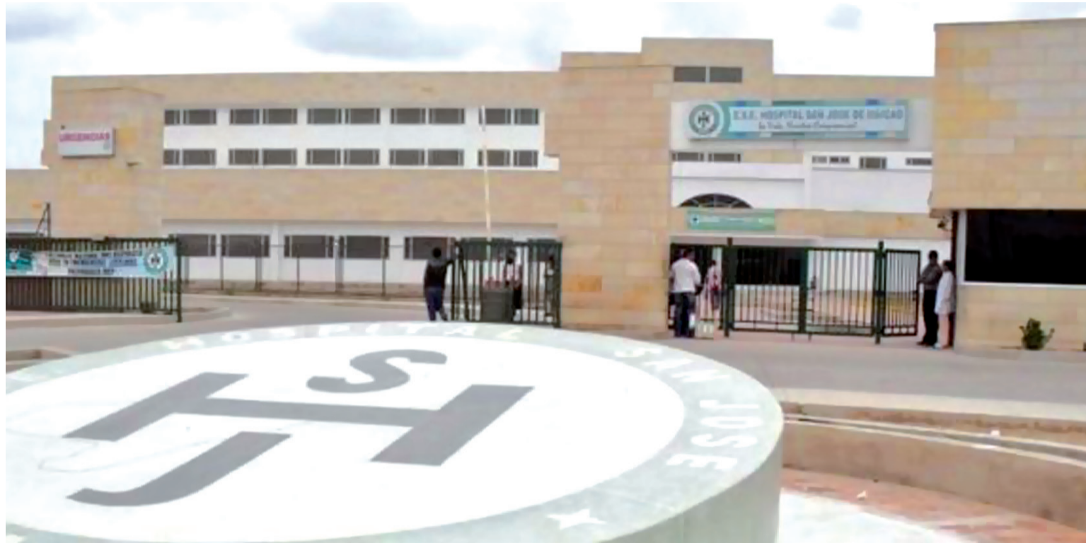
Desde el 13 de junio de 2016 la Superintendencia decidió intervenir forzosamente la entidad hospitalaria.

“Esperamos que el superintendente nacional de Salud se pronuncie de cara a los guajiros de si va a seguir interviniendo el hospital desde Bogotá ya que va