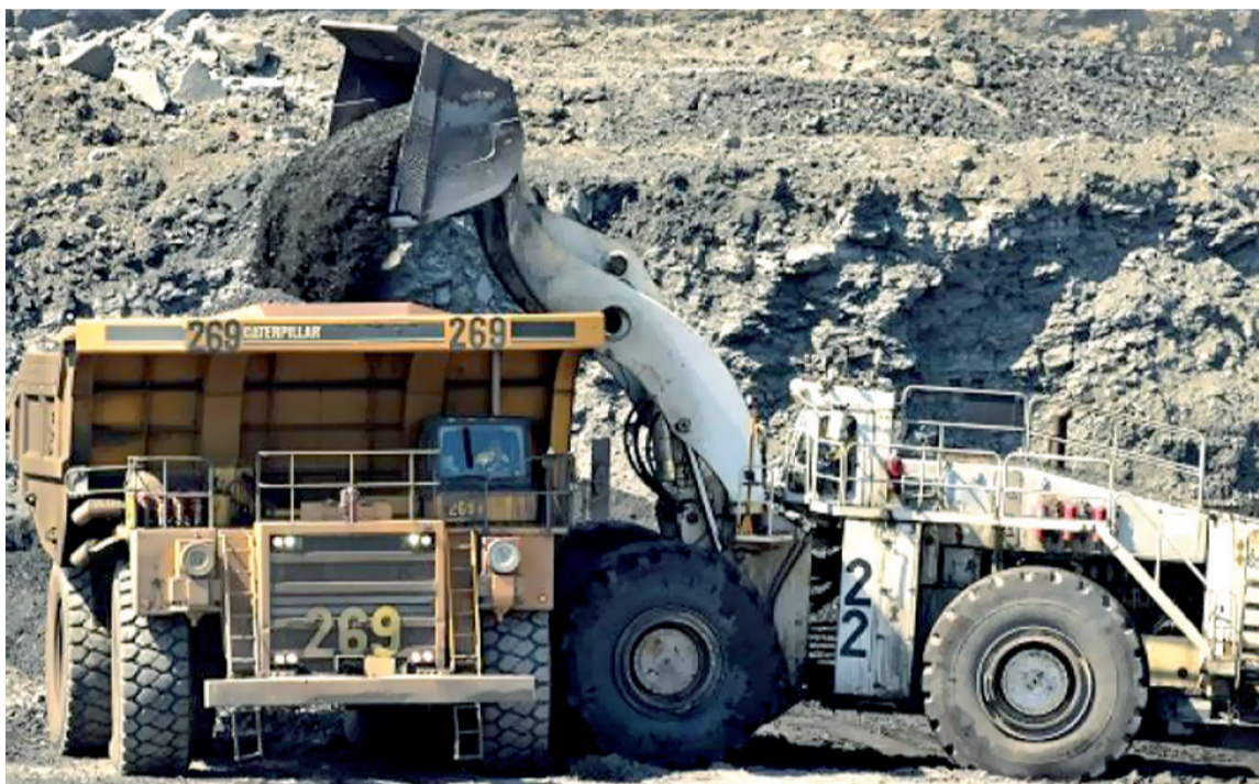
Piden que traslade sus oficinas al Departamento, donde mantiene la producción minera.

Arismendi agregó que “el término es usado para describir relaciones post-coloniales de dependencias en regiones que solo se articulan al modelo de desarrollo nacional, a partir de los recursos naturales que se pueden extraer”.