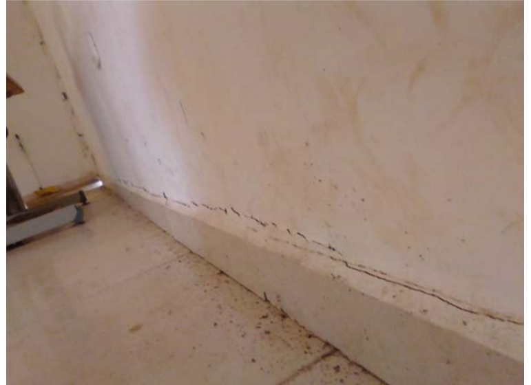
Numerosas irregularidades esperan denunciar los habitantes de Caicemapa a las autoridades de MinInterior.

Luego de la manifestación registrada la semana anterior en el sur de La Guajira, por la posesión del cabildo gobernador del resguardo indígena de Caicemapa, se conoció de varias obras inconclusas.