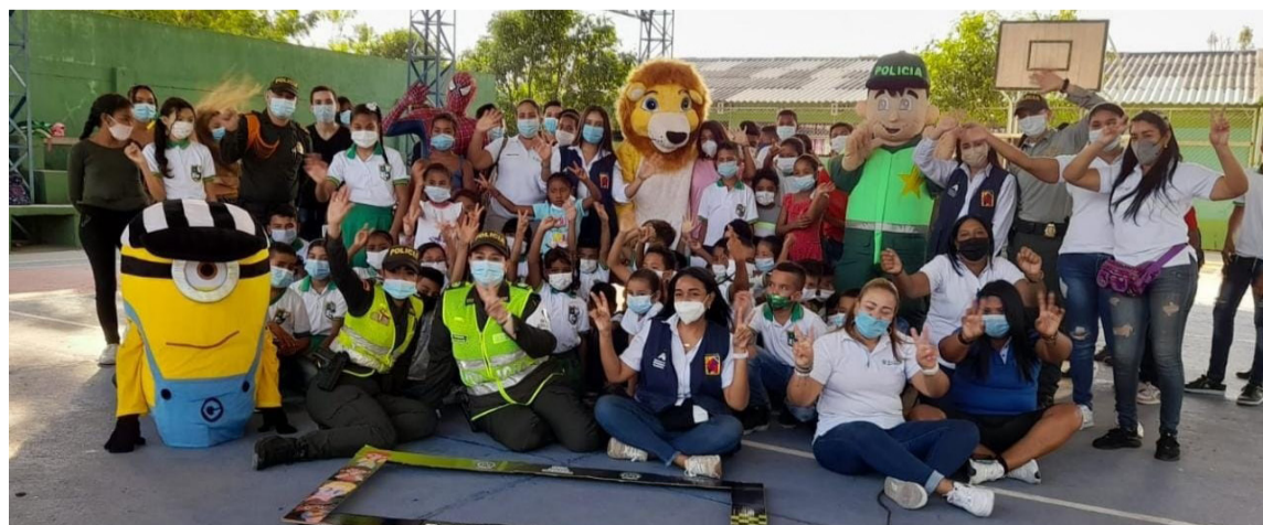
Las Policía socializó valiosa información para evitar el reclutamiento de menores.

El Departamento de Policía Guajira a través del Grupo de Protección a la Infancia y la Adolescencia y los Gestores de Participación Ciudadana adelantaron acciones de prevención, vigilancia y control dirigidas a la comunidad en general, implementando la 'Línea de política pública de prevención del reclutamiento, utilización, uso y violencia sexual contra niños, y adolescentes por parte de grupos armados organizados y grupos delictivos organizados'.