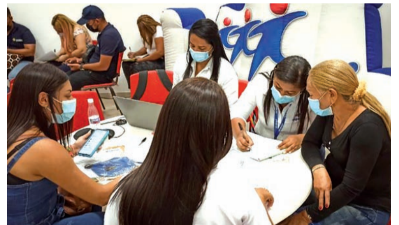
Cajacopi EPS organizó una jornada de prevención en salud, que se prolongará hasta el miércoles 16 de febrero.