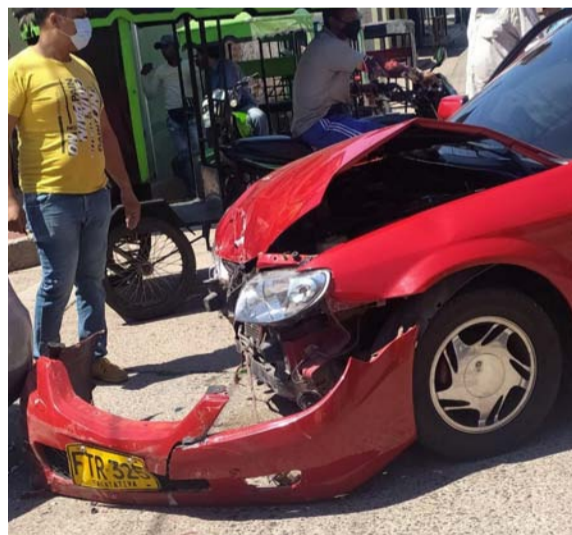
Así quedaron los dos automóviles que se estrellaron en el municipio de Villanueva sin dejar personas lesionadas.