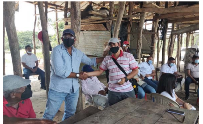
El abigeato es una de las actividades delictivas que más preocupa a la comunidad ganadera de Riohacha.

La colectividad definió como forma de colaboración para las autoridades, suministrar los medios tecnológicos adecuados y necesarios, para que des-