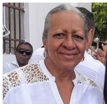
‘La Mina Mendoza’.