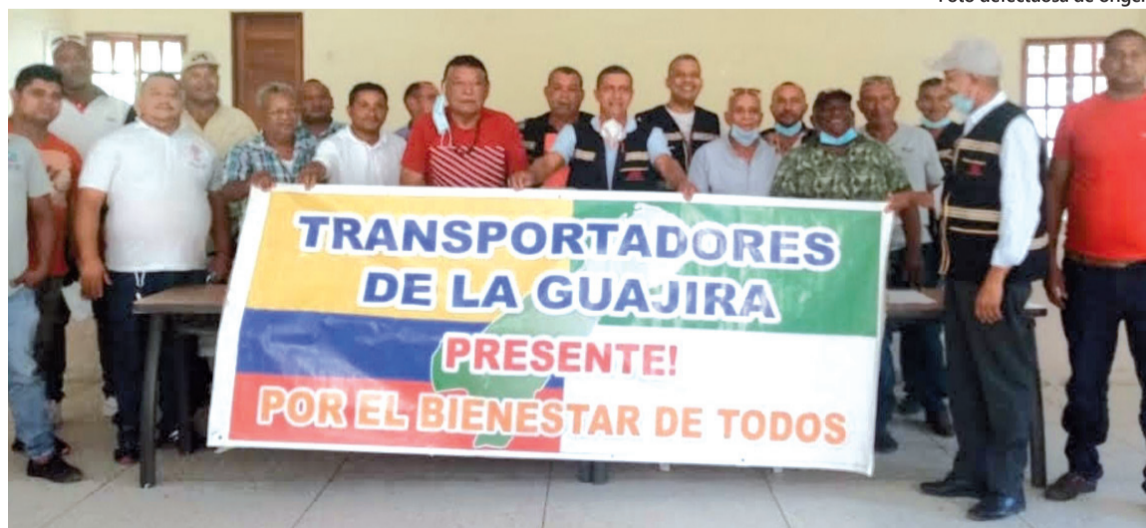
Los transportadores informales solicitan mejoramiento de vía y mayor seguridad vial.