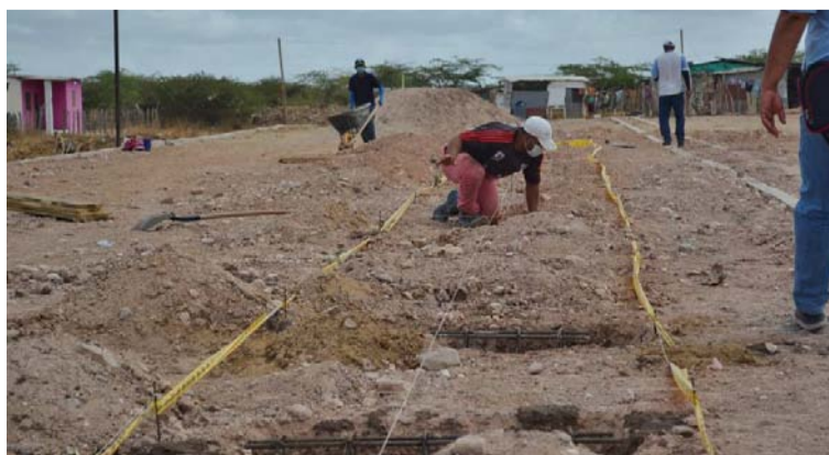
Las autoridades de Maicao están atentos a los avances de las obras en la cancha del barrio San Agustín.

El mandatario dijo que esta obra es consecuente con las gestiones de su gobierno con los organismos de cooperación internacional que apoyan la atención al fenómeno migratorio.