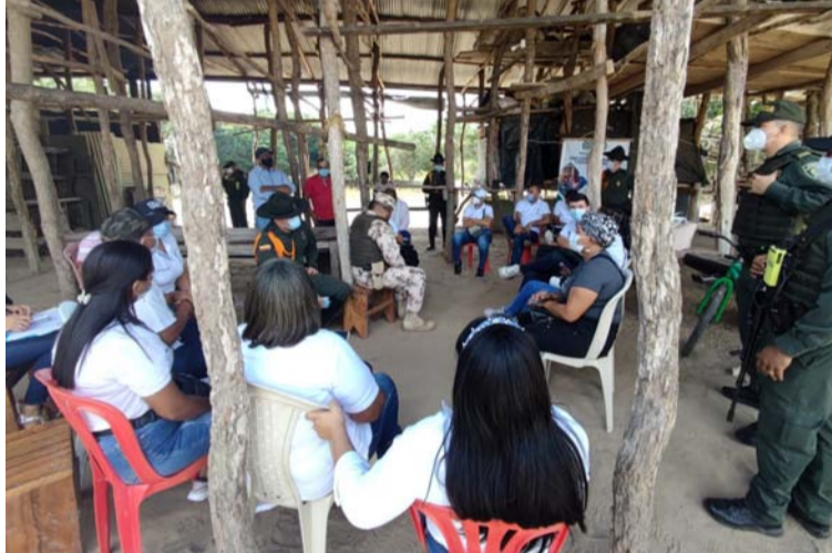
A las reuniones para establecer los acuerdos asistieron todas las autoridades y los corregidores de esa zona.

En el desarrollo del encuentro, el gremio ganadero solicitó el uso de las armas como medio de defensa para ser utilizadas en el momento en que sean despojados de sus pertenencias, así como buscar estrategias con las auto-