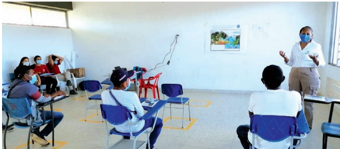
Corpoguajira capacitó jóvenes para que hagan labores de cuidado y protección.