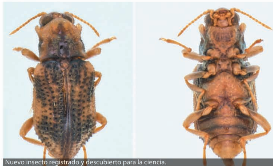
Nuevo insecto registrado y descubierto para la ciencia.

Esta es la cuarta nueva especie que descubre el profesor para el mundo, lo cual ubica a la Universidad de La Guajira como uno de los pilares fundamentales en la producción de conocimiento científico y la proyecta actualmente como un referente en el estudio e investigación de los macroinvertebrados acuáticos en la Región Caribe, la Orinoquía y el país.