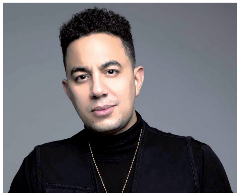
La camioneta en la que se movilizaba Felipe Peláez fue asaltada por ladrones; hurtaron equipos y documentos.

No obstante, Peláez dio parte de tranquilidad a sus seguidores, afirmando que la boletería de su gira había sido vendida en totalidad y que se presentaría en los conciertos que tiene programados pese a las circunstancias.