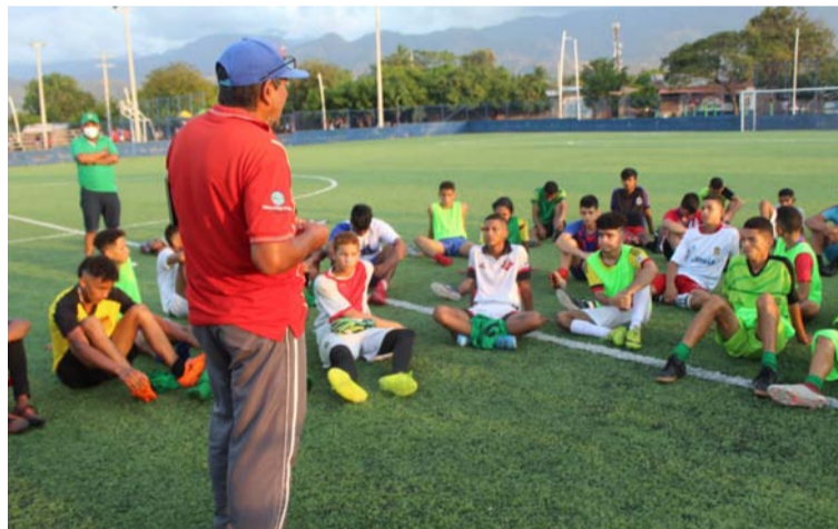
Alrededor de 60 jóvenes atendieron la cita del Club Deportivo Unión Koram Villanueva, en la cancha El Koram.

mostró complacido al ver tanto talento reunido en la cancha El Koram, ubicada en el barrio 6 de Abril.