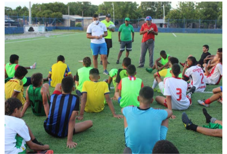
Los jóvenes que asistieron a la convocatoria, en un alto porcentaje, son oriundos del municipio de Villanueva.

“Hemos iniciado con un proceso que para todos es nuevo. El pasado 7 de febrero hicimos la convocatoria