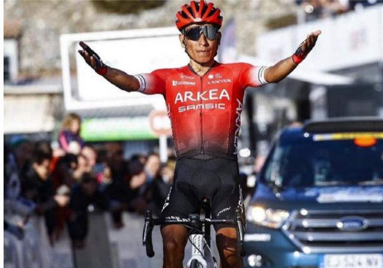
Nairo Quintana, pedalista del Arkea Samsic, ganó el Tour de la Provence, su primera competencia del año.

Nairo cruzó la meta en primer lugar y al sacar una diferencia de 47 segundos a Alaphilippe pudo pasar del décimo lugar de la clasificación al primero y de esta manera quedarse con el título.