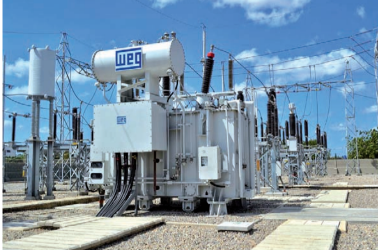
Air-e instaló este nuevo transformador en la subestación de Maicao, una inversión por valor de $9.536 millones.

Las inversiones estuvieron enfocadas en la instalación de un segundo transformador de mayor potencia, que permitirá complementar la distribución de la energía y apoyar el servicio cuando los existentes requieran mantenimiento, así mismo se puso