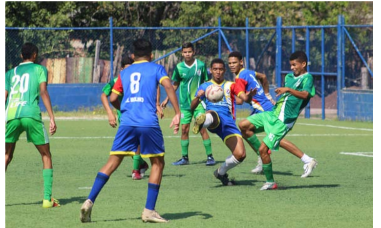
Los equipos disputaron este juego de preparación en la cancha El Koram del barrio 6 de Abril de Villanueva.

Cabe mencionar que la Difutbol notificó a cada club el calendario de juego que iniciará este 26 de febrero.