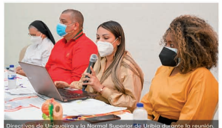
Directivos de Uniguajira y la Normal Superior de Uribia durante la reunión.

Otro tema que se tuvo en cuenta durante la visita fue la inclusión social y educativa de jóvenes con discapacidades. Se propuso estudiar la posibilidad de que estudiantes de los programas de Psicología y Trabajo Social de la