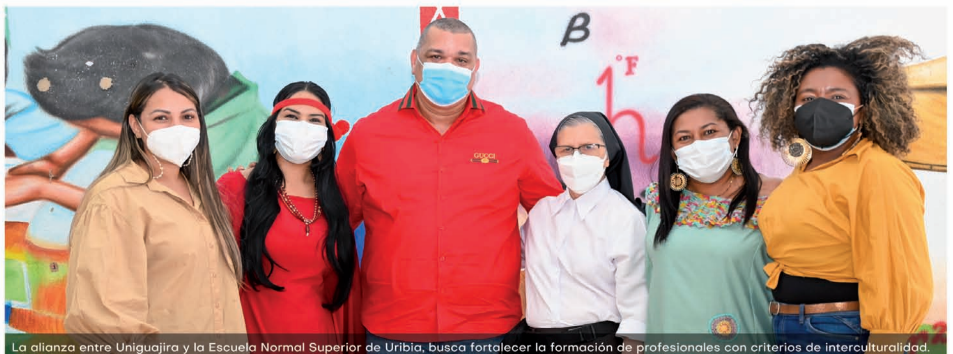
La alianza entre Uniguajira y la Escuela Normal Superior de Uribia, busca fortalecer la formación de profesionales con criterios de interculturalidad.

Cabe resaltar que el convenio motivo del encuentro tiene una duración de cinco años, en los cuales se esperar sacar mayor provecho para enriquecer los conocimientos de la comunidad de la Alta Guajira y garantizar la formación profesional de todos los guajiros.