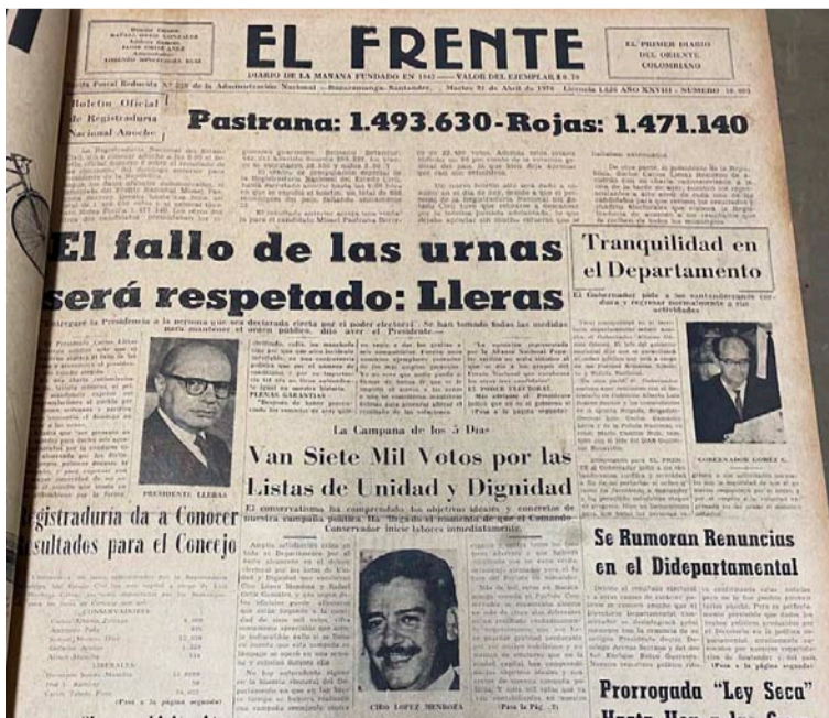
En El Frente, uno de los periódicos de la época, los guajiros leyeron hechos que marcaron la historia del país.