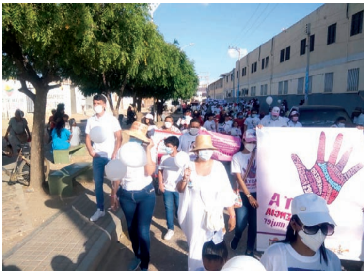
La marcha inició en la plaza principal encabezada por la banda de paz de la institución Alfonso López Pumarejo.