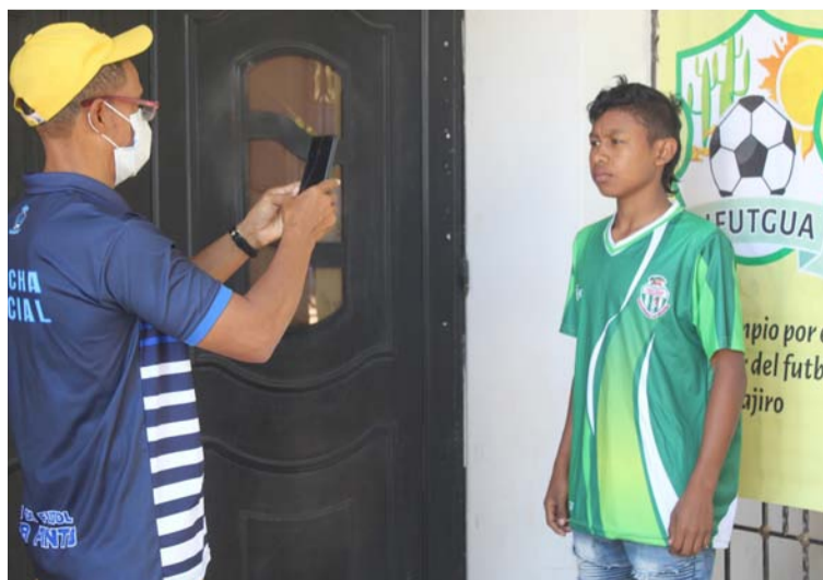
Se obtuvo la información de los 12 clubes participantes.