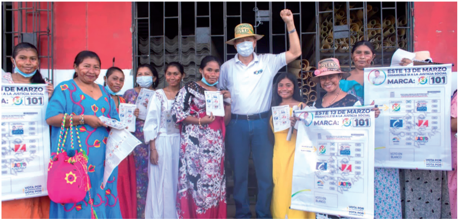
El sábado el candidato Alejandro Rutto estuvo recorriendo el municipio de Maicao, encontrándose con la gente.