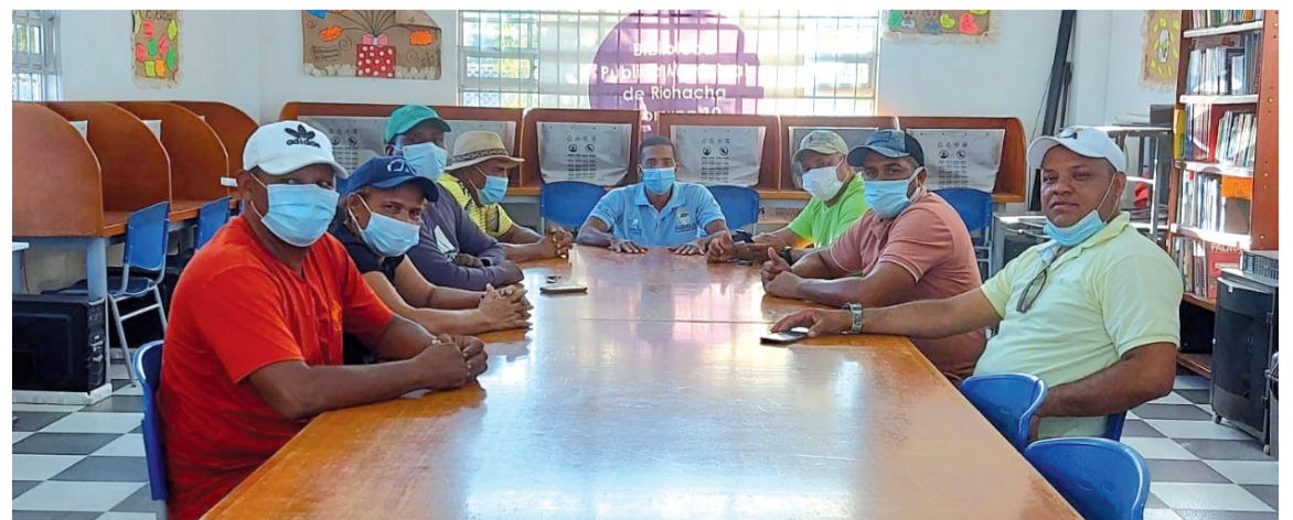
Los ediles de la Comuna 10 pretenden que la comunidad participe y esté enterada.