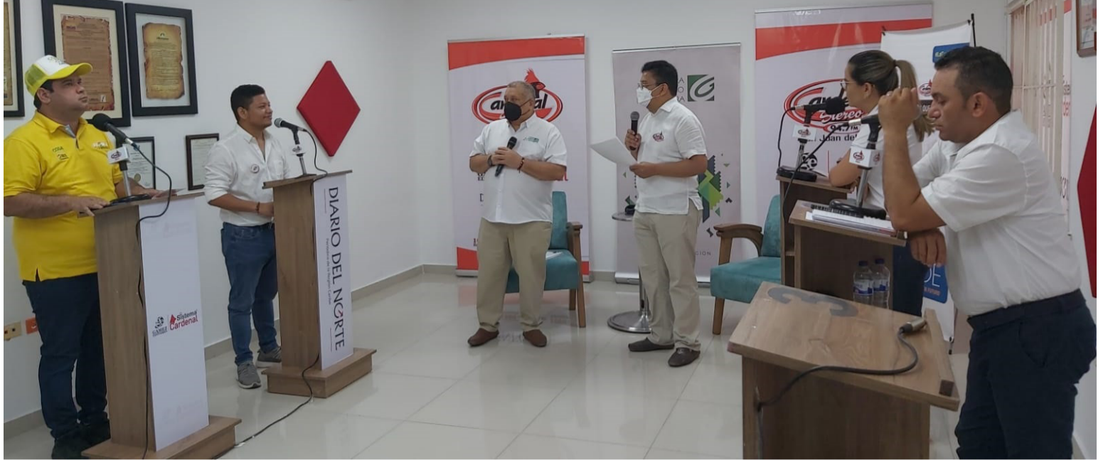
El debate se abrió discutiendo sobre las iniciativas necesarias para garantizar el bienestar de las familias guajiras.