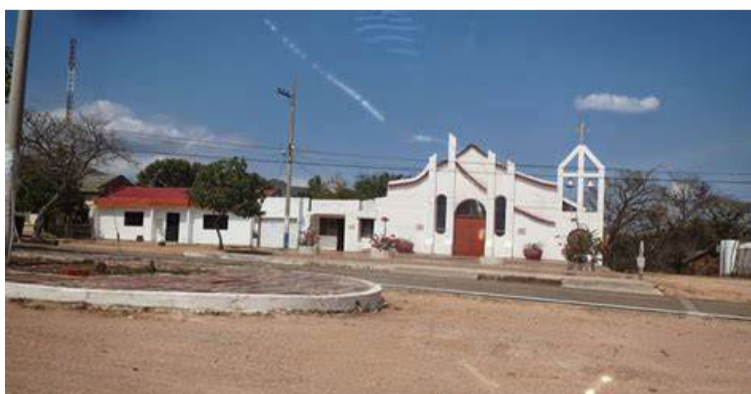
La Junta se ha constituido igualmente en un atractivo turístico para quienes visitan la península de La Guajira.

gan que esa propuesta es de su autoría o que ya la habían hecho hace mucho tiempo. ¡Esperen y verán! Miren, el mejoramiento de la vía San Juan - La Junta se hizo para consolidar la Ruta Folclórica, atraídos por la “ventana marroncita”. Eso es una muestra más que solo hemos pensado hasta ahí.