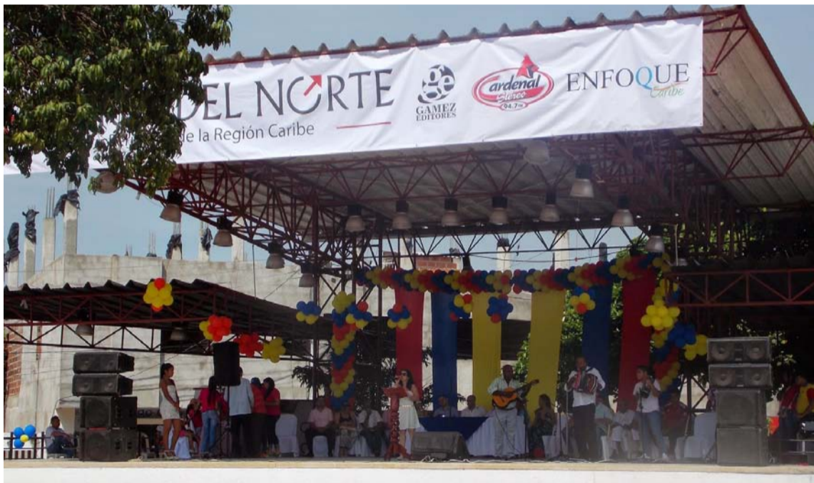
Tarima del Festival Cuna de Acordeones que cada año se realiza en Villanueva.