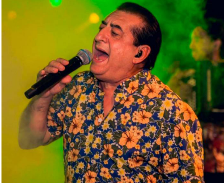
El homenaje a la memoria de Jorge Oñate se realizará el próximo lunes 28 en el municipio de La Paz, Cesar.