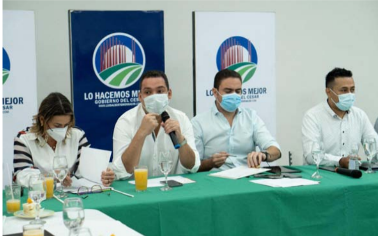
La mesa fue presidida por Andrés Meza, gobernador (e) del Cesar y Nemesio Roys, gobernador de La Guajira.

Dentro de estos proyectos de desarrollo económico, ambiental, social y cultural, se destacan la construcción de infraestructura para el desarrollo turístico del nuevo malecón de Riohacha, por $70.000 millones; la construcción de la Plaza de Ventas – Galería de vendedores ambulantes en Valledupar, por $75.000 millones; los mercados de Maicao y Riohacha, cada uno por $15.000 millones; la construcción de la segunda torre del Palacio de Justicia de Valledupar, por $38.000 millones y la construcción de la infraestructura deportiva del pati-