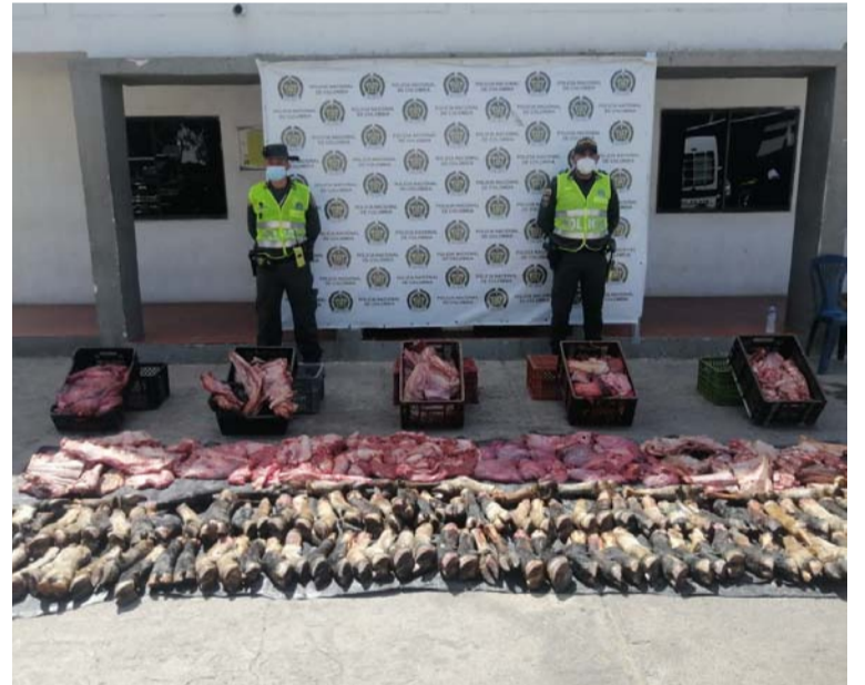
La carne decomisada por las autoridades fue dejada a disposición de la Secretaría de Salud de Maicao.

Finalmente, el producto fue dejado a disposición de la Secretaría de Salud de Maicao.