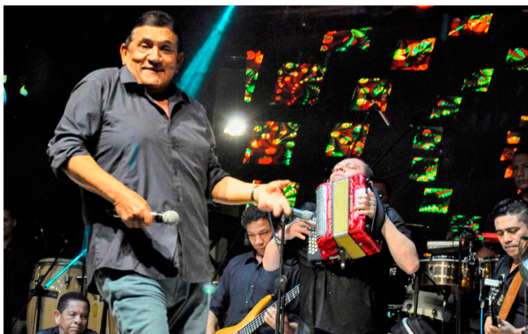
La música vallenata tiene millones de seguidores en el país y ‘Poncho’ Zuleta es uno de sus grandes estandartes.