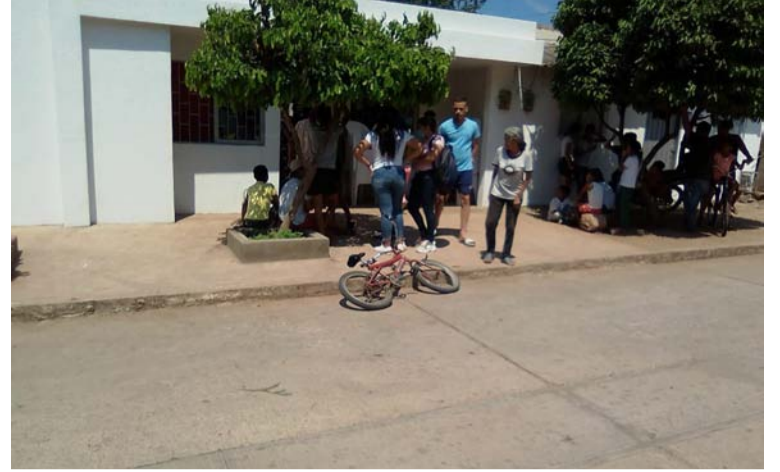
El hombre fue encontrado colgado con una soga a un árbol de mango, en el barrio El Manantial de El Molino.

Al parecer, desde muy joven sufrió problemas de salud y un episodio depresivo lo llevó a tomar la decisión de quitarse la vida.