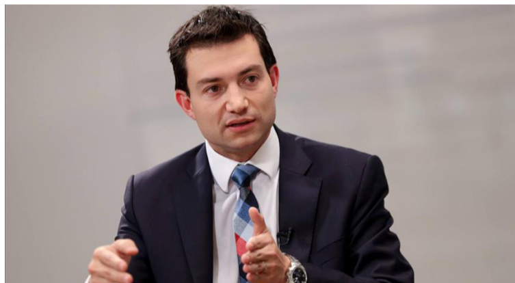
El contralor Felipe Córdoba expuso cómo con un modelo analítico ha evidenciado varias situaciones irregulares.

El día 13 de noviembre de 2021, fecha en la cual inició la Ley de Garantías en el orden territorial.