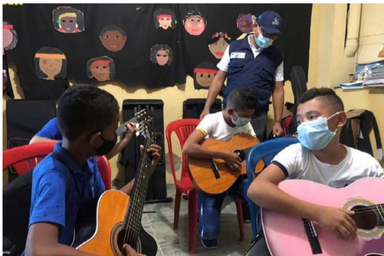
Niños y jóvenes a partir de los 8 años, podrán formarse de forma gratuita en artes plásticas y artes escénicas.

Los interesados deberán presentar fotocopia de los documentos de identidad del niño y de su acudiente, así como fotocopia del certificado o carnet de vacunación.