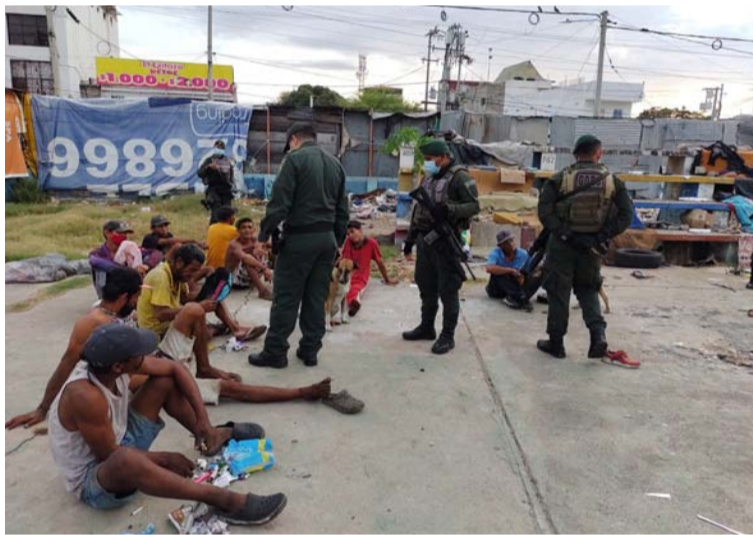
En la intervención en el centro participaron más de 100 uniformados de distintas especialidades de la Policía.

"La Policía Nacional en el departamento de La Guajira Continuará realizando este tipo de actividades en los diferentes municipios con el fin de llegar a las co-