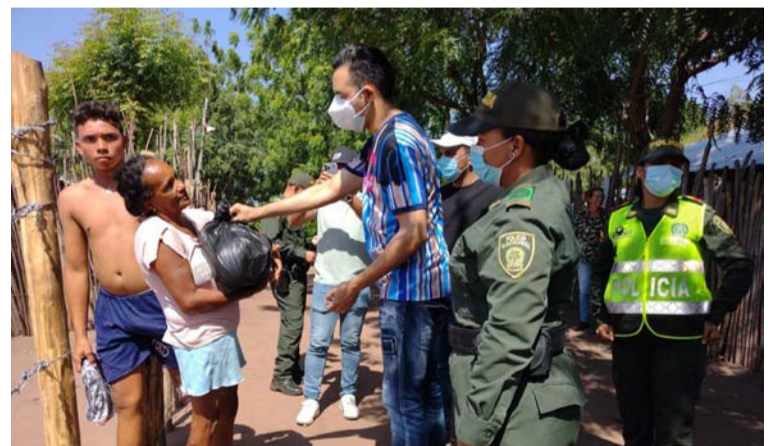
El artista se sintió complacido al cristalizar la entrega de los mercados visitando dos barrios en Villanueva.