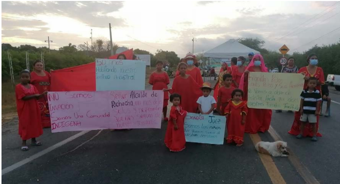
Delegados de la Policía y del Distrito trataban de llegar a un acuerdo con la comunidad.