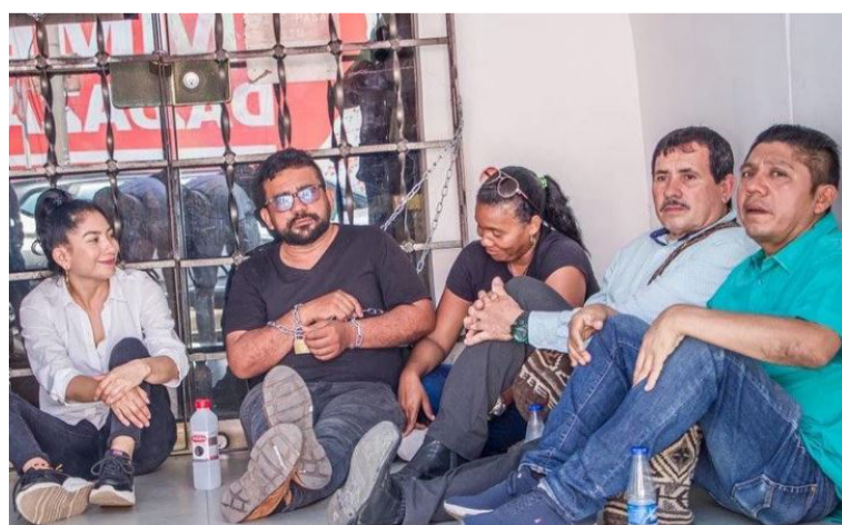
Candidatos al Congreso por Circunscripción Especial de Paz en Cesar, La Guajira y Magdalena durante protesta.