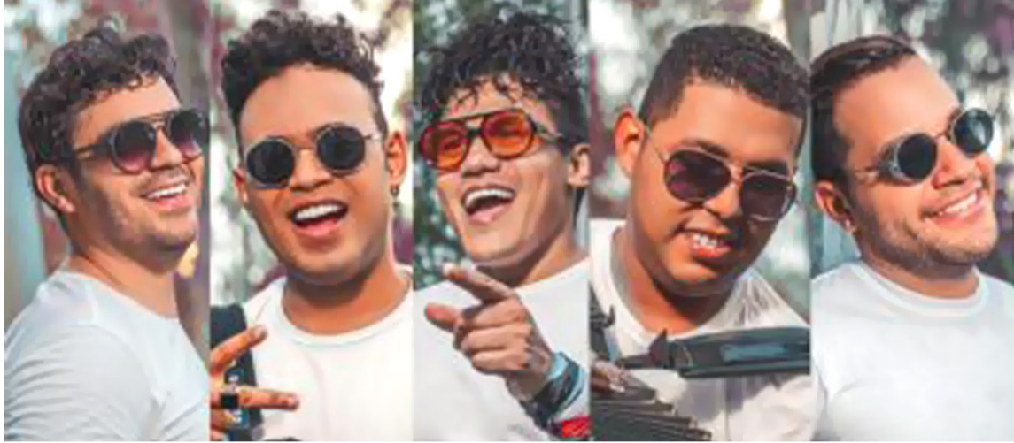
El reconocido Grupo Kvrass se presentará en las ciudades de Orlando, Tampa y Miami.