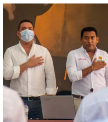
El gobernador Nemesio Roys, presente en la Asamblea.

El nuevo Sistema General de Regalías, es otra de las apuestas que el mandatario planteó como estrategia para ejecutar inversiones estratégicas.