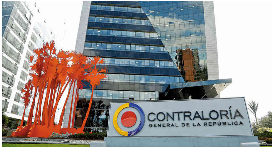
La Contraloría ha encontrado varios casos donde corrieron para hacer los contratos.

Como una situación atípica observada dentro del análisis de los contratos, se evidenció que dos contratos adjudicados a un contratista que suman más de $400 mil millones fueron aprobados en la plataforma Secop