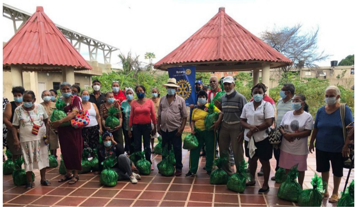
Esta iniciativa permitió financiar la educación de varios jóvenes del Departamento.

“Esta labor tiene una conexión directa con las buenas prácticas de disposición de residuos de los empleados y contratistas de Cerrejón, quienes al hacer una correcta separación en la fuente, preservan la funcionalidad de los materiales para que puedan ser reciclados y comercializados para su aprovechamiento. En 2021, el promedio de los residuos aprovechados por la Fun-