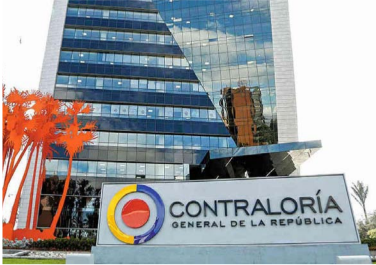
En total determinó 226 hallazgos administrativos, de los cuales 210 tienen posible connotación disciplinaria.

En total determinó 226 hallazgos administrativos, de los cuales 210 tienen posible connotación disciplinaria, 2 presunto alcance penal, 16 dan lugar a la apertura de indagación preliminar y 9 tienen Otras Incidencias. Adicionalmente se lograron