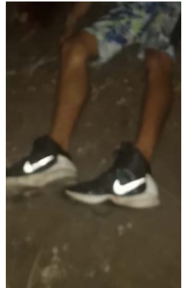
Los cuerpos se hallan en la sede de Medicina Legal.

“Al lado de uno de los cuerpos hay una nota en hoja de papel cuaderno escrita a lapicero que dice: ‘por ratas’”, dijo la fuente.