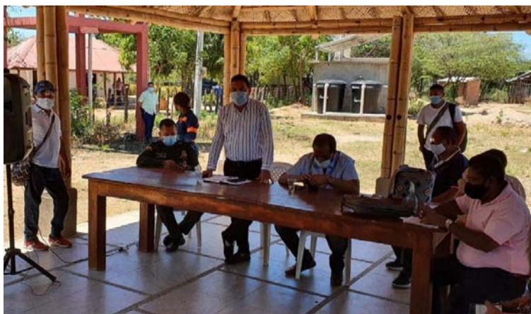
El Tribunal ordenó volver a realizar la escogencia de la autoridad indígena conforme a las normas existentes.

Pero el jefe de gobierno municipal no oculta que no comparte la decisión,