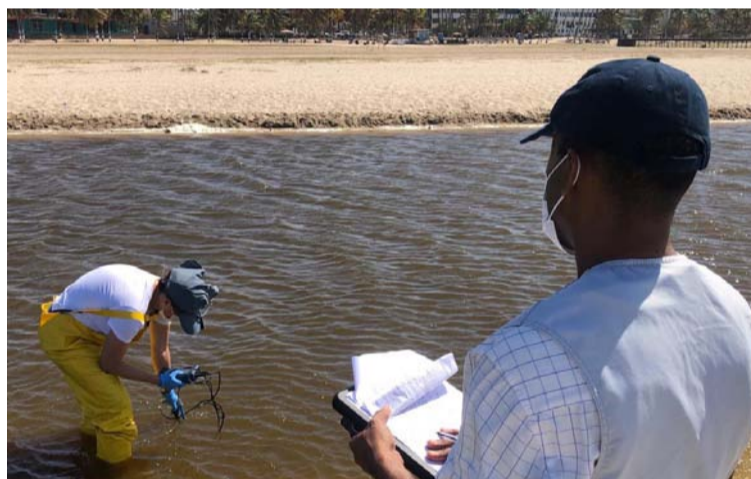
Funcionarios de Corpoguajira realizan la recolección de muestras de peces muertos.