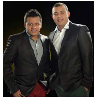
Org. Carlos Serrano.