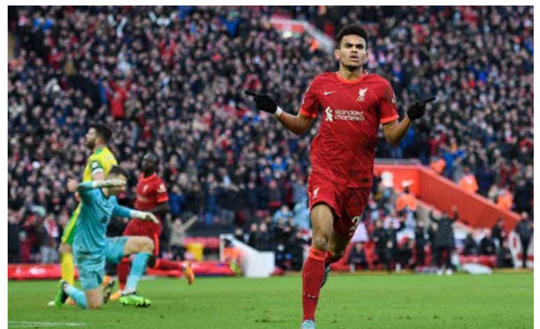
Luis Díaz celebra el gol que le marcó al Norwich City, con el cual fue resaltado por la hinchada del Liverpool.

El tanto en mención es hasta la fecha el primero y único que ha anotado el guajiro desde que llegó a los 'Reds' hace un mes.