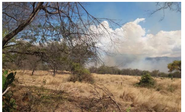
Las llamas arrasaron con la vegetación en la finca ‘La Retirada’, ubicada en jurisdicción de La Jagua del Pilar.

Las autoridades competentes comenzaron con las respectivas investigaciones para dar con los pirómanos y castigarlos.