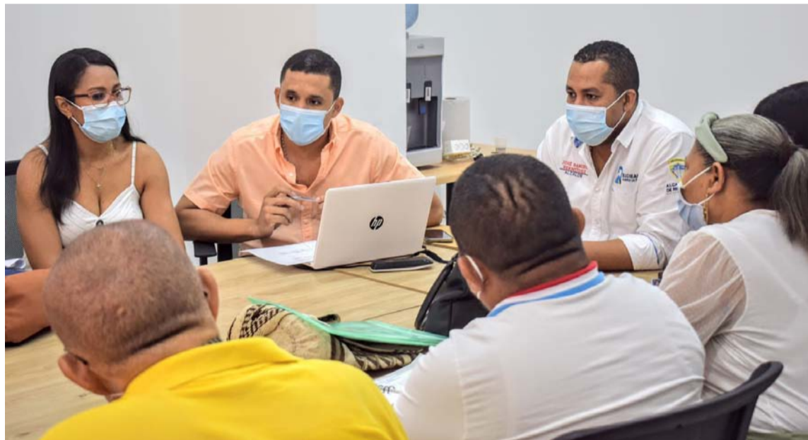
La decisión se dio luego de una reunión con la unión sindical de directivos de la educación.

A estos, entre otros compromisos, se les realizará seguimiento mensual, a través de mesas técnicas en las que participará el mandatario local.