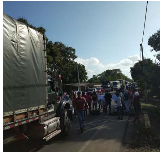
Los manifestantes bloquearon la Troncal del Caribe para buscar ser escuchados.

tura del centro educativo de Pelechúa, para que se brinde una secundaria de sexto a noveno grado.