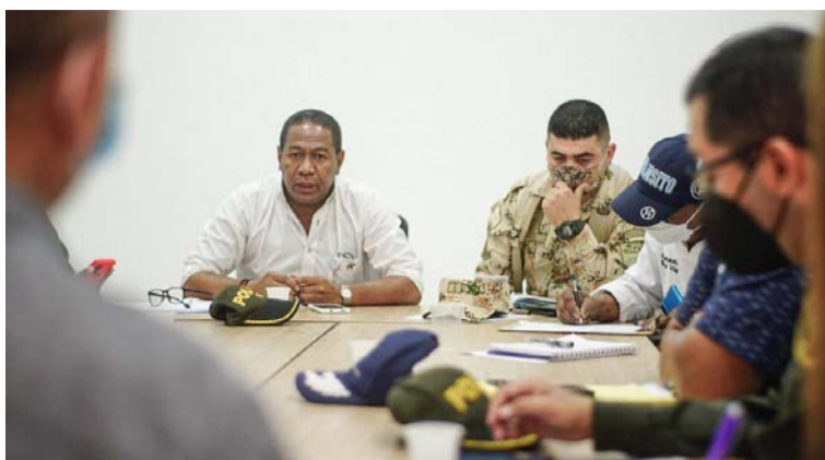
Para las elecciones de mañana se aumentó el pie de fuerza con 60 unidades adicionales de la Policía.