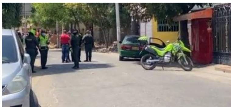
En Gaira, un criminal acabó con sus tres víctimas, luego se dio a la huida sin dejar el más mínimo rastro.