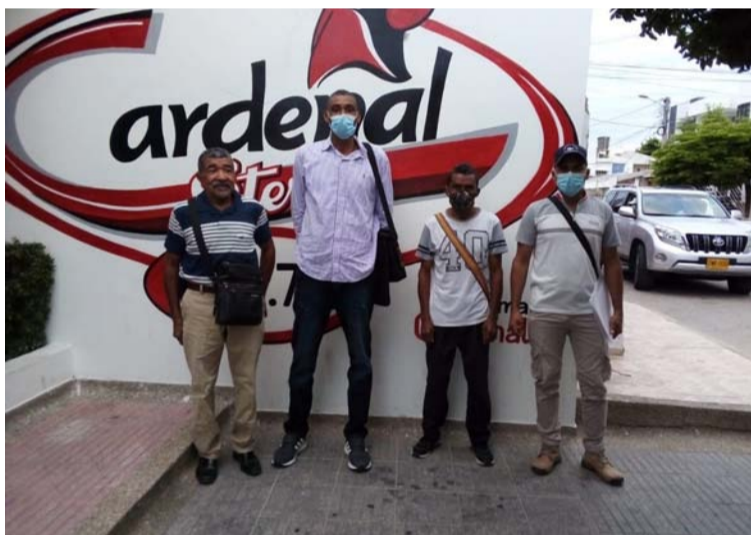
Líderes del corregimiento de Caracolí en San Juan del Cesar hicieron denuncias a través de Cardenal Stereo.