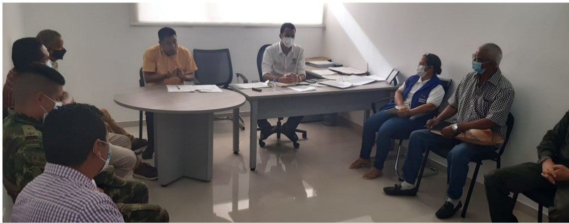
A este comité asistieron el registrador, Personería, inspector de Policía, entre otros.