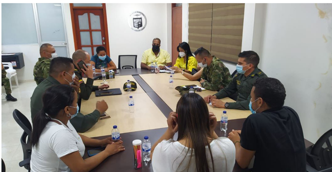
La administración abrió una mesa de diálogo con los habitantes y lograron acuerdo.