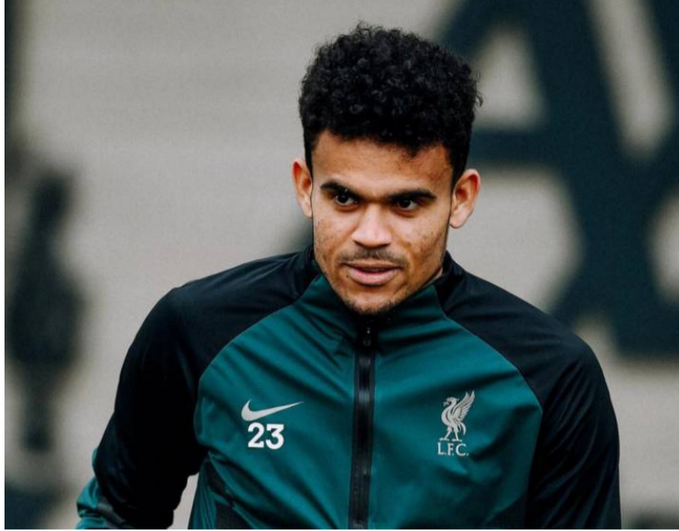
Luis Díaz, extremo izquierdo del Liverpool, procedente del Porto, se adaptó con facilidad al fútbol de Inglaterra.

Sobre su adaptación, Díaz dijo que “ha sido una sorpresa para mí. Así es como quería que saliera. Quería acomodarme rápido, conocer el estilo de juego y sentirme cómodo. He logrado entenderme muy bien con mis compañeros y eso es gracias tanto a ellos como al cuerpo técnico, quienes me han ayudado”.