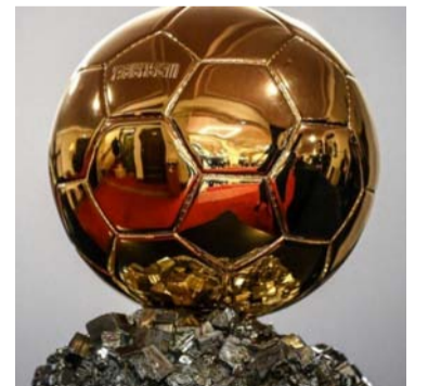
Balón de Oro, distinción vigente desde 1952.

Los periodistas que votan, uno por cada país, se reducirán de los actuales 170 a 100, y representarán a las naciones mejor clasificadas en el ranking FIFA. En el Balón de Oro femenino, solo podrán votar 50 periodistas especializadas. Los criterios de nominación también cambian. La lista no solo la establecerán los periodistas de Fran-