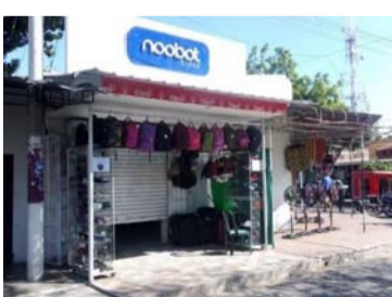
Local de celulares y accesorios que fue asaltado.

Un local dedicado a la venta de celulares, relojes deportivos y otros accesorios tecnológicos fue blanco de un millonario robo en San Juan del Cesar.