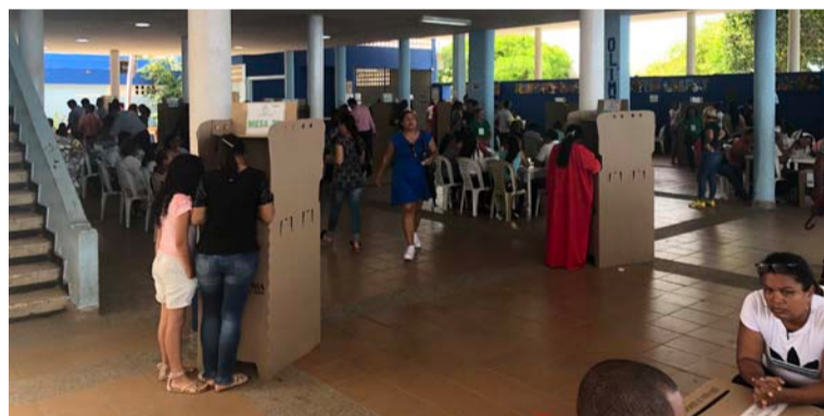
En La Guajira podrán votar 643.843. ciudadanos aptos para votar en elecciones a Congreso y consultas.