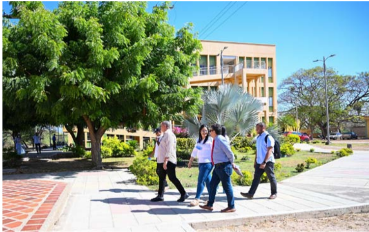
La Universidad de La Guajira, en la sede Fonseca, recibió la visita de representantes del Ministerio de Educación.