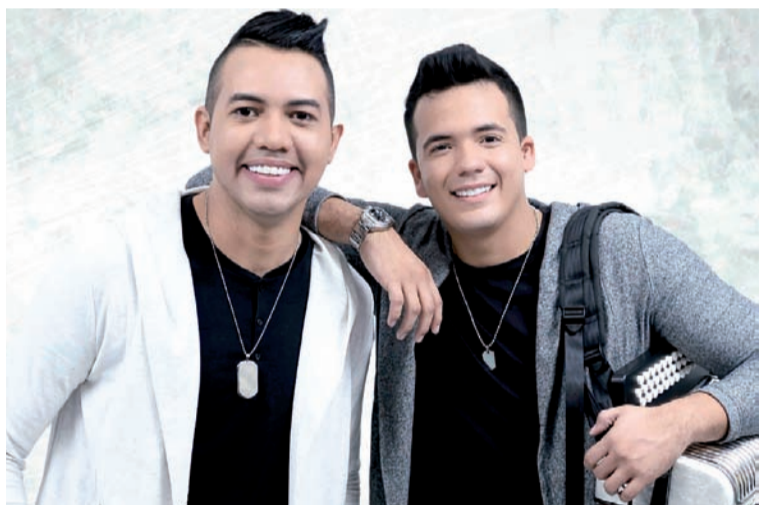
Diego Daza y Carlos Rueda siguen cautivando a Colombia, Latinoamérica y Estados Unidos con sus éxitos.