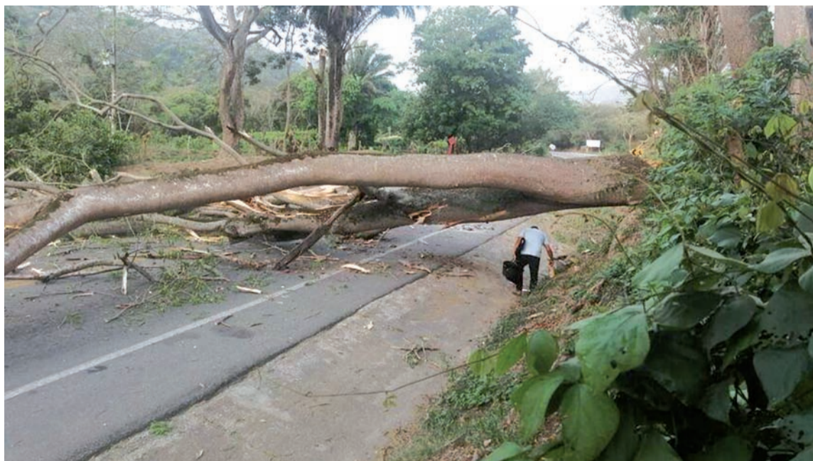
El bloqueo se registró a la altura de los corregimientos de Calabazo y Guachaca.

Integrantes de la Policía intervinieron para recuperar la movilidad en la