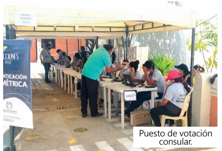
Puesto de votación consular.

los puntos de votación que fueron instalados en las instituciones educativas: Normal Superior Indígena, Alfonso López Pumarejo, Julia Sierra Iguarán y en el Centro de Desarrollo Infantil, sede San José.