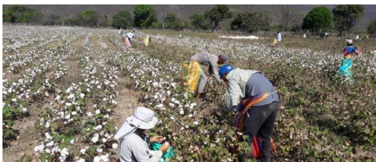
El cultivo del algodón le trajo beneficios a San Juan y Zambrano, ya que generaba mucha mano de obra.