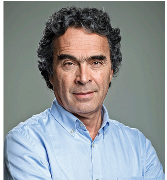
Sergio Fajardo triunfó en la coalición Centro Esperanza y va por la Presidencia.

Se enfrentarán en las próximas elecciones presidenciales