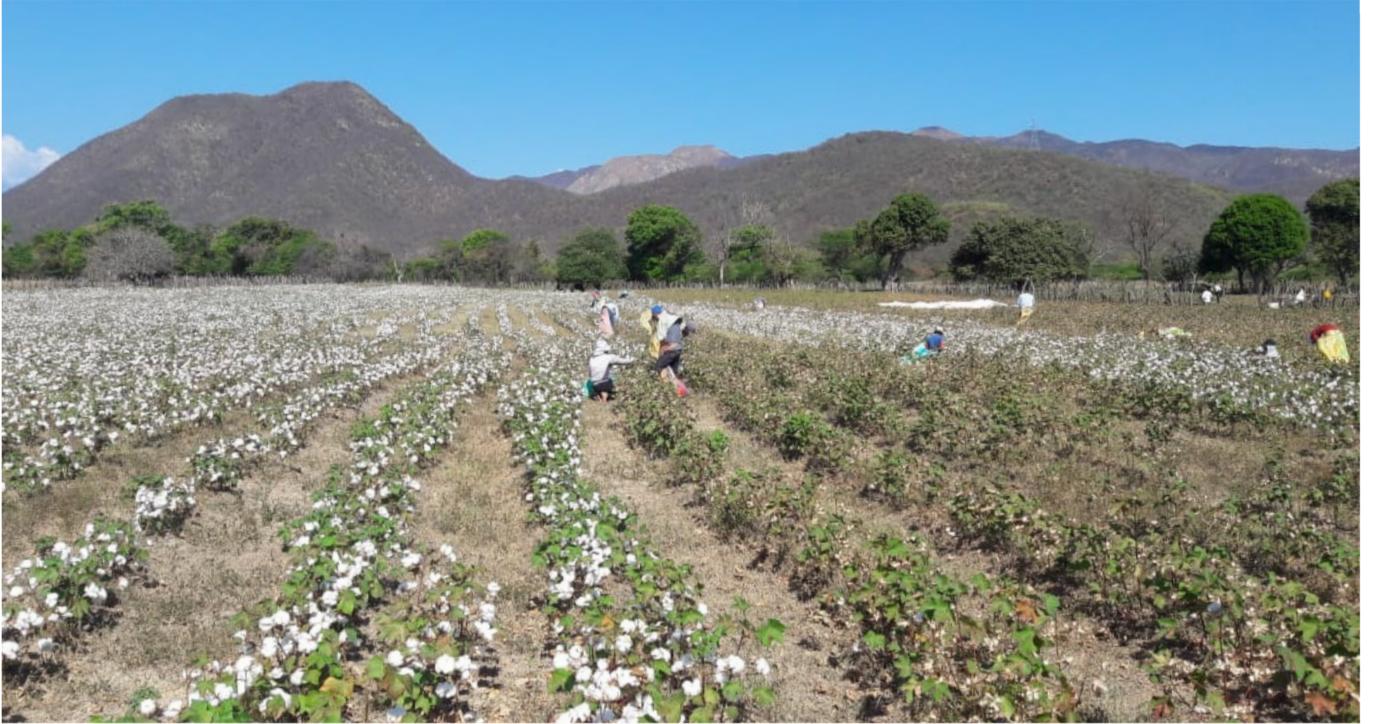
Al llegar el fin de año, en noviembre y diciembre, en Zambrano, los campos de algodón se veían como copos de nieve vestidos de blanco.

En las décadas del 60, 70 y 80 sus habitantes se dedicaban a esas actividades