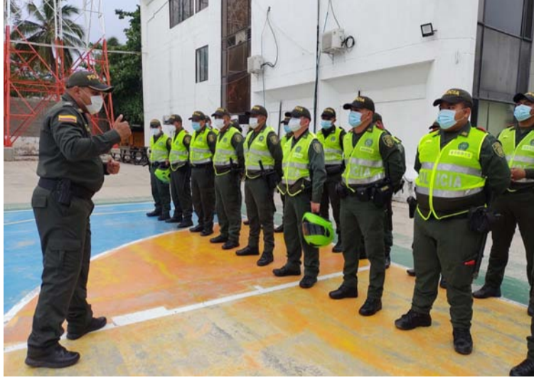
Fueron 2.100 los hombres y mujeres policías que de manera estratégica estuvieron dispuestos en el territorio guajiro.

La Fuerza Pública tuvo la misión de facilitar las condiciones para que funcionarios, jurados y testigos electorales cumplieran con su labor en los puestos de votación en La Guajira.