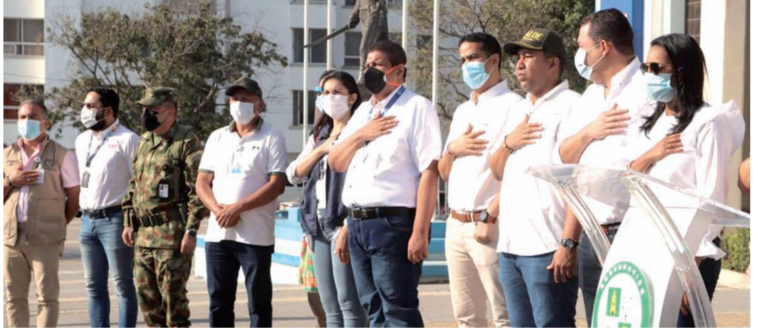
Autoridades del departamento de La Guajira dándole apertura a las elecciones de Senado, Cámara y Consultas.

Largas filas se observaron en las entradas de