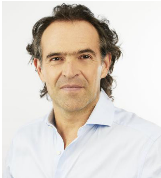
Federico Gutiérrez, exalcalde de Medellín, ganó consulta de Equipo por Colombia.