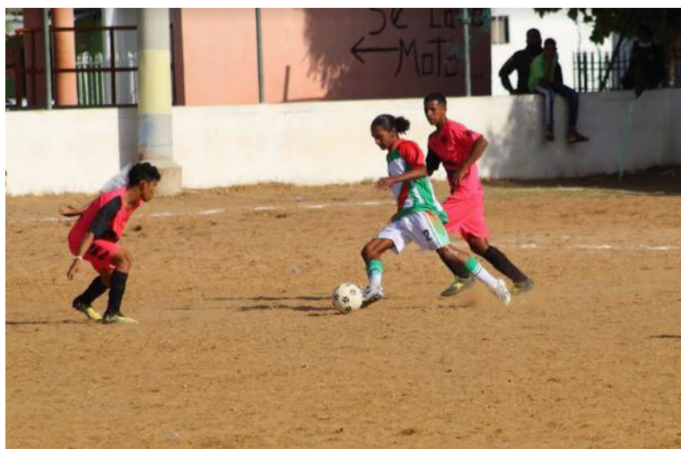
La cancha Colombia Libre, sitio donde se disputó el juego, no estaba en las mejores condiciones para el juego.

El Club Deportivo Unión Koram Villanueva cayó 6-1 ante Sporting FC, en juego correspondiente a la tercera fecha del Torneo Nacional Masculino categoría Sub-17.