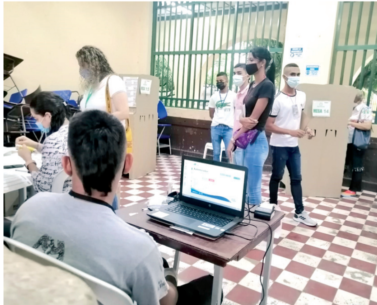
Según informó la Fiscalía del Cesar, las irregularidades presuntamente se estarían dando por trasteo de votos.

importante investigación sobre las Circunscripciones Transitorias Especiales de Paz, por una posible presión a ciertos ciudadanos para votar a una curul particular de paz.