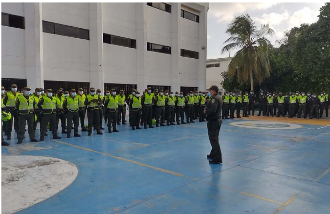
Un total de 850 policías estuvieron concentrados en la atención de delitos electorales.

Por último, los dispositivos especiales de la Fuerza Pública contrarrestaron los 16 delitos electorales.