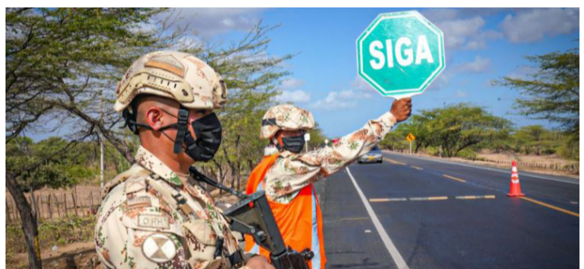
El dispositivo de seguridad estuvo desplegado en las áreas rurales y los ejes viales.

Todo el dispositivo de seguridad estuvo desplegado especialmente en las áreas rurales y los principales ejes viales, con el propósito de poder garantizar el libre desarrollo y movilidad de la población para que pudiera ejercer su derecho al voto de una manera tranquila y sin ningún contratiempo.