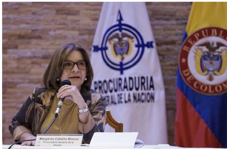
Margarita Cabello, procuradora General de la Nación, dijo que jurados deben ser garantes de la transparencia.

En total se registraron 94 quejas y denuncias en el marco del proceso elec-