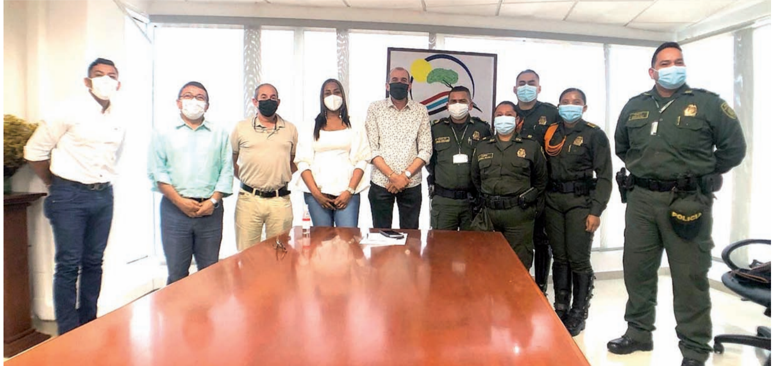
El director General de Corpoguajira, Samuel Lanao Robles, se reunió con varias especialidades de la Policía Nacional.

Se establecieron varios compromisos y líneas de trabajo para controlar la tala indiscriminada de árboles, minería ilegal, el tráfico irregular de fauna silvestre y la comercialización de tortugas marinas.