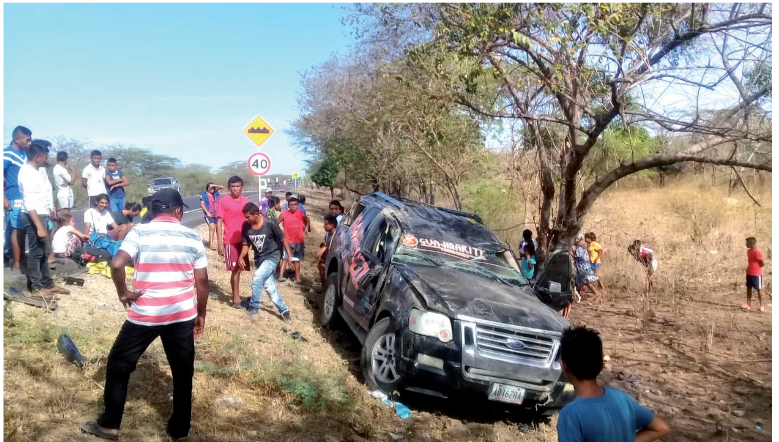
Así quedó la camioneta tras accidentarse en la vía. Moradores del lugar socorrieron a los ocupantes del vehículo.

“Se trata de establecer los nombres de los lesionados y cuántos son en realidad, ya que fueron trasladados a centros médicos de Riohacha”, informó la Policía.