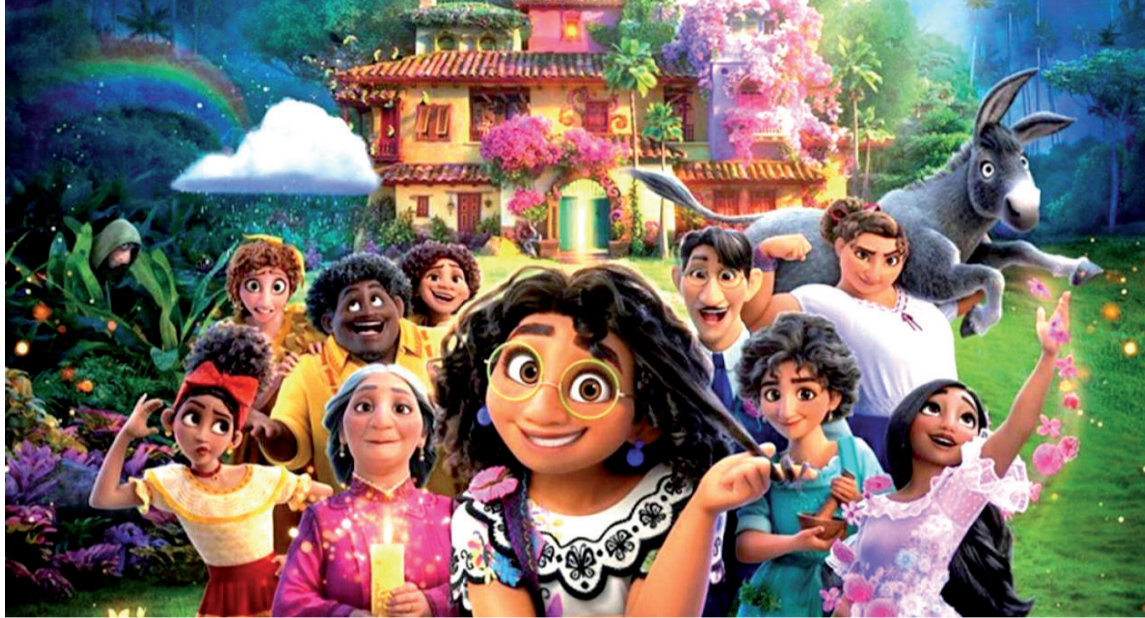
La película ‘Encanto’ se impuso en la única categoría en la que estaba nominada.

“Gracias Bafta por esto, era un sueño crear una pe-