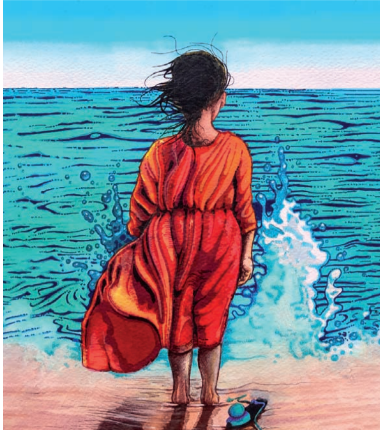
La historia real, sucedida en Puuttuna en la Alta Guajira, pone en manifiesto los peligros de los niños wayuú.