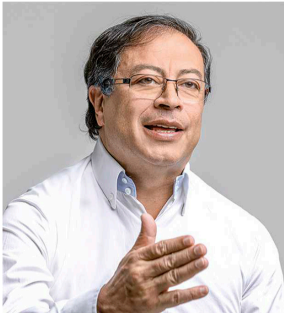
Gustavo Petro quedó en primer lugar en la consulta del Pacto Histórico.