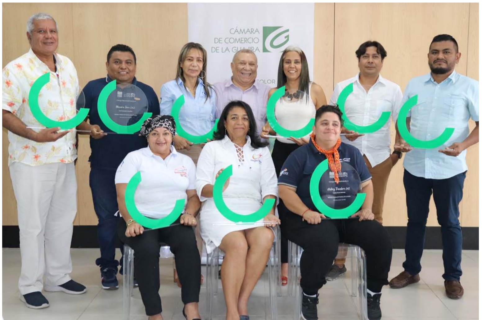
Estas empresas y la Cámara de Comercio definen una ruta para establecer mecanismos de financiamiento.

Desde la definición del turismo como la primera ruta competitiva este grupo