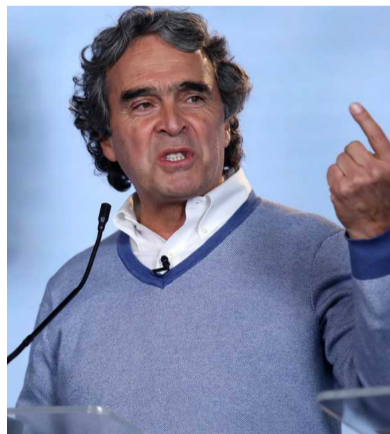
Sergio Fajardo, otro candidato oriundo de Antioquia a la Presidencia de Colombia.