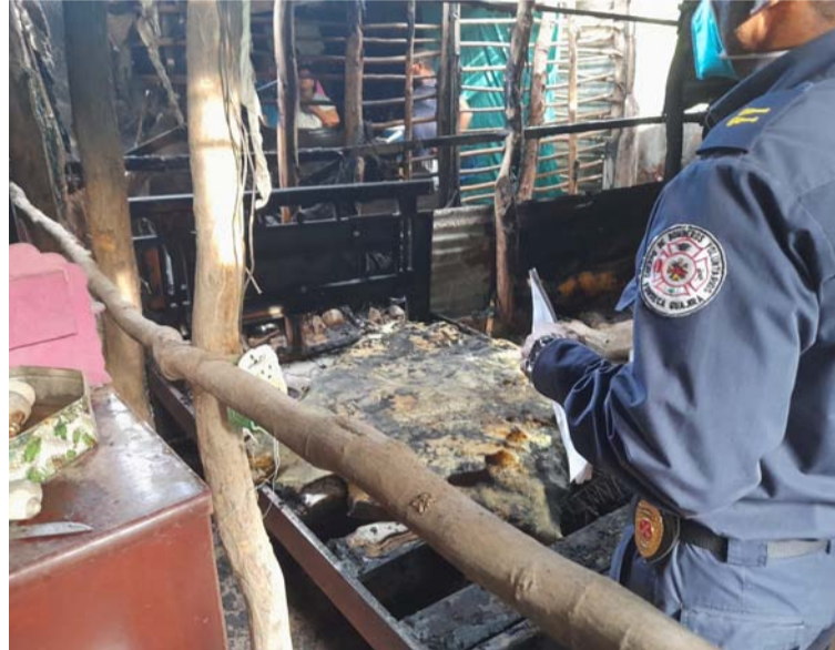
Durante la emergencia se incineraron dos camas, tres colchones, tres ventiladores, un espejo y calzados.

Un incendio acabó con los enseres de una vivienda de bahareque en el barrio 8 de Enero del municipio de Fonseca.