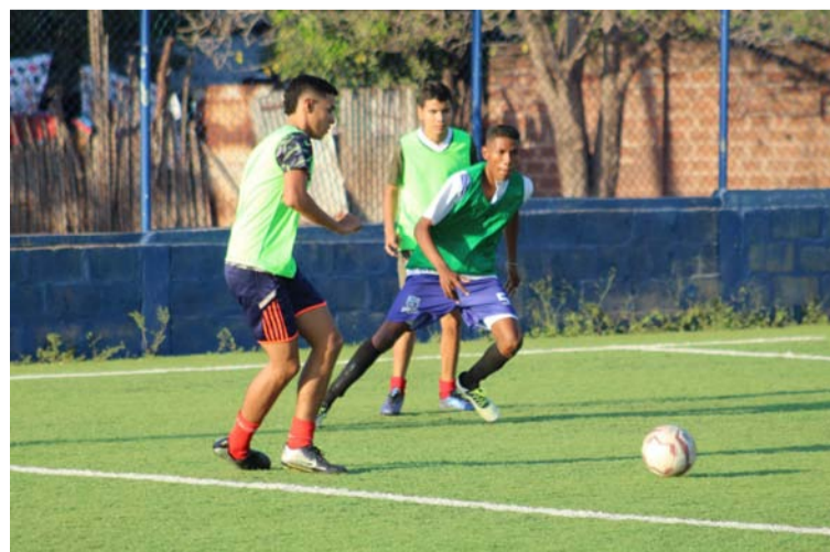
Unión Koram Villanueva espera este sábado contar con su mejor nómina en duelo ante Oro Negro de Albania.

“A nosotros no nos preocupa ya que jugamos in-