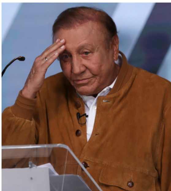
El santandereano Rodolfo Hernández es otra alternativa presidenciable este año.