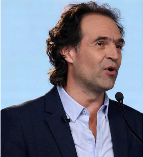
Federico Gutiérrez, exalcalde de Medellín y candidato antioqueño a la Presidencia.