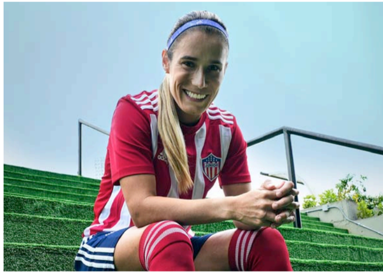
Junior será patrocinado ahora por Adidas y presentará nueva camiseta hoy frente a La Equidad en Barranquilla.

Así lo dio a conocer el propio club a través de redes sociales; allí aparecen