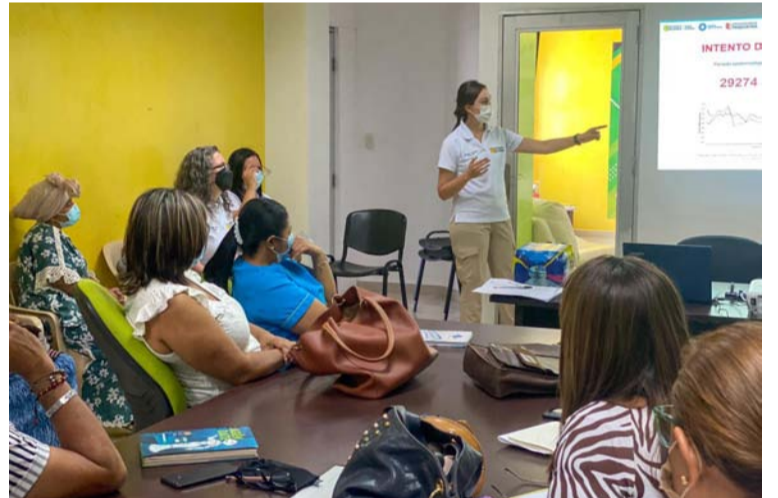
Proyecto Life es una propuesta que le apunta a la reducción de cifras del suicidio en comunidades indígenas.

En esta oportunidad, el talento humano que adelanta las investigaciones pertinentes para nutrir el proyecto de investigación, brindó una capacitación convertida en taller de cartografía social que le apuntará a la detección y prevención de la idea, conducta y casos de suicidio en La Guajira, específicamente