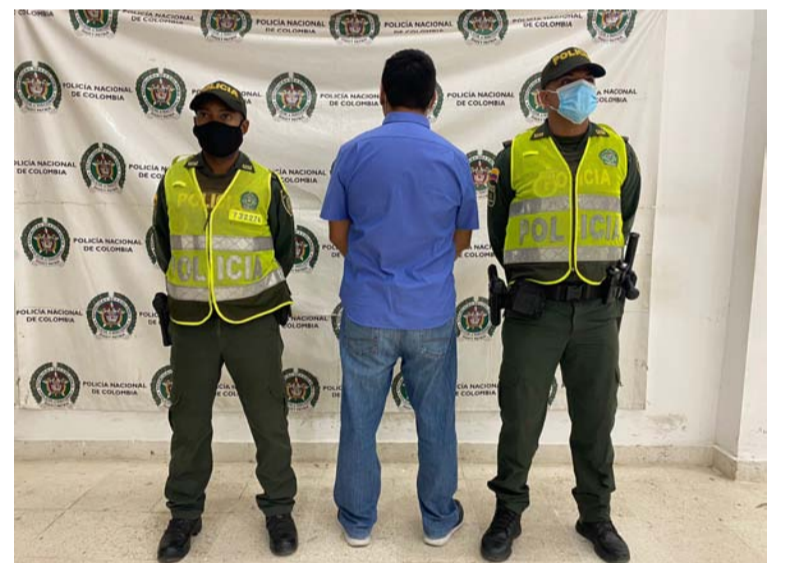
Al sujeto lo sorprendieron con un revólver calibre 22 milímetros sin documentos y además municiones.