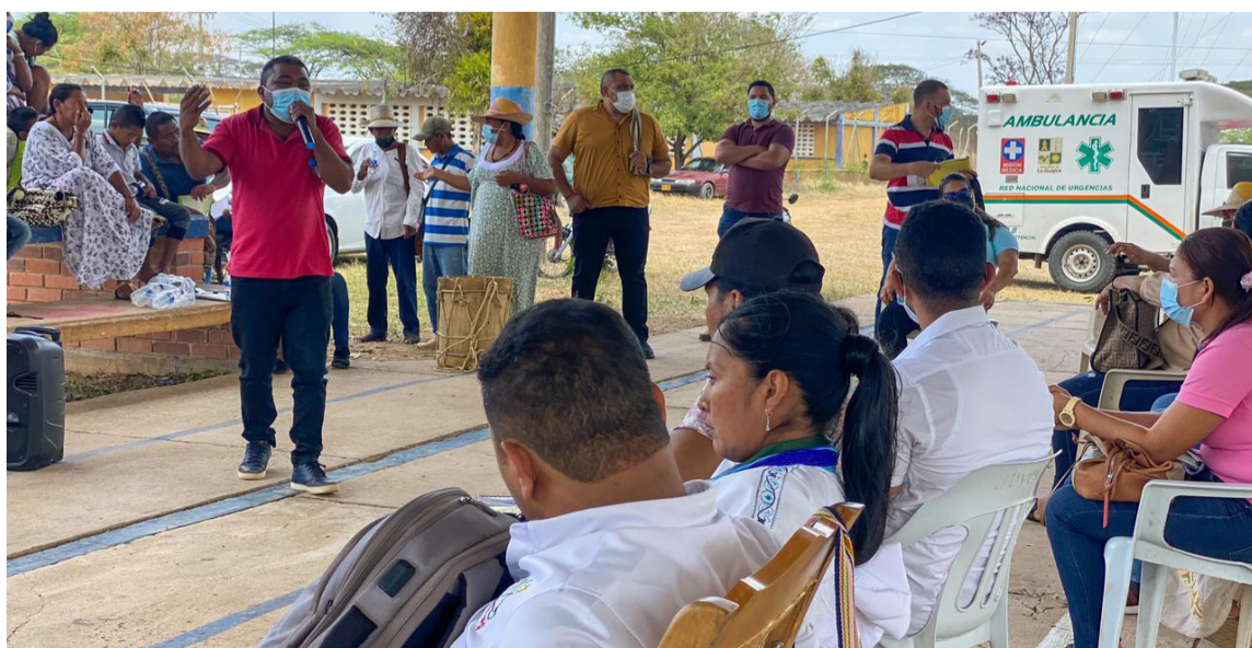
Se evaluaron los avances que se han logrado luego de las denuncias de la comunidad.

Escuchar a la comunidad del resguardo indígena 4 de Noviembre y hacerle frente a los diferentes problemas referentes a la prestación del servicio en salud, fue el objetivo del encuentro entre líderes wayúu, Secretaría de Salud y la EPS Dusakawi, reunión que permitirá diseñar las estrategias para garantizar una buena prestación del servicio en las comunidades de la zona rural de Albania.