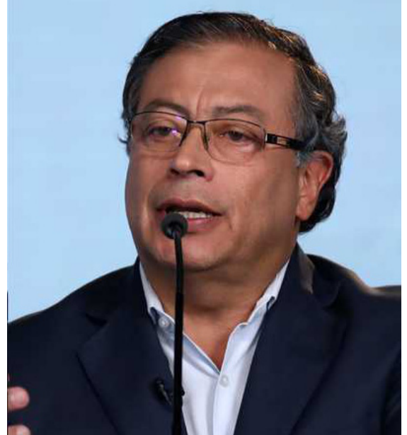
Gustavo Petro, nacido en Córdoba, es el único costeño postulado a la Presidencia.