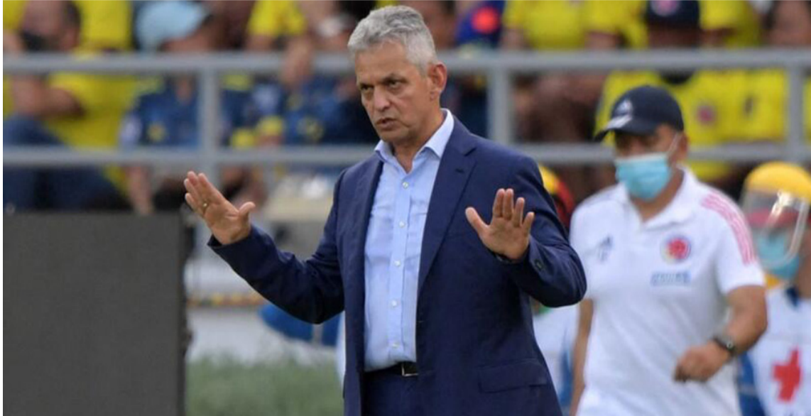
Reinaldo Rueda escogió la misma base de jugadores que siempre ha convocado.

El entrenador de la Selección Colombia, Reinaldo Rueda, dio a conocer ayer la lista de convocados para la Eliminatoria, en los dos últimos juegos ante Bolivia y Venezuela, en Barranquilla y San Cristóbal.