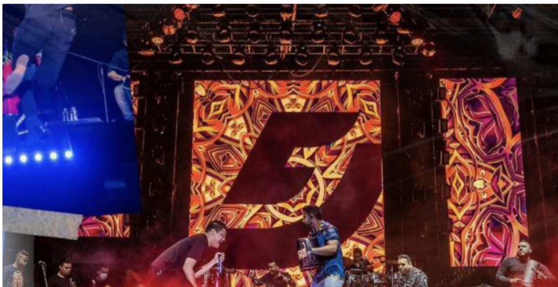
Este concierto ambienta la realización del 55 Festival de la Leyenda Vallenata.

Estas estrellas del folclor ocupan actualmente los primeros lugares de preferencia en Colombia y por eso