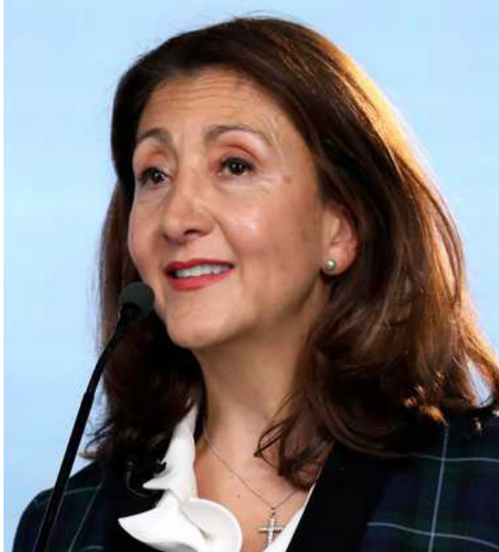
La bogotana Ingrid Betancourt regresó al país para ser candidata a la Presidencia.