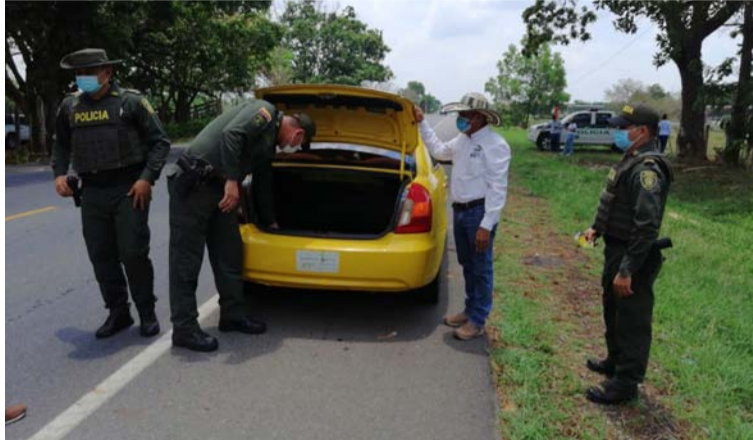
Momento de la inspección realizada por la Policía y Corpoguajira en la que hallaron carne de tortuga y 38 conejos.

Conforme a lo manifestado por la entidad ambiental, el producto decomisado po-