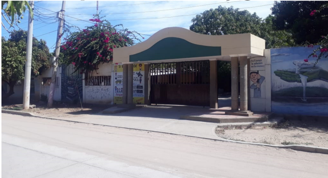
El consejo directivo de cada institución priorizará la inversión de los recursos recibidos.

María Inmaculada, 70 millones de pesos; Roig y Villalba, $118 millones; Agropecuaria de Fonseca, $96 millones; Centro Educativo El Hatico, $20