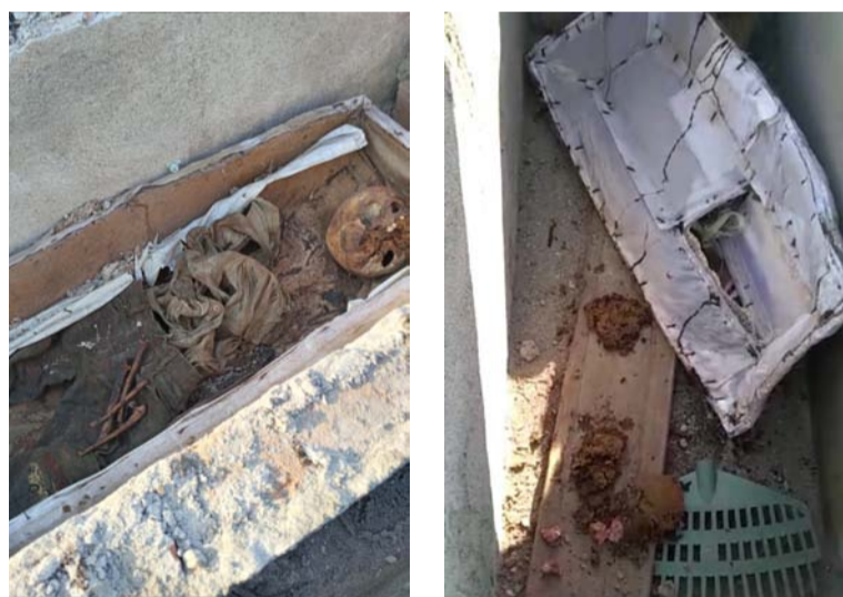
Varias bóvedas del cementerio fueron abiertas por desconocidos que se llevaron los restos de niños y adultos.