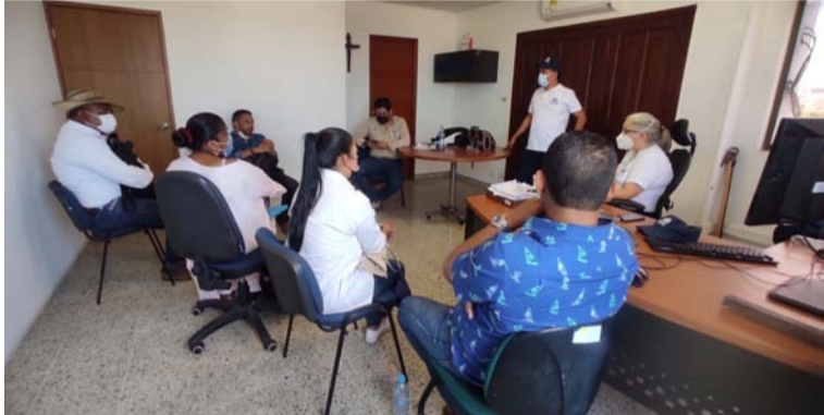
Las comunidades y autoridades tradicionales del área manifestaron su preocupación a los entes de control.