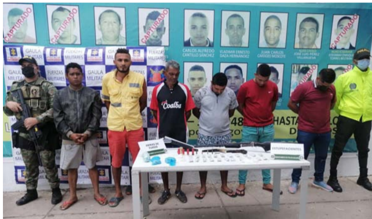
Este es el grupo de delincuencia común organizado 'Los Pakistán', desarticulado por autoridades en La Guajira.

Cabe mencionar que entre el material incautado se encuentra una escopeta calibre 16, una escopeta calibre 12, tres armas artesanales, 700 gramos de clorhidrato de cocaína, 100 papeletas de bazuco, 120 cigarrillos de marihuana y un celular.