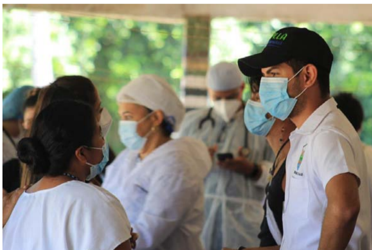
Autoridades de Salud de Dibulla y Santa Marta manifestaron que han estado vigilantes con la atención.

anunció que una comisión integrada por autoridades civiles y expertos médicos subirá hasta las comunidades afectadas por el brote.