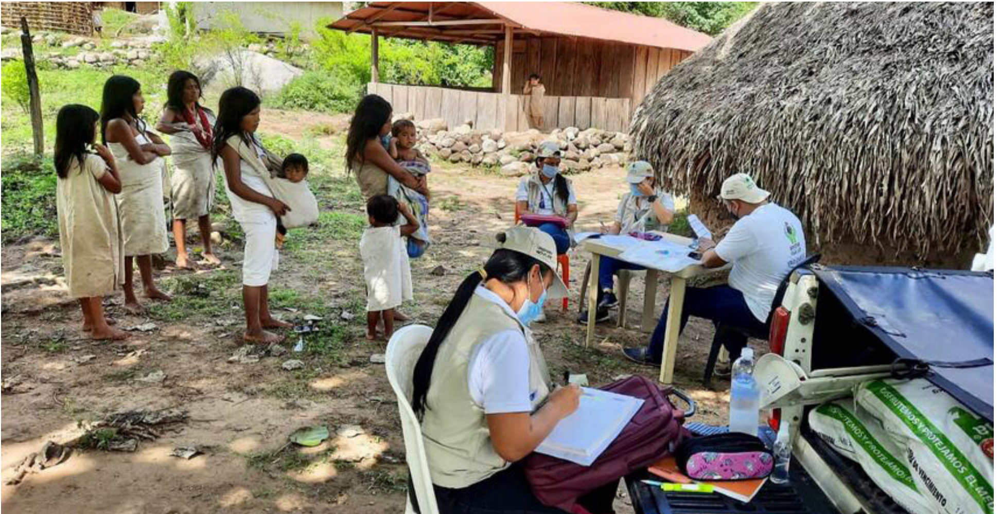
Autoridades tradicionales de la Sierra Nevada de Santa Marta indican que más de 300 personas han resultado afectadas por la epidemia.

Alcaldía de Dibulla no ha podido corroborar número de niños fallecidos