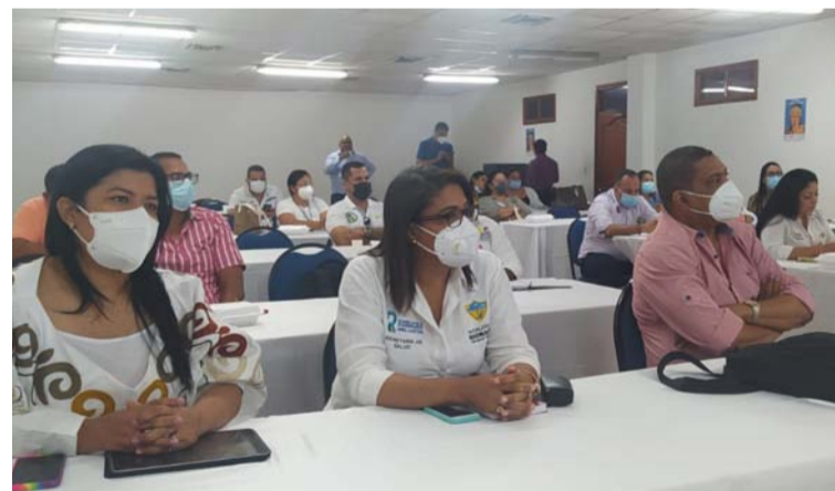
Aspectos de la socialización del programa Vigor para beneficio del adulto mayor con enfermedades prevalentes.