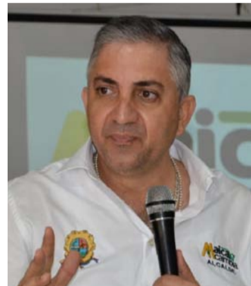
Mohamad Dasuki, alcalde del municipio de Maicao.

desde hace mucho tiempo. Además, recordó que en ese ente de control cursa un