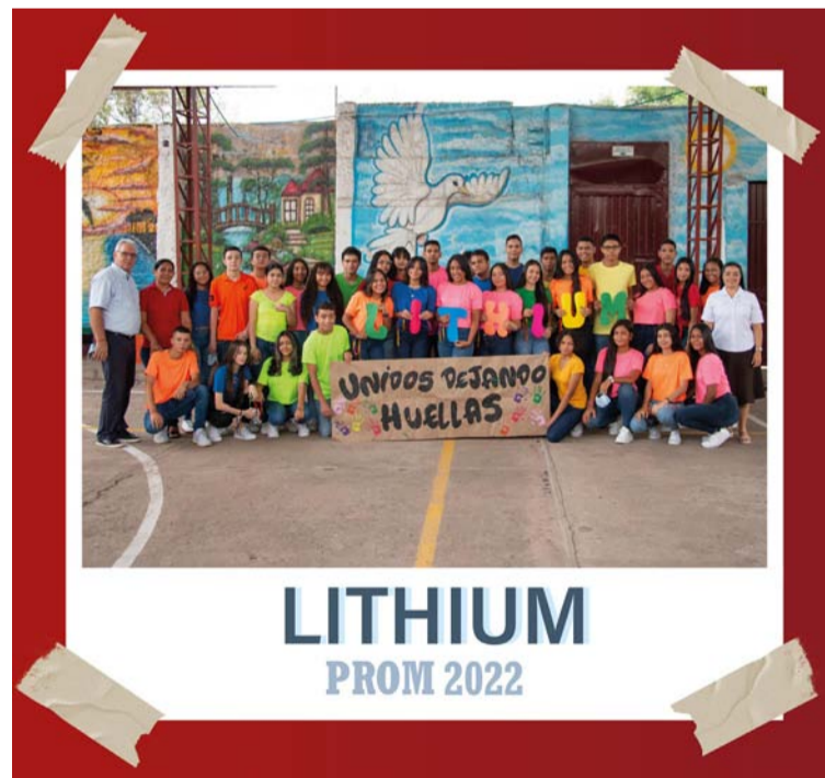
LITHIUM PROM 2022