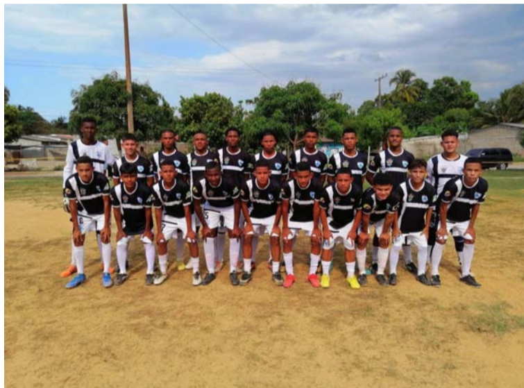
El Mingueo FC buscará sostener el liderato en la visita de este fin de semana ante el Juninho de Fonseca.

Mingueo FC se prepara para afrontar su cuarto compromiso ante Juninho de Fonseca, como visitante este fin de semana.