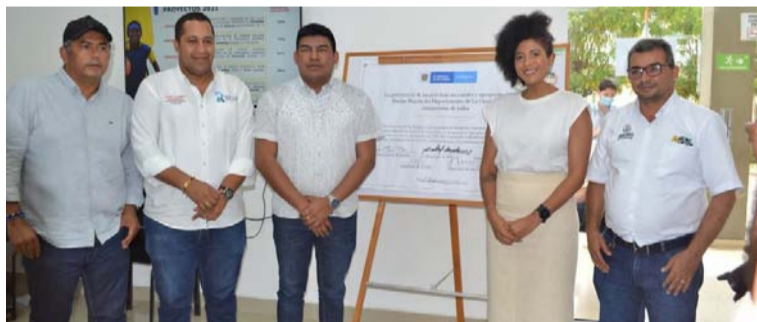
A la mesa de trabajo asistieron los alcaldes de Uribia, Maicao, Manaure, Riohacha y sus respectivos equipos.

Este proyecto traerá tranquilidad a los habitantes de las áreas de influencia sobre todo en las temporadas de lluvia, generando mayor calidad de vida y bienestar.