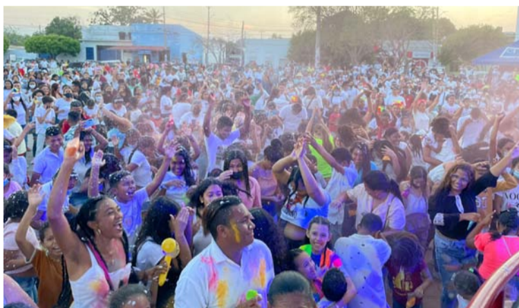
Los pobladores de Barrancas manifestaron su regocijo durante las festividades realizadas en su municipio.

Al mismo tiempo, se rindieron los honores con una