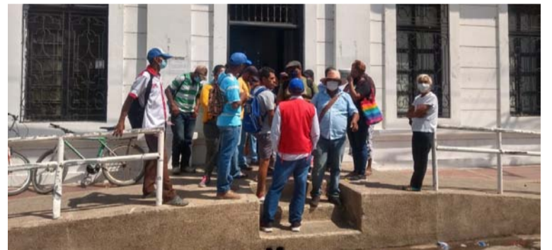
Residentes de Villa Iler, durante la protesta que realizaron por desalojo en la sede de la Alcaldía de Riohacha.

“Se llegó a un acuerdo con ellos mediante el diálogo donde en mesas técnicas, a partir de la otra semana, vamos a conocer la situación de este sector de Villa Iler. Podemos decir que se ventilaron algunas irregularidades, las cuales vamos a estar debatiendo para poderlas identificar”, indicó una fuente.