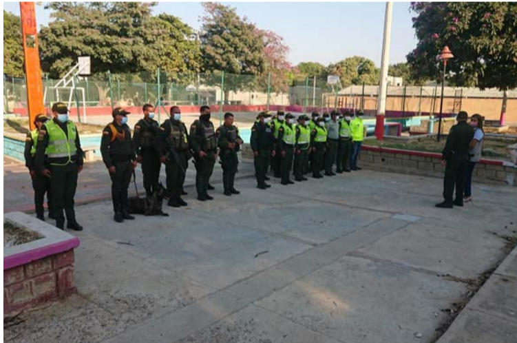
Los operativos iniciaron en los tres parques del Distrito de Riohacha con más incidencia de acciones delictivas.

Estos operativos iniciaron en los tres parques con más incidencia de acciones delictivas: Centenario en el barrio Arriba, Jorge Pé-