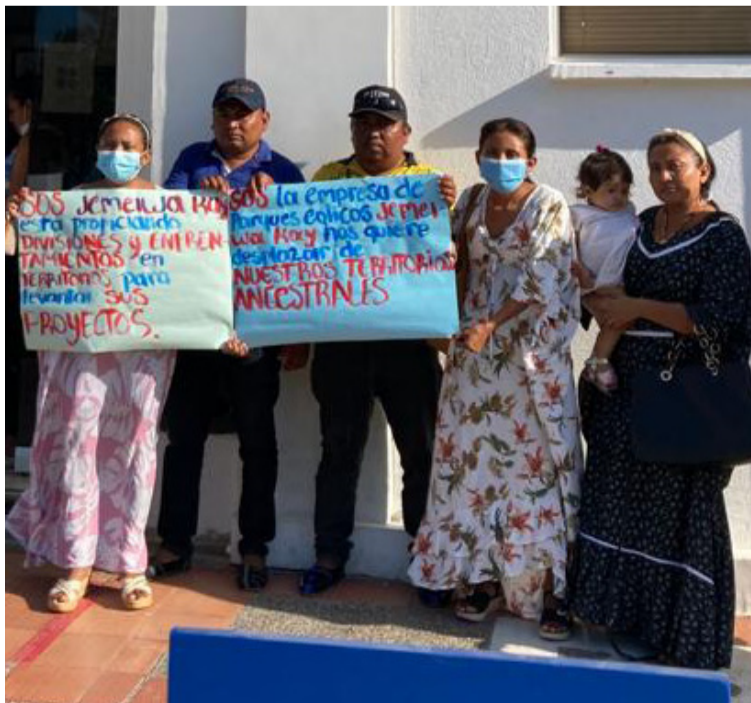
Según las comunidades, la empresa de parques eólicos ha estado ingresando a sus territorios arbitrariamente.

se está convirtiendo en una trampa mortal para el pueblo wayuú, toda vez que vienen siendo engañados y manipulados a cambio de bolsas de comida y carros tanque de agua”, aseguró la ONG de Derechos Humanos Nación Wayuu.