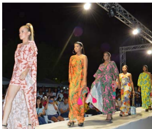
Colección Única, de Vanesa Solano.