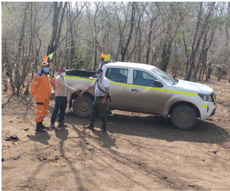
La zona está siendo devastada por las llamas que se aproximan a predios donde se encuentra la mina del Cerrejón.