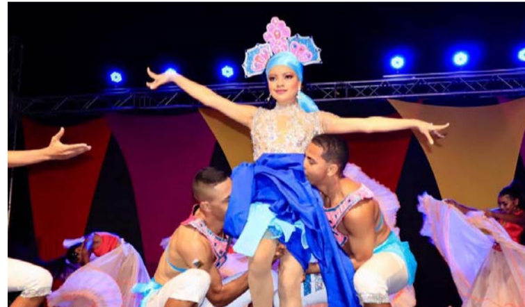
Los guajiros y visitantes tendrán la oportunidad de escoger entre diversos eventos del Carnaval de Riohacha.

Es de anotar, que dentro de las novedades del 2022 se destaca la exitosa Feria de Emprendimiento, Cultura y Tradición CarnavalArt Riohacha, que después de estar dos días en la Plaza Padilla se trasladó los días 24 y 25 de