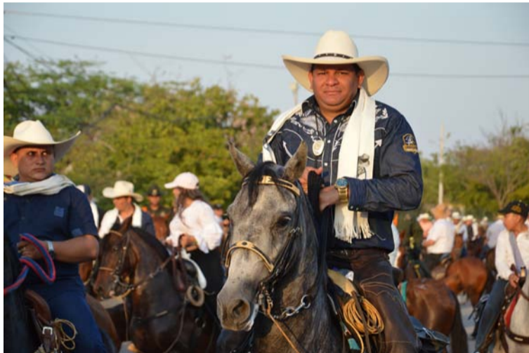
Como invitados especiales de la cabalgata en Riohacha estarán las asociaciones de caballistas de la costa Caribe.

El recorrido se hará por el sector histórico, Calle Ancha de Riohacha. Este evento se viene realizando desde la primera edición del festival y cuenta con la acogida de la comunidad en general, especialmente