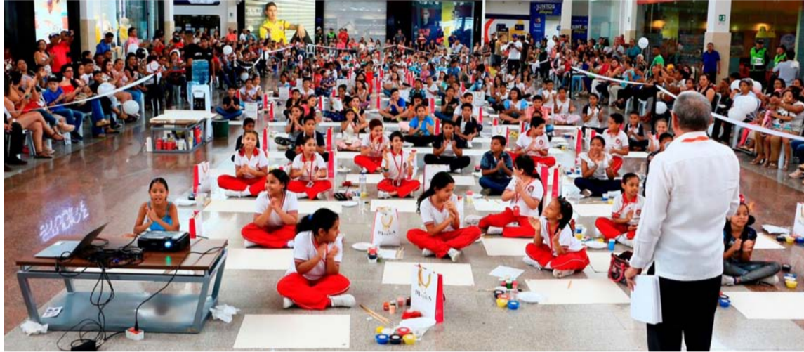
Los tres primeros ganadores recibirán una Scooter eléctrica, una tablet y un celular.

Los objetivos fundamentales del concurso son con-