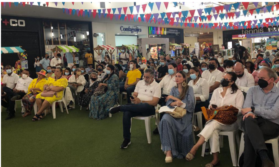
Gran concurrencia se apreció en la presentación de La Ley de Oficios Culturales.