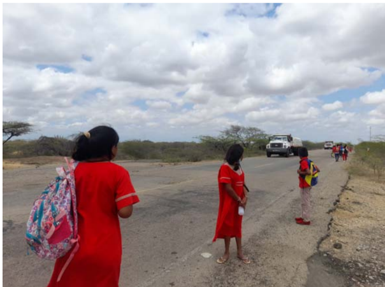
Asodegua exige que se les ofrezca el servicio transporte a los niños o de lo contrario se levantarán en protesta.

A esto se suma una serie de incumplimientos a varios acuerdos por parte de la Secretaría de Educación