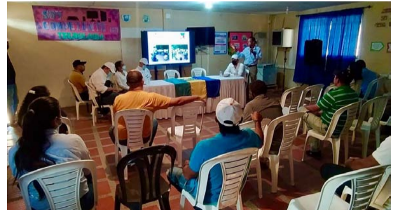
Aspecto de la reunión entre los funcionarios de la administración de San Juan del Cesar y la comunidad.