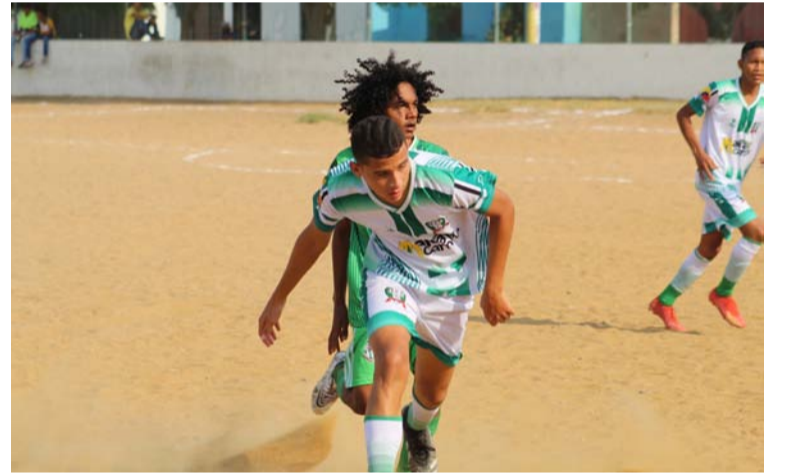
El onceno Unión Koram Villanueva ha ido mejorando en la parte futbolística y en la recaudación de puntos.

sión entre sus hinchas, se vislumbra una actitud de hermandad y de unión. En lo que va de la competencia, en los dos partidos jugados como local, los aficionados empiezan a decir UKV "es uno de los favoritos y tiene juego con clase".