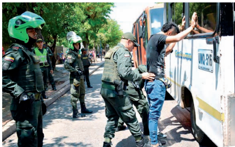
El alto mando anunció que recibirá mil hombres que apoyarán la seguridad durante el Festival Vallenato.

Por otra parte, el coronel manifestó que se desplegarán campañas de cultura ciudadana, para que el Festival Vallenato siga siendo ejemplar a nivel país. Es promover el comportamiento ciudadano, hacer control social e irse preparando de manera logística, para sacar adelante el evento que causará un impacto social y de apertura económica en la región.