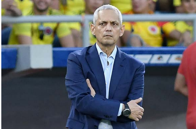
El DT Reinaldo Rueda logró llevar a Ecuador y Honduras al mundial, pero no ha podido llevar a Colombia.

compromiso, y de acuerdo a la información que se conoció, Rueda sellaría su segundo ciclo en el seleccionado nacional, ya que así estaba estipulado en el contrato. Su continuidad al frente de Colombia dependía de la disputa de la repesca, hecho que al final no se dio.