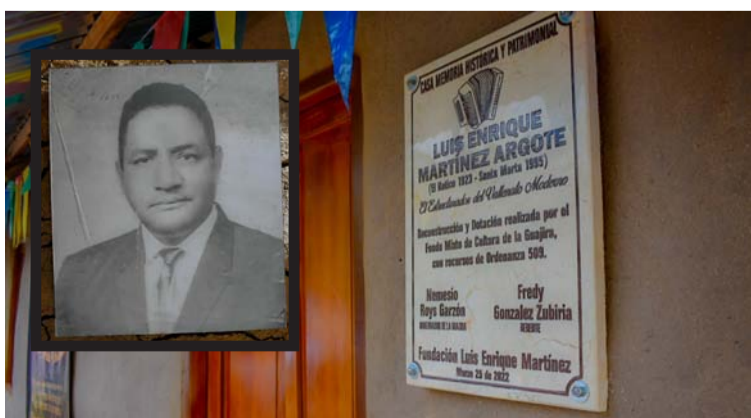
EL espacio servirá para promover el legado de ‘El Pollo Vallenato’, heredado a los amantes del vallenato.

trabajo de investigación de la Fundación y el Fondo Mixto, donde se recopilaron objetos y elementos que sirvieron en el proceso de inspiración y creación de este gran cantante, verseador, compositor y acordeonero.