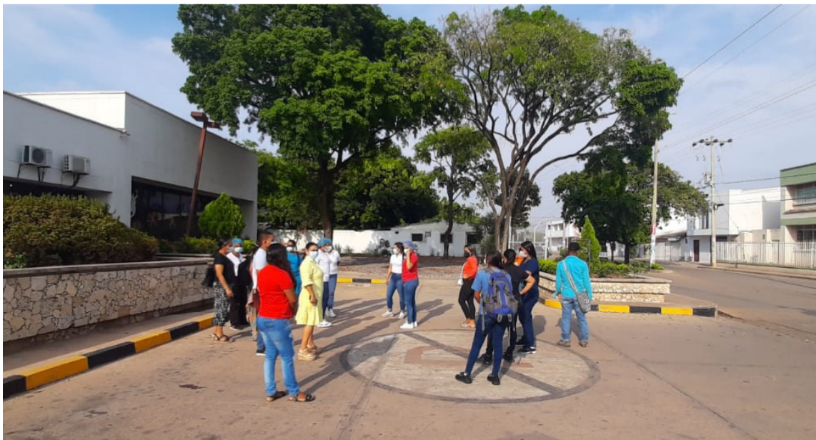
Personal administrativo y voluntarios hicieron parte del simulacro de evacuación.