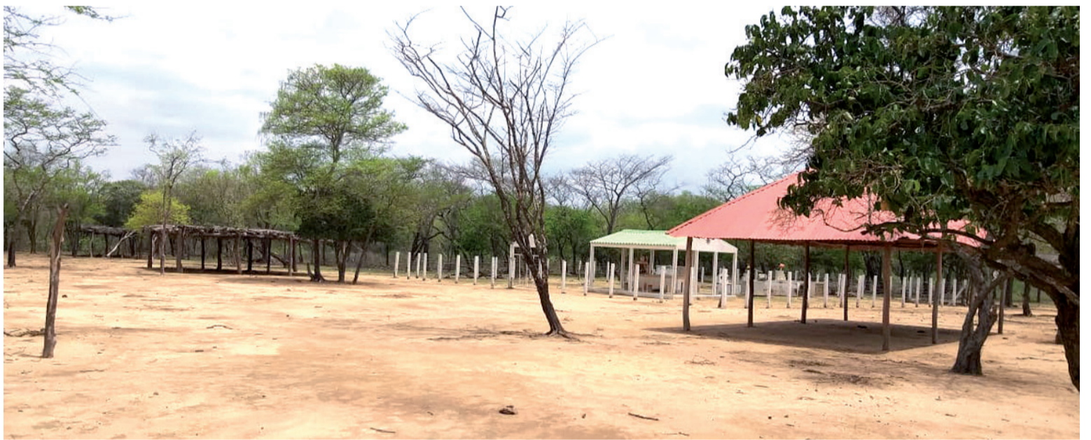
Cementerio indígena donde se encuentran sepultados restos de ancestros con más de 60 años de haber fallecido.

uso de una acción de tutela a inicios del mes de marzo de este año.