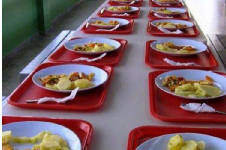
El Programa de Alimentación Escolar debido a las tardanzas afectará a estudiantes del territorio nacional.

marca, Malambo y Sincelejo se han declarado desiertos los procesos contractuales.