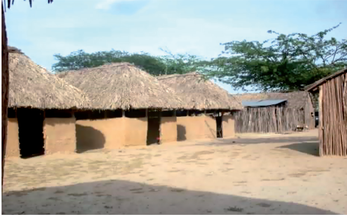
Terreno de la comunidad indígena Paraíso, asentada allí por más de cien años.