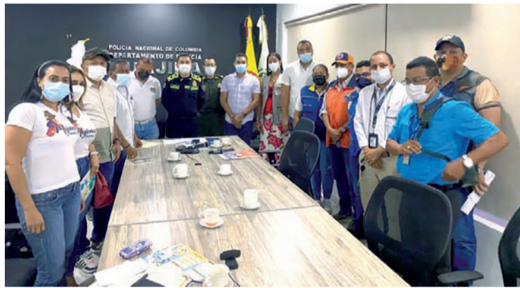
El Festival Francisco El Hombre ha propuesto fortalecerse en los procesos de seguridad y garantizar el bienestar.

Riesgo de Desastres donde estuvieron presentes todas las entidades mencionadas, competentes en la organización logística de este tipo de eventos y, además, cuentan con la experiencia de gestión de seguridad colectiva.