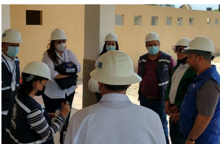
Las obras pendientes para los XIX Juegos Bolivarianos, son los estadios de béisbol, fútbol y baloncesto.

Por esta razón, el Ministerio Público lideró recientemente una reunión de verificación del progre-