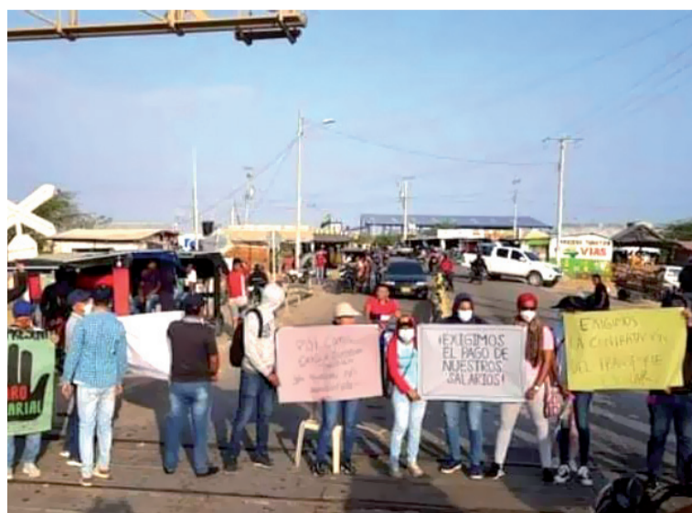
Aspecto de la protesta adelantada por los docentes exigiendo sus salarios en la línea férrea de Cuatro Vías.

En la mañana de ayer, un grupo de docentes decidió bloquear la vía férrea entre Cuatro Vías y Uribia para protestar contra el atraso en el pago de sus salarios.