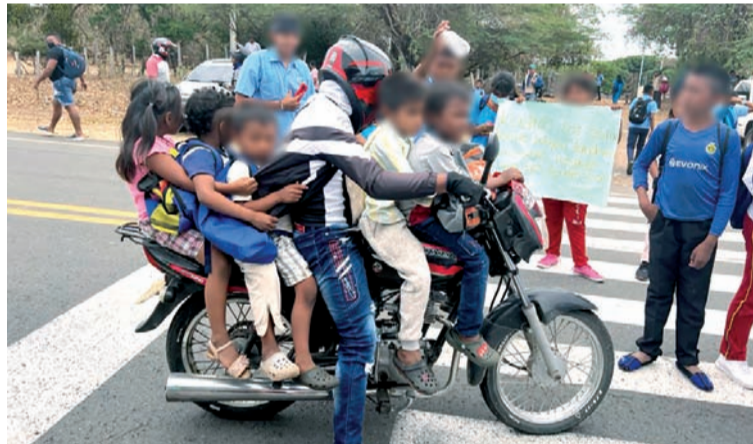
La falta de transporte conlleva a que algunos alumnos arriesguen su integridad tal como lo refleja la gráfica.

Asimismo, aseguró que deben recorrer varios kilómetros por alrededor más