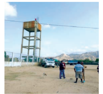
La comunidad de Uribia decidió protestar por el abandono en que se encuentra la importante infraestructura.