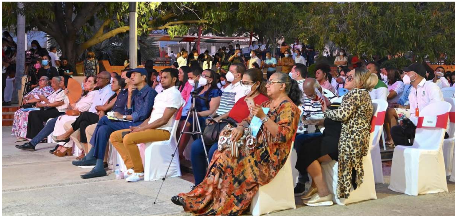
La jornada contó con la presencia de miembros del Consejo Superior, agremiaciones, docentes y estudiantes.

La jornada contó con la presencia de los miembros del Consejo Superior, agremiaciones sindicales, docentes, estudiantes, representantes de cuerpos colegiados, periodistas y ciudadanía en general.