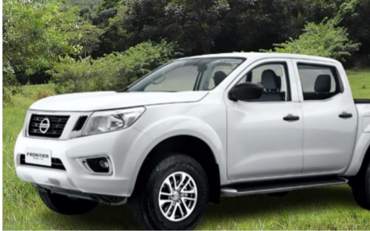
Sujetos encapuchados y fuertemente armados hurtaron esta camioneta en el asalto a la finca 'El Bimbal'.

La capacitación se desarrollaba de manera normal siendo aproximadamente las 11:30 a.m. del pasado jueves, cuando irrumpieron hasta la estancia agrícola un grupo de hombres en