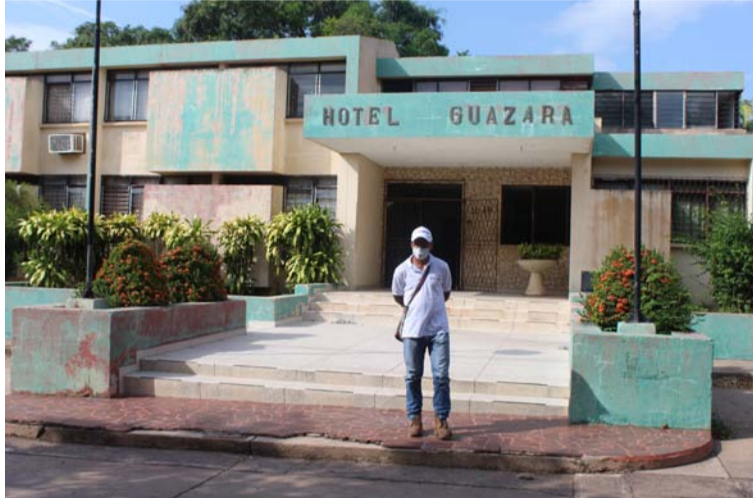
El hotel Guazara dejó de funcionar hace 10 años y lo tuvo en concesión la Fundación Social Creciente.