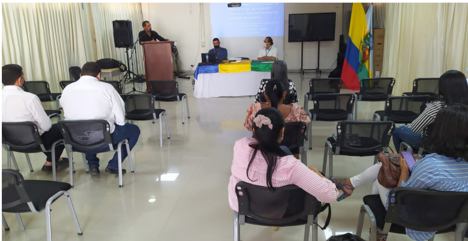
El taller de capacitación se realizó en el auditorio del Instituto Nacional de Formación Técnica Profesional, -Infotep-.

Un taller de asesoría para la formulación de estrategias de participación ciudadana y sistema nacional de rendición de cuentas, dictó el Departamento Administrativo de la Función Pública y su Dirección de Participación, Transparencia y Servicio Ciudadano, a servidores públicos del sur del departamento de La Guajira.