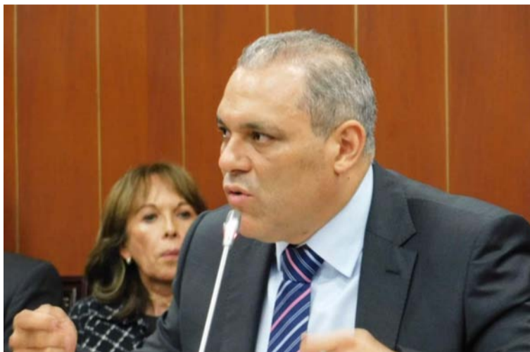
José David Name Cardozo, senador de la República por el Partido de la U, celebró la aprobación del Conpes.

la puerta grande de la transición energética y el crecimiento económico sostenible en el país. Ahora contamos con una política pública que nos direcciona en el cumplimiento de los compromisos de reducción del 51% de emisiones de gases efecto invernadero para 2030 y que también, nos acerca a la reivindicación con las familias colombianas que aún no cuentan con el servicio de energía en sus hogares”, expresó el senador Name.