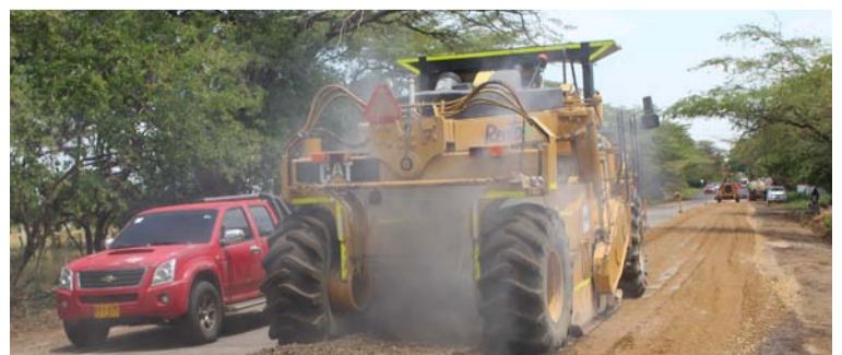
Mincivil y Pavimantar SA, son las empresas constructoras encargadas de toda la malla vial de La Guajira.

Los conductores se mostraron satisfechos por estas intervenciones, pues son muchas las muertes violentas que han ocasionado los cráteres en la carretera.