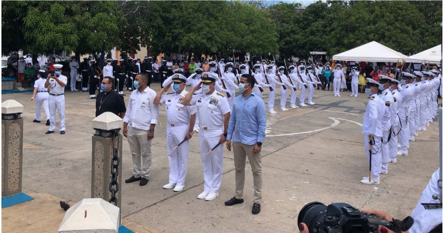
En parada ante el monumento en su honor se conmemoraron los 238 años del natalicio de José Prudencio Padilla.

Siempre estuvo él en el ojo de la tormenta en los procelosos tiempos de la