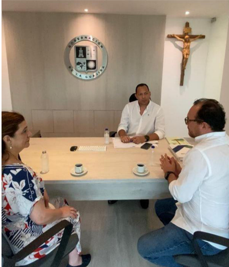
Los estudios permiten que La Guajira tenga un diagnóstico acerca de la productividad de los municipios.

Los resultados son importantes para el desarrollo económico de la región, ya que a partir de hoy, la región de La Guajira cuenta con información clave para orientar la planificación y el ordenamiento productivo agropecuario del territorio, además de un punto de partida para elaborar el análisis financiero de las alternativas priorizadas (costos de producción) y, asimismo, un insumo básico para la formulación de planes de ordenamiento departamental –POD–, planes integra-