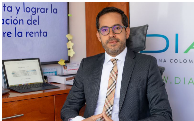
Lisandro Junco, director de la Dian, dijo que se han tomado medidas para garantizar el ingreso de mercancías.

Por último, se resalta el comportamiento del recaudo total de impuestos del 4% por el ingreso de mercancías a la Zrae es de $1,083 millones entre 2019 y 2020, $880 millones entre 2020 y 2021, y $1,100 millones entre 2021 y 2022, lo que representa recursos para la reactivación de esta región del país.