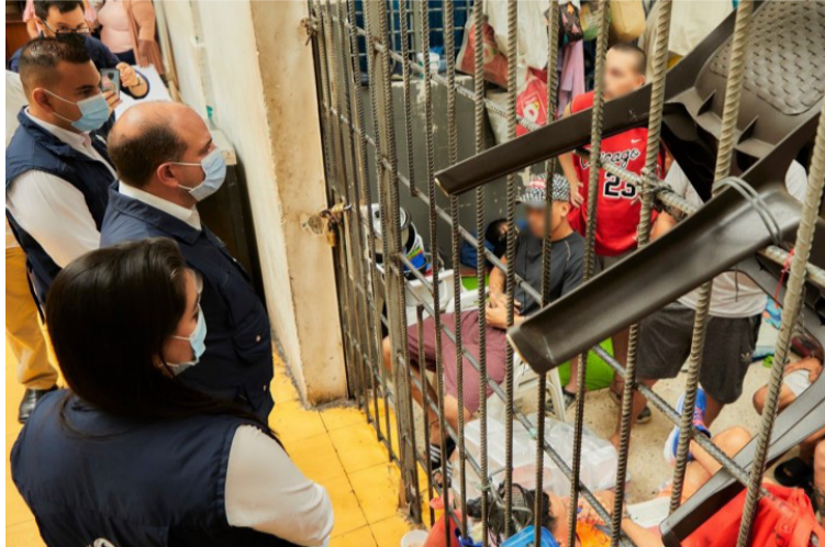
Carlos Camargo, defensor del Pueblo, ha supervisado personalmente las cárceles de La Guajira.

La problemática de hacinamiento se agudizó por la emergencia sanitaria presentada por el Covid-19. Por esta emergencia, en marzo de 2020 el Inpec tomó la determinación de prohibir el ingreso de nuevas personas (condenadas y sindicadas) a sus cárceles. Por esta razón, la problemática histórica del hacinamiento se trasladó a los centros de detención transitoria (URI de la Fiscalía y estaciones de Policía).