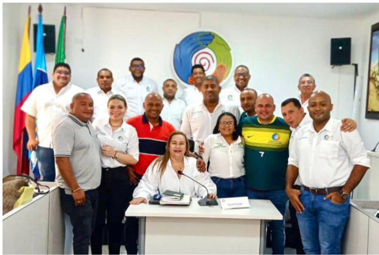
Asaa es el vigente operador y tiene siete años de estar prestando el servicio de acueducto y alcantarillado.

Cabe recordar, que el primer otro si venció en noviembre del 2020. La empresa Asaa cumplió siete