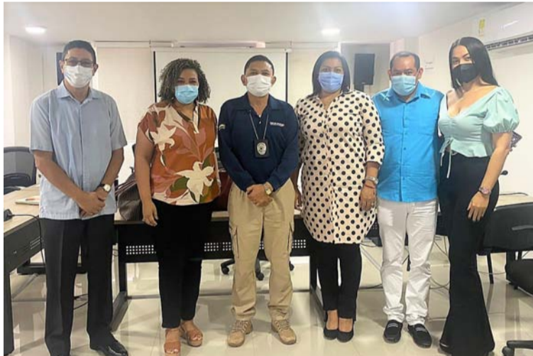
La Uniguajira brindará asesoría, capacitación y asistencia, según el convenio con Migración Colombia.