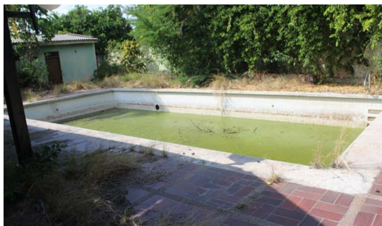
Las áreas sociales del hotel fueron punto de celebración de cumpleaños y matrimonios, hoy son un muladar.

directivo de la Corporación Nacional de Turismo, encabezó el proceso para que el hotel de turismo de Villanueva fuera parte de la Sociedad Progimaura, en donde eran socios la Nación, el