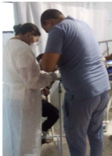
Los médicos del Hospital San Rafael denunciaron que una turba ingresó al centro asistencial y dañó equipos.