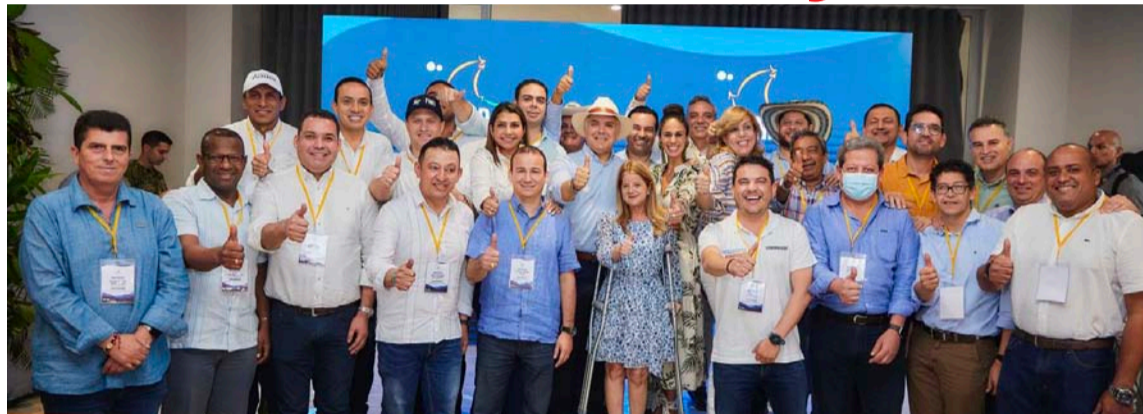
Los mandatarios aterrizaron las necesidades y los retos que enfrentan sus territorios.

A través del ejercicio participativo 'Las Regiones Proponen', los mandatarios regionales aterrizaron las necesidades y los retos que enfrentan los habitantes de sus territorios, dando paso a iniciativas que aportarán al futuro Plan Nacional de Desarrollo en materia de educación, salud, infraestructura vial, transporte y movilidad; minas, energía y medio ambiente; cultura, deporte, participación ciudadana y grupos étnicos; seguridad, justicia y paz; desarrollo económico; niñez y adolescencia; vivienda y servicios públicos; agricultura y desarrollo rural, y descentralización y auto-