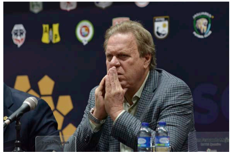
Ramón Jesurún, presidente de la Federación Colombiana de Fútbol, recientemente reelegido por votación.

implica que, en comparación con 2016, cuando llegó al cargo de presidente, cada federación recibirá 8 millones de USD en un periodo de cuatro años. Esto significa siete veces más fondos que en 2016, que se