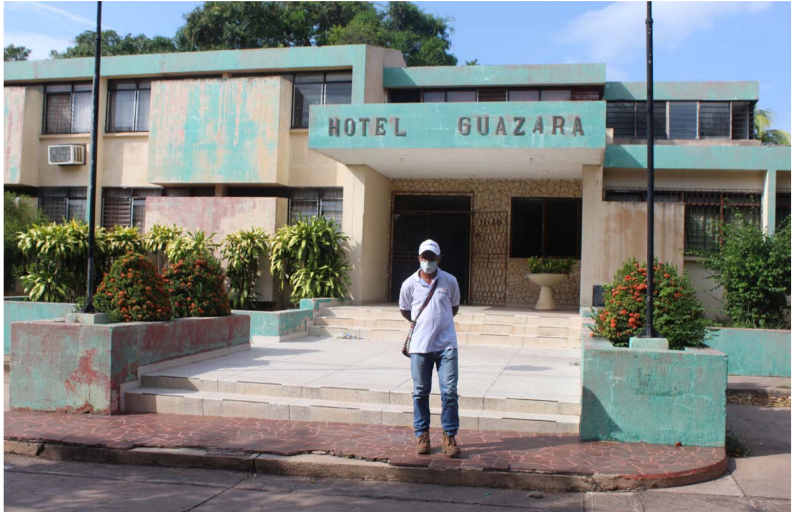
El Hotel Guazara se hizo pensando en alojar a los visitantes que llegaron a Villanueva con el fin de hacer turismo.