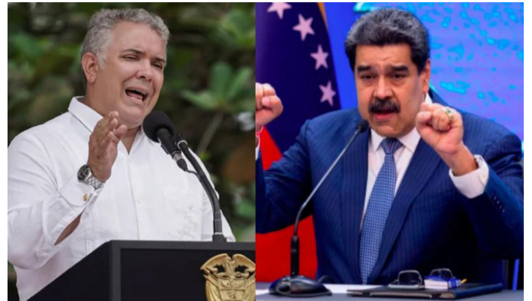
Nicolás Maduro ordenó a los cuerpos de seguridad de su país proteger la infraestructura de servicios.

En Cuba Sí destacaron que los ataques buscan frenar los avances y recupera-