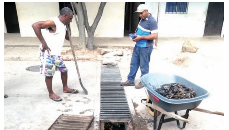
Los habitantes del barrio 7 de Agosto en Albania limpiaron los sumideros fluviales para acabar los malos olores.