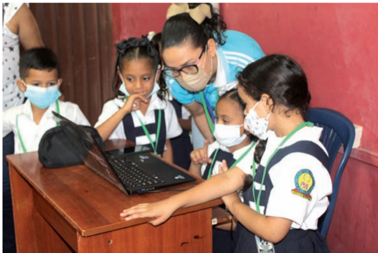
La institución educativa Roque de Alba implementó las votaciones electrónicas a personería y consejo.

Señaló que la I.E. está avanzando y estos son procesos que ya se han crista-