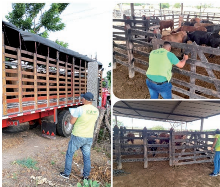
El ICA estuvo atento a que los animales que hicieron parte de las corralejas cumplieran las normas sanitarias.

Durante las cuatro tardes de fiestas taurinas de corralejas, los funcionarios supervisan 27 bovinos, machos de edad adulta en el predio previsto, así como también la inspección en el establecimiento en donde se desarrolló el evento.