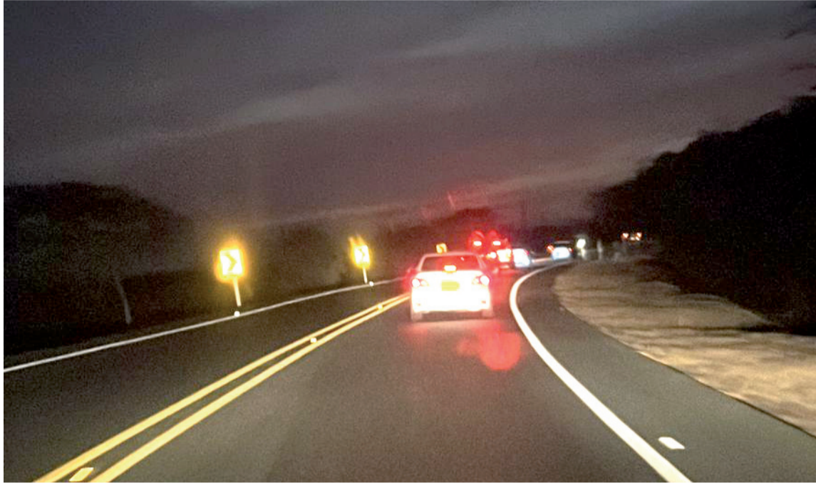
Los hechos se registraron a la altura del kilómetro 26 de la vía Riohacha-Maicao.