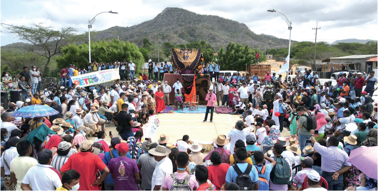
Gustavo Petro, aspirante a la presidencia por la Coalición Colombia Humana, visitó La Guajira el viernes 1 de abril.