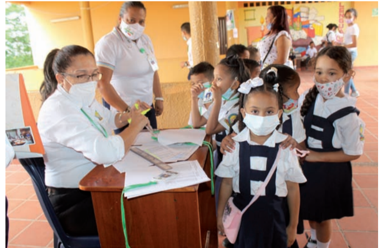
Desde temprana edad, los niños y jóvenes de la escuela ejercieron su derecho al voto, a elegir y ser elegidos.

de que ellos tengan la oportunidad de verificar el proceso y tomarlo en un futuro a nivel de Registraduría – Ins-