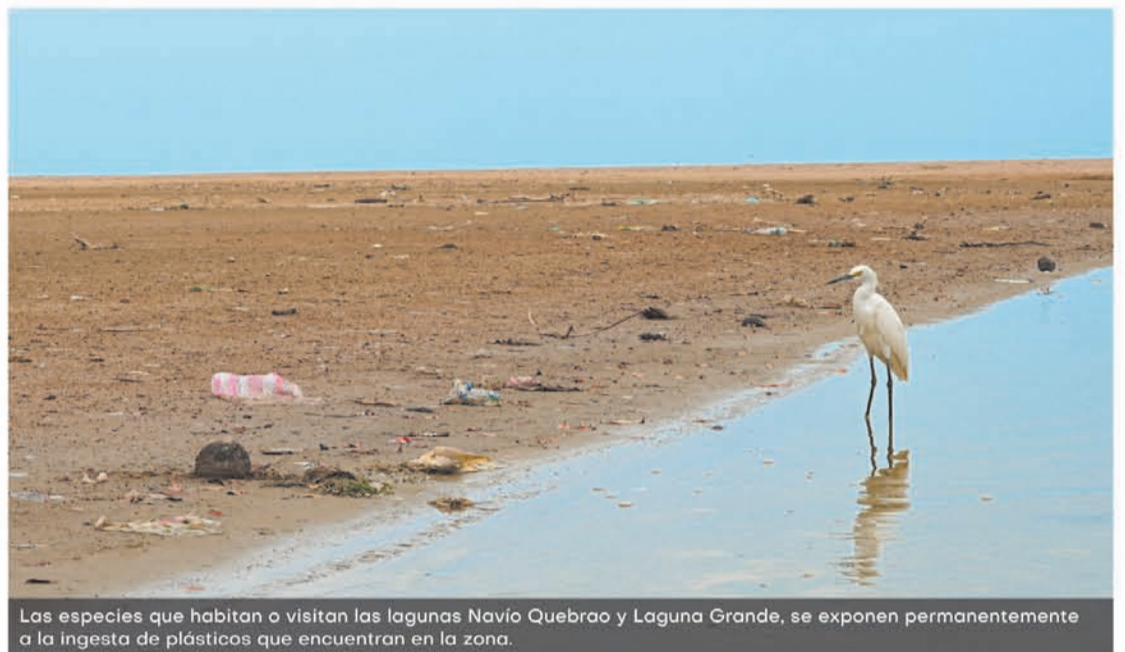
Las especies que habitan o visitan las lagunas Navío Quebrao y Laguna Grande, se exponen permanentemente a la ingesta de plásticos que encuentran en la zona.

“En el departamento no se han encontrado estudios publicados relacionados con la presencia de MP en cuerpos de agua, biota o zonas costeras, por lo que esta investigación sería el primer avance y contribución para el reconocimiento de uno de los contaminantes emergentes de mayor riesgo para los ecosistemas marinos e incluso la salud humana”, concretó el docente de Uniguajira y líder del