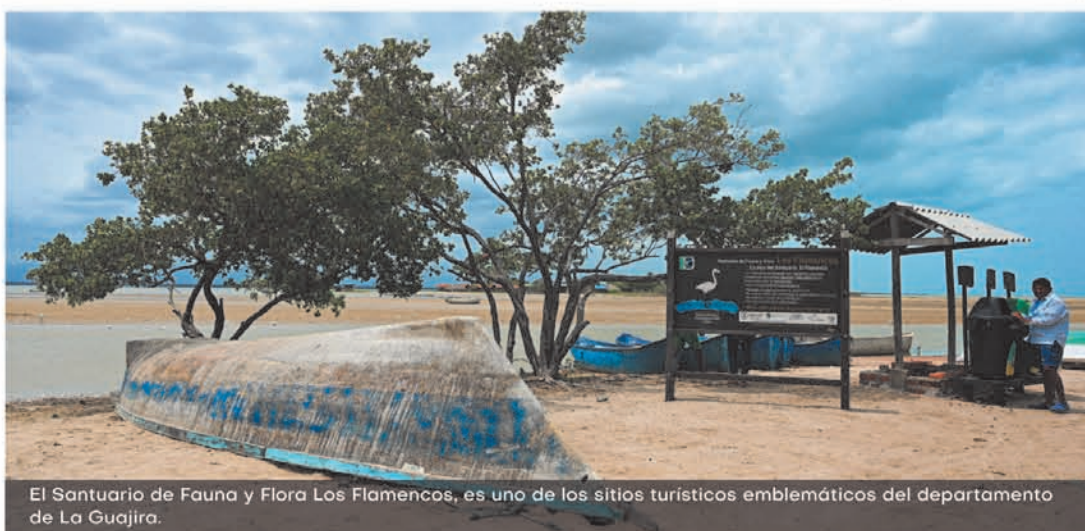
El Santuario de Fauna y Flora Los Flamencos, es uno de los sitios turísticos emblemáticos del departamento de La Guajira.