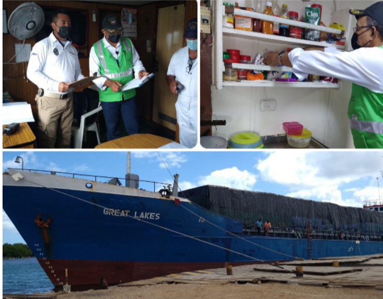
Durante la inspección de las motonaves se verificó la documentación y cuarto de provisiones, entre otros.

La inspección, vigilancia y control de las motonaves internacionales en el puerto se realizó, conjuntamente con Salud Pública, Migración Colombia, Agente Ma-