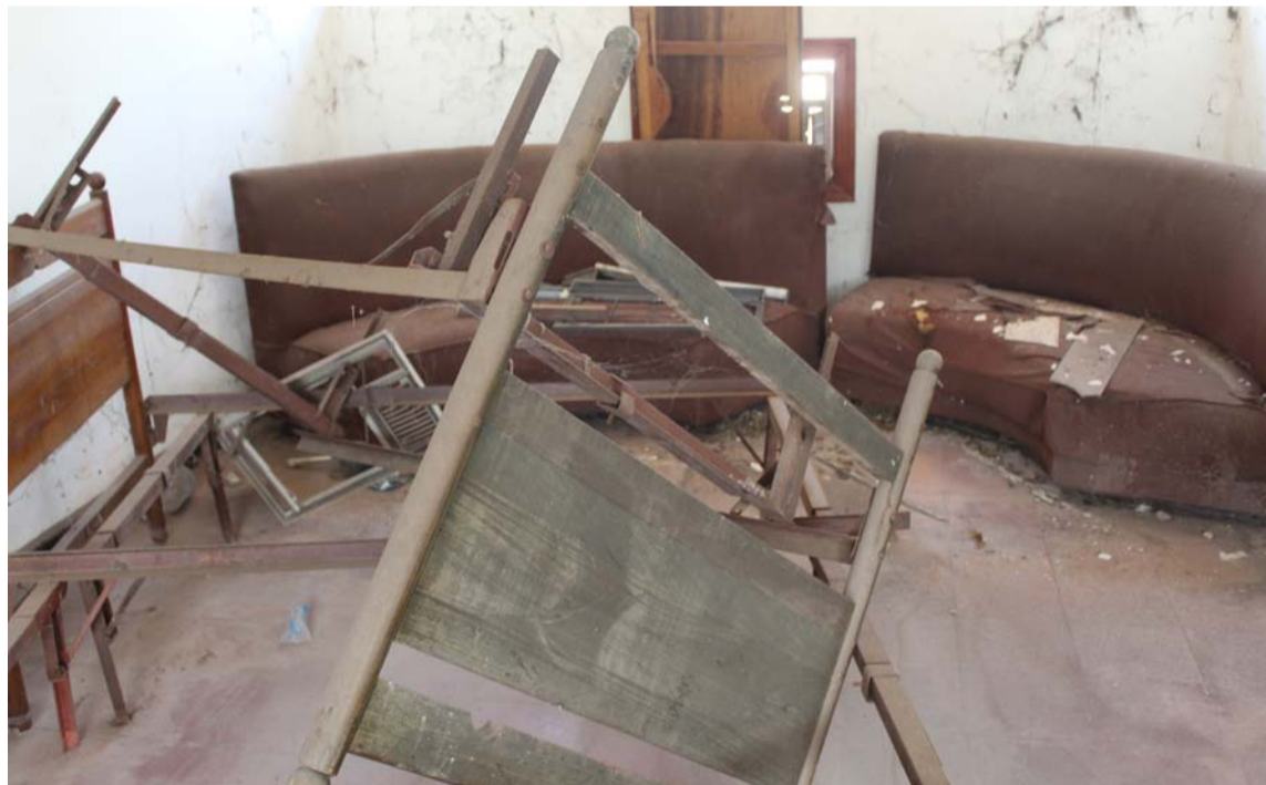
El Guazara, patrimonio de los villanueveros que fue sometido a desidia y abandono.