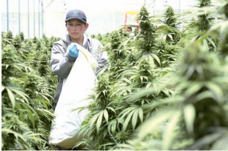
Minagricultura, Minjusticia y Mincomercio reglamentaron operaciones comerciales con semillas de cannabis.

Entre las instituciones que deberán otorgar dicha