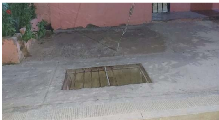
El robo de la rejilla pluvial en Albania ocurrió el pasado jueves y fue denunciado por los habitantes a las autoridades.

El hecho ocurrió el pasado jueves, aproximadamente a las tres de la mañana, situación que tiene preocupados a los moradores del sector, en razón a que ahora está expuesto un agujero.