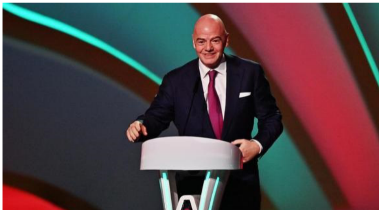
Gianni Infantino, presidente de la FIFA, hizo oficial la entrega de 8 millones de euros a diferentes federaciones.

De esta manera, la Federación Colombia de Fútbol