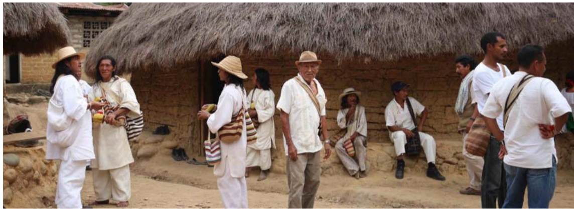
La misión busca encontrar las rutas, garantizar la vida y el buen vivir de los pueblos.

Parlamentarios de Reino Unido e Irlanda participan de la Misión por La Vida para verificar la situación de derechos territoriales en La Guajira y la Sierra Ne-