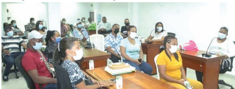
Un total de veinte presidentes de juntas de acción comunal, tomaron posesión en las instalaciones del Concejo municipal de Dibulla.