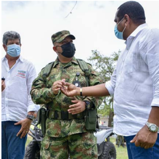
El batallón con sede en Manaure, Cesar, recibió 5 cuatrimotos y 10 motos de alto cilindraje.

“Estamos garantizando seguridad en el sector que se nos ha asignado: Manaure, La Paz y Codazzi, en su parte alta de la Serranía del Perijá, además de los 65 kilómetros de línea