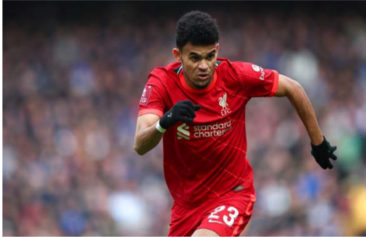
Luis Díaz, extremo del Liverpool, estuvo con la Selección Colombia y no jugó ante el Watford por la liga inglesa.

Aunque fue suplente y no sumó minutos en el triunfo de Liverpool 2-0 sobre Watford en la más reciente jornada de la Premier League, desde que llegó al fútbol del Reino Unido ha sorprendido por su habilidad ofensiva, compromiso, sacrificio y facilidad con la que se adaptó a la considerada mejor liga