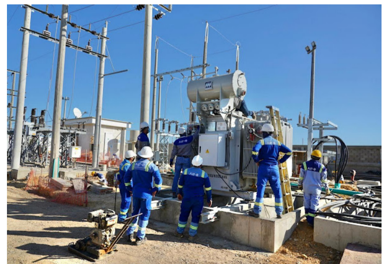
Para el desarrollo de estas maniobras de alta tensión será necesario suspender el servicio en varios sectores.

"Estamos comprometidos con nuestros usuarios. Seguiremos ejecutando acciones a mediano y largo plazo que contemplan la adecuación de la infraestructura eléctrica de la línea 529, la intervención de circuitos en Uribia y Manaure y otras maniobras", afirmó.