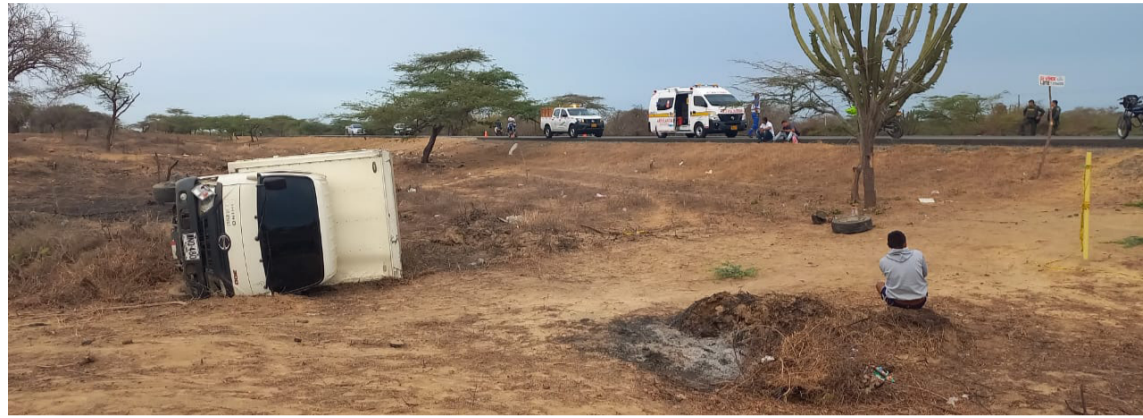
Así quedó el vehículo tras accidentarse a la altura del kilómetro 86 en la Troncal.

iniciar la investigación de lo ocurrido.