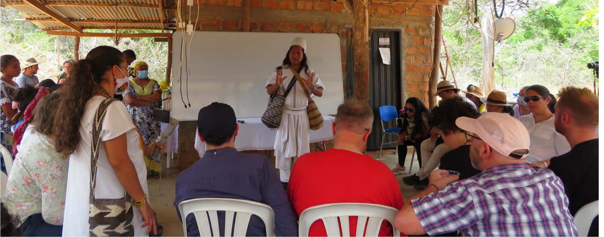
La comunidad ha prendido las alarmas sobre los daños socioambientales que llegarán afectando a las 113 especies que habitan los ecosistemas.

Constatan violaciones a los Derechos Humanos