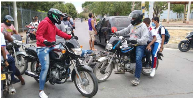
Aspecto del accidente del motociclista ayer en Riohacha. Debido a sus lesiones lo trasladaron a un centro asistencial.

“Impactó fuertemente contra el lado del vidrio del conductor, sufriendo lesio-