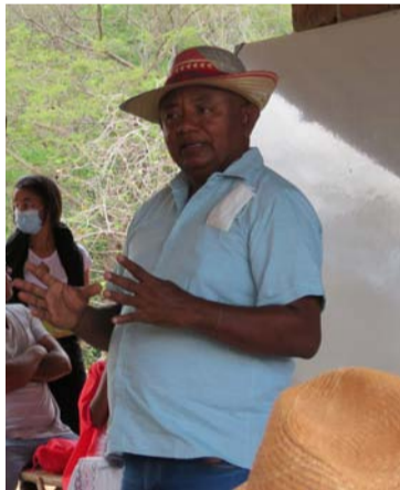
Hacen un llamado a la comunidad internacional para que se implementen proyectos que mejoren su calidad de vida.