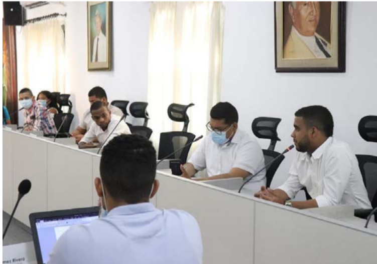
Se debatió y aprobó el plan de acción que traza la hoja de ruta para concertar y ejecutar una agenda juvenil.

En ese sentido, se debatió y aprobó el plan de acción que traza la hoja de ruta para concertar y ejecutar una agenda juvenil integral, que contempla la realización de una gran asamblea