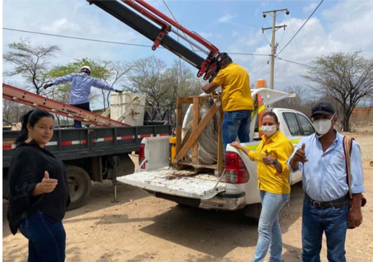
El transformador va a suministrar energía al 30% del resguardo y va a mejorar el servicio para el sector de Provincial.