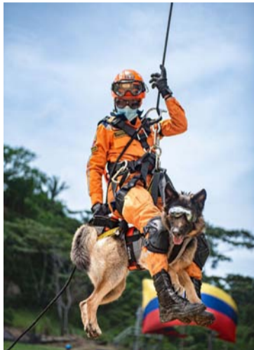
La institución realizará un despliegue de algunas de las capacidades adquiridas.

Con una inversión en el presente cuatrienio cercana a los 48 mil 900 millones de pesos, sin antecedentes en la historia de la entidad, la Defensa Civil Colombiana adquirió cuatro Unidades de Respuesta Rápida en Apoyo a Salud y Alojamiento con facilidades de movilidad, despliegue y autosuficiencia operativa, gracias a recursos gestionados por el señor presidente de la República, a través del Fondo de