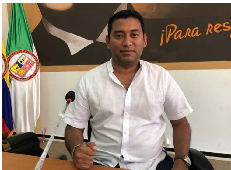
Miguel Felipe Aragón, presidente de la Asamblea de La Guajira, primera en ajustar su reglamento interno.

La Asamblea de La Guajira es la primera en Colombia en ajustar su reglamento interno, cumpliendo así con la ley 2200 del 8 de febrero de 2022.