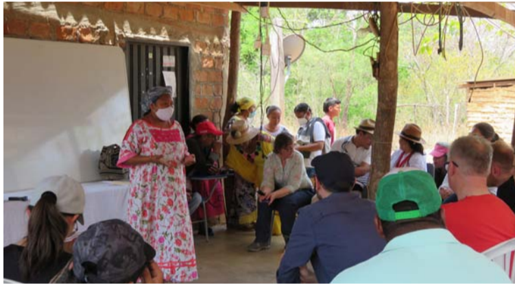
Líderes piden mejoría de calidad de vida para mujeres.

“Soy muy consciente de que estamos parados sobre lo que alguna vez fue