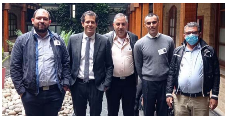
El mandatario estuvo acompañado por el director de Planeación y el representante de Aguas de la Península.

Finalmente, Hugues Lacouture espera que su breve paso de cuatro meses por el Congreso sirva para impulsar proyectos para mejorar la calidad de vida de la región, como el servicio de agua para corregimientos y veredas de La Guajira que actualmente no disponen del líquido con facilidad.