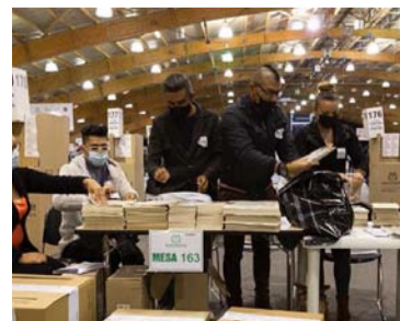
Buscan determinar posible responsabilidad penal.

En este análisis se detallaron algunos errores que se evidencian en las imágenes que están anexas al informe presentado a estos órganos de control. Entre ellos se establece: