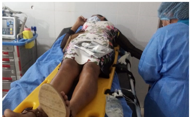
La mujer arrollada por la motocicleta, al instante fue atendida en el Hospital San Agustín de Fonseca.