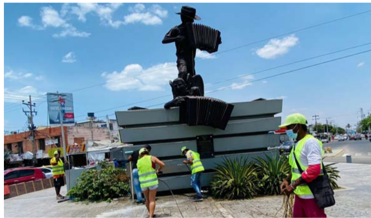
La intervención al monumento Francisco El Hombre incluyó limpieza, pintura y dotación de plantas naturales.

Un nuevo aire de limpieza y embellecimiento se respira en la glorieta Francisco El Hombre, luego de que fuera intervenido por un grupo de