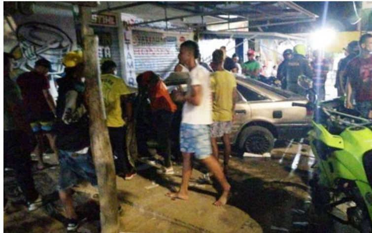
Sancionaron al adolescente por no tener seguro, tecno-mecánica, licencia de tránsito y evadir señal de tránsito.

Tras el siniestro vial que dejó cinco personas heridas, tres mujeres y dos hombre, el adolescente fue capturado y tras ser identificado