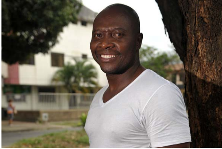
Freddy Rincón, exfutbolista colombiano, sufrió un accidente de tránsito la madrugada del lunes 11 de abril.

La fortaleza del 'Coloso de Buenaventura' está a prueba. El futbolista vallecaucano Freddy Rincón, una de las estrellas de la generación dorada del fútbol nacional, sufrió un accidente de tránsito en la madrugada del pasado lunes en Cali. Su pronóstico es reservado, ha sido intervenido de urgencia en la Clínica Imbanaco, a la que