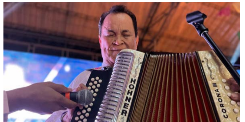
Alfredo Gutiérrez será homenajeado mañana en Bogotá.

La Cancillería con este homenaje destaca el talento y la trayectoria del maestro Alfredo Gutiérrez, un juglar vallenato integral que canta, compone y toca magistralmente el acordeón.