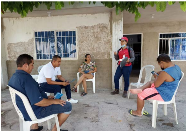
Con un trabajo mancomunado entre Veolia y la comunidad se logrará el cumplimiento del objetivo en El Molino.

Segun se conoció, el primer día se habilitará el sector 1, el segundo el mismo sector con servicio continuo durante 48 horas y el tercer día, el sector 2. “Se abre