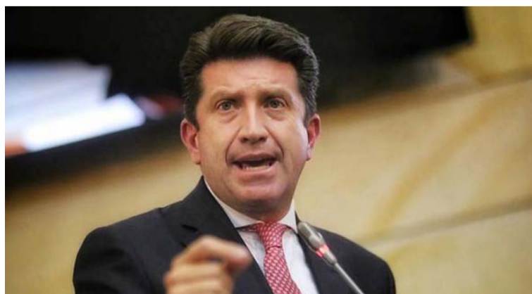
Los citantes de Molano advirtieron que las declaraciones del ministro “son contrarias al orden constitucional”.

Finalmente, manifestaron que el comportamiento del Ministro puede comprometer la responsabilidad internacional del Estado colombiano.