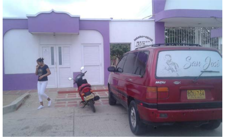
El cuerpo sin vida fue ingresado a las instalaciones de Medicina Legal en Maicao, a espera de ser identificado.

El cuerpo sin vida fue ingresado a las instalaciones de Medicina Legal en Maicao, a la espera de su plena identificación.