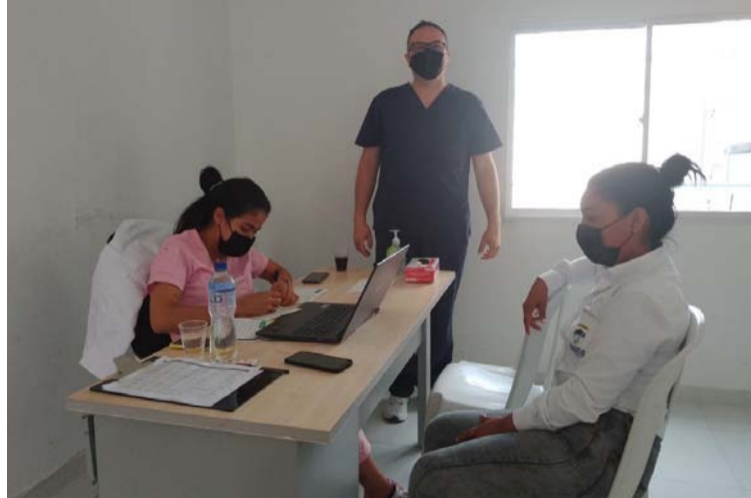
Las jornadas son frecuentes y totalmente gratuitas y las realizan médicos oncólogos y enfermeras a la comunidad.

Precisó que en coordinación con la unidad oncológica NS estudian la posibilidad de regresar al corregimiento de Matitas para atender a quienes no lograron acceder a la jornada del fin de semana pasada.