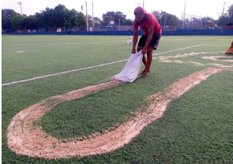
La cancha 'el Koram' y la cancha de la urbanización Román Gómez Ovalle, se les cambió la cancha sintética.

De igual forma, la cancha sintética de 'el Koram', le fueron adicionados un total de 12 toneladas de caucho para el buen funcionamiento del gramado sintético, el