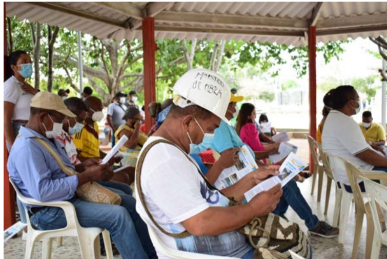
La construcción del parque tiene como fin fomentar escenarios para prácticas de actividades físicas y culturales.

La construcción de este parque, tiene como fin fomentar nuevos escenarios