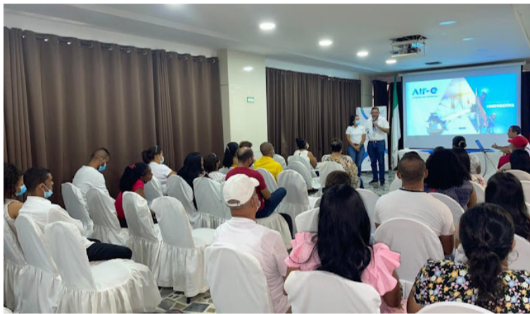
El programa de la empresa Air-e 'Mentes Líderes' busca el fortalecimiento de las capacidades de liderazgo.

Este programa reconoce la importante labor que realizan estas personas y tiene como objetivo aportar a los participantes, herramientas a través del proceso formativo para el fortalecimiento de sus capacidades