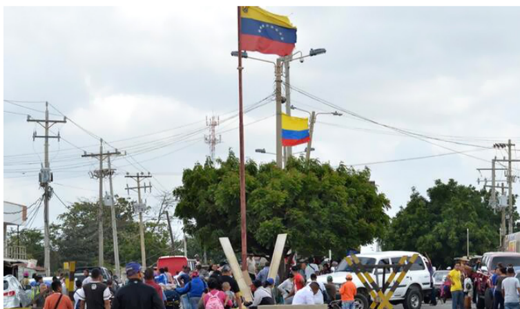
La mayoría sacaron el permiso en el año 2018 o antes.

La mayoría de quienes sí lo sacaron lo hicieron en el año 2018 o antes y apenas el 11 % lo ha hecho entre 2021 y 2022, es decir, después del lanzamiento del Estatuto Temporal de Pro-