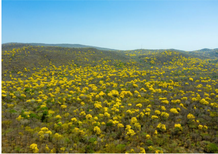
Las acciones de siembra tienen el objetivo de apoyar en la recuperación y restauración del bosque seco tropical.

“En Cerrejón nos unimos a la Gran Sembratón Nacio-