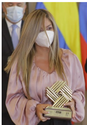
El Premio galardona las experiencias exitosas.

“Desde el pasado dos de marzo, dimos apertura a las postulaciones de las experiencias exitosas del sector público al Premio Nacional de Alta Gerencia y sabemos que este año las entidades tienen cientos de iniciativas que han mejorado la gestión institucional por lo que las invitamos a postularlas”, señaló el director de Función Pública,