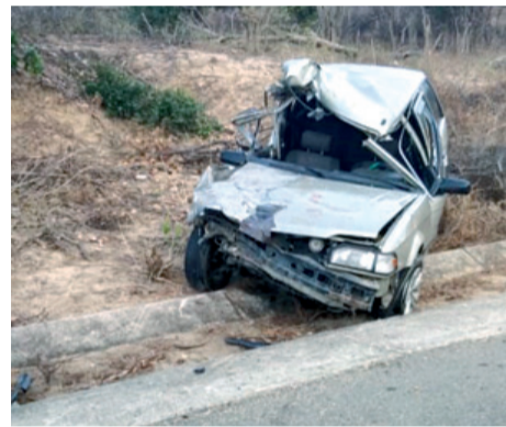
El estado en que quedaron los vehículos demuestra lo violento que resultó el choque.