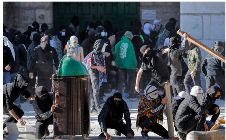
Fuertes incidentes entre manifestantes palestinos, israelíes y la Policía fue la nota característica el viernes santo.

Estos incidentes se producen cuando celebran este domingo la misa de pascua cristiana y las oraciones por la pascua judía (pessah), y