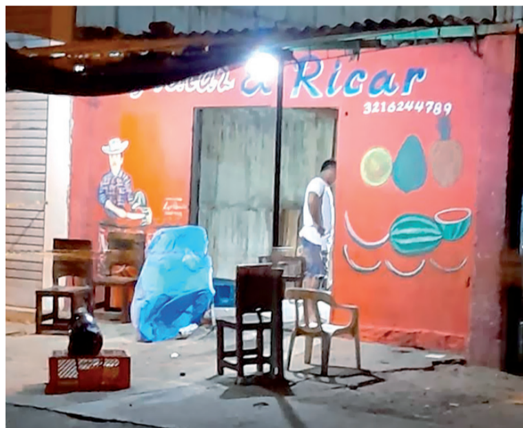
Padre e hija se encontraban en este sitio en inmediaciones del Pabellón de Pescado cuando ocurrió la tragedia.

En su momento el victimario fue judicializado por tentativa de homicidio contra las tres femeninas, pero ahora tendrá que responder por otra conducta punible pues su pareja falleció.