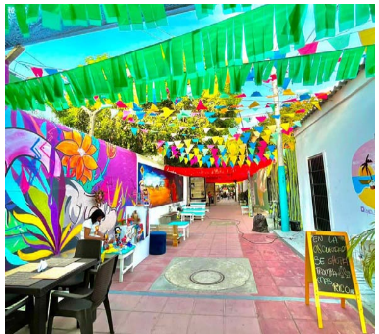
Desde la Gobernación de La Guajira se dispusieron varias estrategias para garantizar el disfrute y la seguridad.

La campaña implementada para esta Semana Santa, ‘La Guajira es mi destino’, ha generado que el Departamento se posicione como un departamento turístico competitivo a nivel nacional, la dirección de turismo del departamento seguirá trabajando por la reactivación turística del territorio.