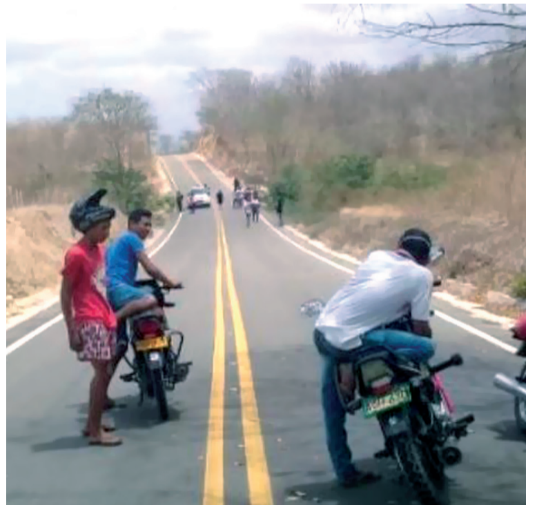
El cadáver fue hallado debajo de uno de los puentes ubicados en la vía que conduce a la vereda Nueva América.

De inmediato hicieron el llamado a las autoridades para que realizaran el levantamiento del cadáver y adelantaran las investigaciones que puedan dar con la plena identificación.