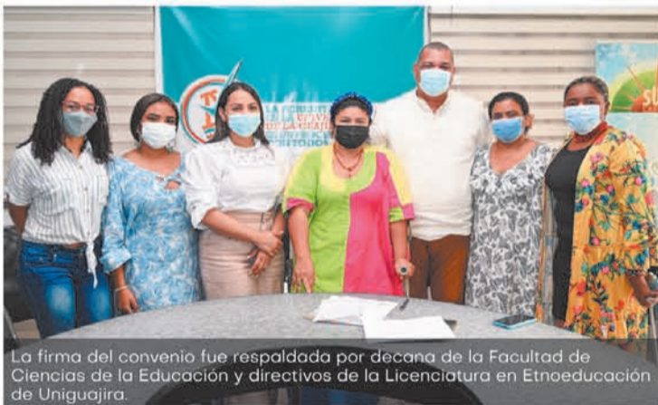
La firma del convenio fue respaldada por decana de la Facultad de Ciencias de la Educación y directivos de la Licenciatura en Etnoeducación de Uniguajira.