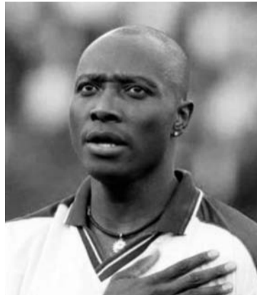
Freddy Rincón, fue a tres mundiales con Colombia.

fael Rincón nació ese 14 de agosto en la Ciudad Puerto. El fútbol fue esencial y permanente en su vida, gracias a este deporte expandió su camino, comenzó a jugar en el Atlético de esa ciudad, allí demostró su gran potencia, técnica, velocidad y esa inteligencia que siempre lo caracterizó en los diferentes estadios a nivel nacional e internacional. Era un delantero envidiable, con talla y buen pie. Fue el abrebocas de lo