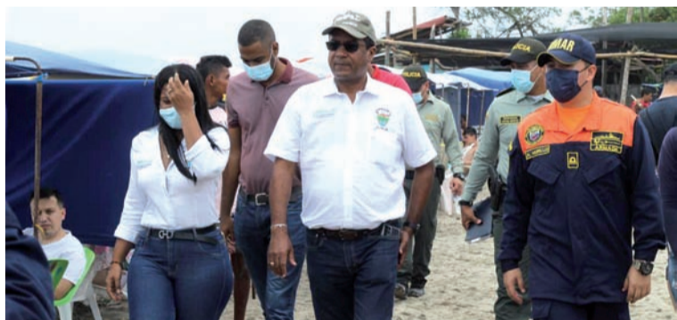
Los operativos ayudaron a que redujeran los homicidios, hurtos, lesiones personales, violencia intrafamiliar y riñas.