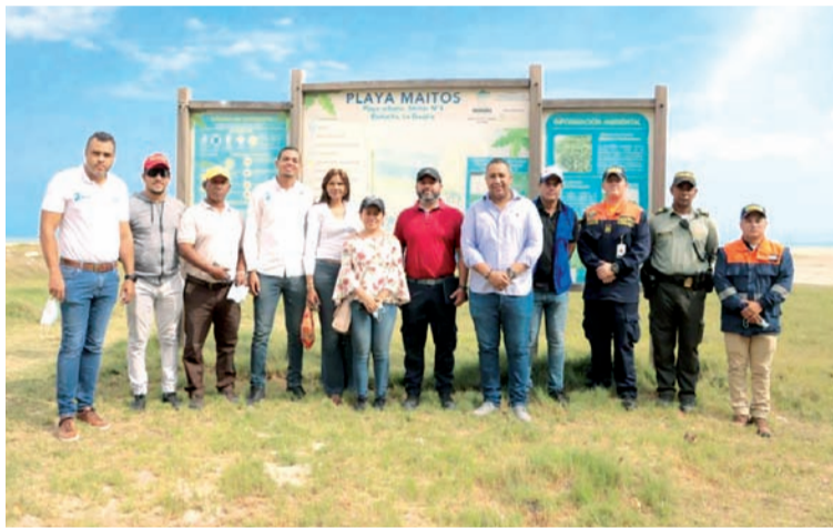
Autoridades realizaron inspección a las playas de Riohacha con propósito de verificar el nivel de cumplimiento.

De acuerdo con los pares, la administración distrital en compañía de entidades como la Dimar, Corpoguajira y la Policía Nacional avanzan a buen ritmo en aspectos como educación y gestión ambiental, calidad del agua de baño, seguri-