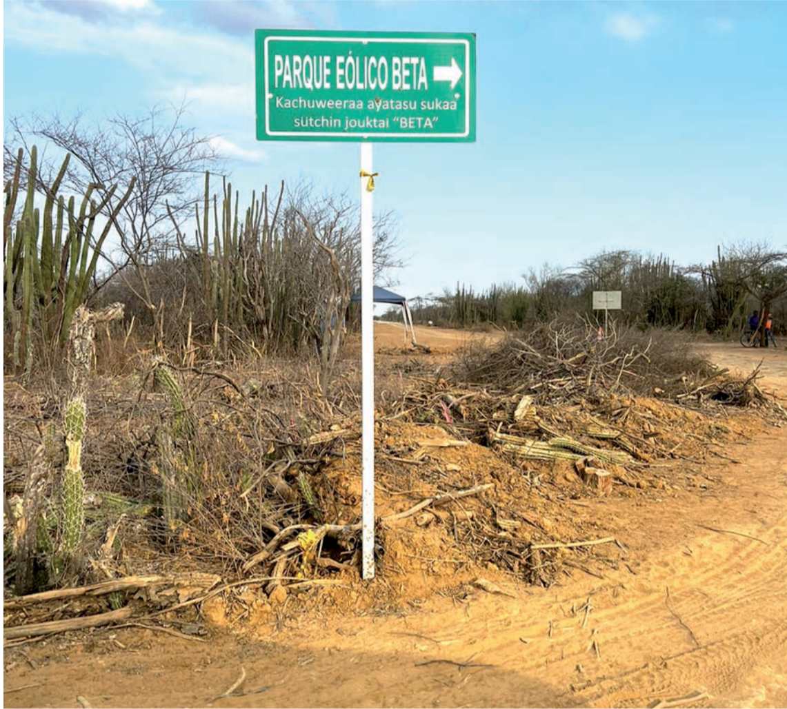
Los wayuú dicen que los parques eólicos están en territorios que les pertenecen.

El problema interno, según informaciones, fue resuelto, pero las graves violaciones a sus derechos fundamentales al territorio, a la vida, al medio ambiente y lo más importante el consentimiento previo libre e informado como derecho fundamental de los pueblos indígenas en el mundo nunca fue reconocido por parte de la empresa Renovatio y Edpr, encargados de la ejecución y puesta en marcha del parque eólico más grande del país (Alpha & Beta).