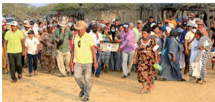
Familia y asistentes acompañando los restos mortales.