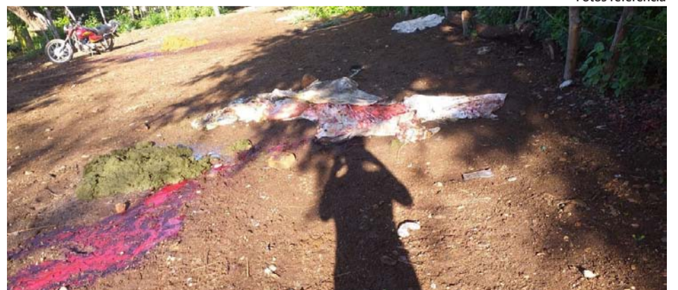
El jueves santo cuatro delincuentes ingresaron armados a la finca Santa Clara, se llevaron tres reses sacrificadas, una motosierra y un vehículo.