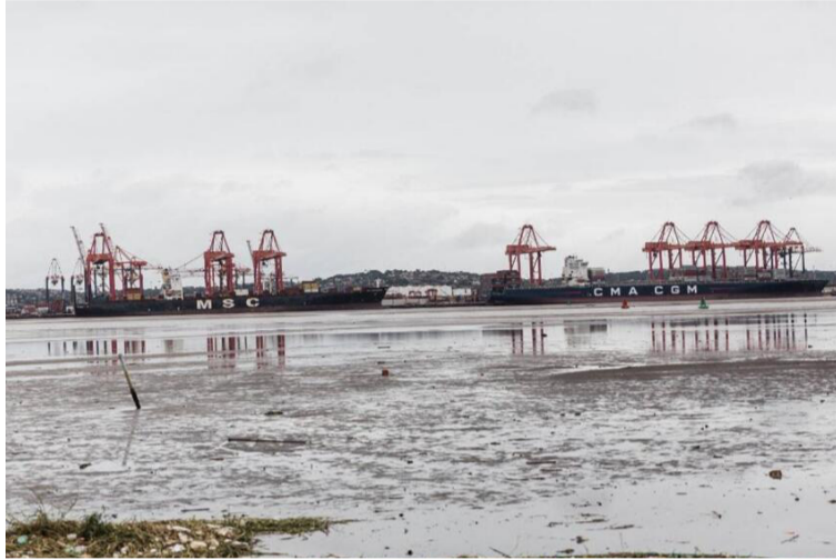
Kwazulu, provincia de Sudáfrica, sufre inundaciones que han cobrado las vidas de 443 personas de momento.

Según cálculos de Mxolisi Kaunda, el alcalde del Ayuntamiento que acoge Durban (oficialmente denominado eThekweni), solo en esa municipalidad los daños se cuantificaban el jueves en 757 millones de rands (unos 50 millones de euros).