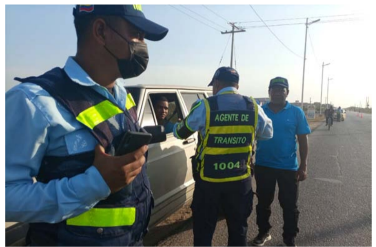
Las intervenciones se realizaron en sectores como la vía que comunica al sur del departamento de La Guajira.