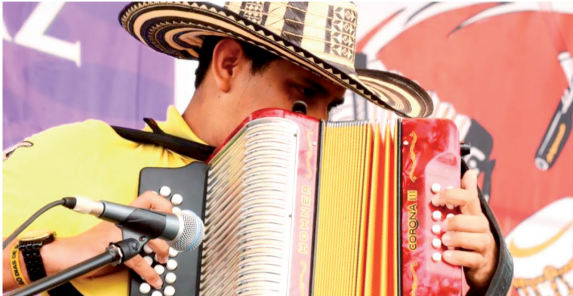
Los concursos de acordeón infantil y acordeonera menor, comenzarán el lunes 25 de abril.

Los concursos de acordeón infantil y acordeonera menor, comenzarán el lunes 25 de abril a las 8:00 am en el Centro Recreacio-