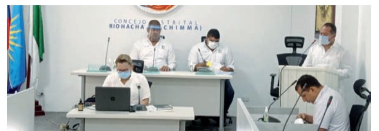
En el decreto emitido por el alcalde se establece que la fecha de culminación de las sesiones es el 23 de abril.

"Queremos ser las manos, los pies, los ojos, queremos ser la boca de Cristo para continuar haciendo presente el milagro de la eucaristía, en cada templo o capilla en donde celebremos", puntualizó.