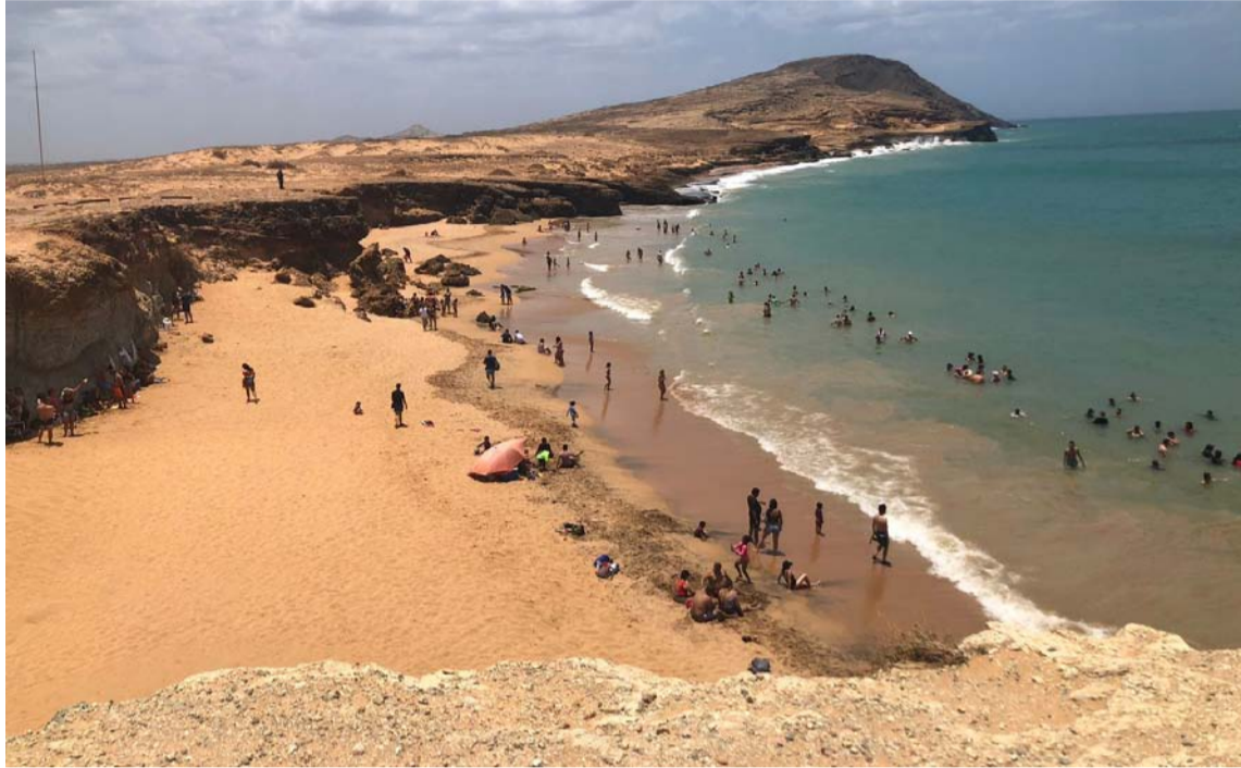
Los hermosos paisajes de La Guajira constituyen gran atractivo para los turistas.

Por ello se estará trabajando en los estudios de carga para que se generen