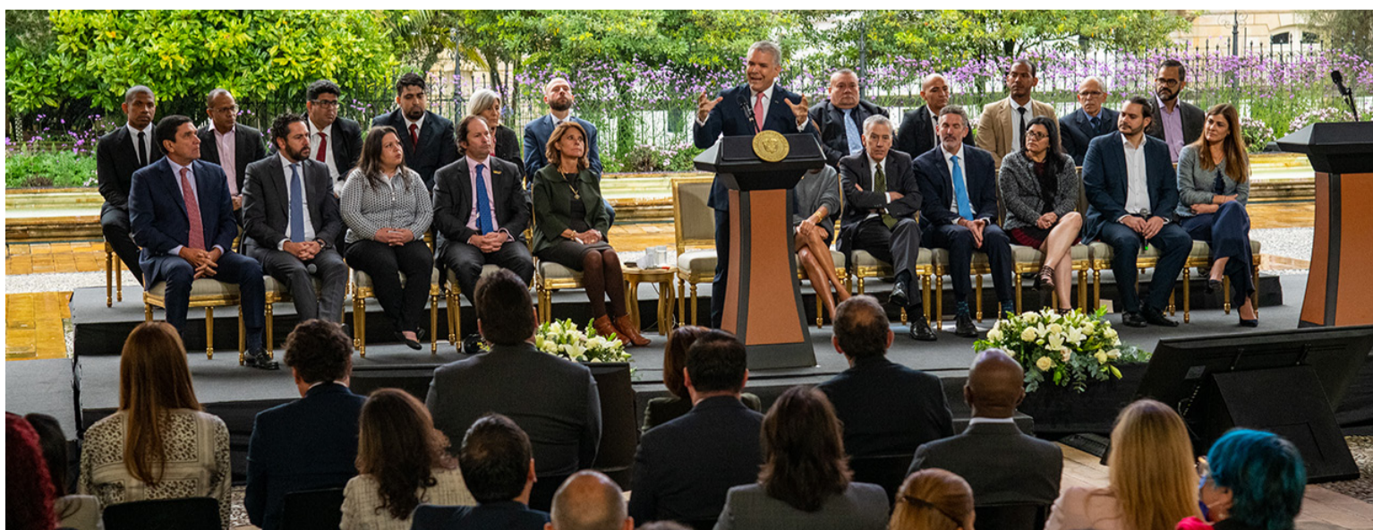
El presidente Duque dijo que los venezolanos tendrán acceso a servicios de salud, educación y actividad bancaria.

Finalmente, destacó "lo que un país es capaz de desarrollar con buenas políticas, con buena coordinación, trabajando en equipo Gobierno Nacional y gobierno local, y demostrando además que, sin ser un país rico y donde hemos asumido la mayor parte del costo presupuestal, podemos hacer las cosas bien, pero las podemos hacer a un mejor cuando tenemos aliados como Usaid y como los Estados Unidos".