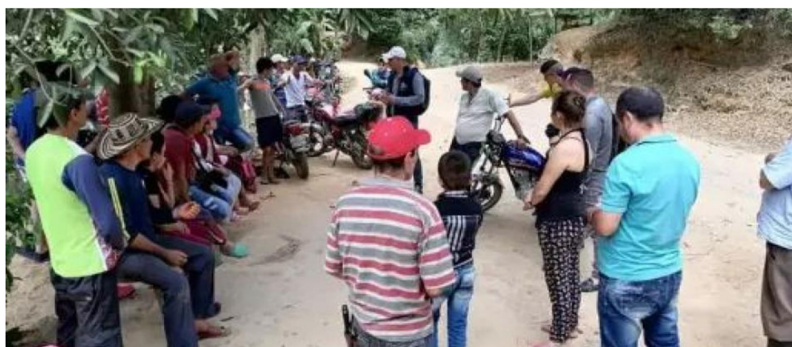
Enfrentamientos entre Los Pachenca y Clan del Golfo han provocado desplazamiento.

Cabe mencionar que la Defensoría del Pueblo había emitido desde el 2019 la Alerta Temprana 044, en la cual se advertía que un hecho de este tipo podría suceder.