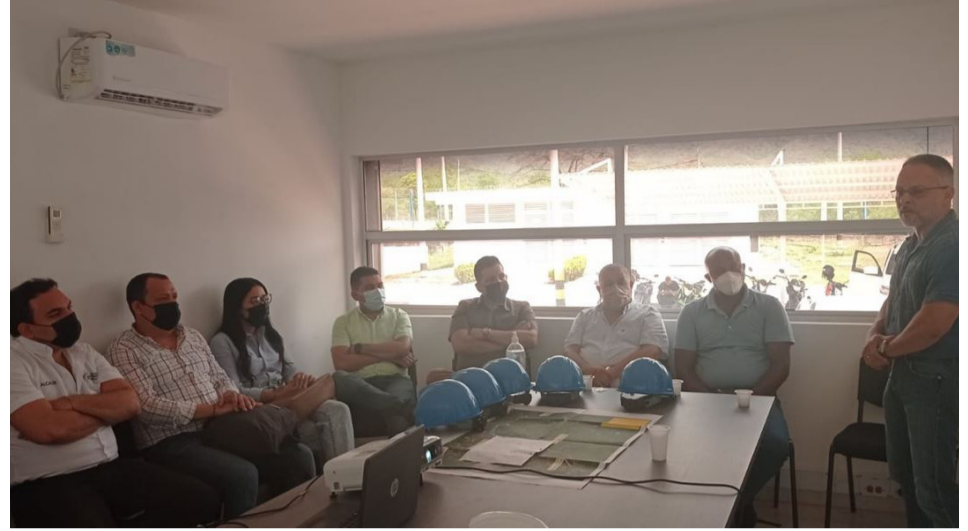
Alcaldes de varios municipios, concejales se reunieron en el corregimiento de Chorreras, buscando una solución a la problemática del agua.