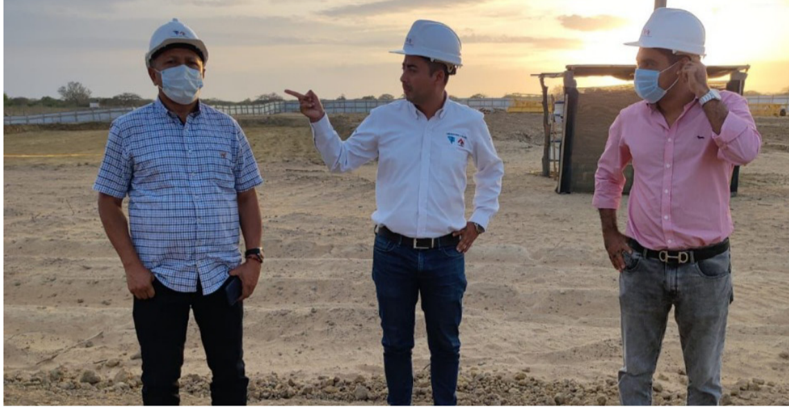
El personero y el secretario de Gobierno hicieron una visita de inspección en la zona.

esto continúe. Ha ido avanzando, ya se está proyectando toda la maquinaria que se necesita para esta obra. Para que en un 100% sea una realidad”, agregó.