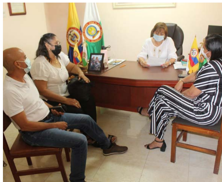
El cese de actividades fue determinado en una asamblea virtual de rectores realizada el pasado lunes.

“Uno de los más apremiantes es dar solución a cada una de las aseadoras que vienen laborando desde el 7 de febrero sin recibir ningún tipo de salario y es por eso que determinamos dentro de la asamblea virtual realizada el lunes dar un cese a las actividades académicas, ya que venimos de una marcha con nuestros estudiantes donde están adaptándose nuevamente a la presencialidad, pero pasa esto y es lamentable”, puntualizó.