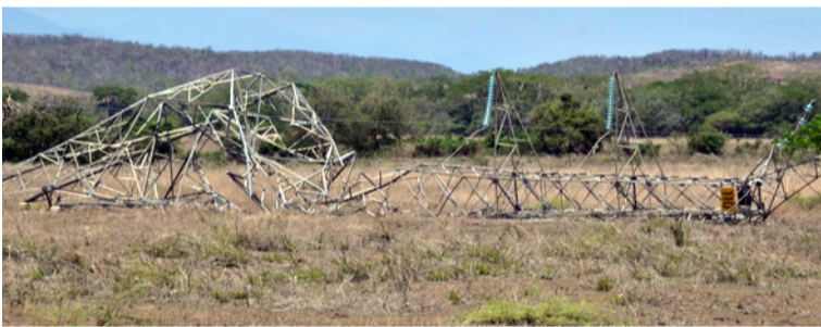
Las torres 051 y 052, que atraviesan la comunidad de Yaguarito, en el Resguardo de El Pozo – Rodeito, se cayeron.