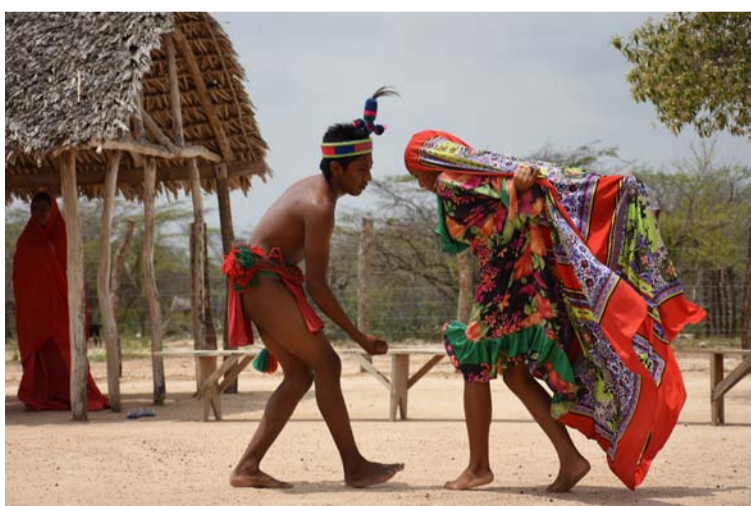
La cultura wayúú es otro atractivo para los turistas y las autoridades departamentales esperan fortalecerla.

las inversiones necesarias y poder soportar todos los visitantes que llegan y se les pueda brindar la atención que requieren.