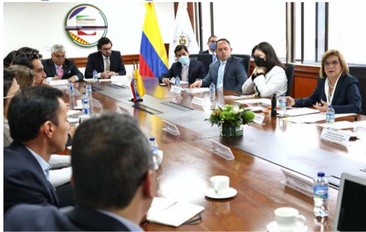
Reunión de la procuradora General, Margarita Cabello, con su equipo y los ocho candidatos presidenciales.

Además, en la selección de la empresa Indra Sistemas por la existencia de situaciones que comprometerían la transparencia del