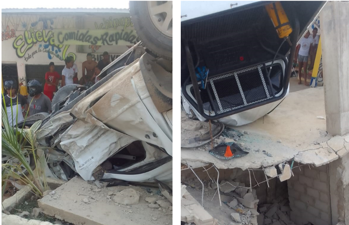
Camioneta accidentada en el sector Guajirito, cerca de la ciudad de Riohacha.