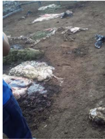
Los delincuentes amarraron por varias horas a los trabajadores y procedieron a sacrificar a los cuatro semovientes.

“Se llevaron hasta los tres dedos de aceite y el poquito de harina que había para hacer el desayuno del día siguiente. Se comieron el arroz y cucayo, para el calentado de los niños el arrocito del calentao de los niños. No dejaron nada”,