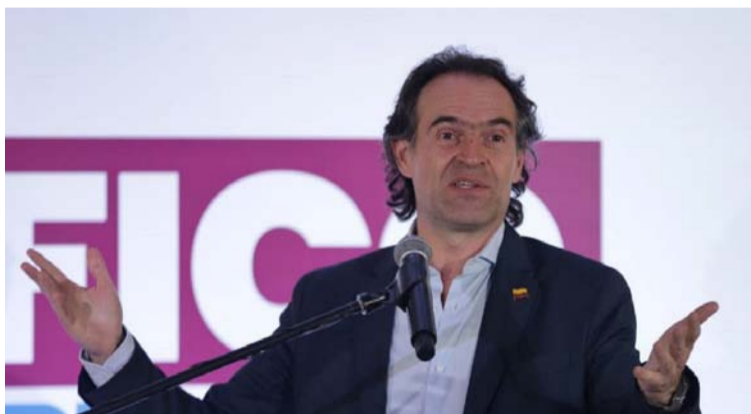
'Fico' Gutiérrez, candidato de Equipo por Colombia.

líticos con peor prontuario. La mayoría de las veces, las consecuencias de nuestra ira es mucho más nefasta que la razón que la originó.