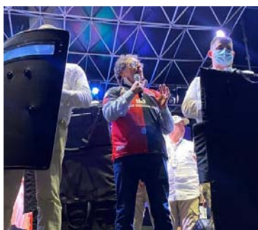
Gustavo Petro Urrego, candidato a la Presidencia.

incluyó guardaespaldas con escudos en la tarima y un chaleco blindado debajo de la camiseta de colores rojo y negro del club de fútbol Cúcuta Deportivo, otorgado por el Gobierno nacional tras la revelación de su campaña de un plan para atacar contra él y que lo llevó a suspender una gira.