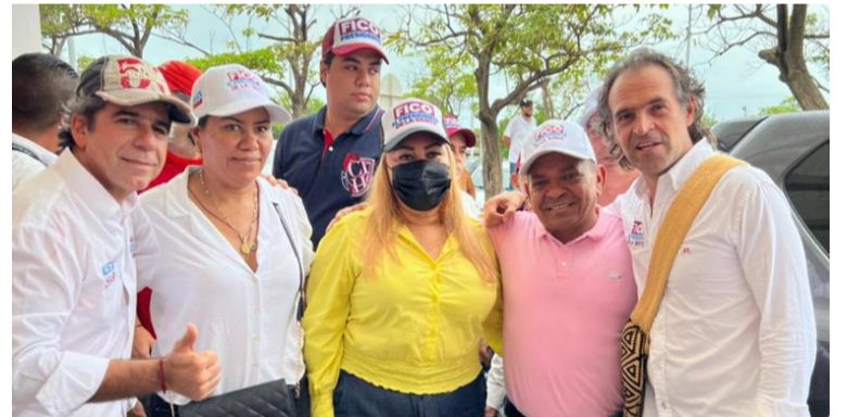
‘Fico’ Gutiérrez, candidato a la presidencia de Colombia, y Alejandro Char, junto a dirigentes políticos guajiros.

“El ingreso solidario que ha aliviado la condición de vulnerabilidad de muchos hogares tiene que convertirse en una renta básica ampliada a cinco millones de hogares colombianos. Que nadie aguante hambre en Colombia, que tengan garantizada las tres comidas”, concluyó diciendo el candidato Federico Gutiérrez.