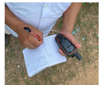
Son más de 460 viviendas de los barrios Hary Fuminaya y Cristo Vive, entre otros, los que recibieron nomenclaturas.