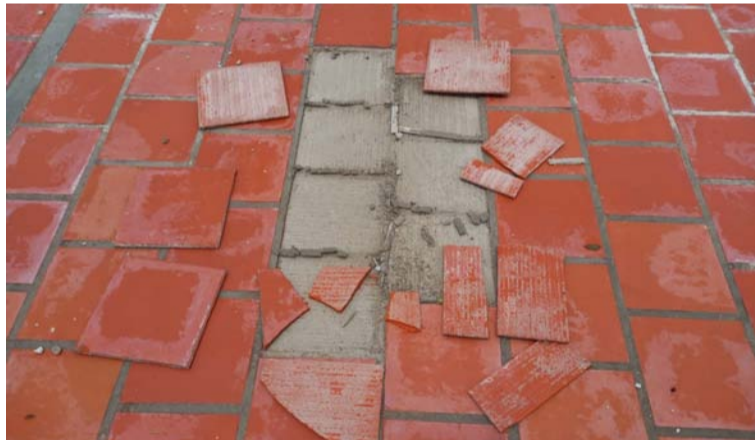
Una a una se han ido desprendiendo las baldosas, evidenciando el pésimo acabado y la mala calidad de la obra.

La denuncia la hizo una habitante del sector aledaño al parque, quien se tomó la tarea de agarrar las baldosas con sus propias manos y las fue desprendien-