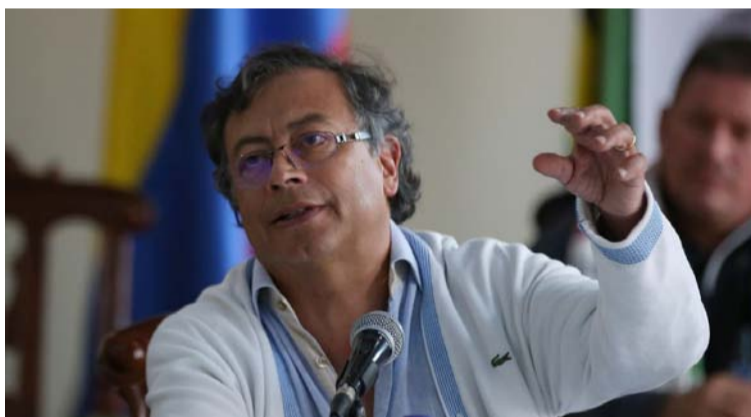
Gustavo Petro, candidato del Pacto Histórico.

Lo más preocupante es que, muchas de estas personas creen que la mejor manera de vengarse de los políticos corruptos o acabar con el "régimen de la complicidad" como lo bautizó Álvaro Gómez, es dándole la oportunidad a otros po-