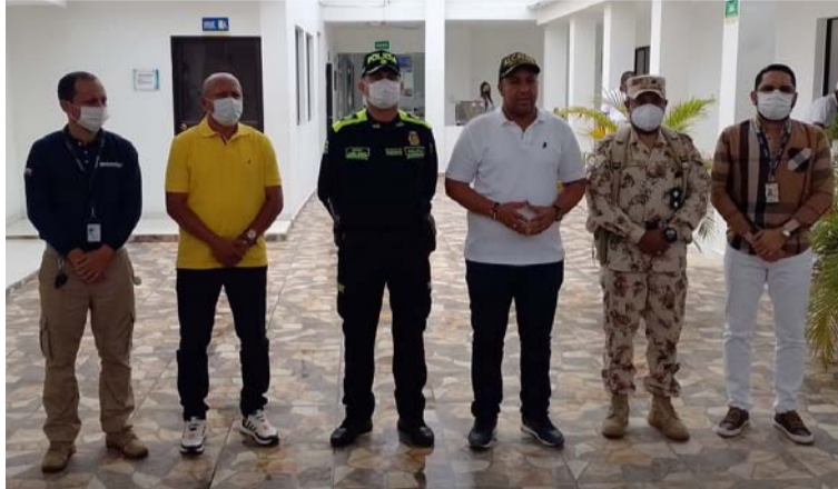
Ejército, Policía, Fiscalía, Migración y Alcaldía de Riohacha, comprometidos con la seguridad de los ciudadanos.

La reunión en la que hicieron presencia funcionarios de la Policía Nacional, el Ejército Nacional, la Fiscalía General de la Nación y Migración Colombia, se realizó con el objetivo de garantizar la seguridad y con-