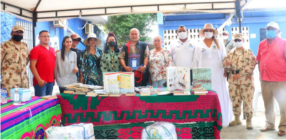
Los kit escolares son donados por la Fundación la Fuerza de la Palabra, la Universidad Javeriana y la Secretaría de Asuntos Indígenas.