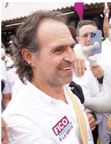
‘Fico’ Gutiérrez invita a la unión y al sentido común.

“Queremos ir más allá de las discusiones de derecha, izquierda o centro. Está el sentido común, vamos a ponernos de acuerdo en que ningún niño se puede morir de hambre. Hay que trabajar por la niñez desde la etapa de la gestación. No puede haber hambre, no se nos puede morir un solo niño, ni una persona de hambre. Es ahí por donde debemos arrancar, no podemos ser