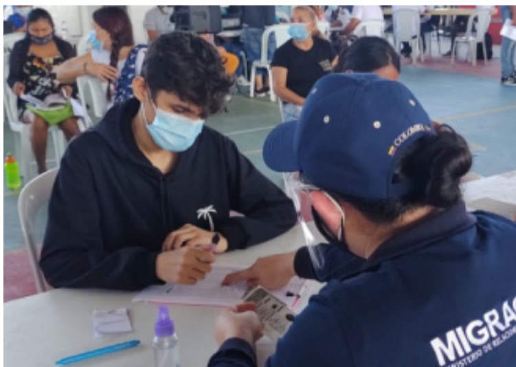
Para la implementación del Estatuto Temporal de Protección, Migración Colombia habilitó 105 puntos visibles.

manecer en Colombia hasta por 10 años de manera regular, sino, además, vincularse a la vida productiva del país.