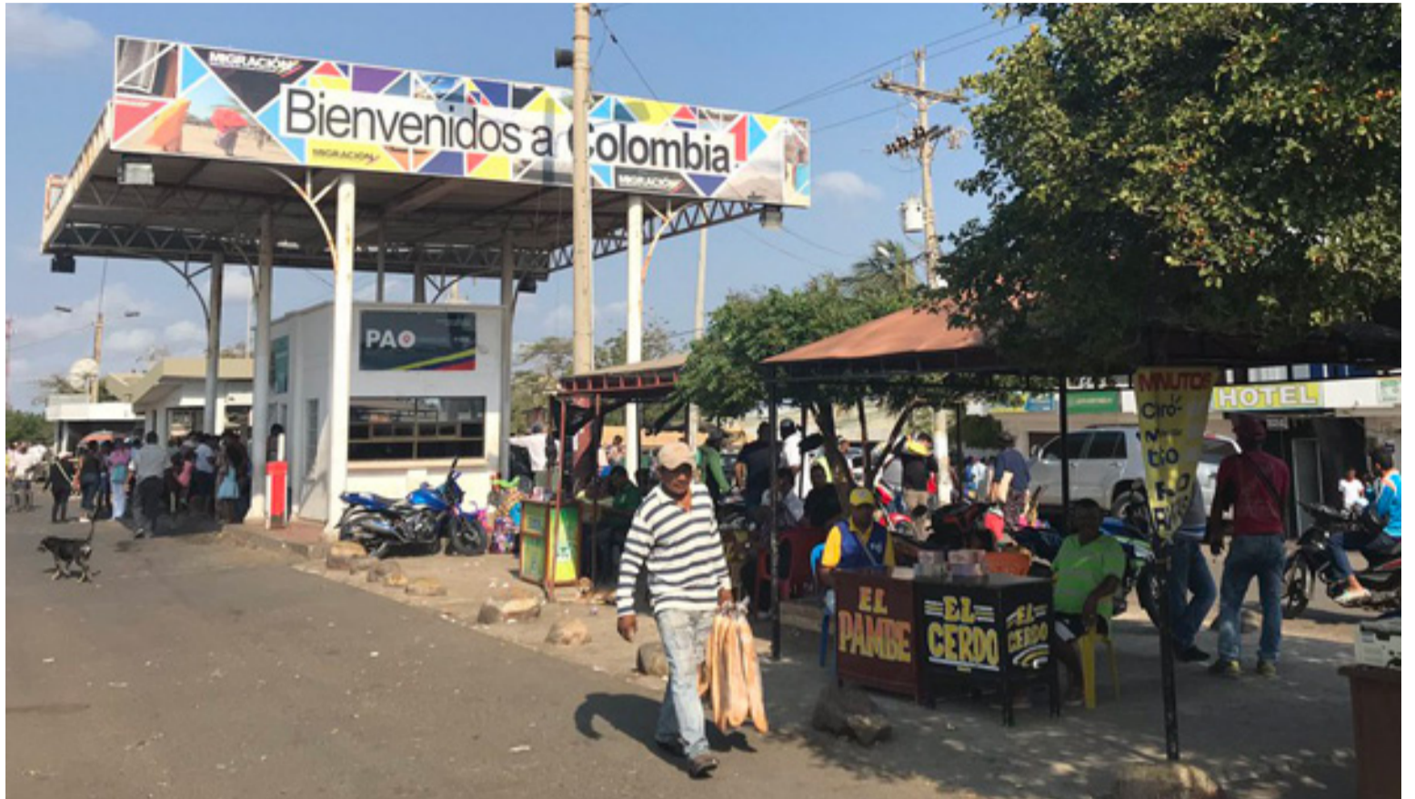
Más de 2 millones 189 mil venezolanos han iniciado su proceso para acogerse al Estatuto Temporal de Protección.

El Estatuto Temporal de Protección – Visibles le permite al ciudadano venezolano, no solo permanecer en Colombia hasta por 10 años, sino vincularse a la vida productiva del país.