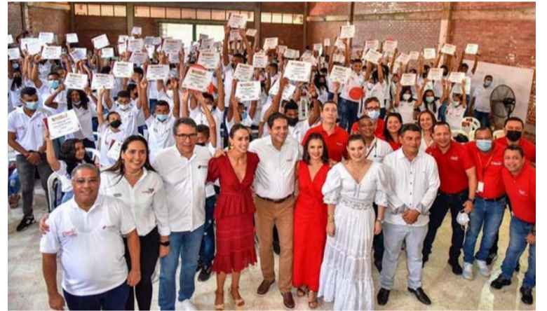
El programa de Formación Básica Musical en Conjunto Típico Vallenato y Piquería, tiene ocho años relizándose.