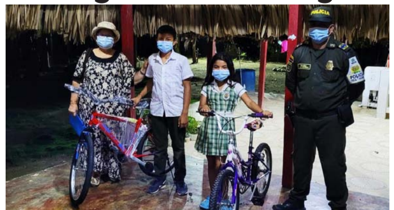
La Policía hizo entrega de dos bicicletas a niños para desplazarse a la escuela, ya que recorrer cinco kilómetros.

académica de los niños y a su vez, aportar a la solución de conflictos locales contribuyendo así, desde la cotidianidad, a la construcción de la paz con legalidad en los territorios”, dijo la Polfa. Asimismo los estudiantes, emocionados por esta nueva herramienta de transporte, se mostraron agradecidos debido a que para muchos de ellos se convierte en un motor que alimenta su sueño de ser profesionales y tener un mejor futuro.