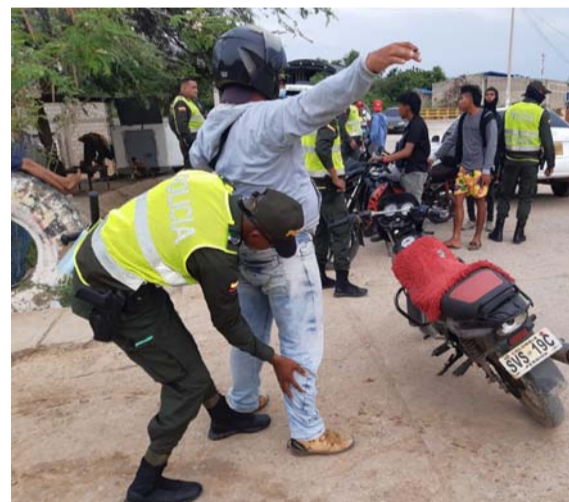
La Policía consultó antecedentes de 200 personas, e igual número de motos y carros