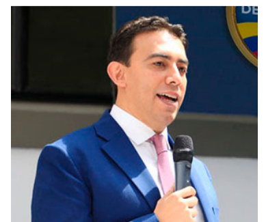
Alexander Vega seguirá como registrador Nacional.

Se trata de directrices ya incluidas en el plan de acción presentado y aprobado por las agrupaciones políticas participantes y en garantías para las elecciones.