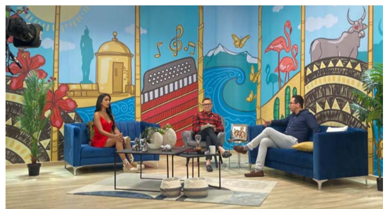
Los programas de Telecaribe enseñan la idiosincrasia de nuestro ser como cultura de la costa norte colombiana.