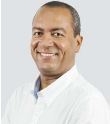
Marlon Amaya, alcalde del municipio de Dibulla.

general y recomienda a los interesados, permanecer atentos a las redes sociales de la Alcaldía, para informarse adecuada y oportunamente de todo el proceso.