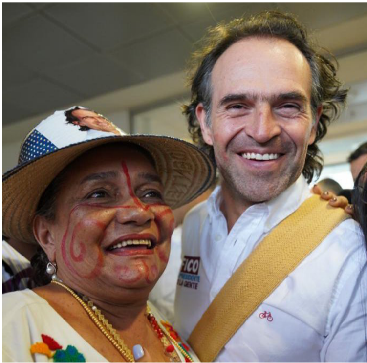
Federico Gutiérrez, prometió que si gana la Presidencia, ampliará la cobertura de educación en La Guajira.

apoyará a la universidad pública, razón por la cual plantea aumentar las coberturas para los jóvenes.