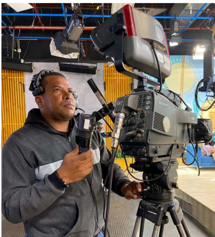
Resultados demuestran que en la región Caribe cuidamos, valoramos y nos sentimos orgullosos de lo nuestro.