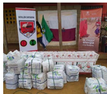
Libros donados a las comunidades indígenas.