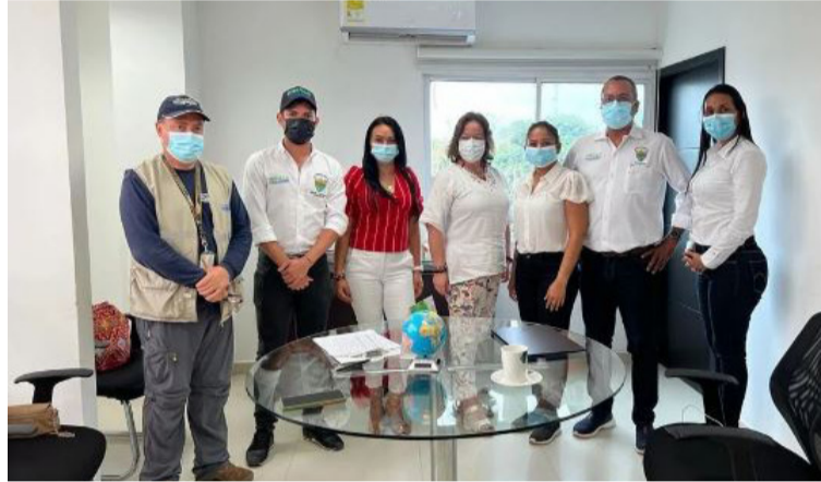
En los próximos días la ESE y la Secretaría de Salud abrirán las inscripciones, donde se recibirán las solicitudes.