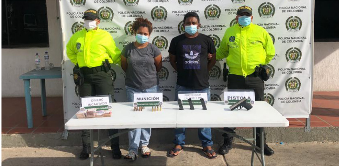
A estas dos personas les hallaron 30 millones de pesos en efectivo y un vehículo.

A estas personas las autoridades les incautaron los siguientes elementos: una tipo pistola calibre 9mm, 3 proveedores para pistola