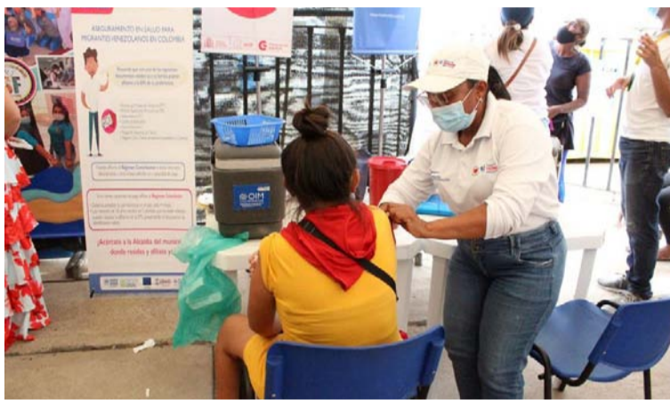
La actividad se realizó en el centro transitorio de solidaridad ubicado en cercanías al asentamiento de 'La Pista'.