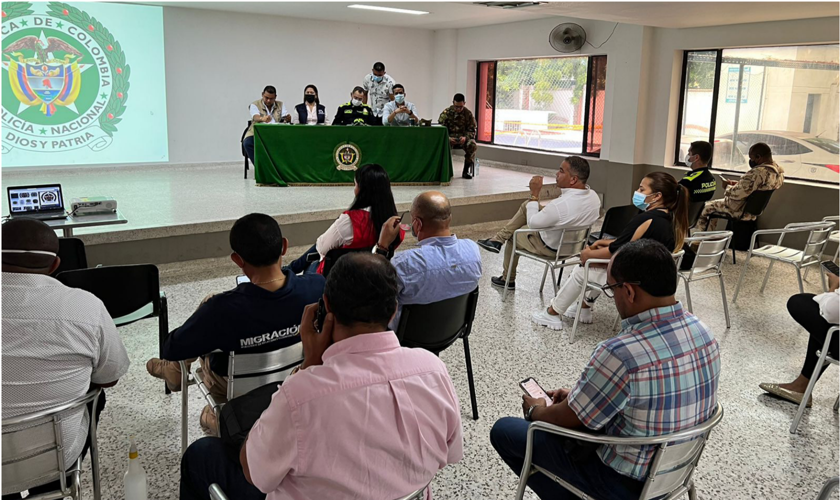
1.400 hombres del Ejército y 1.300 de la Policía Nacional serán los encargados de salvaguardar la seguridad de los ciudadanos.

Ejército y Policía custodiarán cada sitio de votación