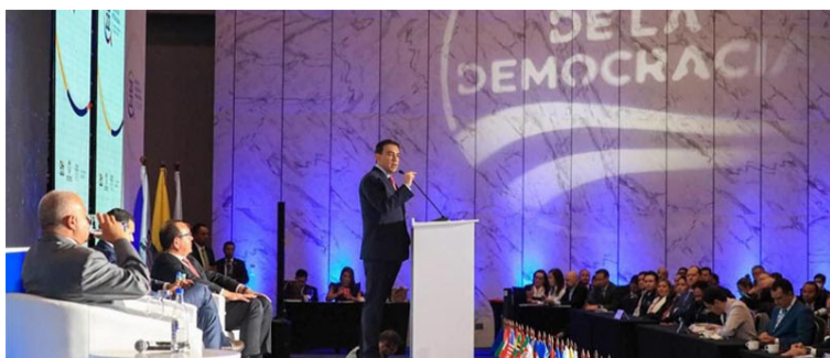
El registrador Alexander Vega dijo que cualquier inconsistencia en votaciones es detectable en el escrutinio.

la Registraduría realizó una prueba de funcionalidad en consulados los días 5 y 6 de mayo de 2022, un simulacro de preconteo de votos el 14 de mayo, un simulacro de digitalización del formulario E-14 el 18 de mayo y un simulacro de escrutinios los días 20 y 21 de mayo. Dichos simulacros contaron con el acompañamiento de las misiones de observación electoral internacional, antes de control y auditores de partidos y campañas políticas.