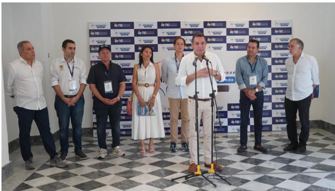
El gobernador Nemesio Roys resaltó el hecho de que La Guajira sea sede de la cumbre.

“Sesionar por primera vez en La Guajira significa no solo el apoyo de los gobernadores a este Departamento, sino un recordatorio