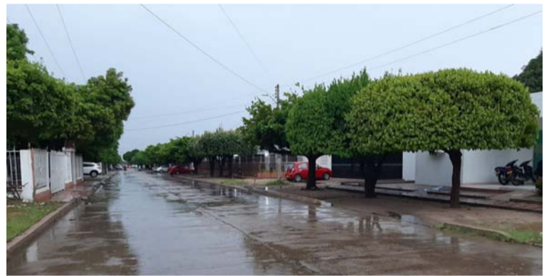
Ráfagas de viento y tormentas eléctricas se presentaron la tarde del día de ayer en el municipio de Fonseca.

ron que atendieron varios llamados y realizaron evaluaciones de los daños cau-