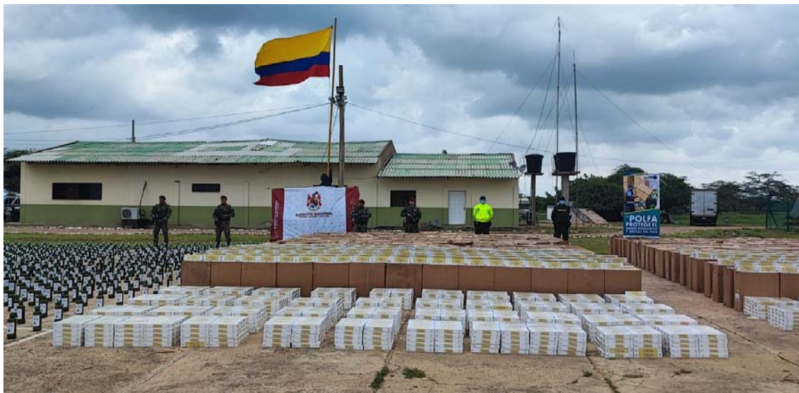
La incautación se registró en un inmueble en Maicao que estaba siendo utilizado para el almacenamiento de mercancía de contrabando.