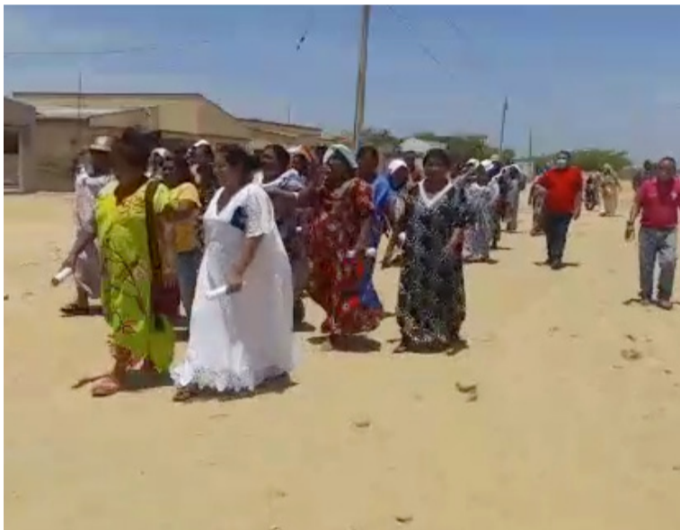
En su segundo día de protestas, los líderes exigieron al alcalde Bonifacio Henríquez una solución inmediata.