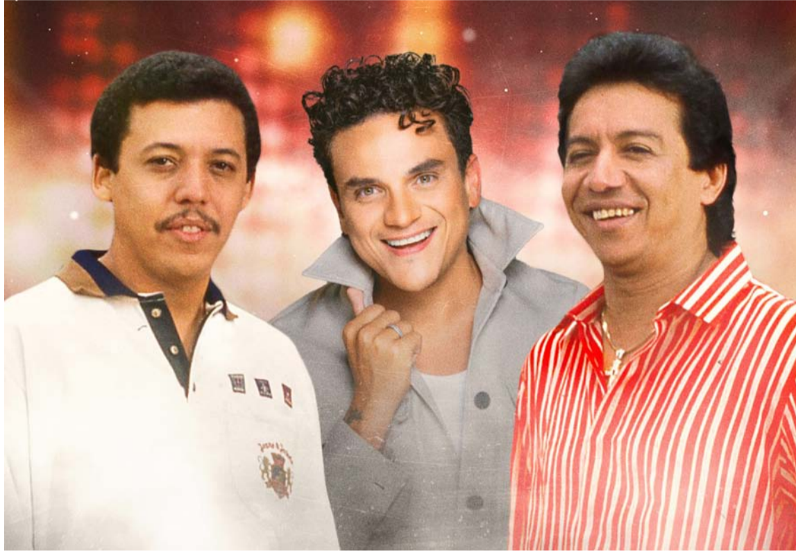
'Juancho' Rois, Silvestre Dangond y Diomedes Díaz, unidos en 'Un motivo especial'.