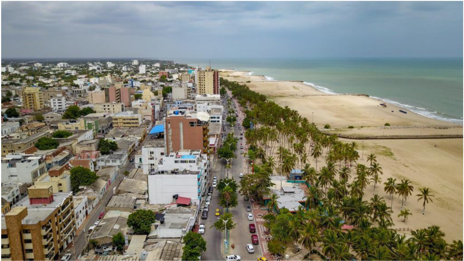
Para construir una Guajira fortalecida es importante que las entidades continúen avanzando en la gestión institucional.

Medición anual que realiza el Departamento Administrativo de la Función Pública