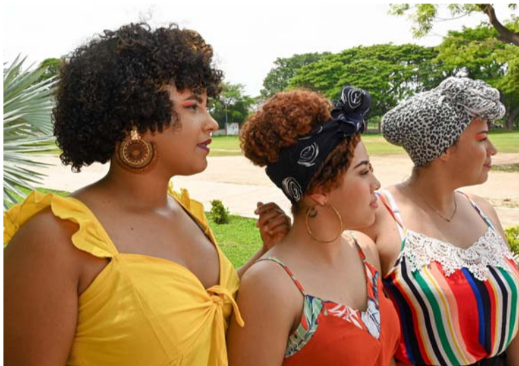
El objetivo principal del encuentro fue promover la recuperación de la memoria histórica de esta población.

poraciones negras, raizales y palenqueras.