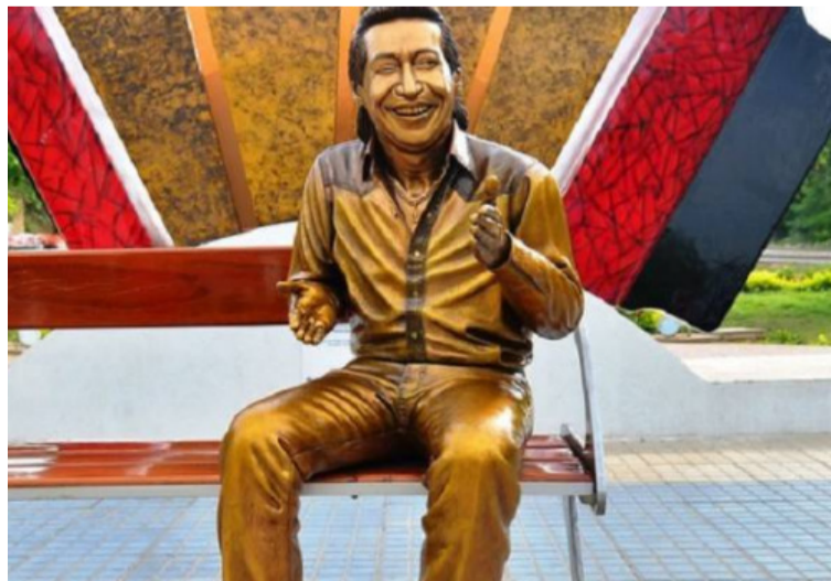
La escultura de Diomedes Díaz fue reparada por su autor Jhon Peñaloza y puesta en la glorieta Los Juglares.

Las autoridades pidieron mayor cultura ciudadana para preservar estas esculturas que son el atractivo turístico en el parque La Provincia a orillas del río Guatapurí.