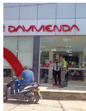
Policía busca generar conciencia en los ciudadanos.

“Se dio a conocer el número del comunitario de la estación las 24 horas para informar cualquier requerimiento o asesoría policial”, reveló la fuente de la institución policiva.