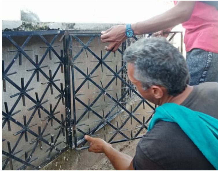
Este operario coloca nuevamente las rejas que habían sido hurtadas del cementerio José María de Alfara.

Los jóvenes posiblemente se hurtaron varias rejas de hierro y unas lápidas de