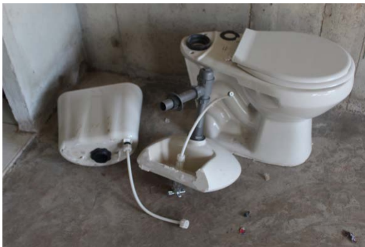
Aún sin haber recibido sus casas, los beneficiarios denunciaron el robo de los elementos al interior de las mismas.

momento no se podía hacer nada, pero sí se va hacer responsable de los elementos faltantes de cada vivienda afectada”, agregó Alarza.