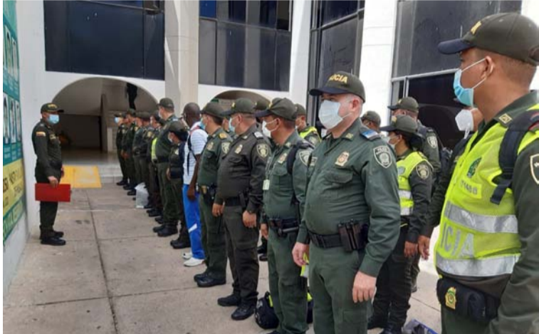
En seguridad, todo está coordinado para la Cumbre de Gobernadores. La Policía dispuso de más de 380 hombres.

“Todo dispuesto desde cielo, tierra y mar para garantizar la seguridad de la cumbre de gobernadores en La Guajira. Estamos comprometidos 24 horas al día y 7 días a la semana”, reveló Aguilar Deluque.