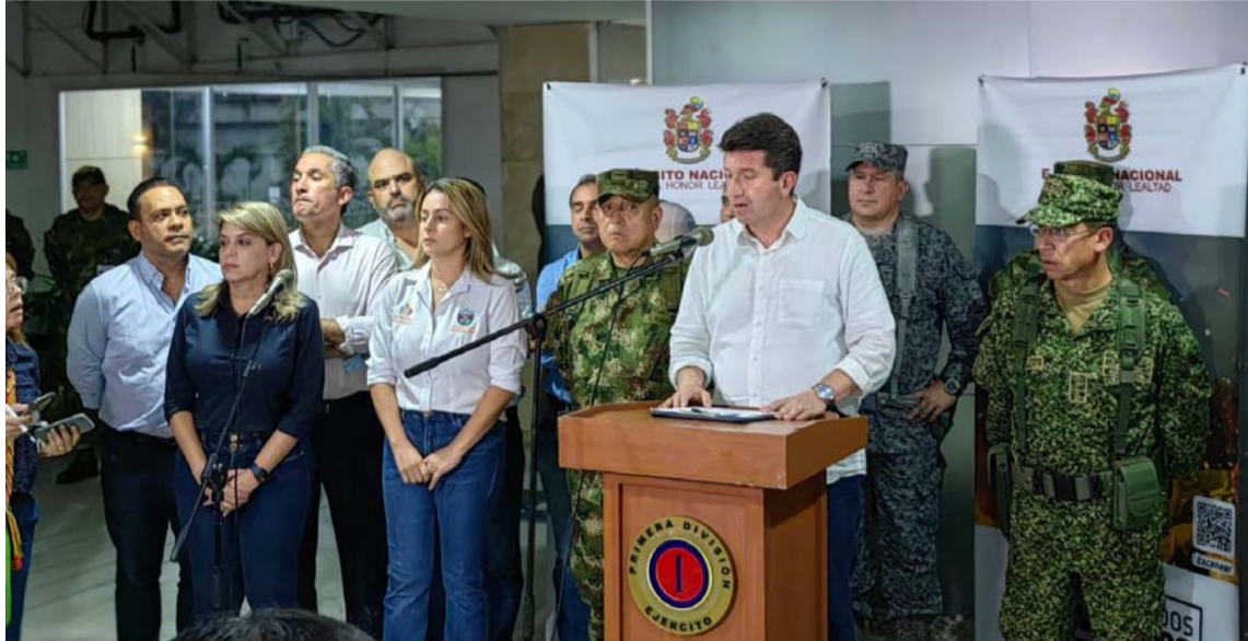
Con incremento de la fuerza se intensificarán las acciones, dijo el ministro Molano.

Sostuvo el ministro que con el incremento del pie de fuerza con 332 hombres del Ejército Nacional, en el marco del Plan Cóndor y el Bloque de Búsqueda, se incrementan las acciones ofensivas y una burbuja de inteligencia especial para desarticular, no solo los reductos del Clan del Golfo, sino el grupo criminal de