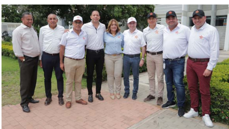
El proyecto, que contó con una inversión de $864 millones hace parte de una gran estrategia de ejecución de obras.