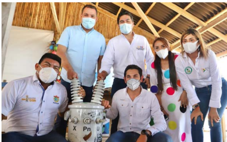
Su gobierno ha logrado que más de 1.300 familias de 53 comunidades de la Alta Guajira tengan servicio de energía.

ta de cobertura en materia de servicios públicos, de salud y de educación, constituyen la consecuencia lógica de unas políticas encaminadas a fortalecer grupos y a debilitar adversarios, sin que se piense, como en cualquier democracia civilizada, en la generación del desarrollo y la productividad que debería beneficiarnos a todos. Un panorama que no cambiará en la medida que quienes tenemos el poder para lograrlo, sigamos haciendo lo mismo, o peor aún, no hagamos nada para