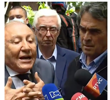
Hernández y Fajardo se reunieron ayer en Bogotá.

Corre el rumor según el cual, en caso de que Hernández llegue a la Casa de Nariño, Fajardo sería su ministro de Educación.