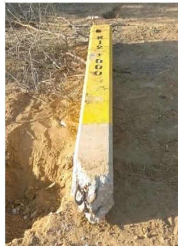
La torre fue socavada en su base por los vándalos.

Por esas personas que utilizan la misma herramientas y estilo de hacer sus acciones y quieren generar pánico a la comunidad manaurera, quienes están detrás de esa situación, se hace el llamado a las autoridades competen-