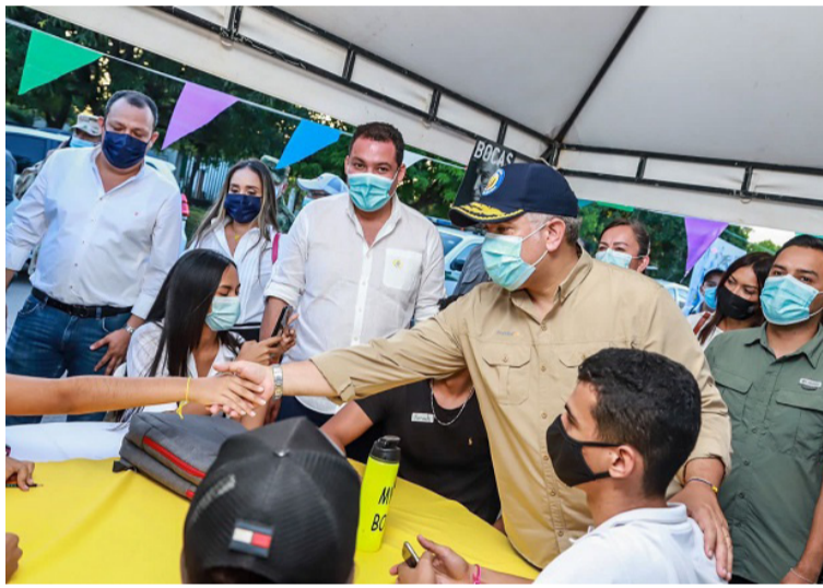
El gobernador Nemesio Roys Garzón expresó que todo se encuentra listo para la realización de la cumbre.

El presidente, Iván Duque, se reunirá con los gobernadores en horas de la