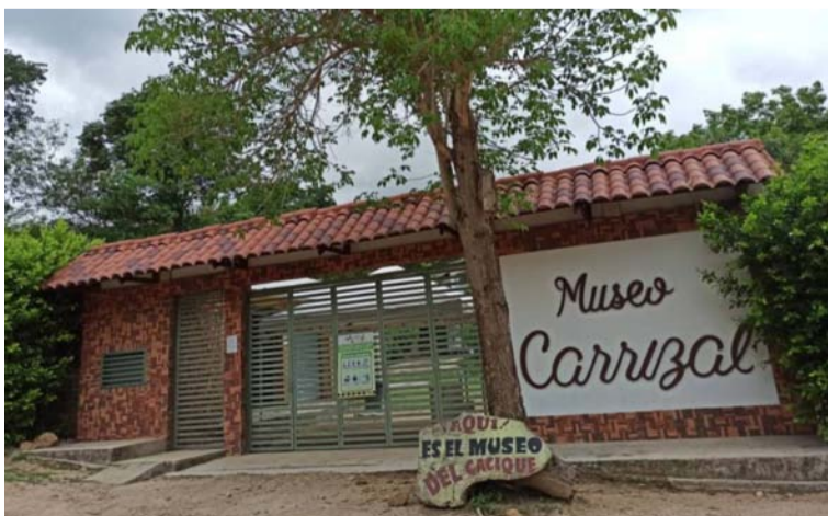
La convocatoria la lideró la Dirección de Turismo del departamento de La Guajira, direccionado por Fontur.

El corregimiento de La Peña, se consolida como un atractivo turístico de La Guajira, luego de un trabajo concertado entre Fontur, la Alcaldía del municipio de San Juan del Cesar y la Dirección de Turismo de La Guajira.