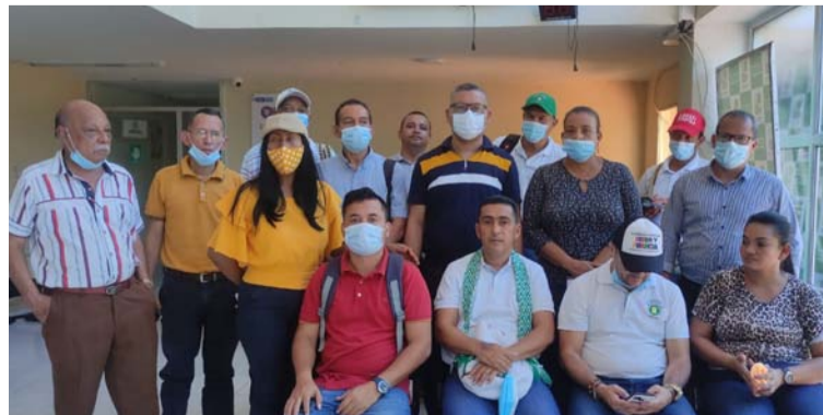
Grupo de maestros de La Guajira que se tomaron las instalaciones de la Secretaría de Educación departamental.

Dichos traslados se esperan desde el pasado mes de enero, luego del debido diligenciamiento de la solicitud de traslados y la aprobación de comité conformado para tal fin, fueron aprobadas 26 de las 37 solicitudes, 18 de ellas internas, es decir, estos traslados serían dentro de los 12 municipios a cargo del Departamento, como ente certificado en educación