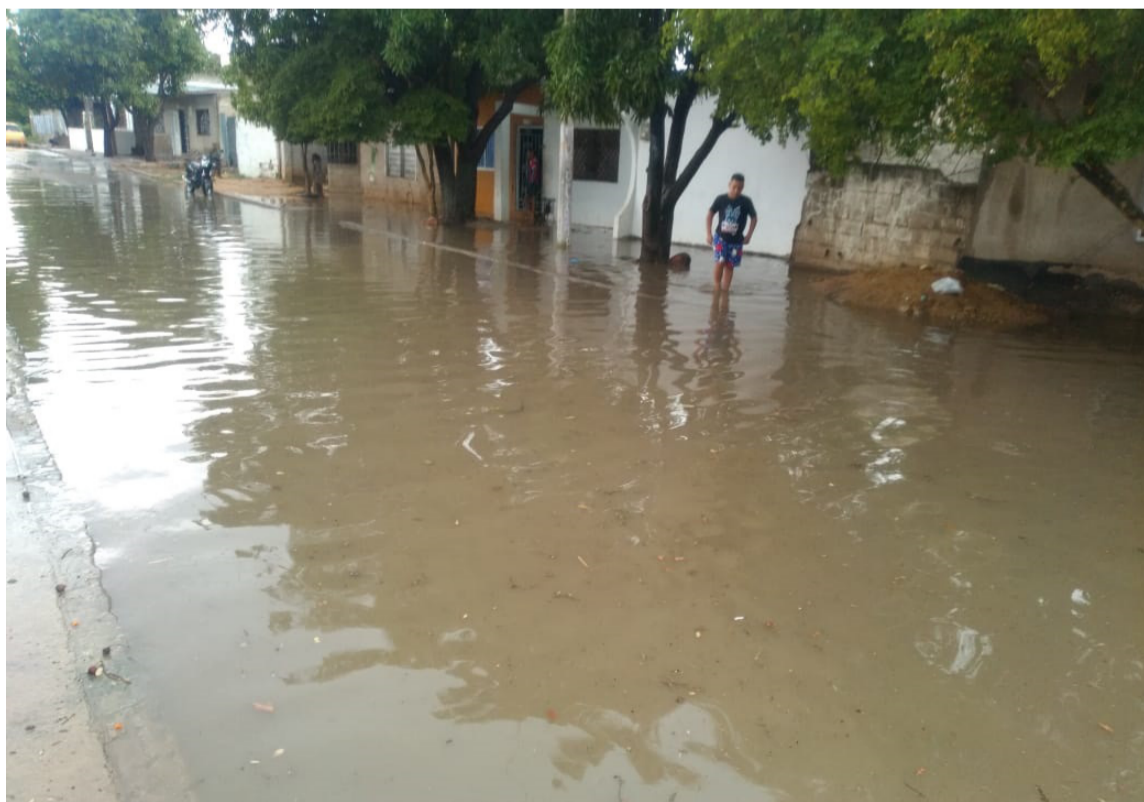
El 'Fenómeno de La Niña' sigue y se prevé que se extienda en el segundo semestre.

Análisis propios del Instituto de Hidrología, Meteorología y Estudios Ambientales -Ideam- y de los centros internacionales de predicción climática, indican que