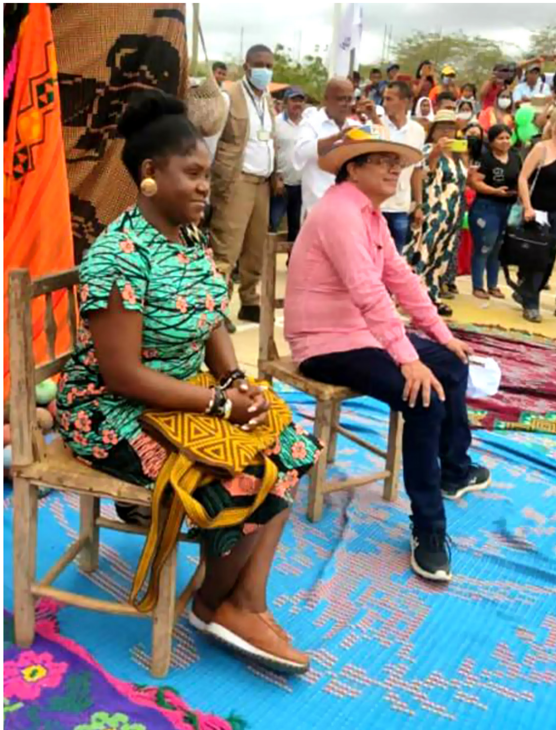
Francia Márquez y Gustavo Petro, aspirantes a la vicepresidencia y presidencia del país.

Francia, hoy le has demostrado una vez más a toda Colombia y a la humanidad, que la mujer es