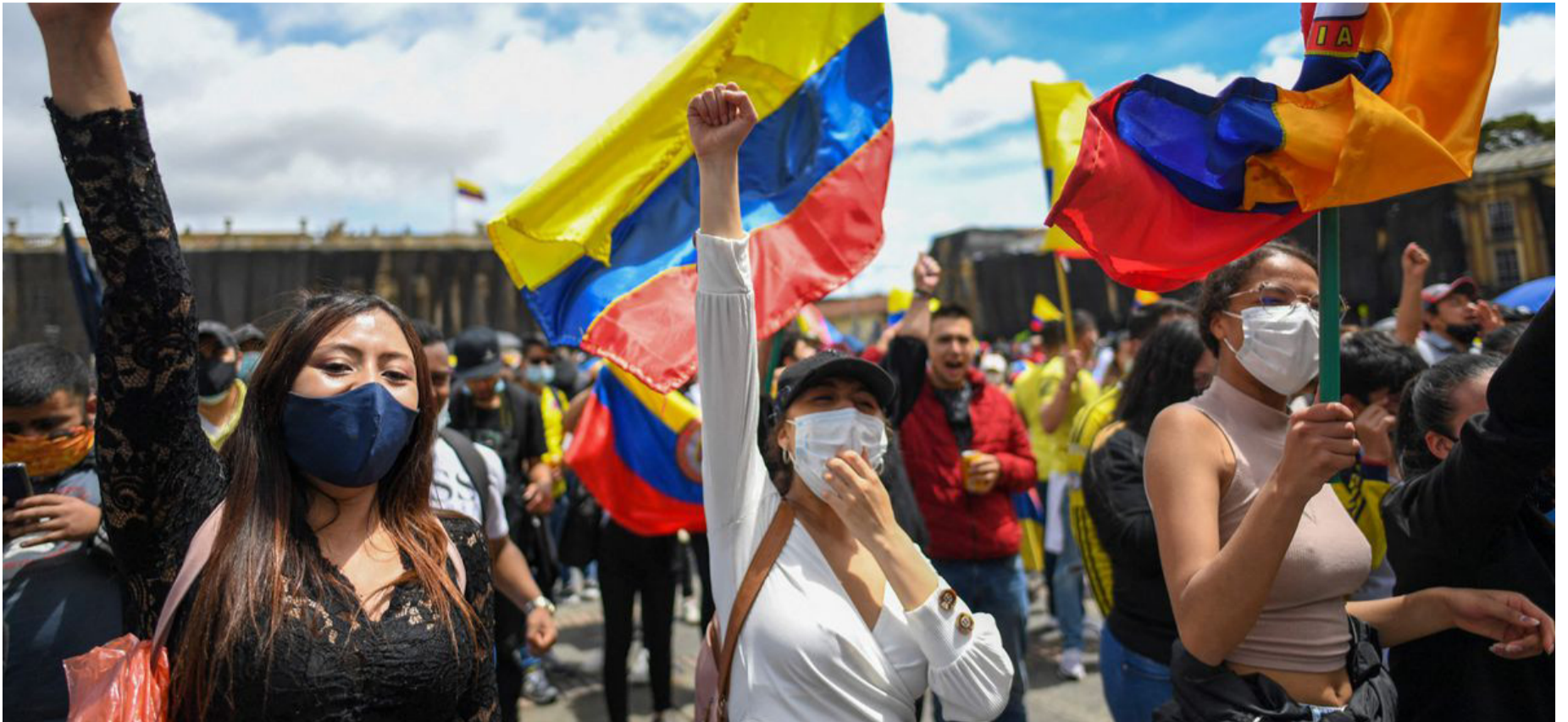
Los colombianos quieren asomarse a la ventana del mundo. Atrás quieren dejar la era del subdesarrollo y navegar por la autopista de la cibernética.