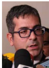
Marcelo Pecci, prestigioso abogado asesinado en Barú.

Con los dólares también habrían pagado dos días de alojamiento en el hotel Decameron de Barú,