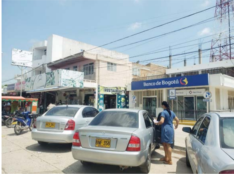
El comercio y los ciudadanos son los más afectados; las autoridades se muestran indiferente ante los hechos.

Por lo anterior, elevaron una solicitud al Ministerio de Defensa, gobernador de La Guajira, Nemesio Roys