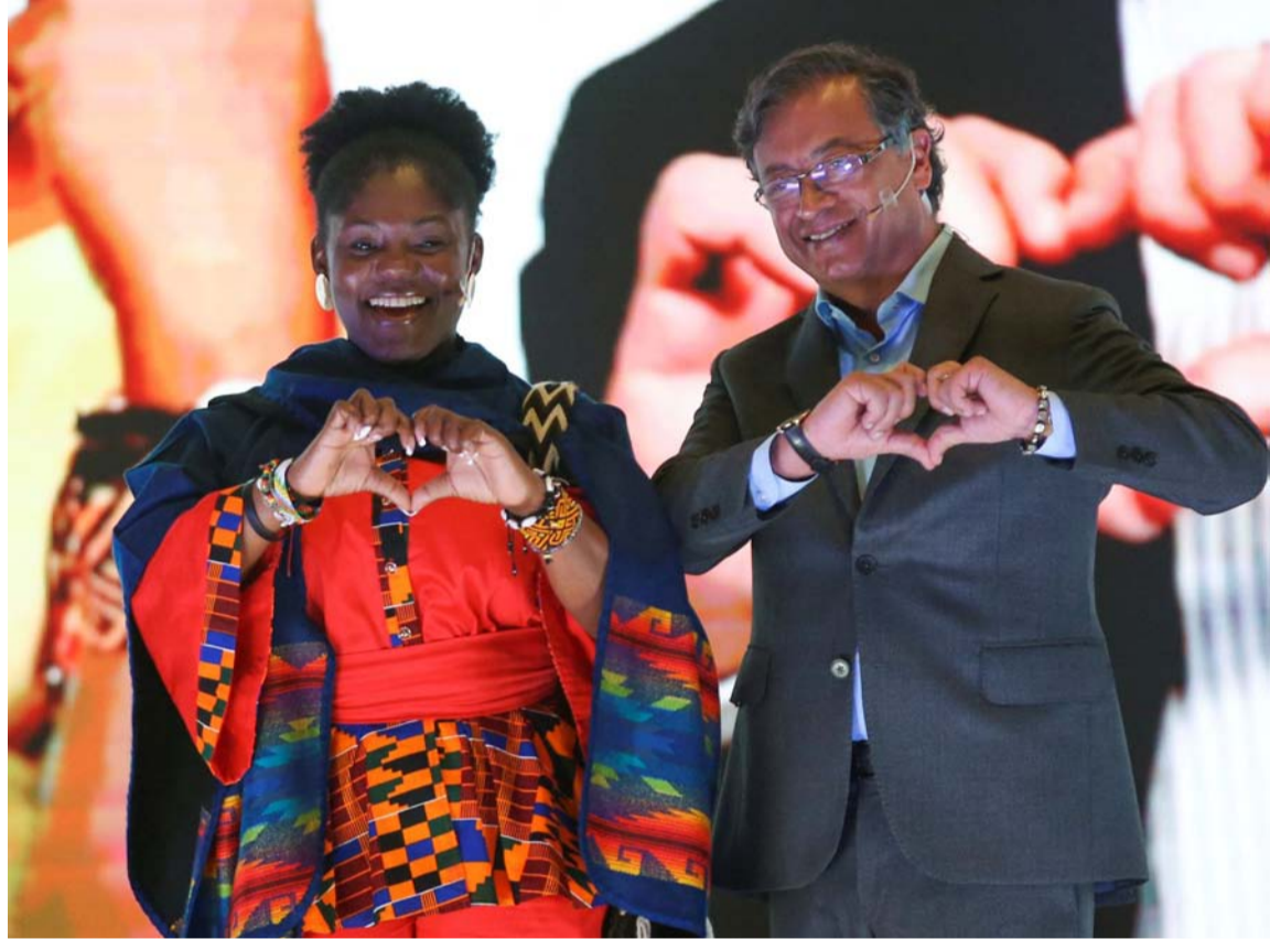
Gustavo Petro Urrego y Francia Márquez son los candidatos del Pacto Histórico.

La guerra económica Rusia - Ucrania encarecerá el petróleo con cambios en los ciclos económicos. El momento es similar al año 1973 con costos energéticos elevados y problemas