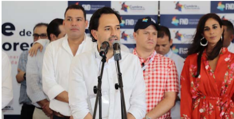
Diego Mesa, ministro de Minas y Energía, advirtió que desde el gobierno nacional hay seguimiento a tarifas.

Indicó, que cuando se concretó la operación de parte de las nuevas empresas, des-