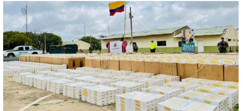
El material incautado quedó a disposición de la Policía Fiscal y Aduanera, el decomiso se hizo en la Alta Guajira.

avaluado en cerca de 420 millones y comercialmente en 900 millones de pesos, fue puesto a disposición de la Policía Fiscal y Aduanera Polfa.