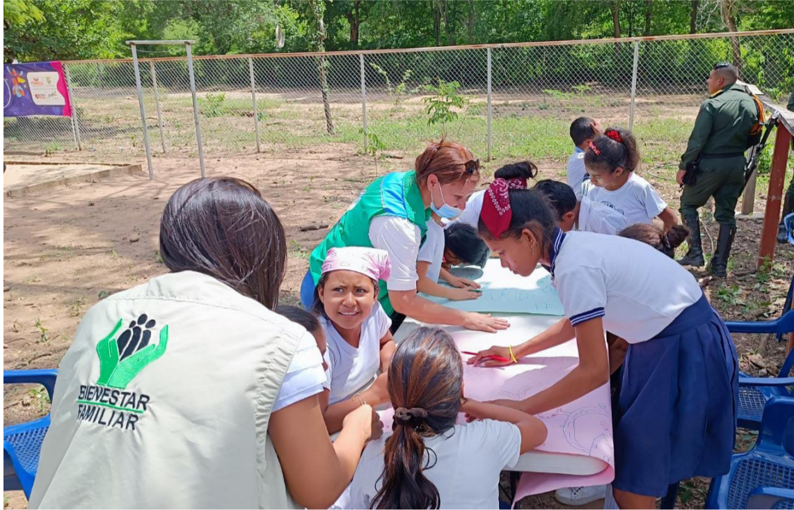
En esta actividad se vacunaron 78 menores y se realizaron actividades recreativas.

También, de qué manera estos pueden ser parte activa del proceso de mejoramiento de la política pública que busca garantizar sus derechos y libre desarrollo de la personalidad. Adicionalmente, en la jornada se realizaron activi-