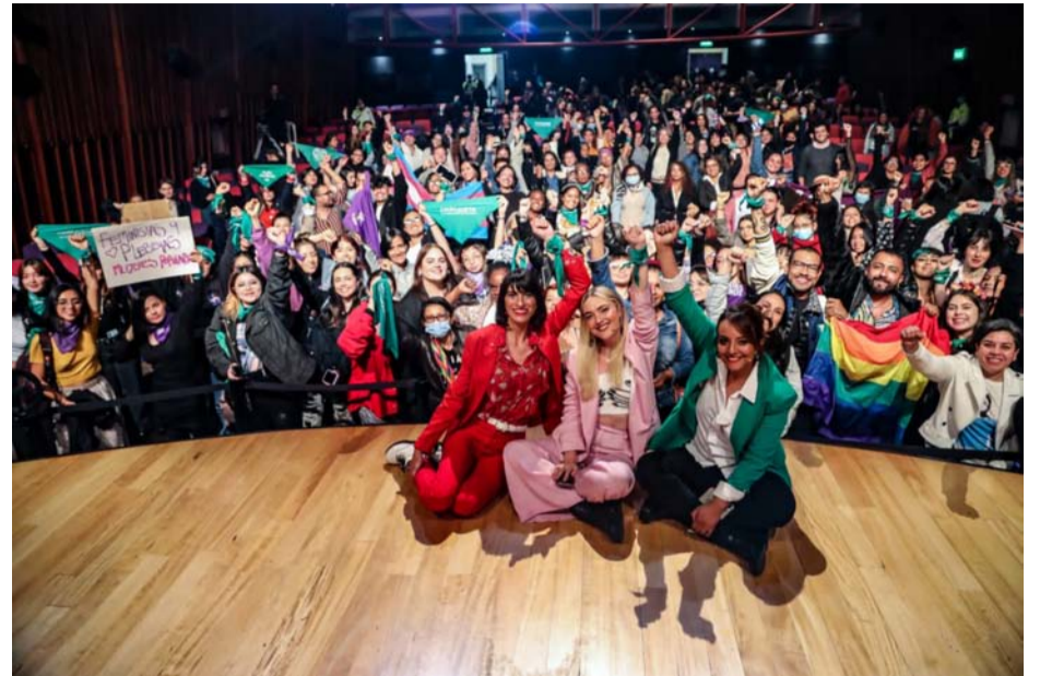
Gustavo Petro Urrego, candidato a la presidencia por la coalición Pacto Histórico, presentó sus propuestas y se mostró muy receptivo.

Evas & Adanes y La Guajira estuvieron presentes