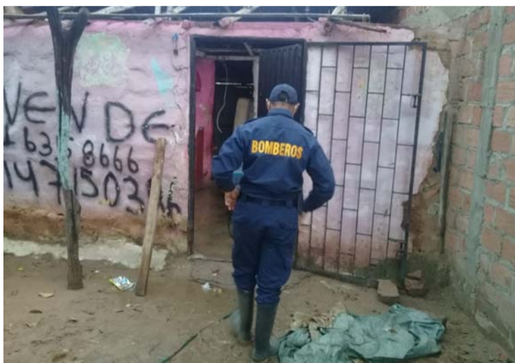
El Cuerpo de Bomberos atendió la emergencia ocurrida en el barrio Nueva Esperanza, hubo tres damnificados.

No obstante, el organismo de socorro precisó que solo hubo daños materiales.