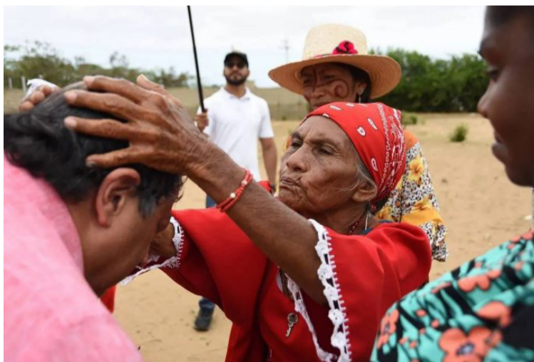
Las minorías étnicas de Colombia en gran mayoría se identifican con el discurso del candidato Gustavo Petro.

Ustedes dos nos representan, representan al pueblo luchador, a los que somos mayoría, representan