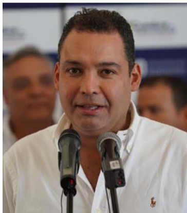
Nemesio Roys, gobernador anfitrión de la cumbre.

"Esta es la primera cumbre en la historia de La Guajira. Hoy le estamos mostrando una nueva cara al país y agradezco a la Federación Nacional de Departamentos por ser un aliado incondicional. El diálogo que entablaremos en la Cumbre de Gobernadores es una oportunidad para La Guajira y las demás regiones del país para el fortalecimiento de temas estratégicos enfocados en el desarrollo", manifestó el Gobernador de La Guajira, Nemesio Roys.