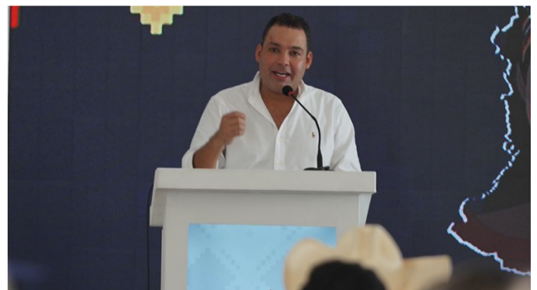
El gobernador de La Guajira, Nemesio Roys Garzón, dijo que hay que respetar la institucionalidad del país.

los colombianos, como él va a respetar a todos los gobernadores que fueron elegidos popularmente”, dijo.