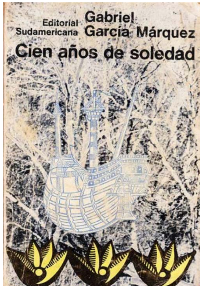
‘Cien años de soledad’, la obra magna de la literatura colombiana, ha tenido varias ediciones en 55 años.

gresar a Ciudad de México para llevar a cabo su obra maestra, la cual terminó de escribir en 1966.