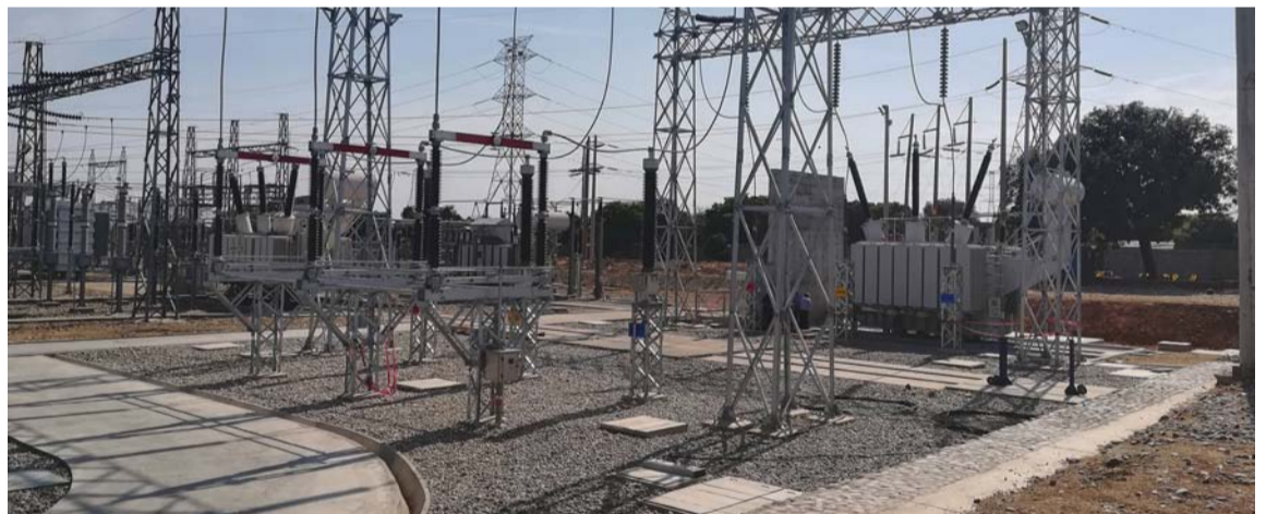
El mantenimiento se realizará en la Bahía de la Línea Valledupar a El Copey.

“Con la ejecución de estos trabajos reiteramos nuestro compromiso con la prestación del servicio de transmisión y conexión de energía eléctrica en la Región Caribe colombiana”.