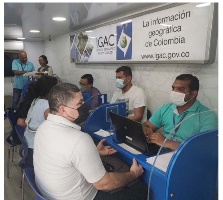
En la semana anterior la jornada se realizó en Villanueva, donde se atendieron más de 100 trámites catastrales.