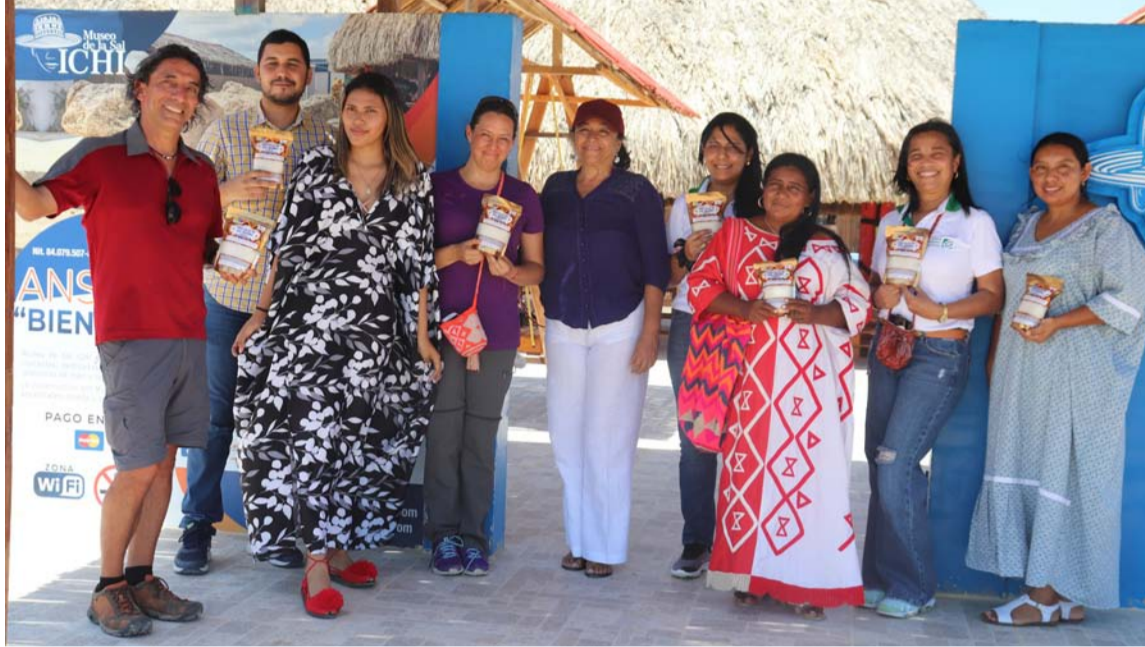
La jornada incluyó en Manaure un recorrido por las salinas, restaurante y rancherías.

El propósito es apoyar una cadena de valor sostenible para proporcionar oportunidades de empleo e ingresos a partir de un acompañamiento a mínimo