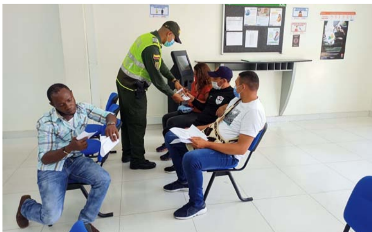
Las autoridades de Policía informaron que adelantaron estas acciones por medio de charlas pedagógicas.

Cabe mencionar que con esta jornada se logró sensibilizar alrededor de 100 personas.