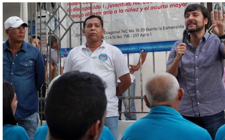
Jaime Pumarejo recibirá a los demás alcaldes de las capitales de la región Caribe, este jueves en Barranquilla.

Los mandatarios de las capitales de la región Caribe se reunirán con el alcalde Pumarejo en la Alcaldía de Barranquilla este jueves en horas de la mañana.