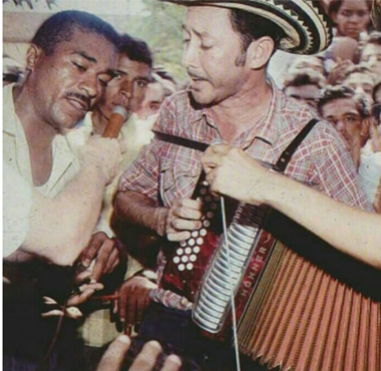
Alberto Pacheco tendría igualmente su figura de cera en el Hall de la Fama del Vallenato en Valledupar.