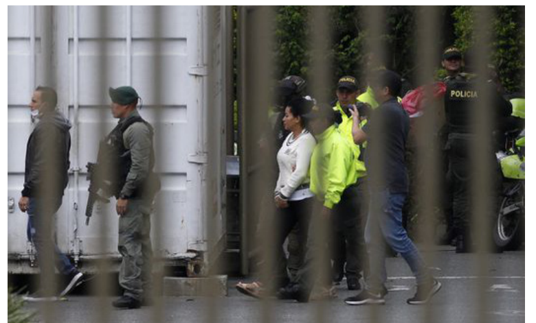
Tras ser capturados en Medellín, los implicados en el crimen del fiscal paraguayo fueron llevados a Cartagena.