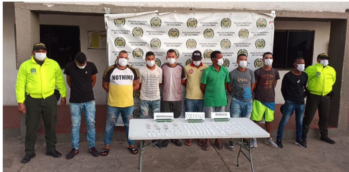
Los nueve miembros de ‘Los del Mercadito’ se dedicaban al tráfico de estupefacientes.

En la operación las autoridades lograron la in-