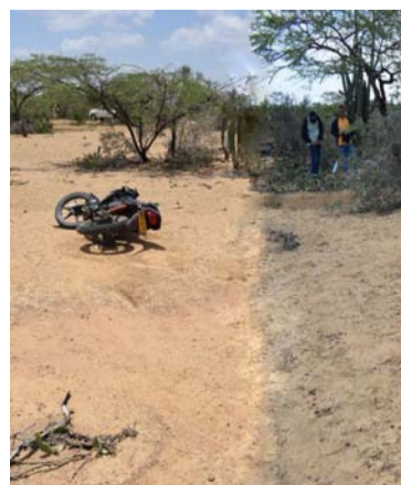
En este lugar se produjo el intercambio de disparos.