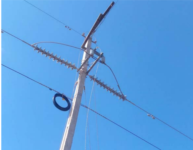
La empresa pidió a la comunidad denunciar acciones vandálicas que ponen en riesgo prestación del servicio.

La empresa pidió a la comunidad denunciar estas acciones vandálicas que ponen en riesgo la presta-