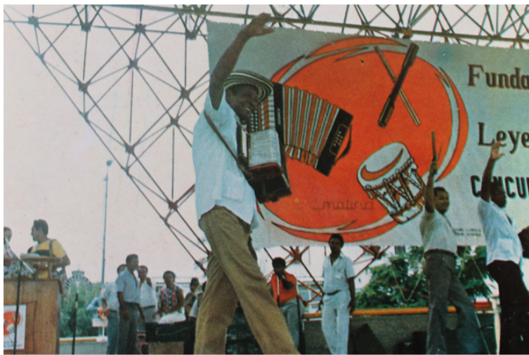
Con la venta de boletería del Museo de Cera del Vallenato se espera recaudar importantes recursos económicos.