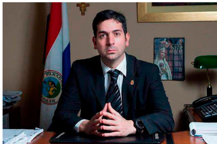
Marcelo Pecci, fiscal paraguayo asesinado en Barú.

Los capturados fueron presentados ante el juez 12 Penal Municipal con funciones de control de garantías de Cartagena.