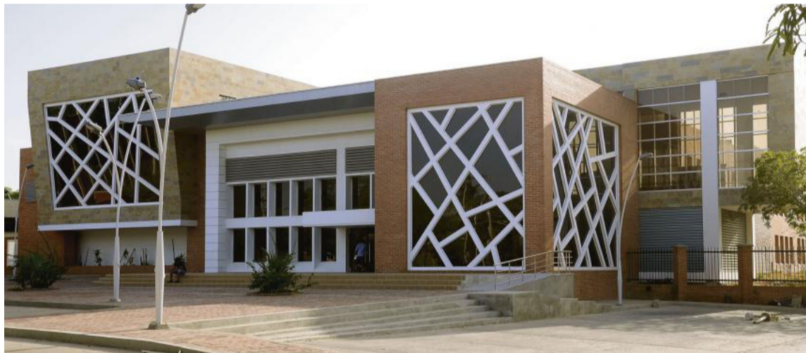
El taller se realizará el día 16 de junio en la Biblioteca Virtual Héctor Salah Zuleta.

El taller de habilidades en gestión empresarial se realizará el día 16 de junio en la Biblioteca Virtual Héctor Salah Zuleta, en Riohacha, de 8:00 a.m. a 5:00 p.m. Los interesados en participar deben realizar su inscripción previa.