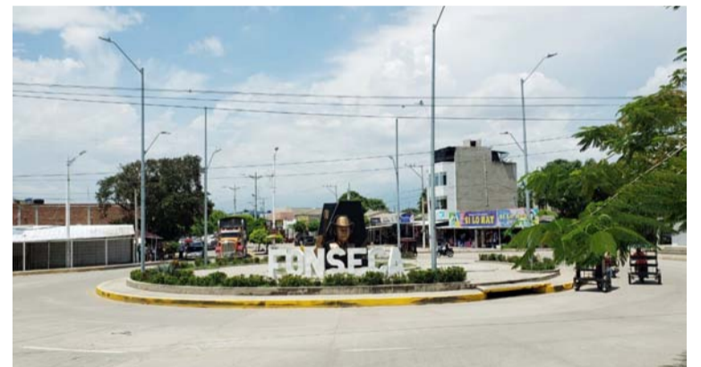
El mayor número de personas asesinadas ocurrió en abril. Durante este mes le quitaron la vida a 4 personas.

Sensibilizaron alrededor de 100 personas