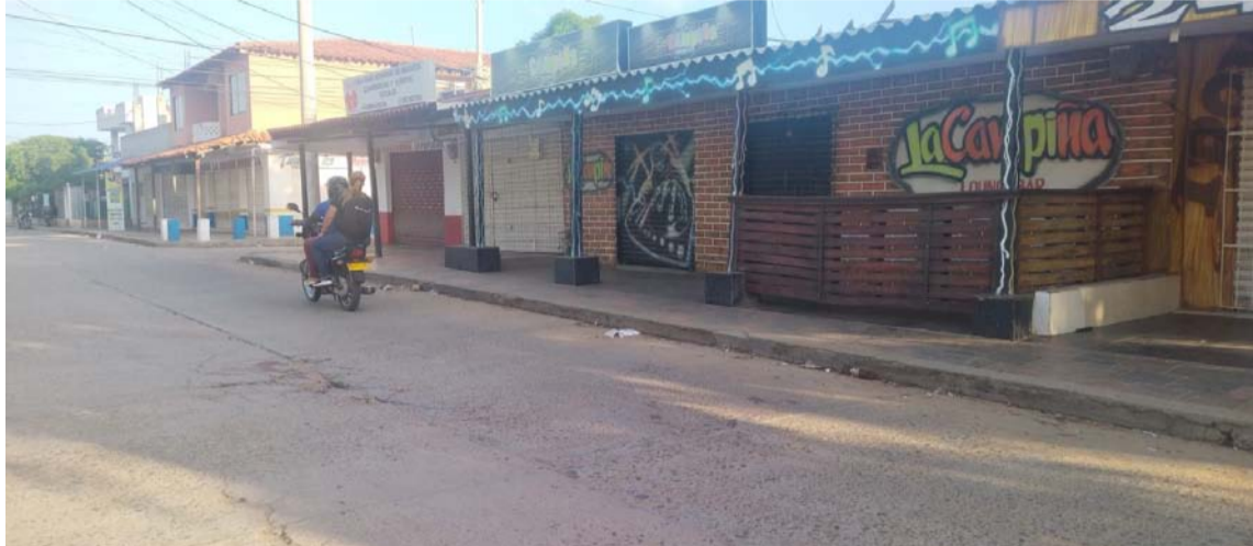
El procedimiento policial ocurrió en la discoteca La Campiña de la ciudad de Riohacha.