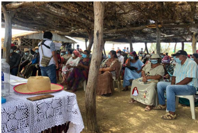
Se debe reconocer que las comunidades tienen el derecho de que se respeten sus formas de vida social.

y niñas wayuú y quienes integran esta cultura (son) seres humanos, sujetos de derechos y (tienen) garantías constitucionales en la república de Colombia”.