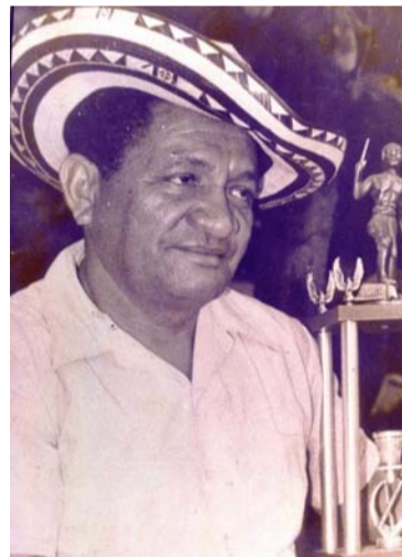
Luis Enrique Martínez tendrá igual su figura de cera.

par entrará al selecto grupo de ciudades destacadas por tener museos de cera, como Londres, Madrid, Nueva