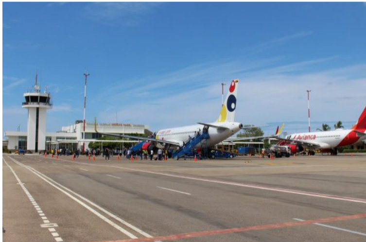
Riohacha es un destino que ha crecido en cuanto al movimiento de pasajeros en relación con el año 2019.

Igualmente, para el caso únicamente de abril 2022, se han movilizad 2,6 millones de pasajeros en vuelos nacionales, es decir, un crecimiento del 30%, con rela-