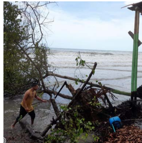
La erosión se registra en la margen derecha del río Palomino, en la desembocadura del mismo y en la costa.

Las autoridades de Dibulla se trasladaron hasta el corregimiento de Palomino para hacer un recorrido por la zona costera y el río, en aras de trazar estrategias que permita mitigar la problemática de la erosión en