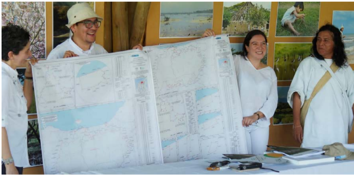
Esta cuarta ampliación del resguardo es importante por la inclusión del sitio sagrado.

Tierras es importante por la inclusión del sitio sagrado, “y responde al compromiso institucional con el reconocimiento territorial de los pueblos étnicos de Colombia, su protección constitucional y la preservación de los valores culturales de los pueblos con su entorno”.