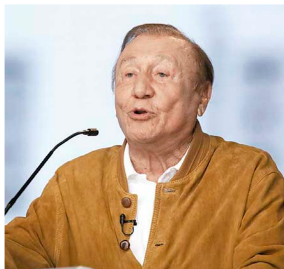
Rodolfo Hernández, candidato presidencial.