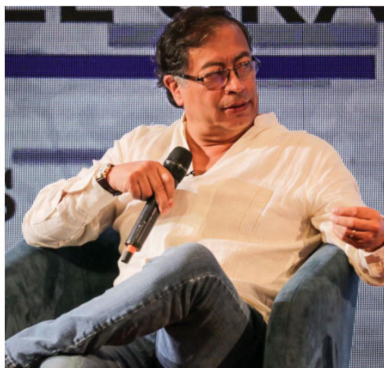
Gustavo Petro, candidato a Presidencia.

Todo cambio genera inquietud. Ese estado de ánimo nos preocupa porque nadie sabe cómo será nuestro país después de estas elecciones. Se trata de un salto, pero esperamos que no sea al vacío y que al final acertemos al depositar nuestro voto por el candidato de nuestra preferencia.