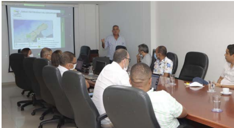
Se analizaron estrategias para fortalecer el ejercicio de la autoridad ambiental en articulación con el Congreso.

Las transferencias del sector eléctrico, el fortalecimiento del Sistema Nacional Ambiental –Sina–, la sobretasa ambiental, cargas contaminantes de las fuentes hídricas, visibilizar las áreas protegidas y las compensaciones por el transporte de gas, fueron algunos de los temas abordados durante la sesión, la cual también contó con la participación de un