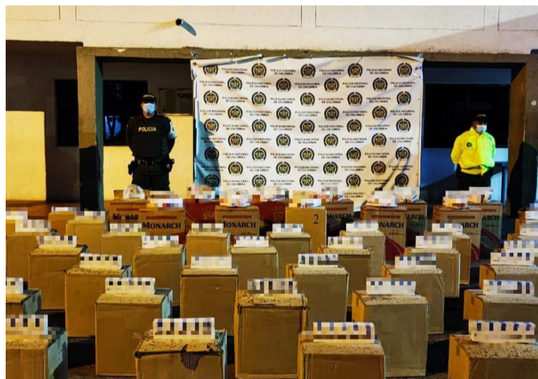
Estas son las cajas con cigarrillos que fueron incautados por la Policía Fiscal y Aduanera en el municipio de Maicao.