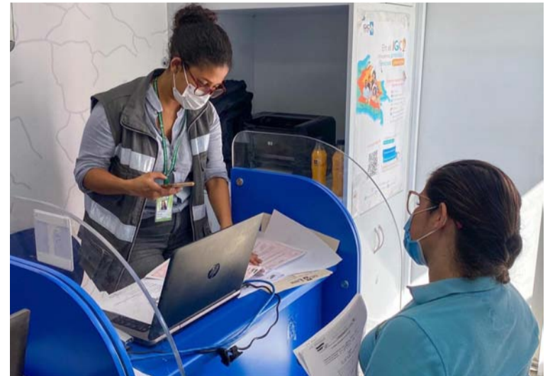
La móvil del Igac estuvo dos días en la plaza principal de Albania con la disposición de atender a los habitantes.