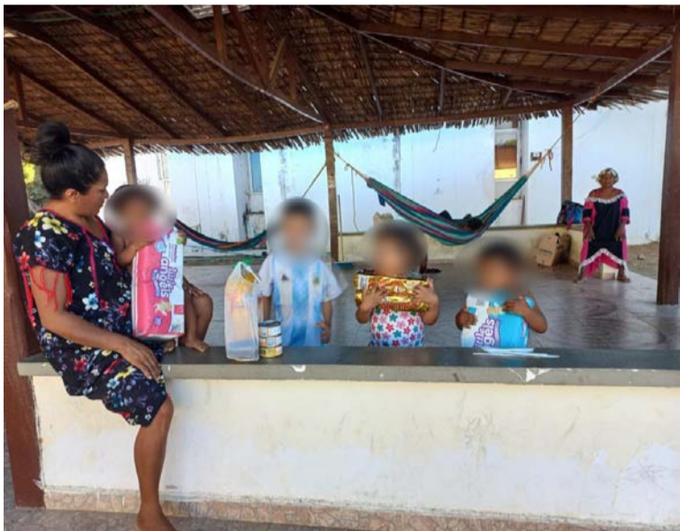
Los desplazados se mantienen en la Casa de la Cultura de Uribia durmiendo a la intemperie sin agua ni alimentos.

Cabe indicar que la única ayuda que han recibido los afectados son donaciones en alimentos y agua que les han entregado los coordinadores de Derechos Humanos del municipio de Uribia, adscritos a la ONG Nación Wayuú.