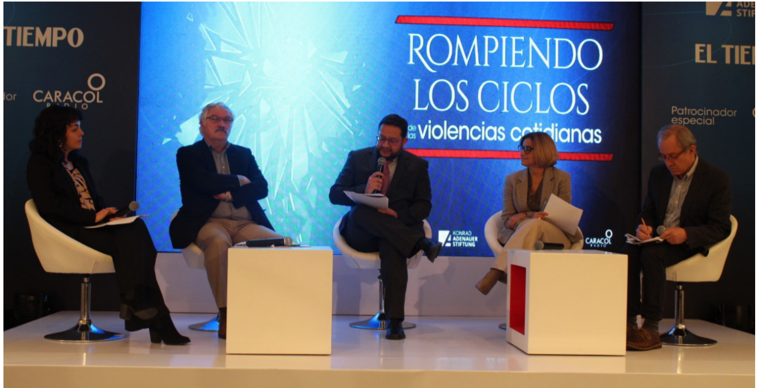
Los analistas consideran que los obstáculos para alcanzar la paz son la corrupción, pobreza, desigualdad y desempleo.

Los encuestados en el estudio indicaron que se sienten totalmente inseguros en las calles (59%), en el centro de su ciudad (56%), en el transporte público (49%), en los parques (43%), en los lugares de ocio (33%), en las carreteras del país (29%), en las redes sociales (27%) y en el barrio (26%). Los principales lugares en que se sienten totalmente seguros son en su casa (75%), en la Iglesia o lugar de culto