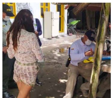
La joven argentina ante funcionario de Migración.