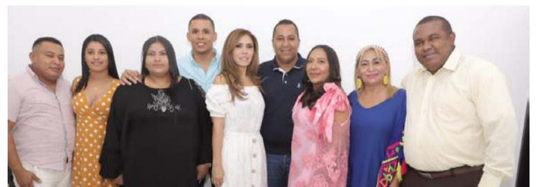
La designación de cinco nuevos rectores garantizarán la prestación del servicio educativo en Riohacha.

Es de anotar que los nuevos cargos se vieron materializados en el marco del encuentro nacional de secretarios de educación, realizado en la ciudad de Bogotá, donde la ministra de