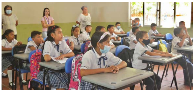
Con la campaña Crianza Amorosa + Juego, la administración de Barrancas fomenta el bienestar para los niños.

En desarrollo de la campaña de Crianza Amorosa + Juego, la administración municipal fomenta diversas estrategias de bienestar para los niños, disfrutando de actividades como literatura, juegos, bailes, pintucaritas, rifas, aeróbicos entre otros, que contribuyen en la promoción de valores y cultura en general.