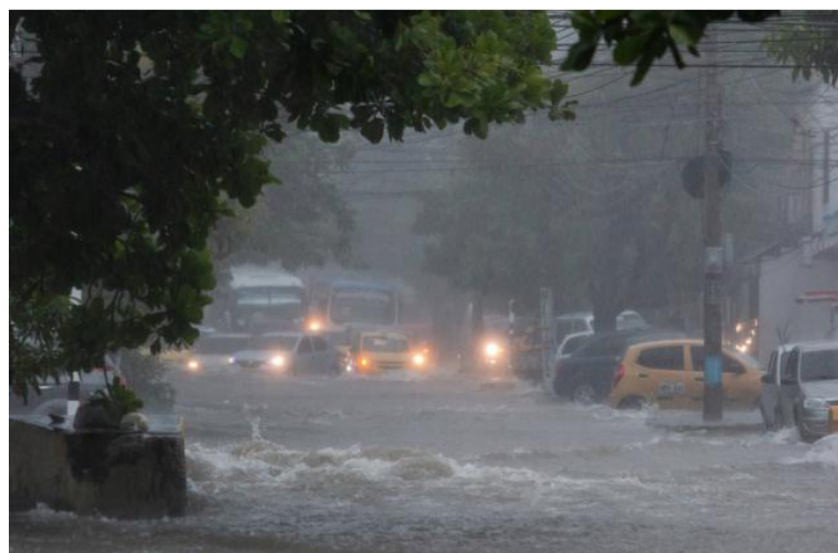
Más intensas lluvias se esperan en sectores de los departamentos del Cesar, Magdalena, Atlántico y La Guajira.

La época de fuertes lluvias se vive en diferentes regiones de Colombia y es por eso que las autoridades han emitido una serie de alertas en algunas zonas para evitar tragedias ante el desbordamiento de ríos y posibles deslizamientos.