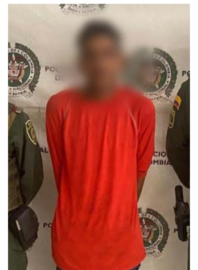
Sujeto capturado en Riohacha por agredir a mujer.

Los uniformados usaron la mediación policial para controlar la situación, luego procedieron a materializar la captura por el delito de violencia intrafamiliar.