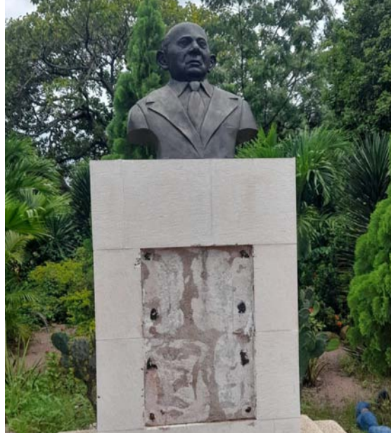
Busto del profesor Rafael Antonio Amaya al que le quitaron la placa de bronce.

“Dicho lugar estaba siendo utilizado para el almacenamiento de mercancías de contrabando, para su posterior comercialización, producto que al ingresar de manera ilegal no genera ningún tipo de economía evadiendo el pago de impuestos y colocando en riesgo a la población en materia de salud”, sostuvo la Policía Fiscal y Aduanera.