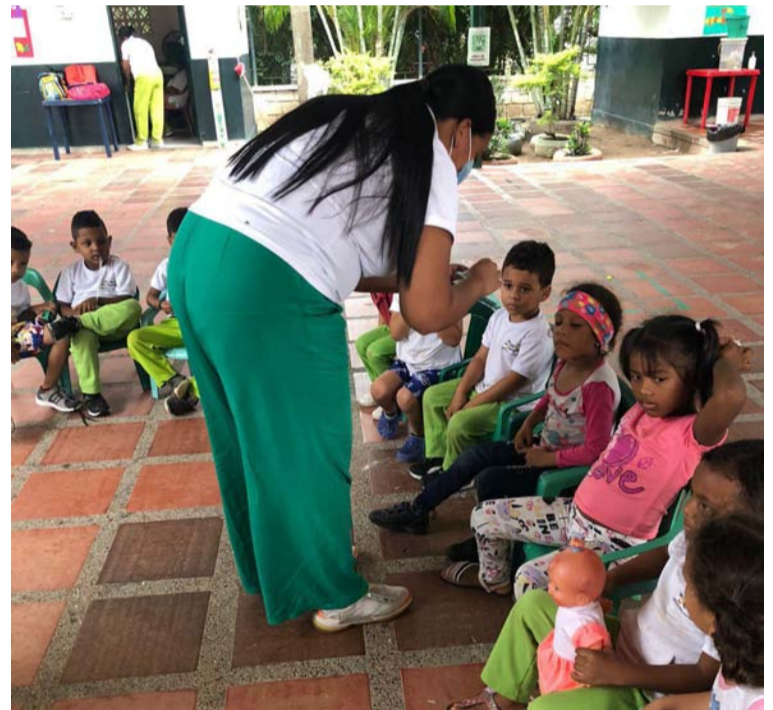
Realizan un plan de desparasitación masiva, a través de jornadas en CDI e instituciones educativas, donde se focaliza a niños entre 1 y 4 años.