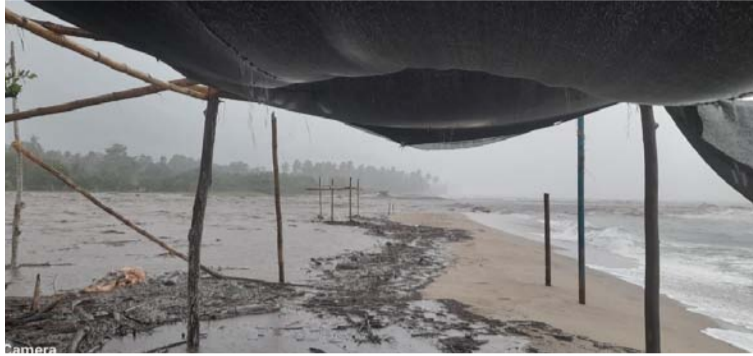
Las fuertes lluvias han provocado el desbordamiento del río Palomino, afectando a los comerciantes cercanos.

Cabe indicar que en pasados días pasados el se-