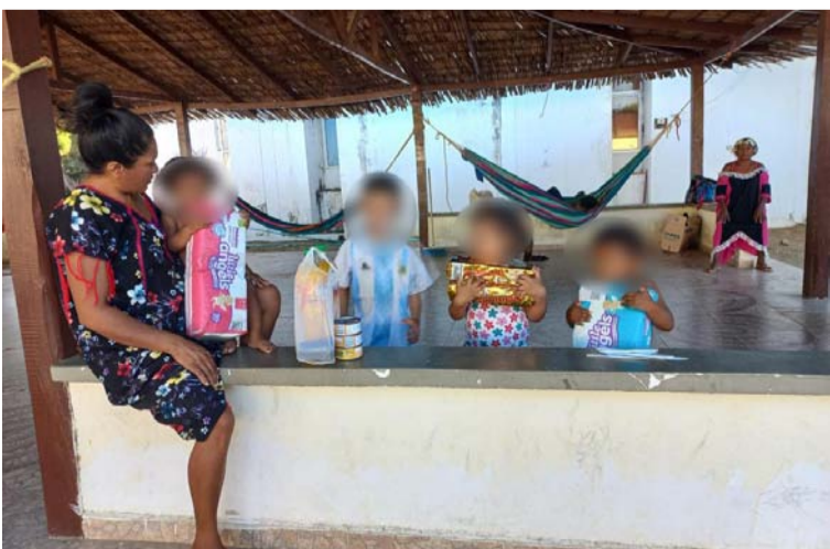
La ONG Nación Wayuu sostiene que Enel Colombia ha provocado el desplazamiento de familias indígenas.