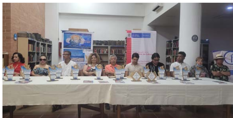
En el evento cultural se dieron cita poetas nativos de San Juan del Cesar y de otras zonas del país.

Queremos motivar a las instituciones para que apoyen esta iniciativa que recorre el departamento por una semana, en compañía de grandes poetas de todo el mundo.