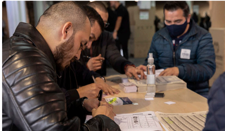
Los jurados serán los mismos de la primera vuelta y ocuparán los mismos puestos y mesas de votación.

Para esta ocasión, las capacitaciones para la segunda vuelta no se realizarán de forma presencial, los jurados recibirán en sus correos el enlace para que ingresen al Sistema Integral de Capacitación Electoral, allí podrán descargar el paso a paso para ingresar al curso virtual que será dictado por parte del Servicio Nacional de Aprendizaje