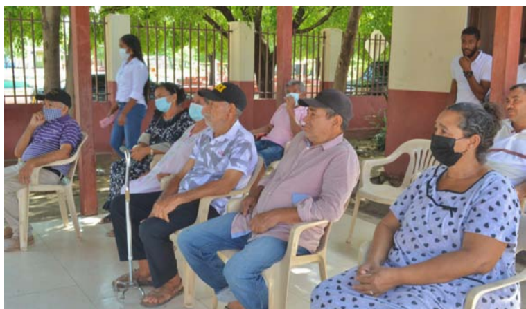
Se realizaron encuentros intergeneracionales, charlas de cuidado e higiene personal, ejercicios lúdicos y recreativos,

El Programa del Adulto Mayor de Barrancas llegó hasta el corregimiento de Pozo Hondo, continuando con las jornadas de atención social dirigidas, con el fin de