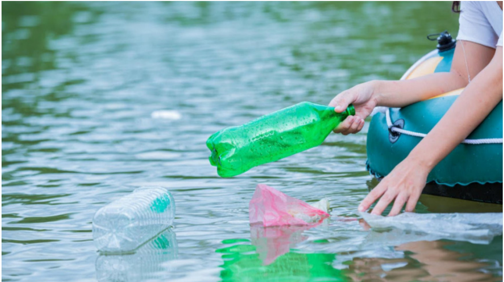
Se ha comprobado que la presencia de microplásticos en especies marinas ocasiona en algunos casos enredos y asfixia.

En La Guajira la contaminación está desbordada