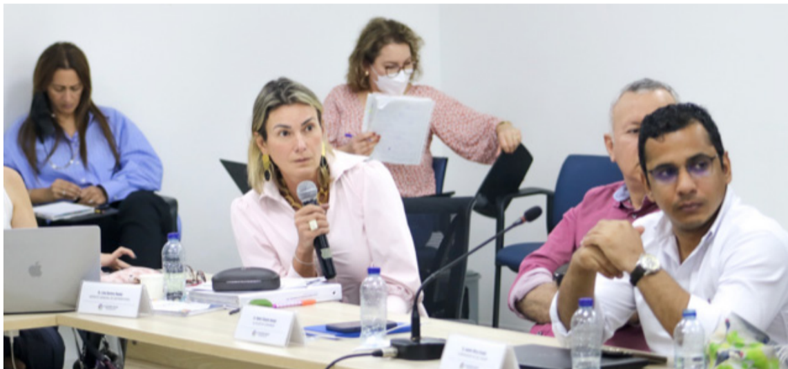
Alejandra Botero, directora del Departamento Nacional de Planeación -DNP-.

Entre los proyectos más importantes que pudieron verificarse en este encuentro, está el de mejoramiento de vías secundarias y terciarias para 15 municipios del departamento del Cesar; obras que tendrán una inversión de $497.970 millones y consistirán en la intervención de más de 215 km en 14 corredores viales que aportarán a la disminución de tiempos de transporte y permitirán la comercialización de alimentos de los habitantes de los