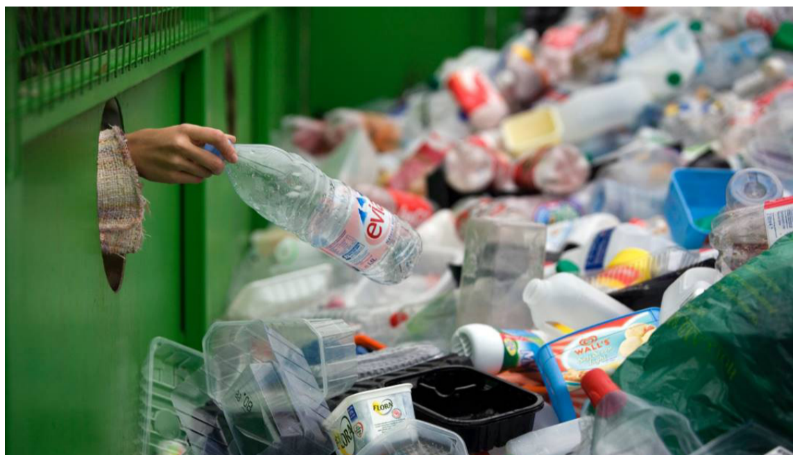
Los plásticos pueden también causar problemas de sanidad a los seres vivos.

Es en este sentido que se considera la ley como una oportunidad para recuperar los espacios afectados y promover acciones que se podrán percibir a largo pla-