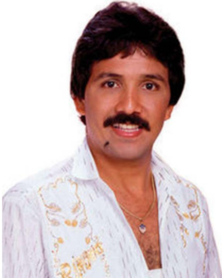
Rafael Orozco, el cantante que revolucionó el vallenato cumple 30 años de fallecimiento este 11 de junio.

cuerdos a su memoria y anotó: "En esos días se llevaba a cabo una feria en esa población del sur del Cesar, y estando en la parranda se apareció Rafael Orozco, un muchacho delgado y cabellón. El me dijo que me ayudaba a cantar. Acepté y de salida quedé sorprendido con su voz. Me gustó el estilo, su afinación, su brillo y que tenía unas caídas bien suaves y llamativas".