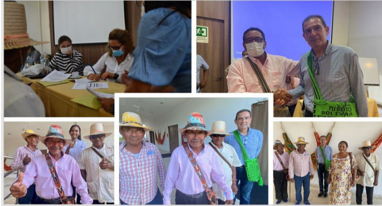
Un total de 198 acuerdos fueron firmados entre Cerrejón y las comunidades indígenas durante el año 2021.

En línea con esto, es importante destacar que las