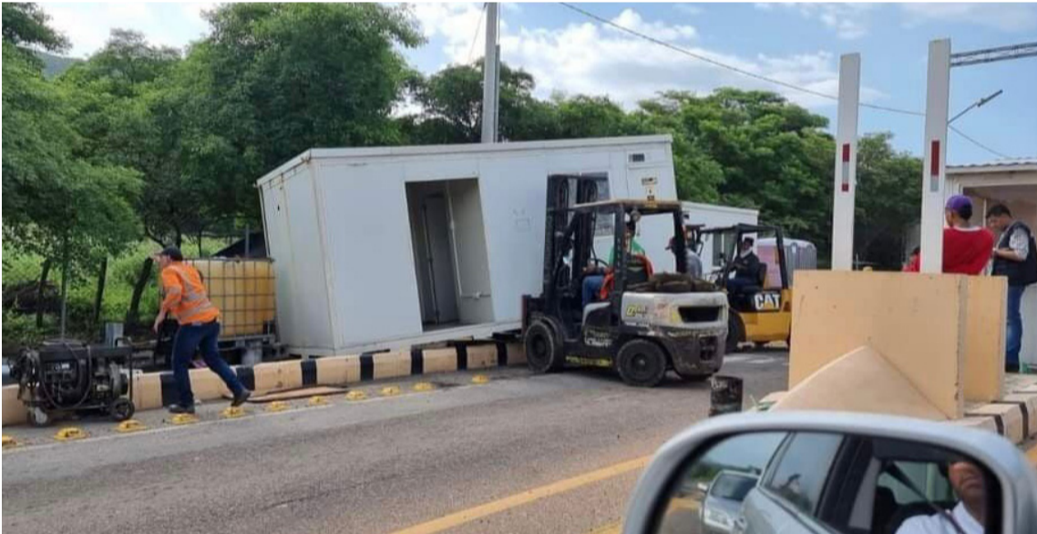
El Ministerio de Transporte retiró el peaje entre San Juan de Cesar y Valledupar.