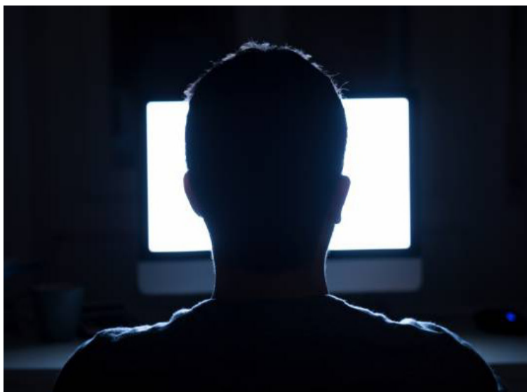
Tras ser denunciado desde 2019, ‘Pedoper’ fue seguido por las autoridades y capturado en Honda, Tolima.

En Colombia se lograron 3.788 capturas por delitos basados en violencia de género, de las cuales 2.573 fueron por violencia intrafamiliar, 1.182 por delitos sexuales, 28 por feminicidio y 5 por homicidio a mujeres, además de la desarticulación de una estructura criminal y 173 acciones de control preventivo.