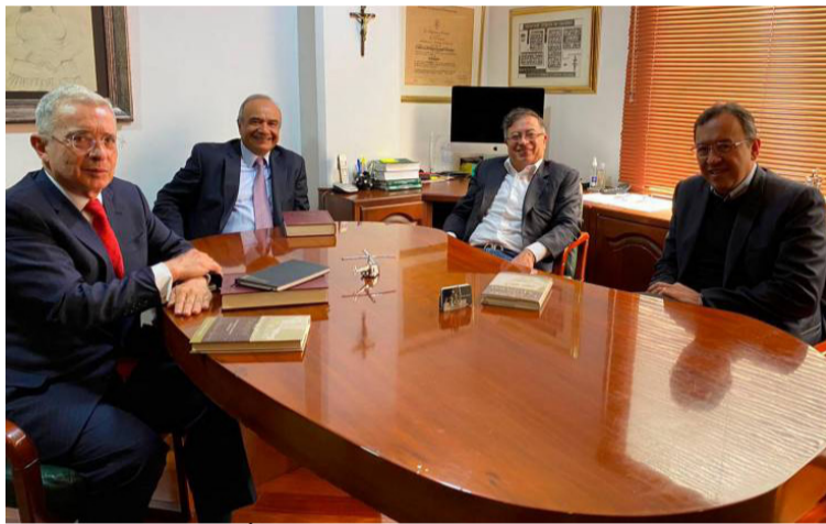
El expresidente Álvaro Uribe Vélez tuvo ayer un encuentro cordial con el presidente electo Gustavo Petro.

“Le dije que tuviéramos un canal de interlocución permanente. Yo no lo molestaré mucho, lo que tengamos que apoyar, lo haremos; cuente con una oposición razonable siempre teniendo canales de diálogo”, sostuvo.