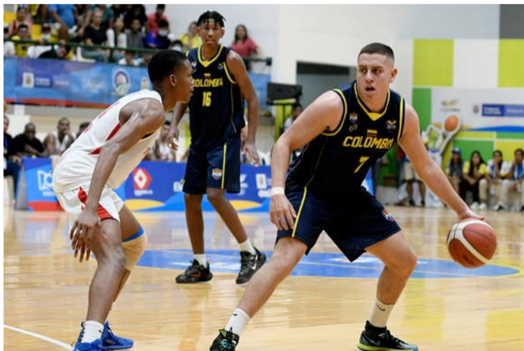
Jugada correspondiente al duelo que Colombia le ganó 72-61 a Panamá para conquistar el oro en baloncesto.

Panamá llegó a la final como la única selección invicta del certamen, luego de ganar todos los partidos en la fase de grupos, incluso imponiéndose ante la delegación cafetera. No obstante, en el juego que debían