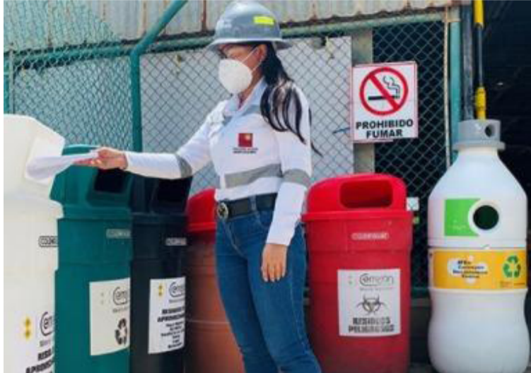
Las ecobotellas son contenedores con forma de botella que invitan a hacer correcta separación de los residuos.

Los residuos se recogen cada dos días y son llevados al patio de reciclaje donde se clasifican y se colocan en una prensa para ser compactados. Tras