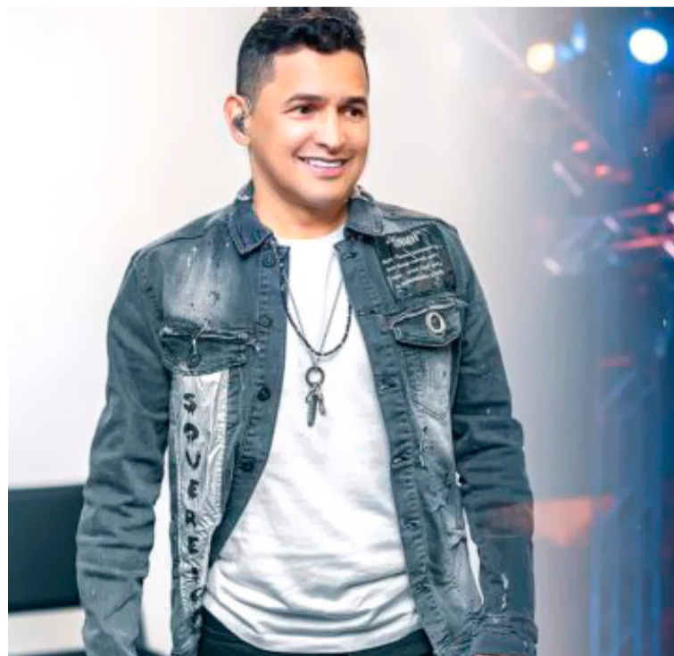
Jorge Celedón entregará con su canto un mensaje de hermandad para fortalecer los lazos de amistad.

La ciudad vive una verdadera fiesta deportiva y disfrutará del mejor cierre de los Juegos Bolivarianos con Jorge Celedón cantando ‘Qué bonita es Esta vida’ y dándole gracias a Dios por estos momentos inolvidables que quedarán en el recuerdo de la gente.