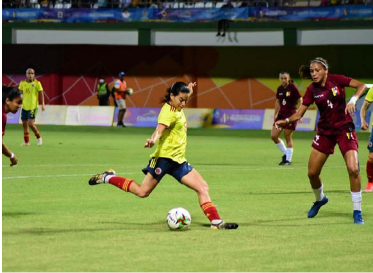
Acción del partido que Colombia le ganó 3-0 a Venezuela en Valledupar para alcanzar el oro en Bolivarianos.