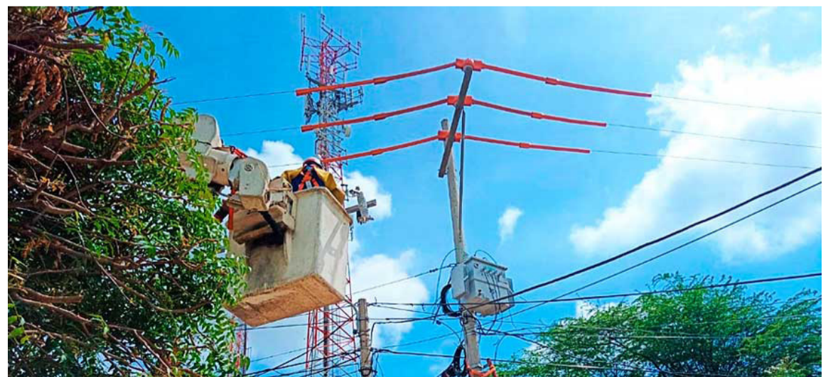
Técnicos de la empresa Air-e desmontaron el transformador conectado ilegalmente.

Asimismo, señaló que a través de los operativos realizados diariamente, se ha logrado una disminución de las pérdidas de la región en los últimos meses.