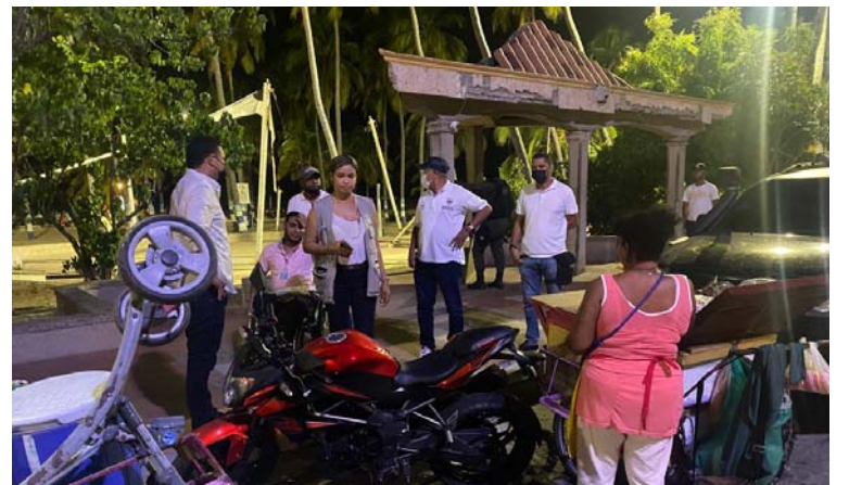
El objetivo de las autoridades es que los vendedores no se adueñen del espacio público e impidan la movilidad.

acciones realizadas por las autoridades para poder esclarecer, en el menor tiempo posible, los homicidios Inés Álvarez y del abogado Raúl Rosales Blanquicet.