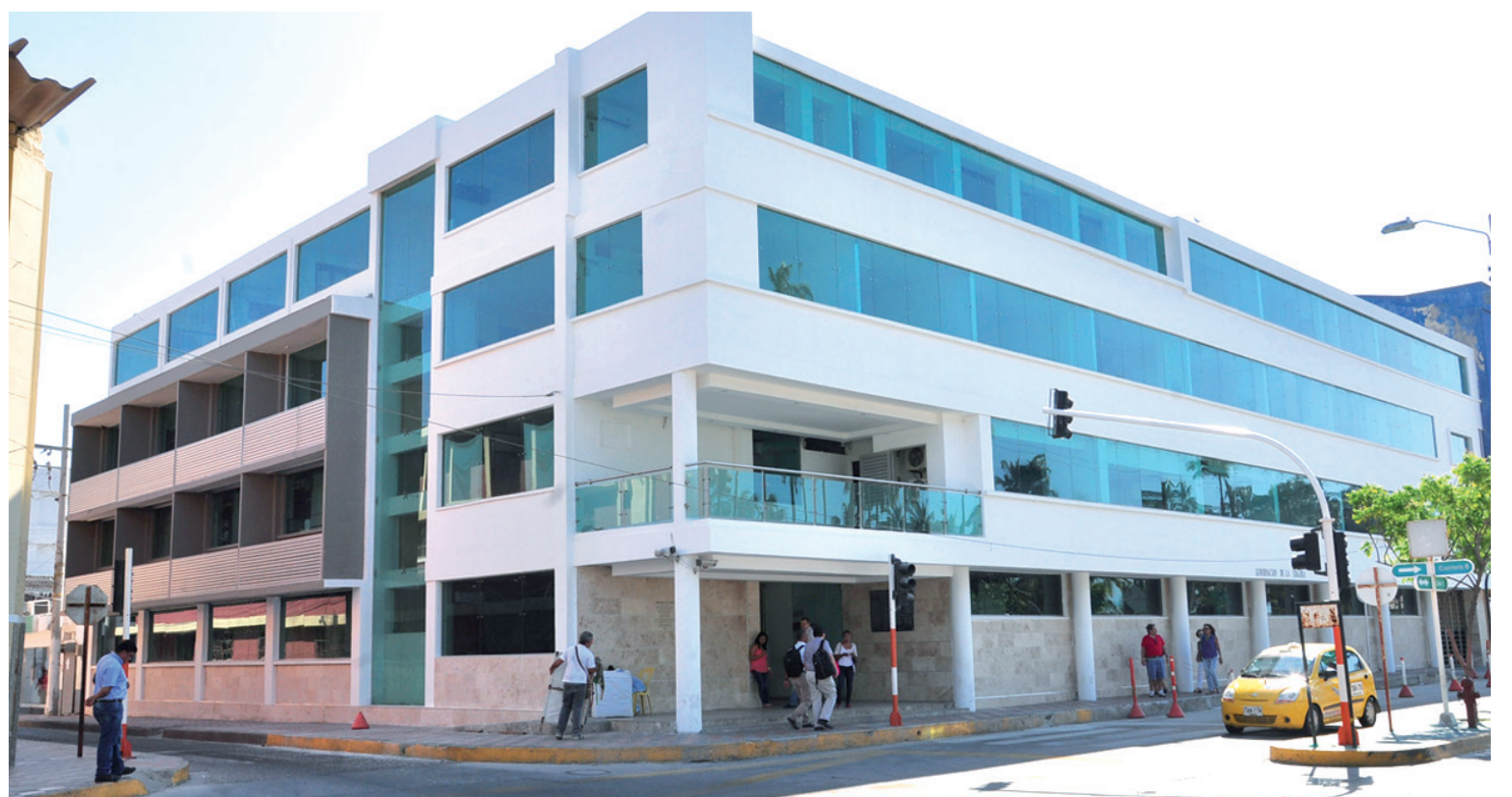
Un nuevo mandatario departamental es esperado en próximos días en la sede de Gobernación de La Guajira.