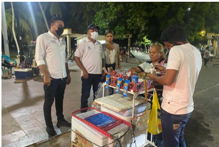
Se hicieron operativos en la zona céntrica, en la calle Primera, donde dispersaron a los vendedores ambulantes.

"Hicimos operativos en la zona céntrica, en la calle Primera, donde dispersamos a los vendedores ambulantes, a personas sospechosas que se han ido adueñando de esta zona, crean pánico, por eso decidimos realizar las acciones