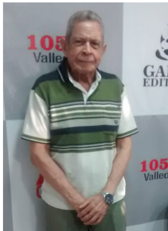
En Cardenal 1050 AM Valledupar, lideró un conversatorio musical al aire.