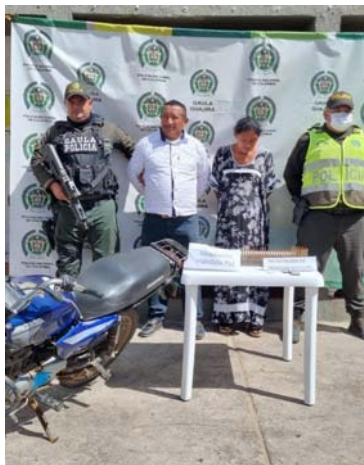
La pareja fue sorprendida portando una 'canana'.

"Gracias a información suministrada por la Red de Participación Ciudadana, quienes llamaron para alertar sobre una pareja que se movilizaba en una moto llevando varios cartuchos para armas de fuego, se obtuvo la captura de dos personas por la carre-