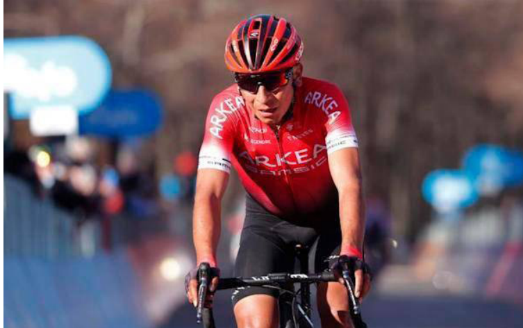
Nairo Quintana, del equipo francés Arkea Samsic, ocupó el sexto lugar en la vigente edición del Tour de Francia.

Con todo lo anterior, Nairo Quintana pudo ocupar el sexto lugar de