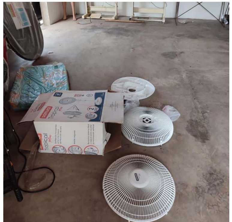
El allanamiento se realizó en una vivienda ubicada aproximadamente a dos kilómetros del antiguo espacio territorial.