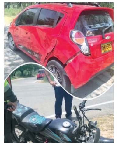
La moto de los hermanos chocó contra este auto.

Haticos y La Peña, La Junta y Villa del Río. La moto impactó al carro por el lado izquierdo. El auto es Chevrolet Sparm-GT, rojo, y placas RHU-505 de Bogotá.