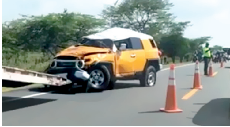
La camioneta se salió de la vía y provocó la muerte de Crispulo Deluque y heridas a su hijo Crispulo Deluque Díaz.