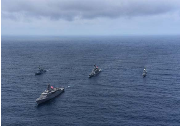
Colombianos y japoneses hicieron maniobras tácticas, procedimientos de comunicación y operaciones de control.

Los buques presentes son JS Shimakaze y JS Kashima de Japón, los cuales junto a la fragata ARC 'Antioquia', el buque ARC 'Caldas', el patrullero marítimo ARC 803 y el helicóptero Bell ARC 228 del Grupo Aeronaval del Caribe de la Armada de Colombia, quienes desarrollaron diversos ejercicios navales que permitie-