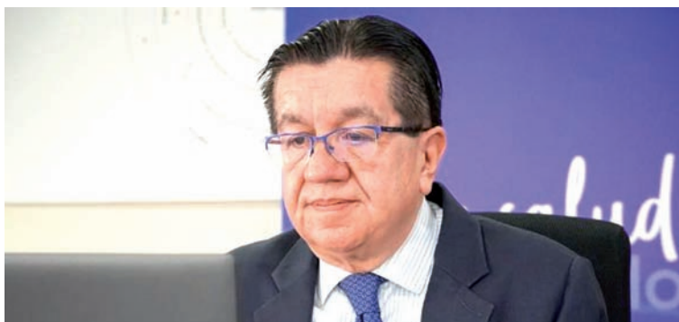
Fernando Ruiz, ministro de Salud, confirmó 11 casos de viruela del mono en Colombia, 10 provienen del exterior.

“Es una enfermedad que se caracteriza por la presencia de unas lesiones en la piel, parecidas a la varicela, las cuales se presentan y duran aproximadamente de dos a tres semanas y que se