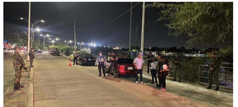
Los controles de las autoridades se van a seguir realizando en otras zonas del Distrito de Riohacha.