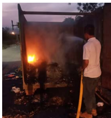
Los Bomberos debieron sofocar las llamas.

La emergencia fue atendida por el Cuerpo de Bomberos Voluntarios de Barrancas que lograron superar el riesgo para los vecinos del sector.