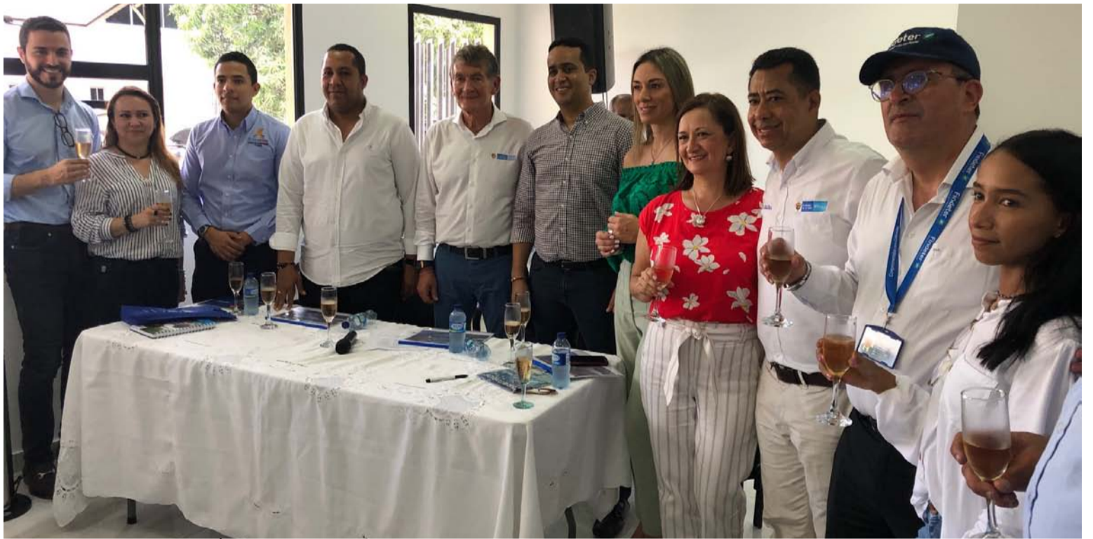
El ministro de Trabajo, Ángel Custodio Cabrera, junto a funcionarios en la sede de la Oficina del Trabajo en Riohacha.

El pacto fue firmado por el Ministerio de Trabajo, el Instituto Colombiano de Bienestar Familiar Regional Guajira, la Alcaldía de Riohacha, la Gobernación de La Guajira, Policía de Infancia y Adolescencia,