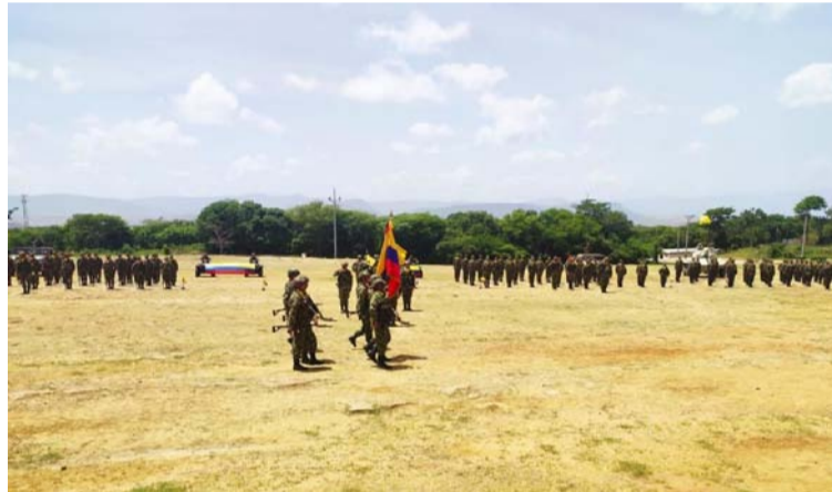
En la ceremonia militar 143 soldados tomaron juramento, de los cuales, varios de la etnia indígena wayuú.

Por su parte, Medina manifestó que este grupo de soldados que tomó juramento entrará a reforzar la seguridad en la jurisdicción del Grupo Matamoros, que incluye el municipio de Maicao.