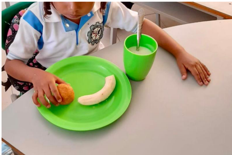
Se requiere mejorar efectivamente la atención en alimentación y aumentar la cobertura del programa PAE.

Sentencia T-302 de 2017 y la superación del Estado de Cosas Inconstitucionales.