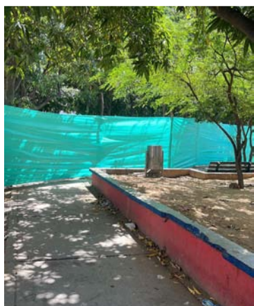
Una cancha se construye en el parque del barrio.

Las autoridades del Distrito informaron sobre la ejecución de las obras en el barrio Entrerríos, las cuales estaban paralizadas por embargos, según informó el secretario de Infraestructura y Servicios Públicos, Keider Freyle Sarmiento.