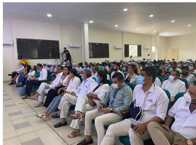
Ángel Custodio Cabrera, ministro de Trabajo, durante rendición de cuentas realizada en el municipio de Villanueva.