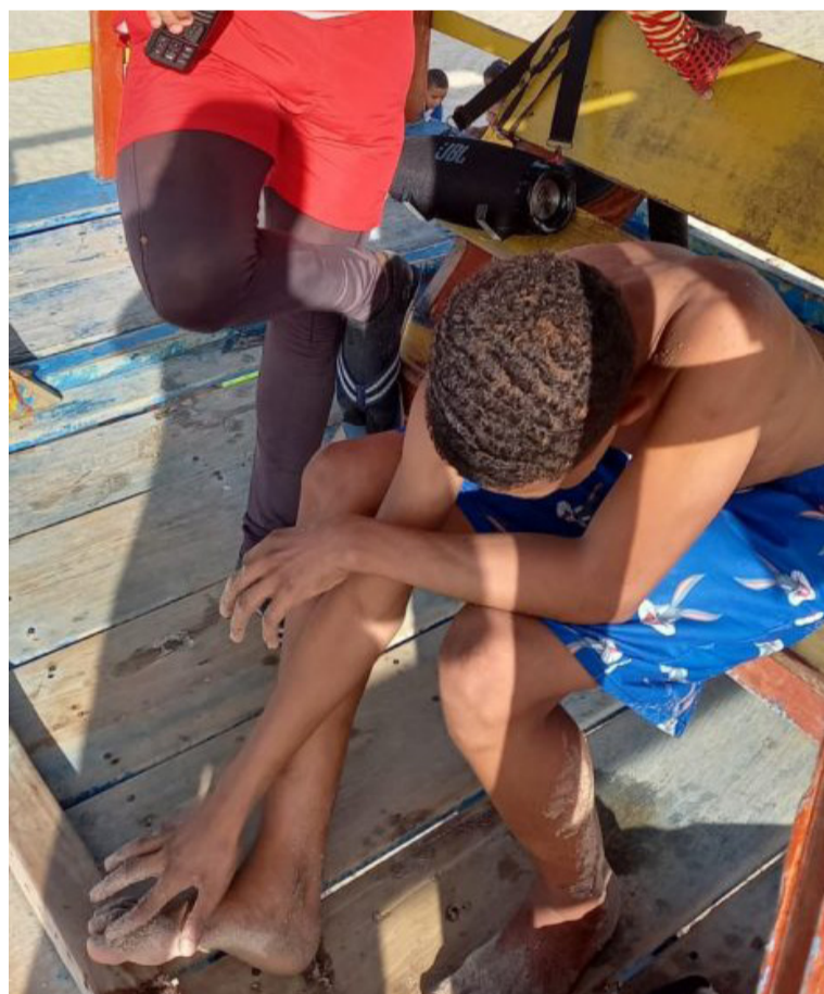
Al parecer, al joven le dio calambre en el mar y fue rescatado por seis de los miembros de Guajira Aventura.

Cabe mencionar que estos dos ladrones están señalados también de atracar a otro ciudadano al mediodía del sábado en un parqueadero de la calle 76 con 59.