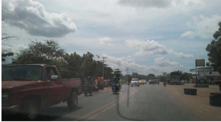
El joven fue ultimado a bala cuando caminaba por la vía entre Maicao y Albania a la altura del kilómetro 85.

“La víctima se movilizaba a pie junto con otra persona, aparecieron dos