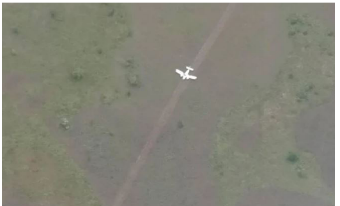
Los aviones colombianos descubiertos fueron interceptados en el estado Apure.

Es en esa zona en la que las autoridades del país presidido por Nicolás Maduro hacen operativos en contra de los ‘tancel’, acrónimo inventado por parte de ellos para referirse a aeronaves pertenecientes a supuestos “terroristas armados narcotraficantes colombianos”.