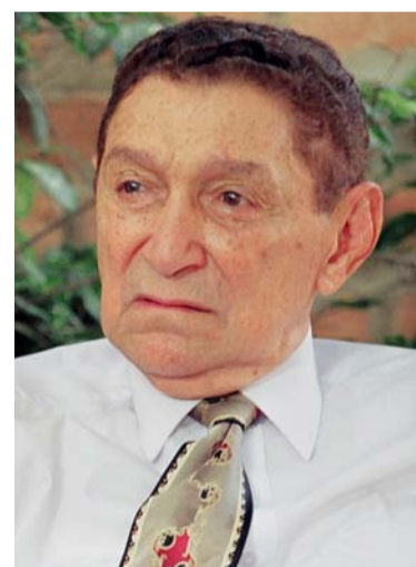
Rafael Escalona expresó sentimientos en sus canciones.