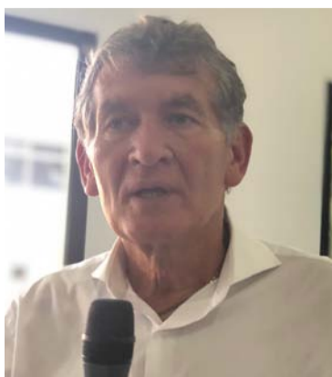
Ángel Custodio Cabrera, ministro del Trabajo.