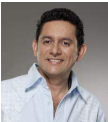
Iván Ovalle, compositor e intérprete del vallenato.