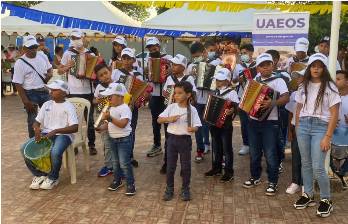
Niños engalanaron la Feria de Emprendimiento interpretando la música vallenata.