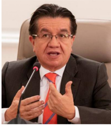
Fernando Ruiz Gómez, jefe de la cartera de Salud.

“En Colombia hasta ahora hemos mantenido una serie de casos de viruela, la mayor parte controlados, a la fecha llevamos 12 casos confirmados que se han reportado la mayoría de ellos derivados de contagios que se han dado por fuera del país, pero se han diagnosticado en Colombia. Sin embargo, dado el crecimiento de contagios, se ha veni-