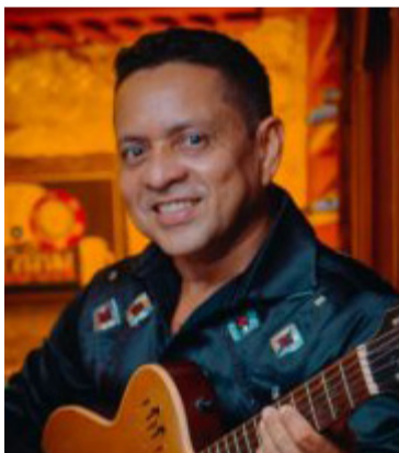
Jorge "El Pitufo" Valbuena, compositor vallenato.