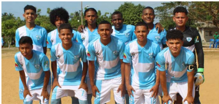
Mingueo, líder de la fase regular en La Guajira del Torneo Nacional Sub-17 de Fútbol. Avanzó a segunda ronda.

El líder de la tabla hasta la fecha cuenta con una estadística favorable, 12 par-