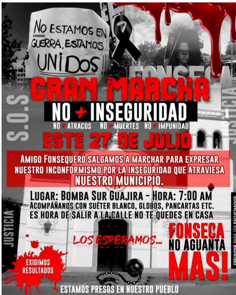
La marcha contra la delincuencia está programada para salir a las 7 de la mañana desde la Bomba Guajira Sur.

me las botas y el uniforme y salir también a patrullar”, expresó enfadado.