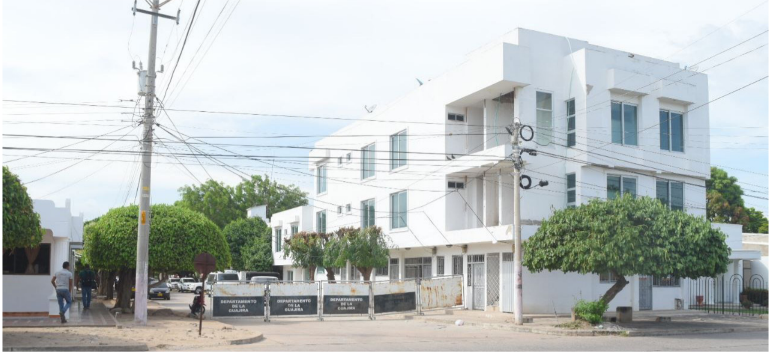
En el Comando de Policía en Fonseca solo hay 7 uniformados, pues los otros 10 fueron trasladados a otras zonas.

Indicó que lo más preocupante es que el municipio quedó solamente con 7 uniformados de vigilancia, que son insuficientes en número para atender todos los casos que se presentan. “Me va a tocar a mí colocar-