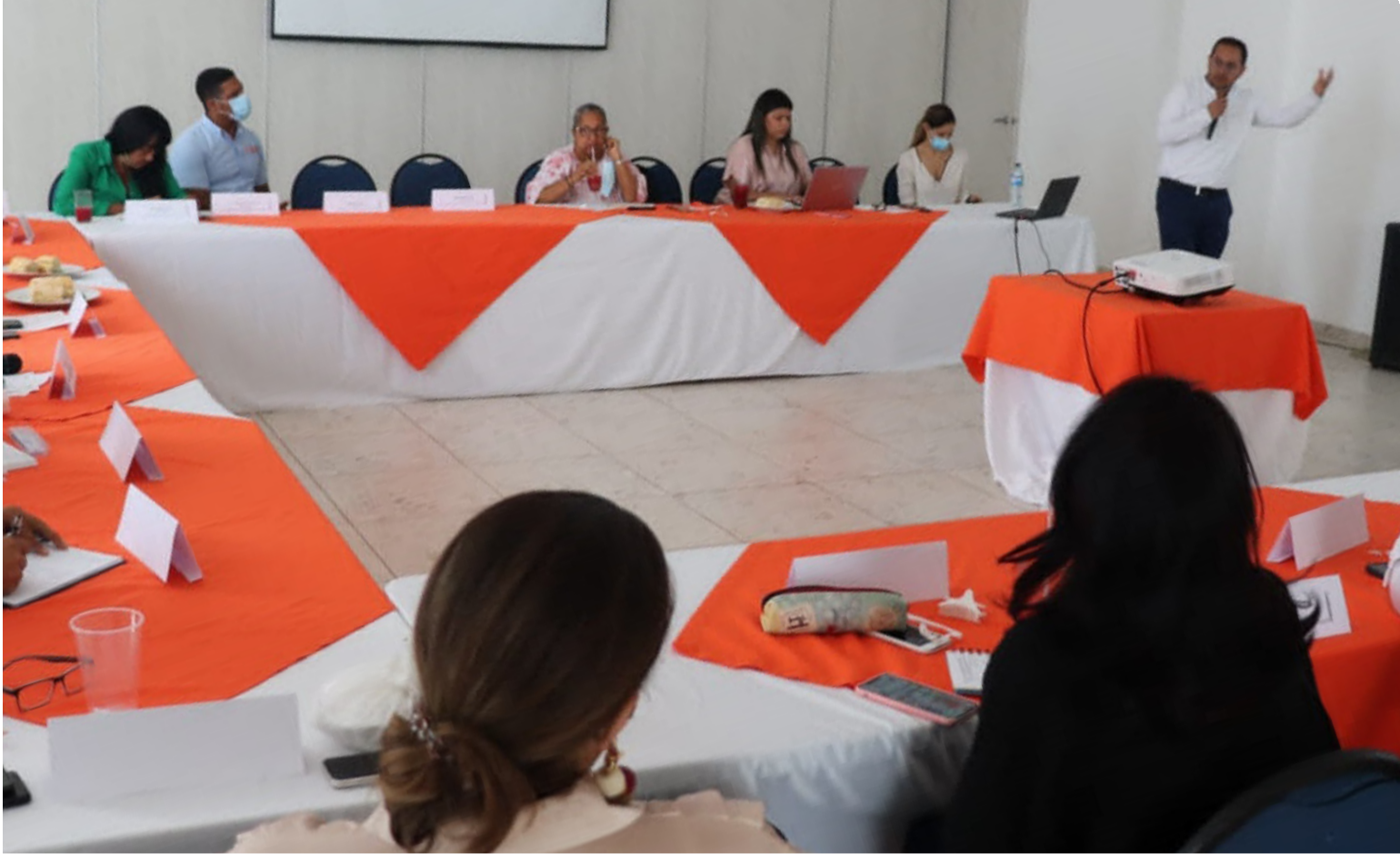
El Consejo Privado de Competitividad y la Universidad del Rosario, entregó el resultado durante una sesión en Riohacha.

Ocupó el puesto 26 con un puntaje de 3,86