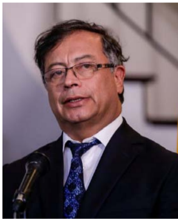
Gustavo Petro, presidente electo de Colombia.

En este espacio de diálogo, que se llevará a cabo en la ciudad de Bogotá, Bermúdez Cotes solicitará al nuevo gobierno priorizar proyectos que permitan superar la pobreza, garantizar la seguridad alimentaria, llevar agua potable a todo el territorio e inversión en