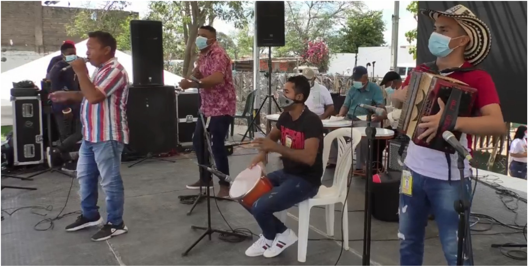
La apuesta este año era mostrar un festival fortalecido, renovado, sin errores, la realidad nos mostró que fue la peor versión en la historia.