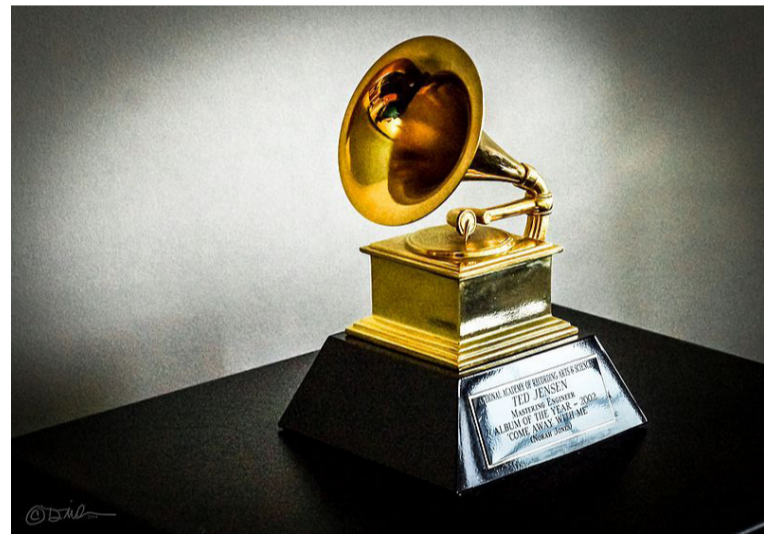
Univision, la principal empresa de medios en español transmitirá en vivo la gala de los Latin Grammy.