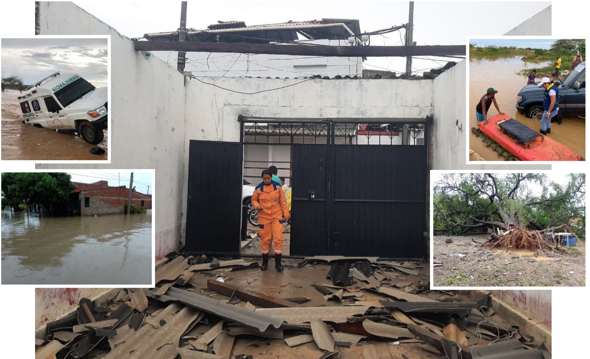
Viviendas destechadas, desbordamiento de arroyos y vías incomunicadas dejó el paso de la tormenta 'Julia' en La Guajira.