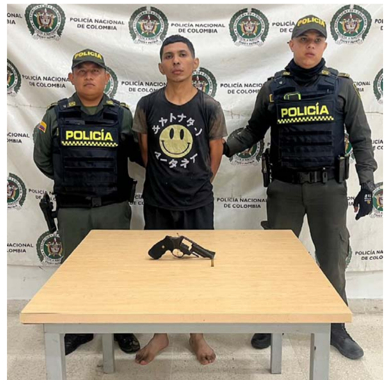
Sujeto capturado por la Policía tras intentar huir en moto junto a otro individuo que portaba un arma de fuego.

Por ende, le materializaron la captura al motociclista por el delito de fabricación, porte y tráfico de armas de fuego o municiones y lo dejaron a disposición de la Fiscalía URI de Riohacha.