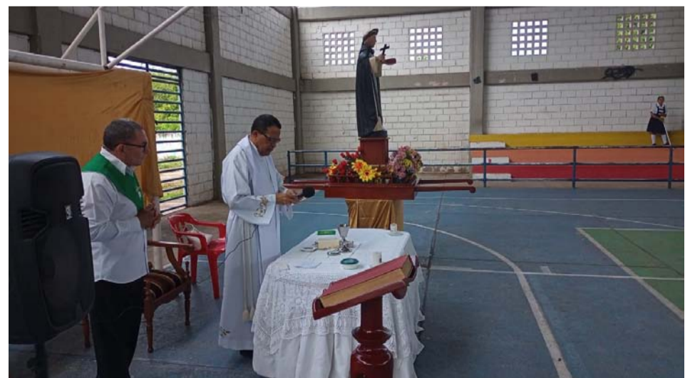
Numerosos feligreses presentes en la eucaristía celebrada con motivo de las fiestas religiosas de San Luis Beltrán en el municipio de Villanueva.