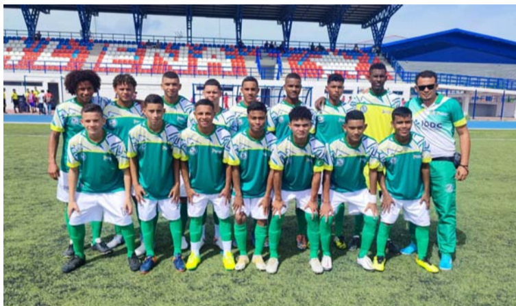
Equipos de fútbol masculino y de voleibol femenino de La Guajira que participan en los Juegos Intercolegiados.

Asimismo, las instituciones educativas Técnica Inmaculada Liñán de Urumita, Institución Educativa Manuel Anto-