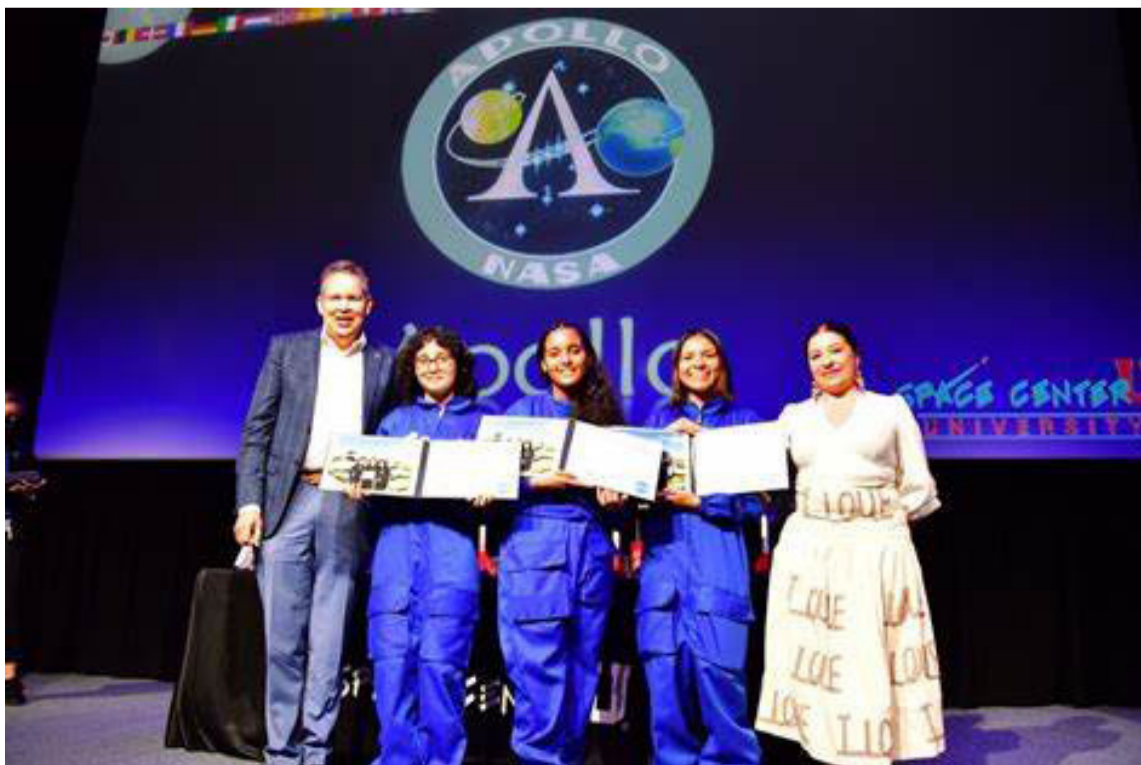
La apuesta de Ella es Astronauta es iniciativa de la Fundación She Is y Space Center.

rra que siempre brilla - Uri-bia - en mi amada guajira.