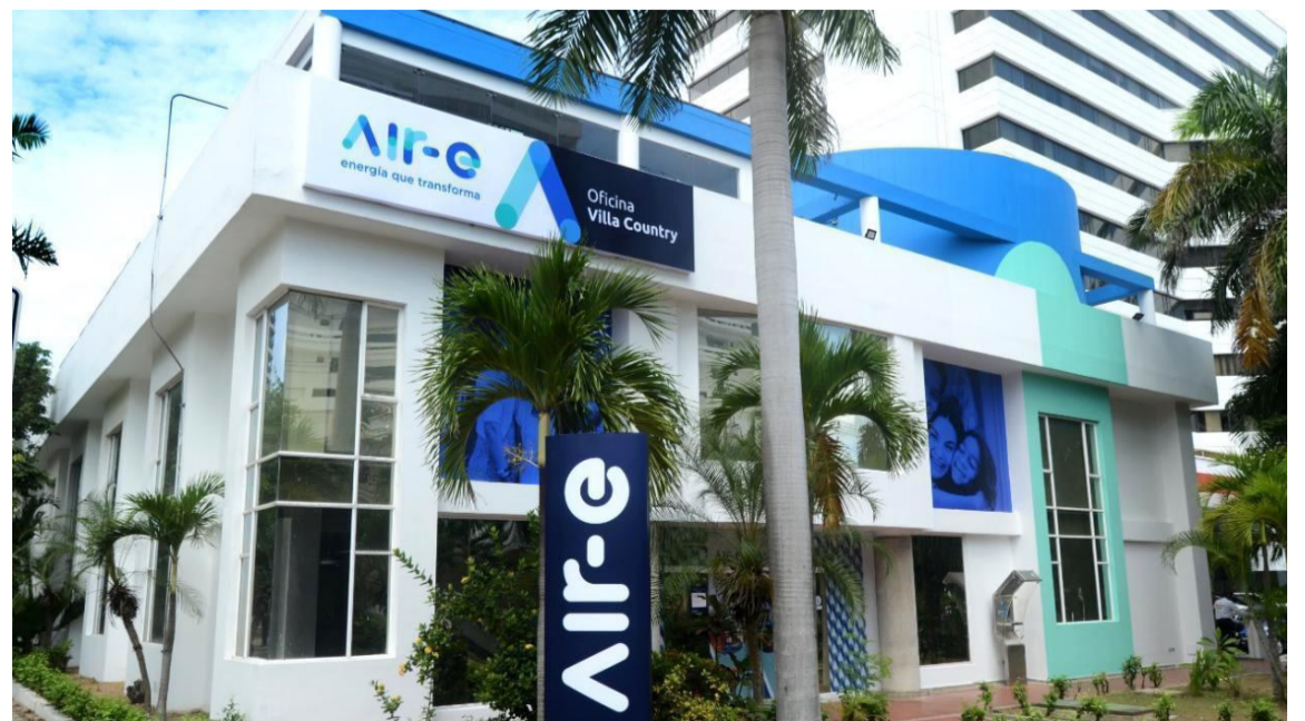
Se cuantificó el daño de Air-e por $17.561 millones y el de Afinia por $11.843,8 millones.

Producto de la visita fiscal, se solicitó a los operadores de energía del Caribe la entrega de toda la información necesaria para determinar el respectivo daño fiscal.