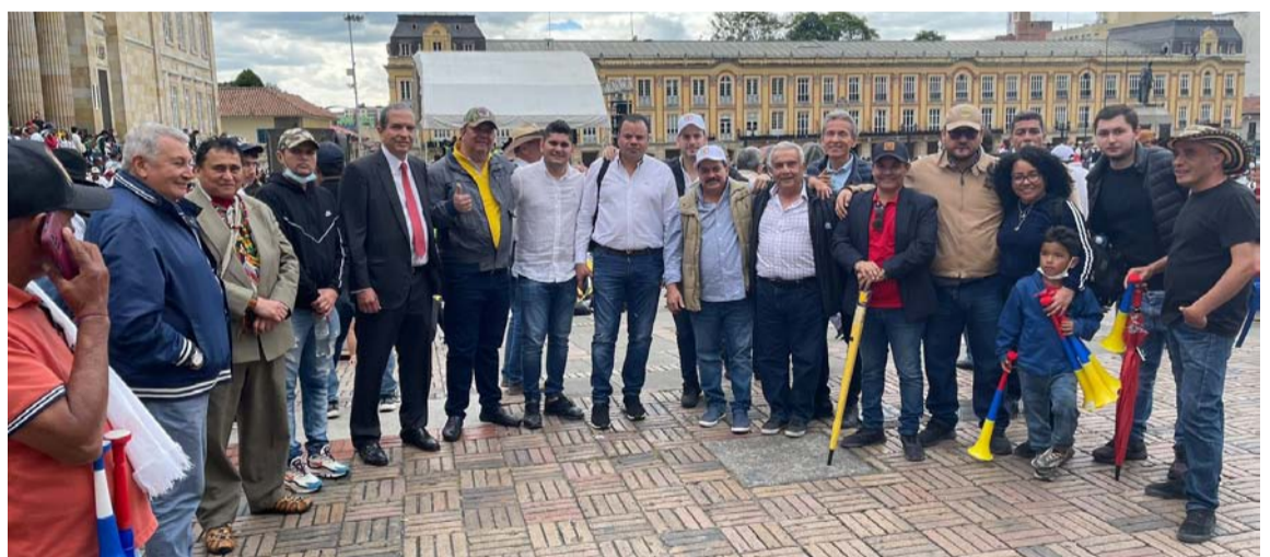
Galleros del país que ayer protestaron por proyecto que prohíbe las peleas de gallos.

Cabe mencionar que Sintracarbón señaló que solo marcharán para defender su labor y a las comunidades, de las afectaciones del gran capital.