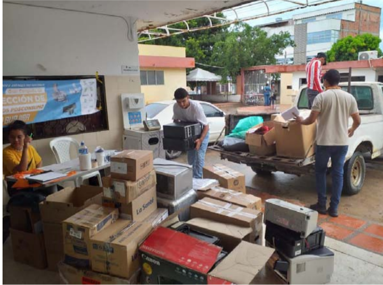
Los habitantes respondieron a la jornada de recolección de residuos realizada en el municipio de Maicao.

Durante la actividad se habilitó un punto de recaudo en el antiguo Hospital San José de Maicao y fue un trabajo coordinado por la dimensión ambiental del Departamento Administrativo de Planeación y el área de Salud Ambiental de la Secretaría de Salud Municipal, y contó con el apoyo de la