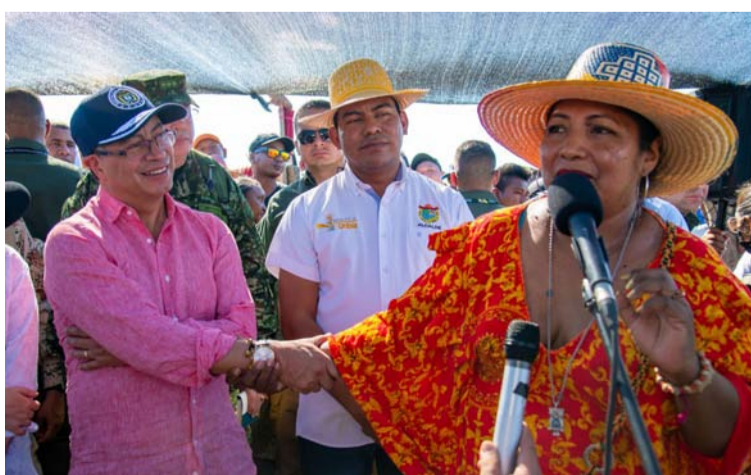
Gustavo Petro saluda a una líder wayuú tras inspeccionar la inundación que dejó en Uribia la tormenta 'Julia'.