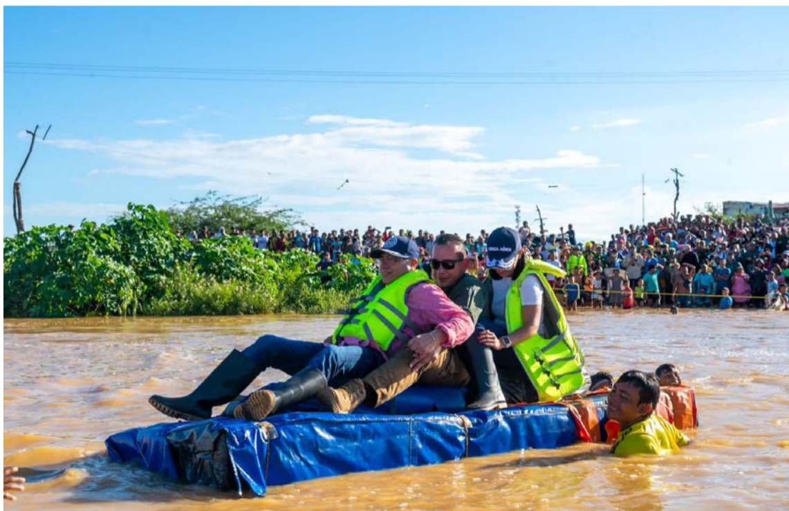
El presidente Petro cruza en balsa el arroyo Chemerrain rumbo al barrio 3 de Abril de Uribia.

En ese sentido, el presidente Gustavo Petro aseguró que se trabaja en un plan estratégico para el sector de agua potable que parte de recuperar todos los sistemas que durante décadas se han construido en La