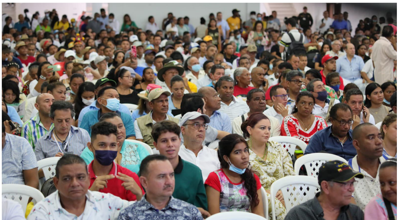
Autoridades de la Guajira y comunidad en general se hicieron presentes en el Diálogo Vinculante en Riohacha.

situación problemática con su correspondiente acción de cambio y enviarnos el duplicado de cuestionario para estructurar una base de datos de la Subregión Sur y Alta Guajira.