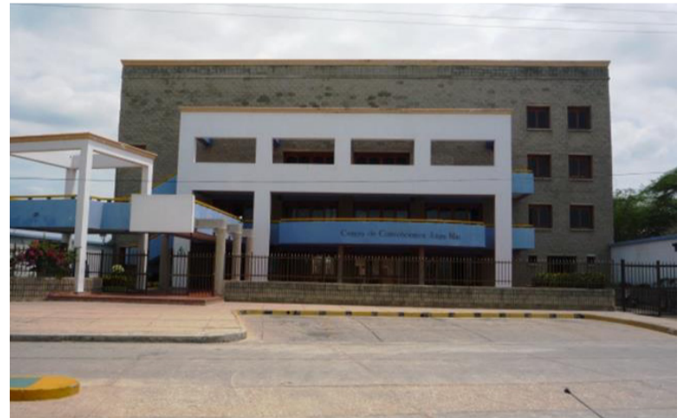
El Centro de Convenciones Anas Mai de Riohacha será sede de la asamblea de Asodegua a partir de las 8 a.m.

Para este evento, la directiva de Asodegua ha invitado a todos sus afiliados a participar de manera libre, espontánea, masiva, activa, creativa y propositiva manera presencial, respetando los protocolos y utilizando los elementos de bioseguridad de forma correcta.