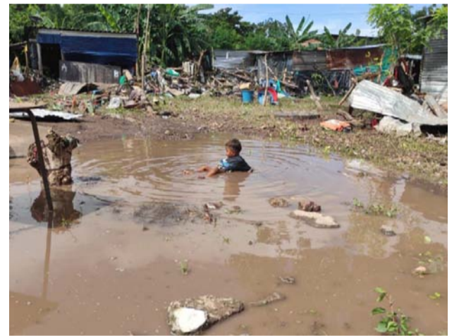
Las calles de Bosconia quedaron convertidas en ríos tras el desbordamiento de varios arroyos. El alcalde Edulfo Villa declaró calamidad pública.