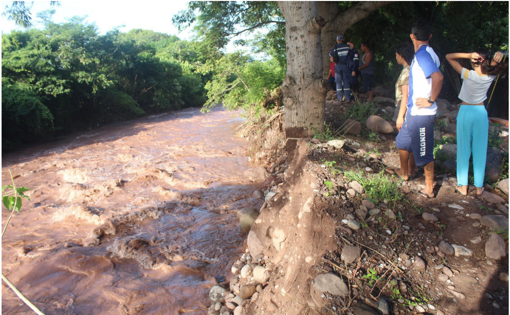
Los ríos Villanueva y Los Quemaos generaron afectaciones a unas 50 familias campesinas en la vereda Los Zanjones.

Son varias las zonas afectadas por las lluvias