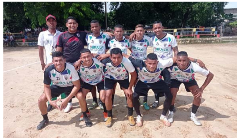
Campeonato de Fútbol, categoría abierta, en Dibulla.

diente a dicho campeonato, en el que participan la cabecera municipal y los siete corregimientos de