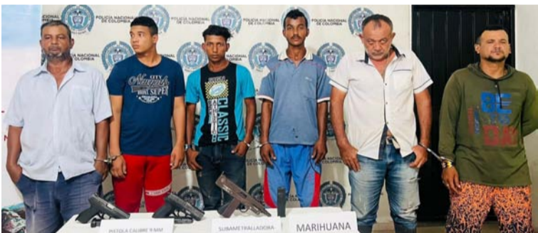
Sujetos detenidos por el Ejército Nacional y la Sijín.

Finalmente, tanto los capturados como los elementos materiales probatorios fueron puestos a disposición de la Fiscalía URI de Maicao, con el fin de que surtan su proceso jurídico.