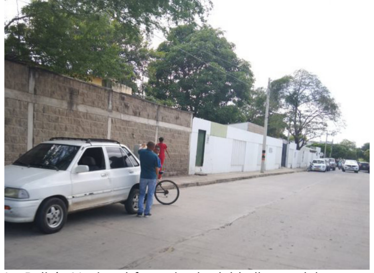
La Policía Nacional fue avisada del hallazgo del cuerpo por parte de personas que frecuentaban la zona.

El cuerpo fue trasladado hasta las instalaciones de Medicina Legal de Riohacha. No obstante, será trasladado a Barranquilla para su plena identificación.