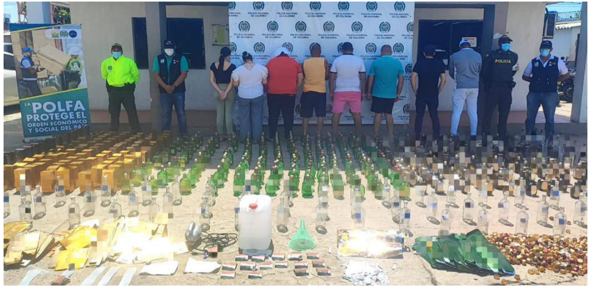
Se incautaron 1.500 botellas de distintos licores, asimismo cajas, 3.077 tapas, 350 unidades de estampillas y se judicializaron a los detenidos.