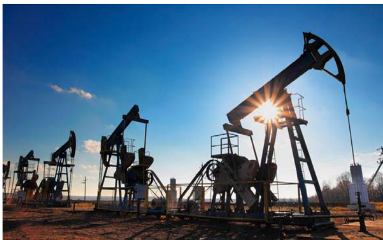
El avance en energías limpias debe transitar de manera gradual, segura y con objetivos claros, señala la Contraloría.

prudencia y rigor técnico para asumir el debate sobre el sector y precisó que esto permite que las empresas y los inversionistas tomen sus decisiones con claridad en las reglas de juego.