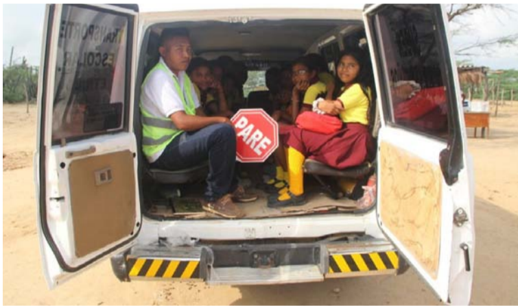
La Gobernación busca garantizar prestación del servicio de transporte escolar a estudiantes en el Departamento.

La “urgencia manifiesta” es una situación que puede decretar directamente cualquier autoridad administrativa, sin que medie autorización previa, a través de acto motivado.