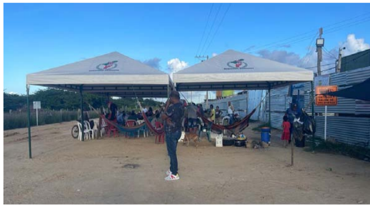
La comunidad indígena La Ceibita Macedonia señala que está asentada en su territorio hace 90 años.

el año 2014 por la Alcaldía distrital, cuando ni siquiera se pensaba en la construcción de esta cárcel”.