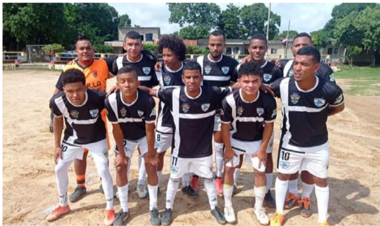
Equipos de Mingueo y Las Flores que jugarán la final del