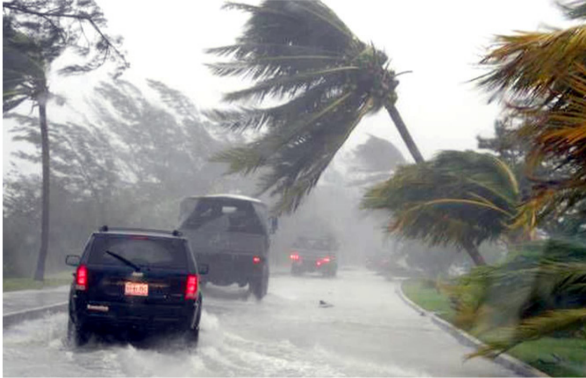
La Guajira, así como la Sierra Nevada se verán afectadas por las fuertes precipitaciones.

meros días de la presente semana se presentarán lluvias concentradas, especialmente, en el Caribe y la región Andina.