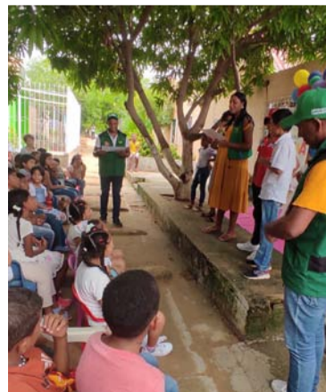
Se adelanta en prevención con 800 niños y niñas.

De igual forma, se adelantó una actividad del programa en el barrio Villa Fátima de Riohacha para hacer entrega de cuentos a los niños y niñas referentes a que aprendan a identificar situaciones que los exponga a cualquier tipo de riesgo.