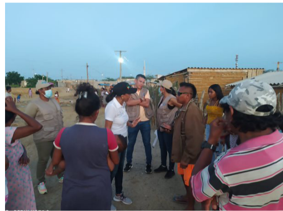
Se recomienda a la comunidad de Manaure limpiar sus hogares y eliminar residuos.

cialización en las comunidades del área rural y urbana del municipio, y además, el reordenamiento del medio.