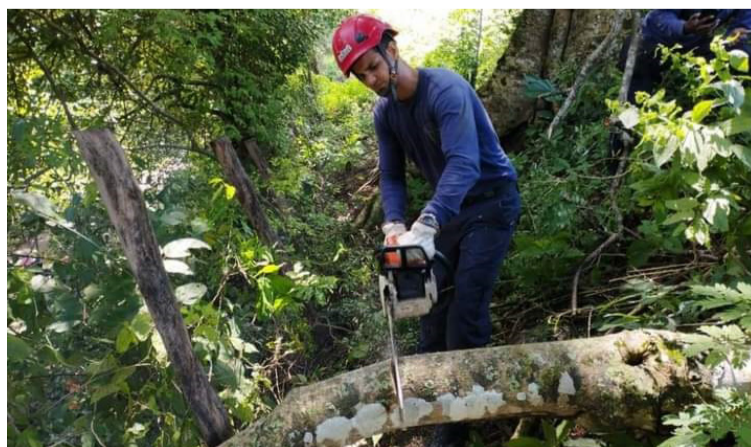
Algunos campesinos intentaron realizar trabajos manuales y no fue posible. Se necesita maquinaria.

traron deslizamientos, por lo cual se llevó un sinnúmero de mangueras de agua utilizadas para el suministro del líquido hacia las fincas.