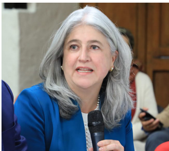
Catalina Velasco, ministra de Vivienda, Ciudad y Territorio, invitó a participar.

La Universidad de La Guajira presentará al Gobierno los resultados del encuentro fronterizo realizado la semana pasada, un documento con propuestas concretas en materia de migración y Derechos Humanos; comercio y turismo; salud; educación; y trabajo.