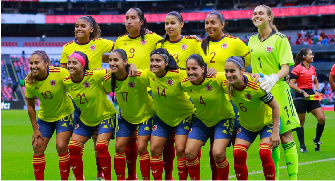
Selección femenina de Colombia, categoría mayores, que participará en el Mundial.

Dentro del calendario que ya se dio a conocer, el debut de la 'Tricolor' será, según la dife-