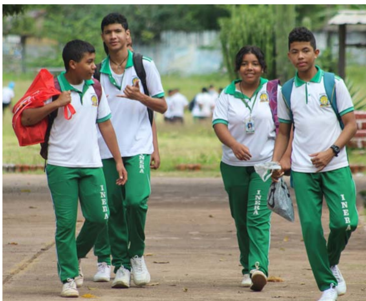
Estudiantes de la Institución Educativa Roque De Alba que celebra 58 años de su fundación en Villanueva.