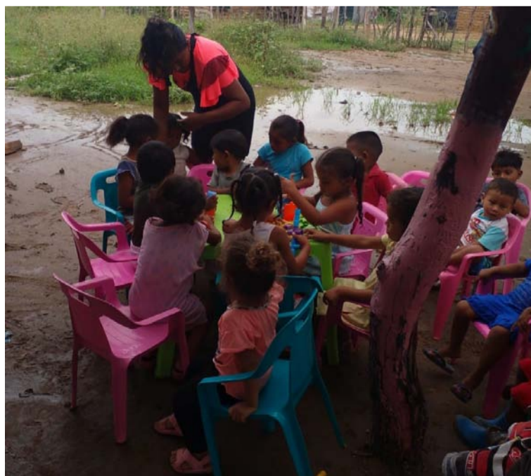
Para la Supersalud, es claro que la EPSI desconoció que los niños y niñas son sujetos de especial protección.

Lo anterior generó la evidente transgresión a la garantía de prestación de los servicios de salud a pacientes sujetos de especial protección constitucional, en condiciones de vulnerabilidad, con claras repercusiones en la garantía de satisfacción del derecho fundamental de la salud, en condiciones de accesibilidad, continuidad y oportunidad. En la resolución que impone la multa de 250 salarios mínimos legales vigentes, se indica que contra este acto administrativo de primera instancia proceden los recursos de reposición y de apelación.