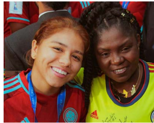
El seleccionado nacional femenino sub-17 de fútbol en su visita a la Casa de Nariño.