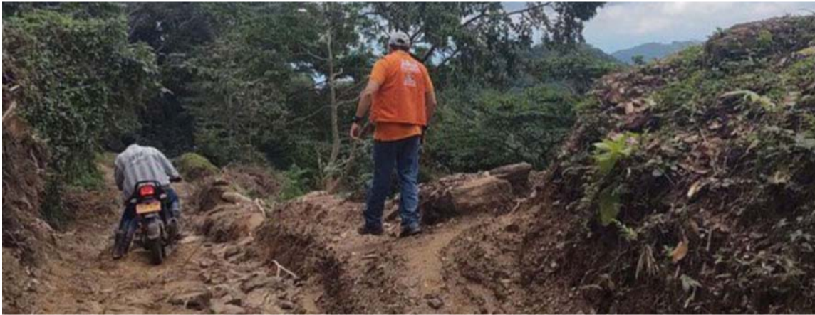
La emergencia se registró en el corregimiento de Siberia, zona rural de Ciénaga.