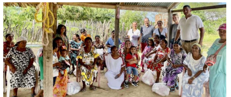
La donación fue enviada a La Guajira por familias solidarias con la situación de las comunidades afectadas.

La convocatoria a las madres de las familias benefi-