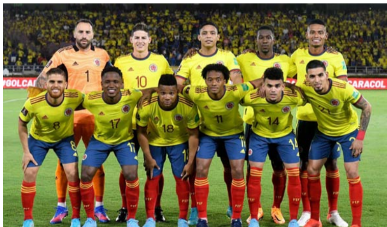
La Selección Colombia viene de superar a Guatemala y a México en los dos juegos amistosos de septiembre.