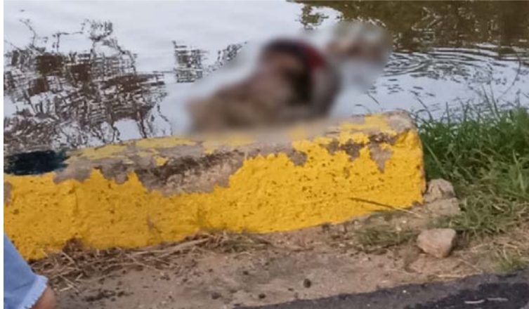
El cadáver fue hallado a la altura del Colegio Sagrado Corazón en la salida de Riohacha a Maicao.

Aunque inicialmente se habla que la persona habría