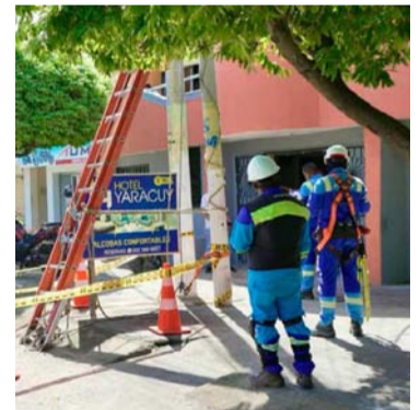
Operarios de Air-e debieron cortar el servicio al hotel.

“Es importante que se acerquen a nuestras oficinas o se comuniquen a la línea 115 donde tenemos una política de financiación flexible que está dispuesta para que se acojan a métodos de pago y puedan ponerse al día con la factura. Solo con su pago puntual podemos realizar inversiones para transformar el servicio de energía que la región Caribe necesita”, puntualizó.