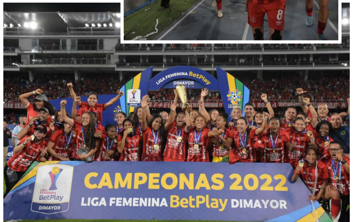
Se sabe por parte del delegado de la marca, que será esa marca principal.