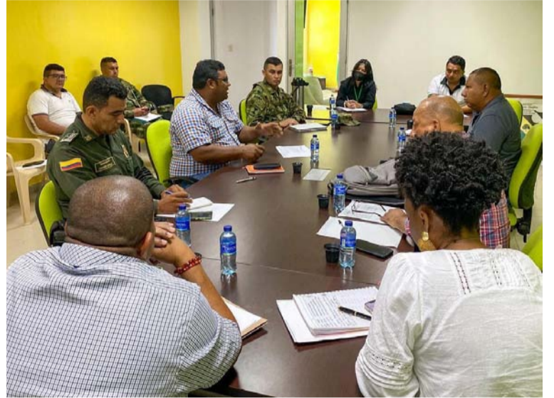
En el consejo de seguridad se diseñó el mecanismo para garantizar la concertación de ambas comunidades.