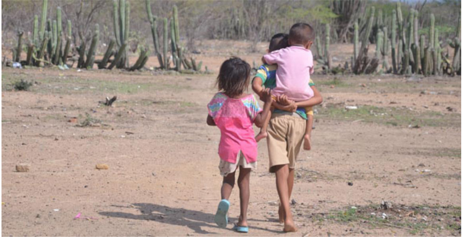
La EPS AIC incumplió con la obligación de garantizar el tratamiento de la desnutrición aguda a los niños y niñas.

Es claro que una persona y en especial un niño que no accede a los alimentos y nutrientes necesarios para