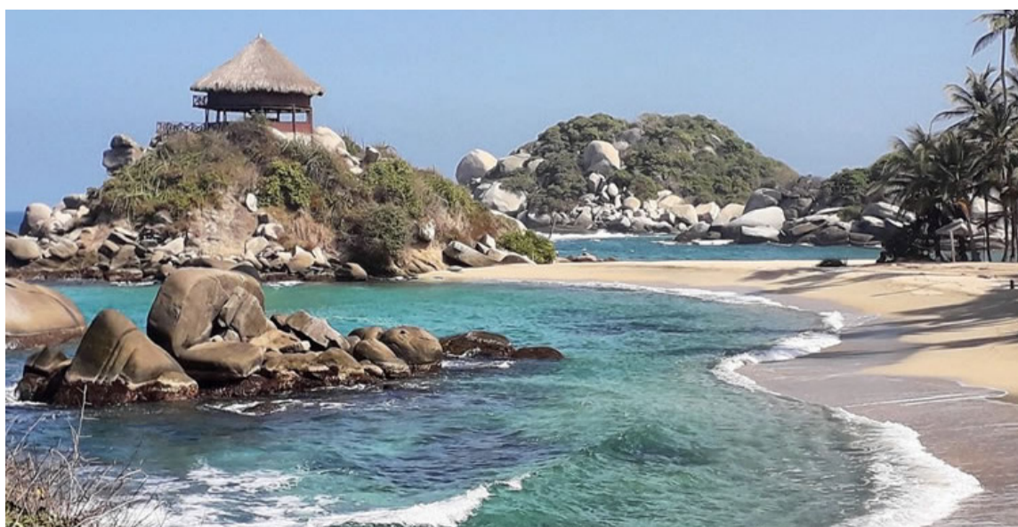
Los turistas podrán volver a disfrutar de la belleza del Parque Natural Nacional Tayrona.

Terminó el pasado miércoles 2 de noviembre, el tercer y último cierre del 2022 del Parque Natural Nacional Tayrona y volvió a abrir sus puertas para todos los visitantes.