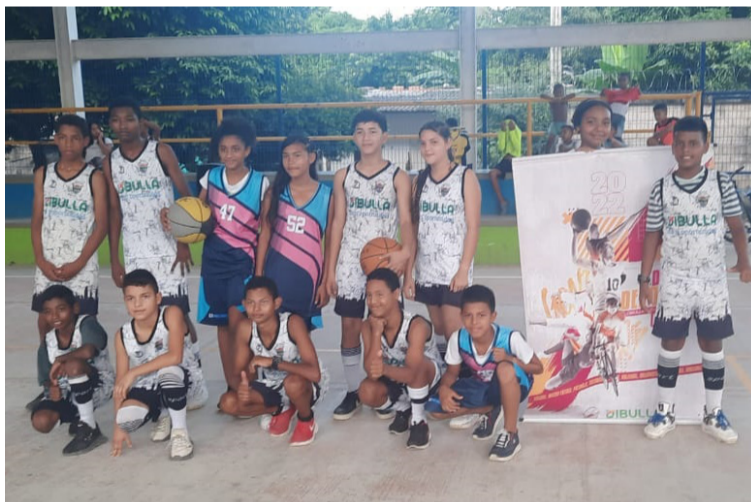
Equipo de Dibulla con menores entre 12 y 15 años que participa en el Campeonato Municipal de Baloncesto.

El acto inaugural fue realizado en la cancha 20 de Enero de Mingueo, y cada encuentro será en el corregimiento que corresponda, de acuerdo a los