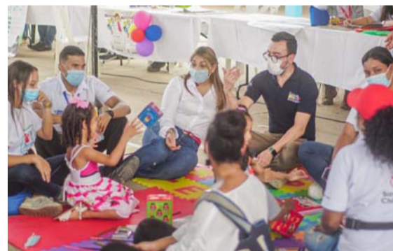
La jornada a realizarse el sábado hace parte de la Feria de Servicios en donde también podrán recibir orientación sobre beneficios.

Después de escuchar a la plenaria, discutir el articulado y adquirir compromisos puntuales para la siguiente deliberación legislativa, la comisión aprobó por unanimidad la iniciativa dándole paso al tercer debate donde se espera siga su curso con éxito.