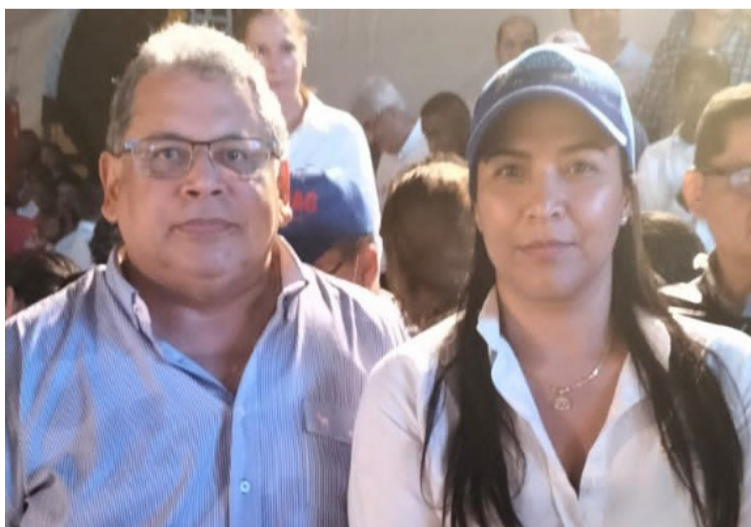
El Hospital Nuestra Señora de los Remedios participó de la primera etapa del programa de Salud Preventiva.

Este programa nacional contribuye a la transformación y armonización del Sistema de Salud de Co-