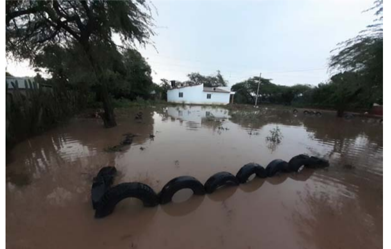
Cada municipio debe adoptar las medidas para disminuir los efectos causados por los fenómenos naturales.

–Ideam– para este año, las lluvias superiores a lo normal continuarán y se intensificarán con el ‘Fenómeno de la Niña’ entre los meses de octubre y diciembre de 2022 en sectores del centro, norte y occidente