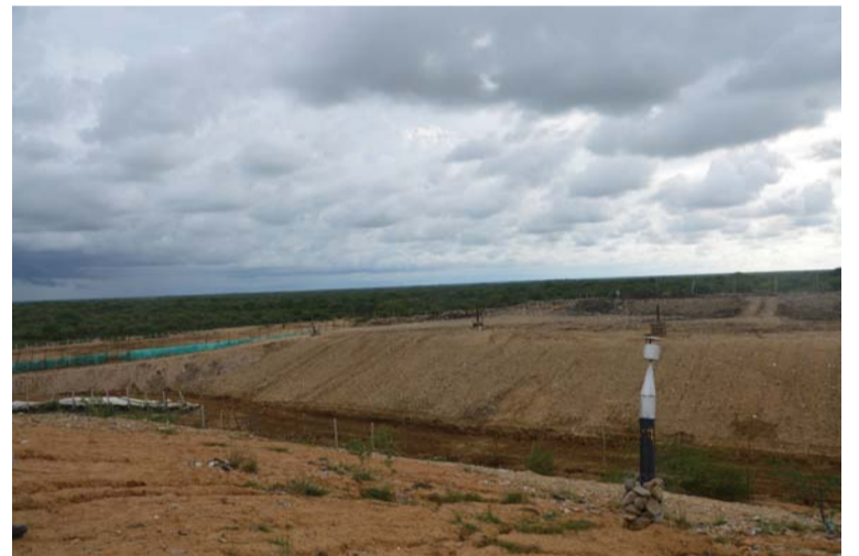
Se argumenta que el cierre del relleno sanitario está causando perjuicio a los usuarios de la empresa Interaseo.

Asimismo, se les informa a la accionada y vinculados que la decisión será proferida dentro de los 30 días siguientes al vencimiento de