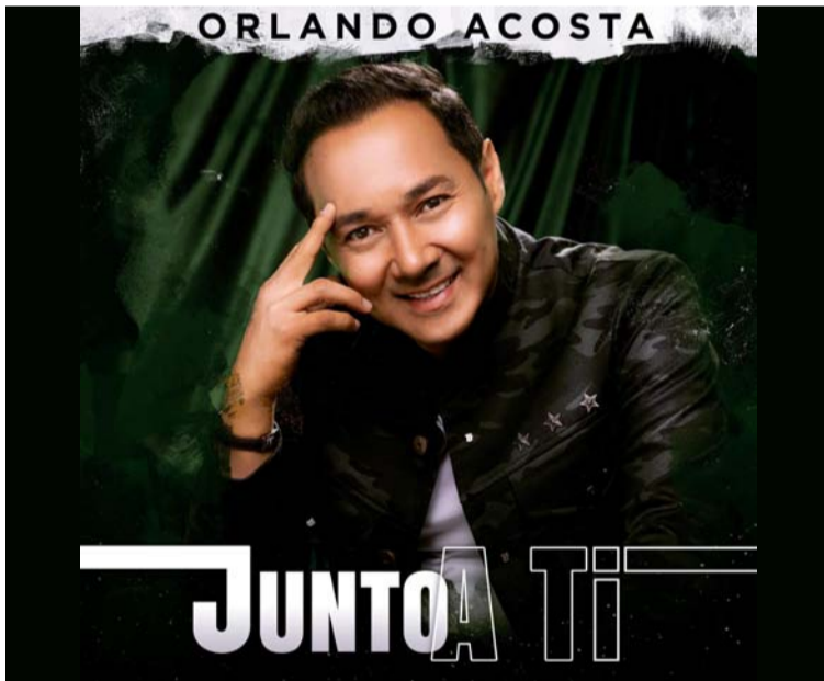
Orlando Acosta es un artista de la música vallenata con gran trayectoria. Ahora promociona el tema ‘Junto a ti’.

Orlando Acosta es un artista de la música vallenata con gran trayectoria,