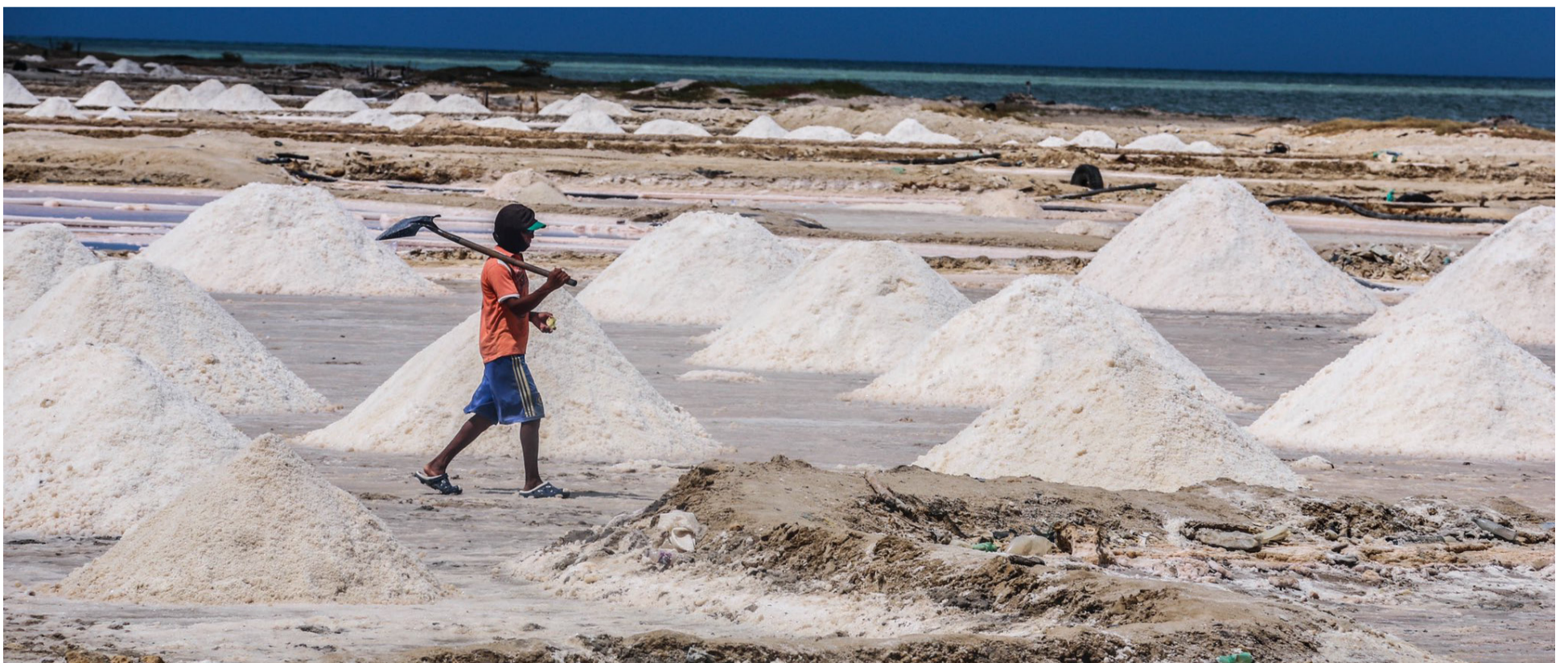
Los denunciantes dan cuenta del robo de la sal y de una crisis económica deliberada que requiere la urgente intervención de los entes de control.

Los denunciantes advierten de otras irregularidades que ocurren en Sama como la expedición de los certificados de origen sin el registro de las toneladas despachadas (espacio con anotación cero).