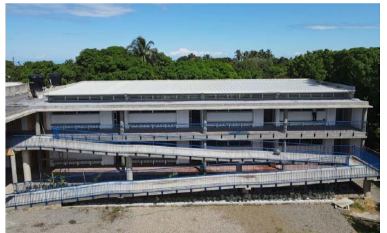
La Institución Educativa Miguel Pinedo Barros de La Punta de los Remedios tendrá otras ocho aulas de clases.