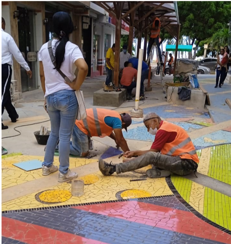
La obra tiene como novedad la instalación de una estructura de madera a lo largo de la calle y acabados en el piso.