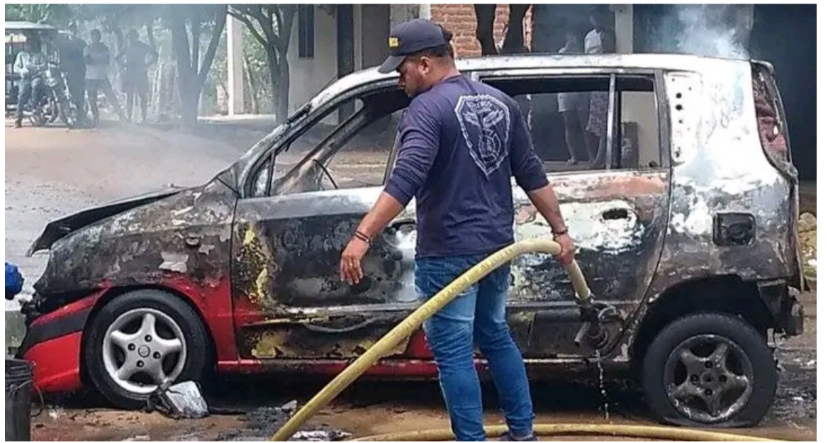
Unidades del Cuerpo de Bomberos debieron atender la emergencia en el taller.

car el fuego hizo presencia el Cuerpo de Bomberos voluntario de Urumita. Las partes afectadas llegaron posteriormente a un acuerdo amigable.