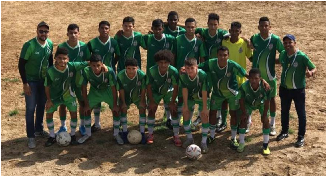
Unión Koram Villanueva venció 2-1 a Juninho en la cancha del 12 de Octubre de Fonseca.

“Un partido difícil en condición de visitante ya que Juninho FC es un Club reforzado y es un equipo que esta para pelear título”, afirmó el DT