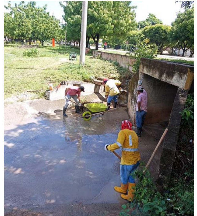
Se intervinieron canales de aguas lluvias del arroyo de Pringamoza, Cerrejón, El Martina, El Lupita y las rejillas de las carreras 3 y 5 con calle 12.

Alcaldía firmó convenio con la comunidad