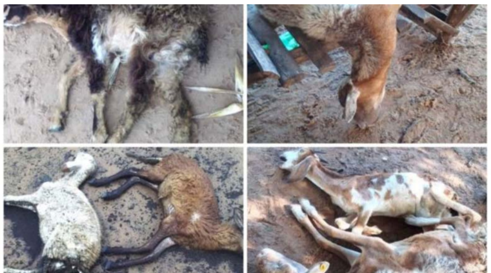
El gerente del ICA en La Guajira envió un parte de tranquilidad a la comunidad.

El gerente seccional del ICA en La Guajira envía un parte de tranquilidad a toda la comunidad del Departamento, especialmente a los habitantes de Maicao, indicando que son totalmente falsas las noticias relacionadas con la presencia de un brote de encefalitis equina venezolana, pues hasta el momento no hay ningún diagnóstico positivo por parte de un laboratorio oficial.