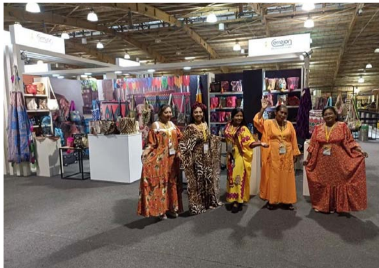
Artesanas de comunidades de Satsapa, Chorrechon, Provincial, Yotojoroin y Riritana, presentes en Expoartesánías.

“Nos alegra poder apoyar a estas mujeres artesanas pertenecientes a comunidades vecinas de Cerrejón. La asistencia a esta feria es una muestra del compromiso que tenemos con la cultura, con la gente, con el fortalecimiento artesanal del pueblo wayuú. Además, es una oportunidad de generación de ingreso para ellas, sus familias y comunidades.