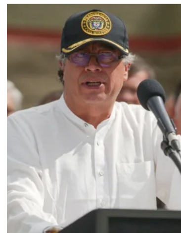
El presidente Petro oficializó el salario para 2023.