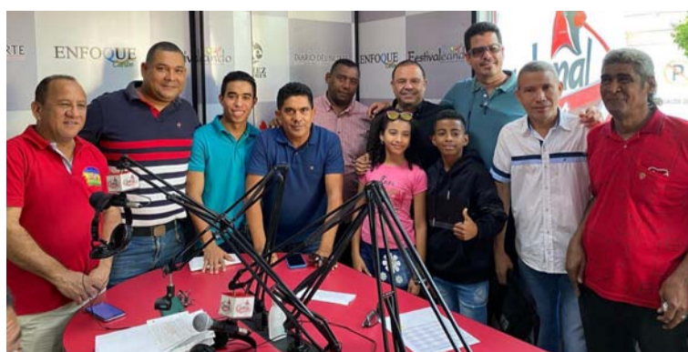
Los premios fueron recibidos por los ganadores de los concursos de las diferentes categorías del festival.