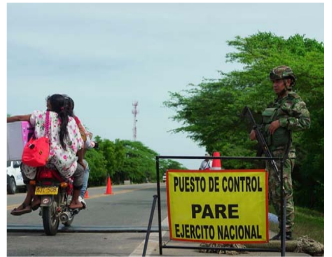
El recorrido llegó a los puntos con el Ejército y la Policía desplegados en los principales corredores viales de entrada y salida del municipio fronterizo.