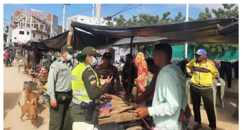
Se hizo llamado a la ciudadanía para que denuncie sitios y personas que fabrican licor de manera clandestina.