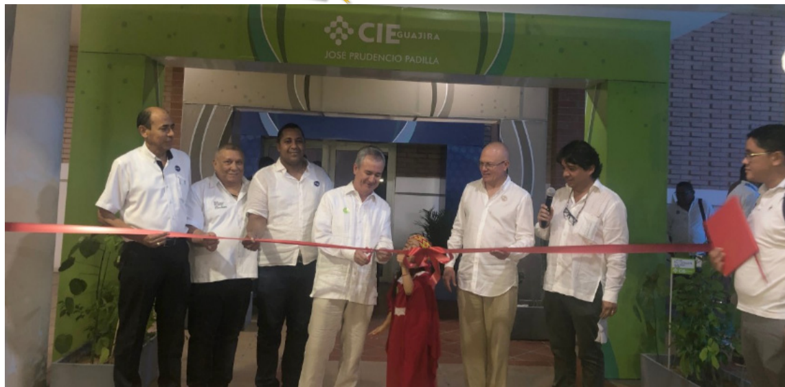
Principales autoridades de Riohacha y el Departamento, presentes en la apertura del Centro de Innovación y Emprendimiento de La Guajira.

En alianza entre varias entidades públicas y privadas