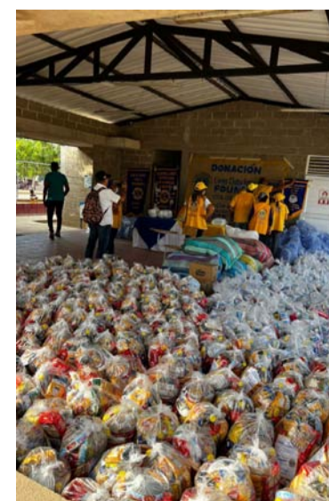
Unas 300 familias se beneficiarán con la donación.

La donación tiene un monto de $10 mil dólares, los cuales fueron otorgados por LCI (Lions Clubs International) y la Fundación de Leones.