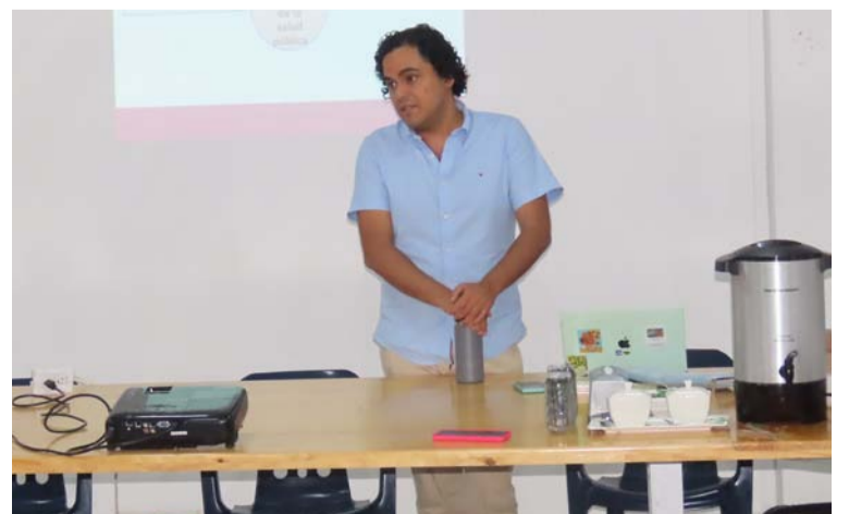
El propósito de la formación en su primera fase fue fortalecer las capacidades del personal de salud de la ESE y de otras entidades.