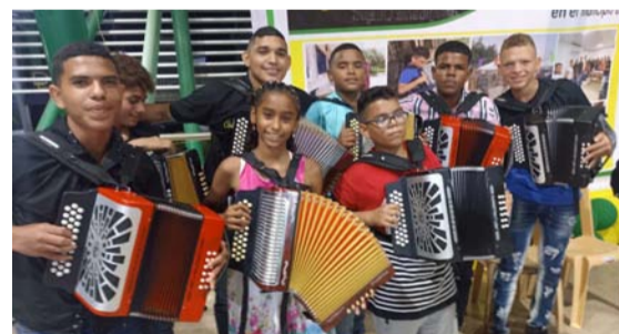
Exposición de pinturas y concierto de acordeones se observaron en la plaza de Albania.