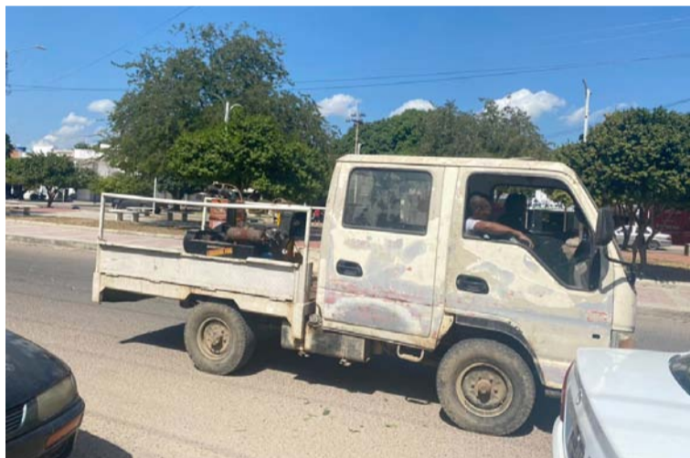
Desde el pasado lunes y hasta el próximo miércoles se estará realizando una fumigación en barrios focalizados.

Cumpliendo los lineamientos emitidos por la Secretaría de Salud de La Guajira, la Alcaldía de San Juan del Cesar conmemoró el martes 27 de diciembre el Día Sin Dengue, que busca generar conciencia en la ciudadanía para que prevengan los criaderos del mosquito Aedes Aegypti, transmisor de la enfermedad.