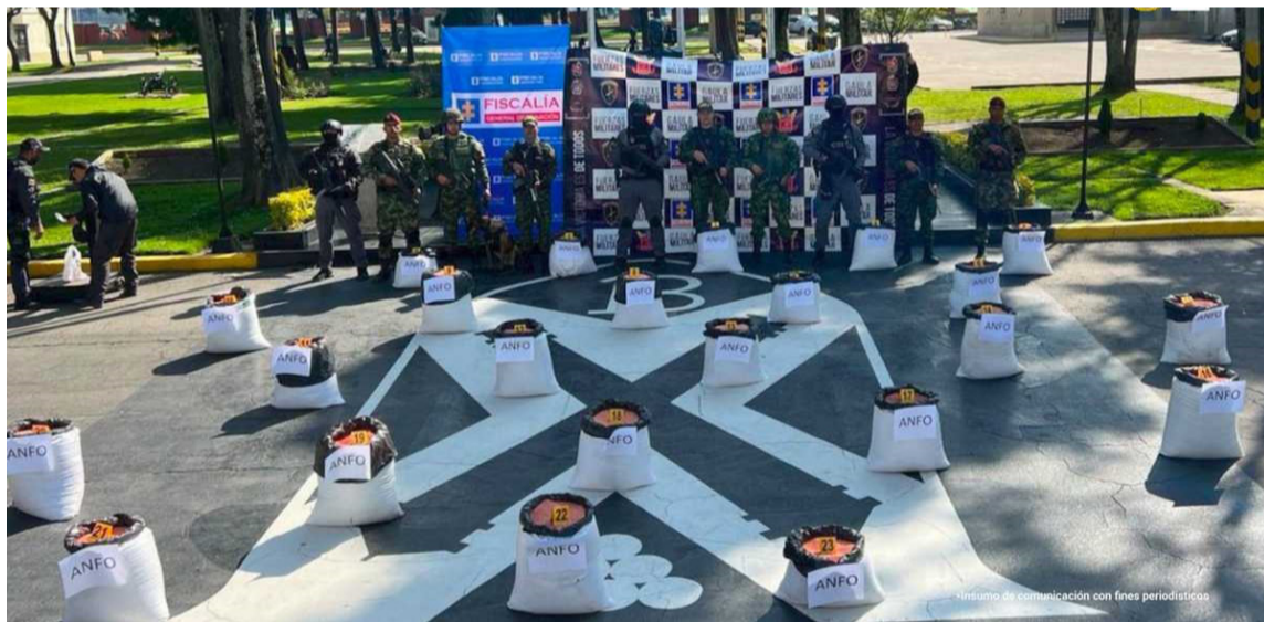
Material explosivo incautado en el barrio Villa Anita, en la localidad de Usme, Bogotá.

La Fiscalía General de la Nación, a través del Grupo de Investigaciones Especiales del CTI, en trabajo articulado con Gaula Cundinamarca y la Brigada XIII del Ejército Nacional, incautó más de una tonelada de explosivo anfo en el barrio Villa Anita, en la localidad de Usme, en el sur de Bogotá.