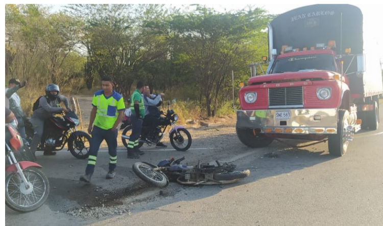
Los hombres se movilizaban en una moto por el sitio 'Cuatro vías del sur', cruce a La Peña, cuando fueron atropellados.

Dos indígenas wiwa resultaron gravemente heridos en un accidente de tránsito ocurrido en la vía que de San Juan del Cesar conduce a La Junta.