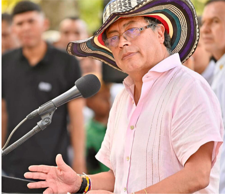
El presidente Gustavo Petro señala que antes que bienestarina, los niños deben ser alimentados con comida.

En ese contexto, Petro confirmó que el Gobierno debe organizarse para saber qué es lo que está pasando con la alimentación de los niños en el país, que