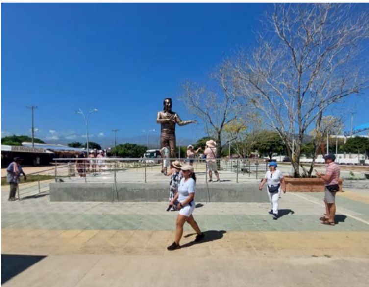
En los alrededores de la imagen de Diomedes Díaz se puede observar a muchos turistas haciendo filas para lograr una foto en el Parque El Cacique.

Allí pueden observar muchas fotografías con imágenes que revelan la vida del Cantautor desde su niñez hasta su muerte y una réplica de la vivienda donde nació y vivió con sus padres Rafael Díaz, Elvira Maestre y familiares los primeros años de su existencia.