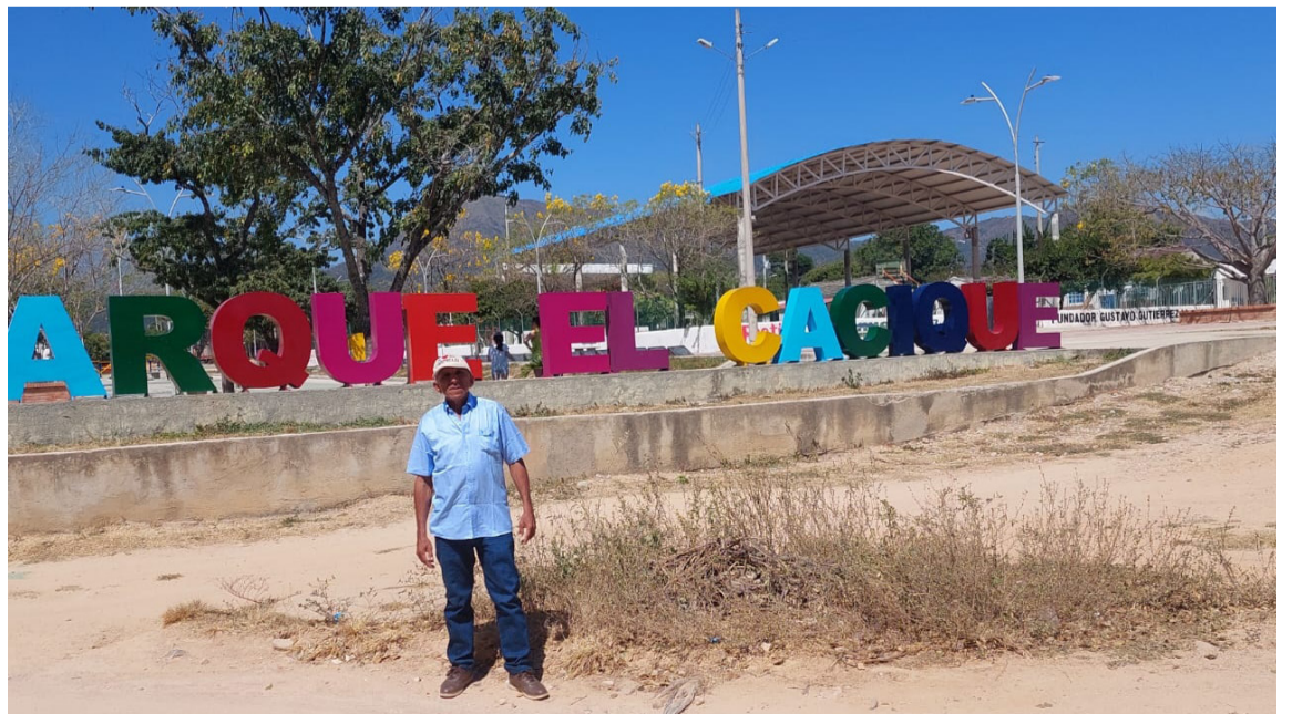
Parque El Cacique, ubicado en La Junta, guarda celosamente la historia de Diomedes.