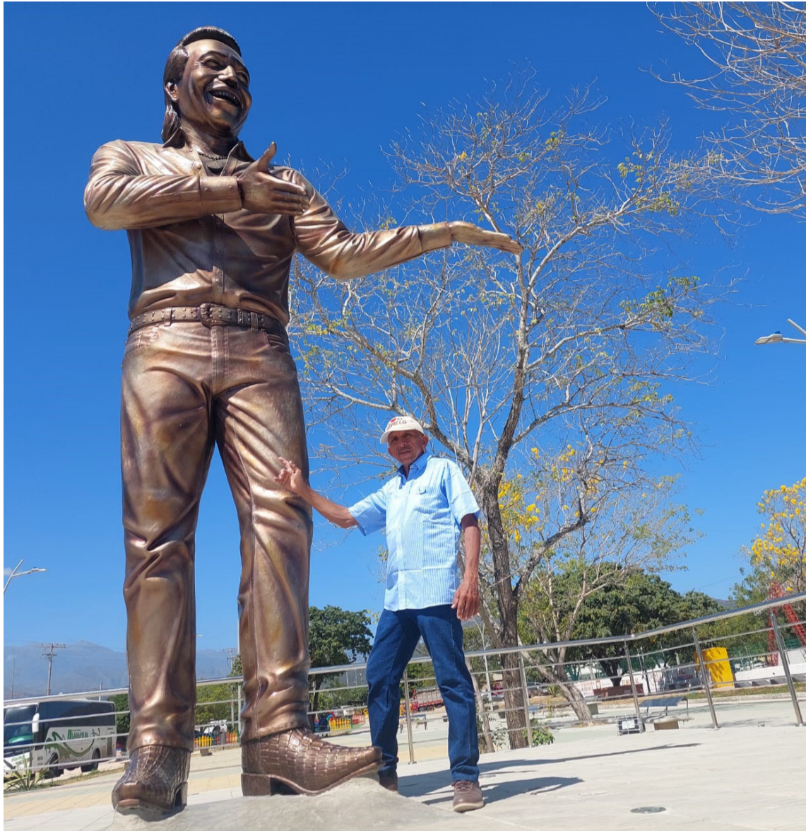
Muchos de los turistas que visitan al corregimiento de La Junta llegan hasta la estatua de Diomedes Díaz con el fin de tomarse fotografías con la gigante imagen del 'Cacique'.