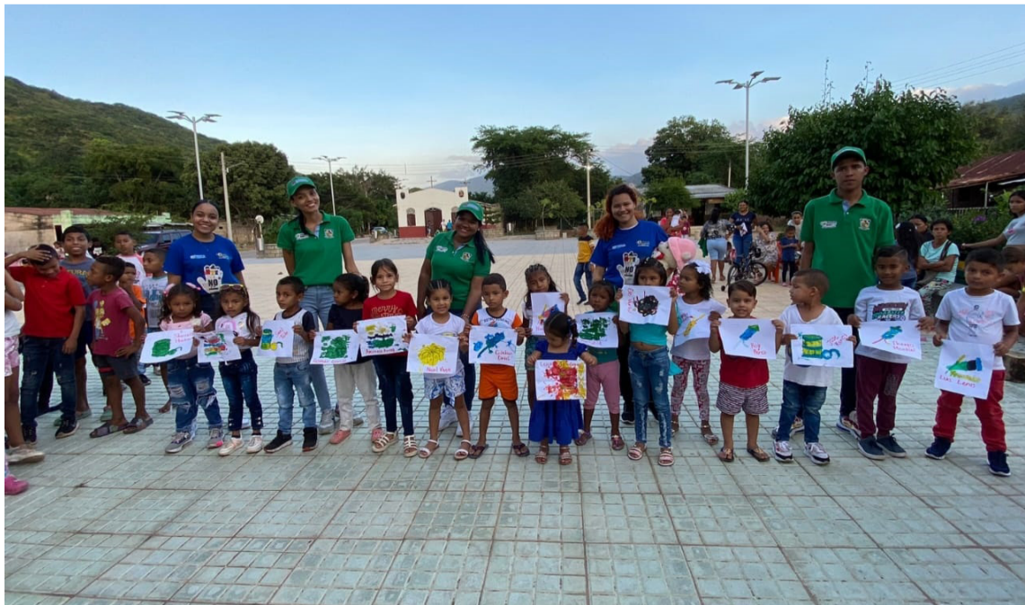
La estrategia está dirigida a los niños, adolescentes, jóvenes y adultos en Albania.

Esta campaña inicia con jornadas recreo preventivas consistentes en zona de libre creatividad a través de la pintura, concursos de baile, tu equili-