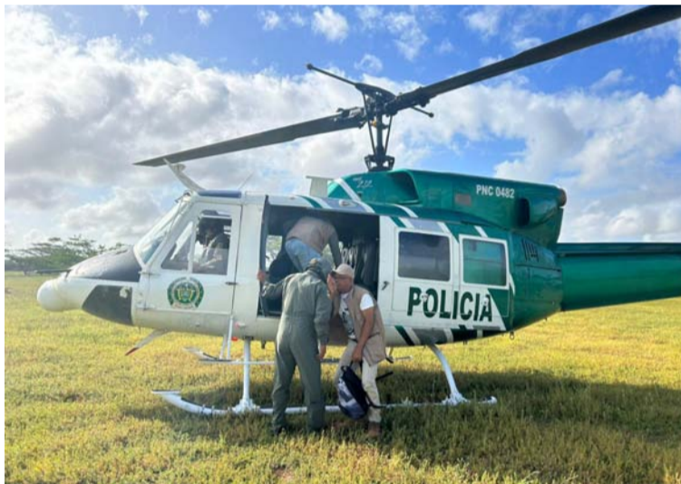
La unidad de búsqueda activa se trasladó hasta Siapana para garantizar el acompañamiento a la comunidad.