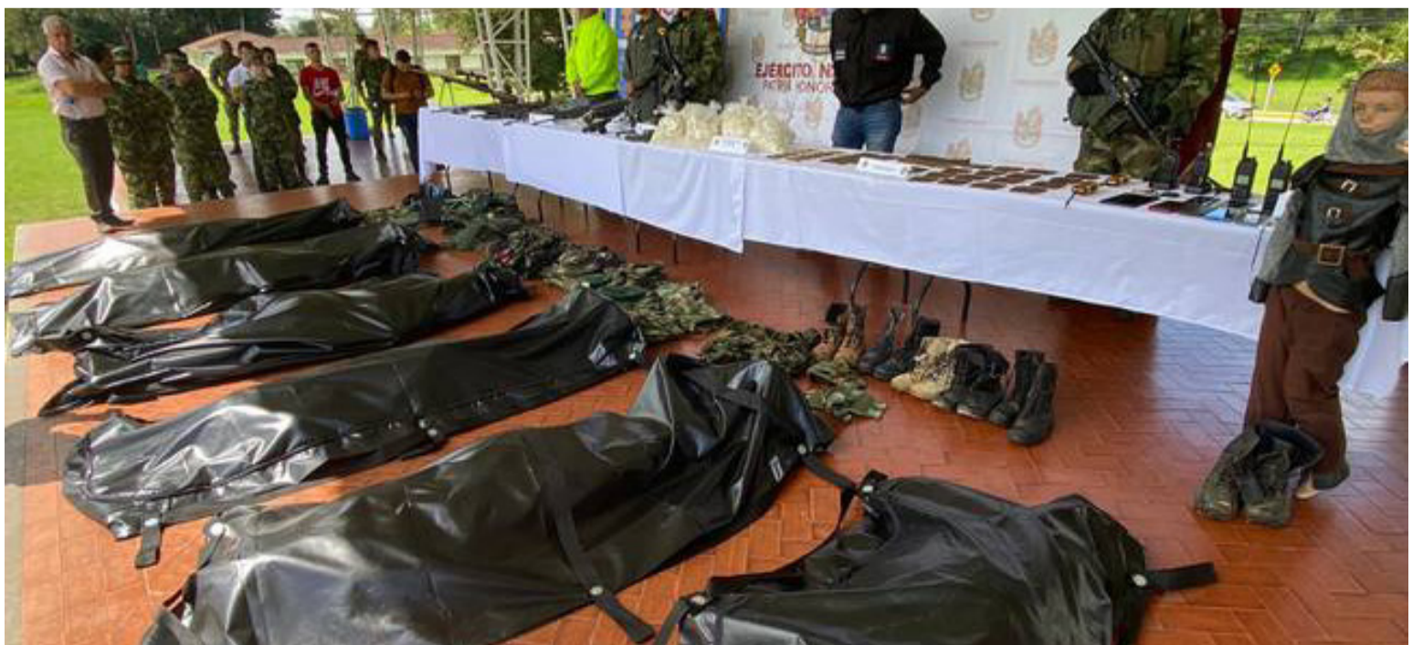
En bolsas negras reposan los cadáveres de los disidentes de las Farc abatidos por el Ejército Nacional en el Cauca.