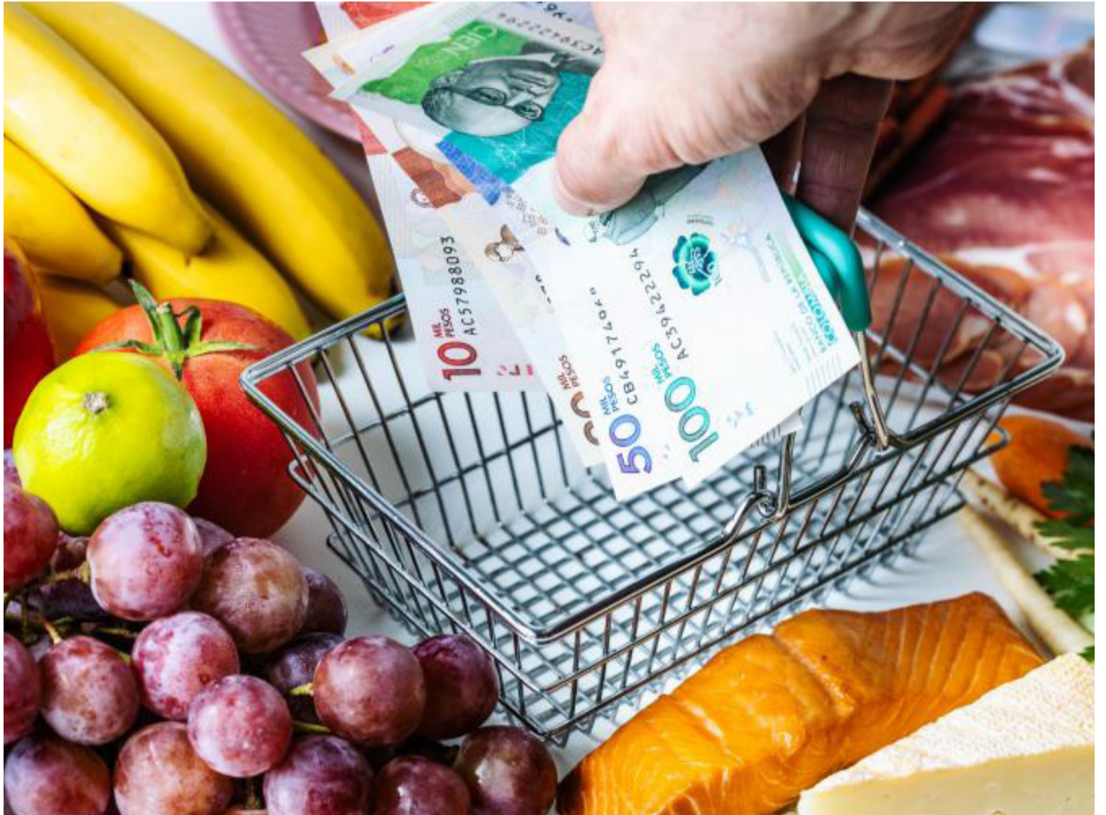
La inflación actual es sin dudas un fenómeno global del que nadie ha escapado luego de la pandemia.

El año 2022 terminó con la inflación más alta de este siglo, con una cifra de 13,12 por ciento, equivalente a 2,33 veces la del año 2021, a pesar de las medidas monetarias implementadas por el Banco de la República. Fue la tercera más alta de América Latina, detrás de Venezuela con 305,7 por ciento, según el Observatorio Venezolano de Finanzas, y de Argentina con una inflación estimada del 95,5 por ciento. Siguen Chile con el 12,8 por ciento y Perú con 8,46 por ciento. Vale la pena destacar que Ecuador, con un 3,7 por ciento, y Bolivia con un 3,1 por ciento, fueron los países con la más baja inflación en