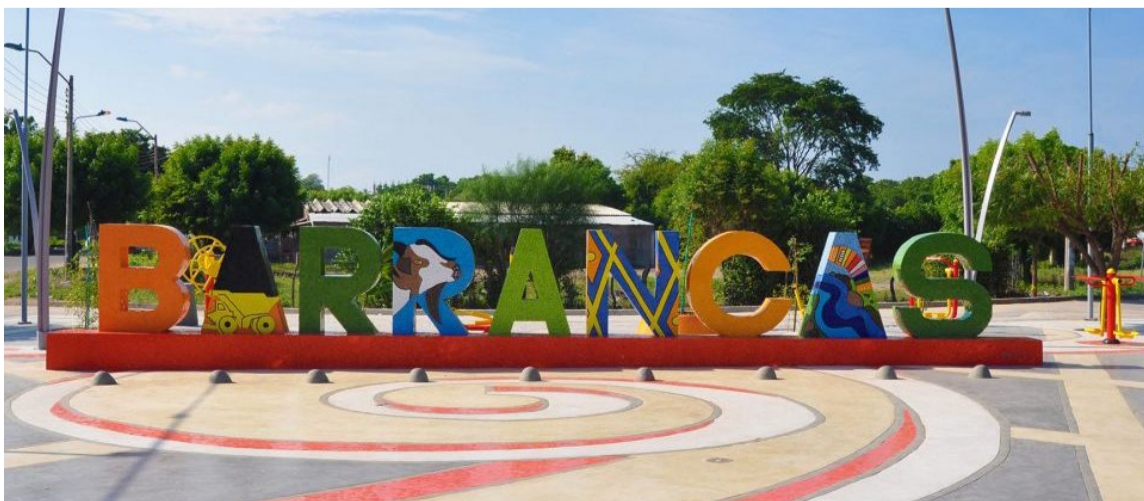
La jornada de atención a las víctimas del conflicto en Barrancas se realizará el lunes.

“La Alcaldía de Barrancas y La Unidad para las Víctimas recuerda que los trámites ante la entidad no tienen ningún costo y que no es necesario recurrir a intermediarios”.