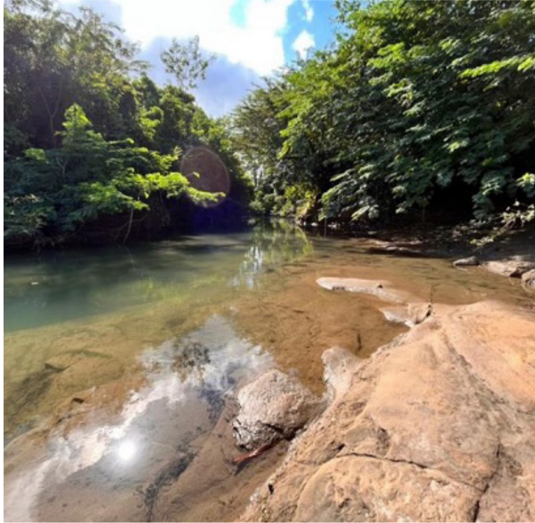
El arroyo Bruno mantiene flujos de agua y el área a su alrededor se mantiene igualmente en buen estado.

“Seis años después de que comenzara el proyecto de modificación parcial, podemos decir con orgullo que el nuevo cauce se ha convertido en un corredor de biodiversidad de 24 kilómetros que va de la re-