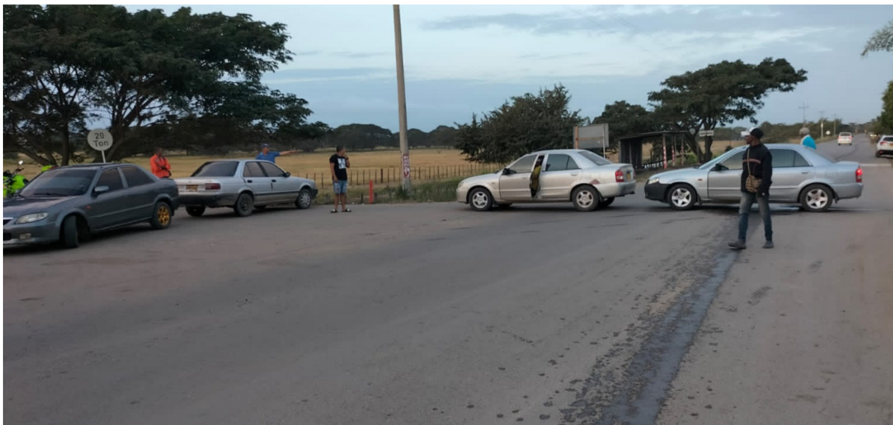
Los conductores bloquearon por aproximadamente 6 horas, la vía que de Riohacha conduce a Cuestecita y Albania con Maicao.