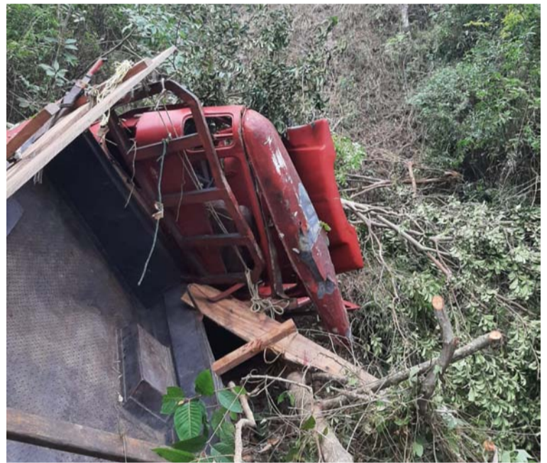
La camioneta quedó totalmente destruida debido a que cayó en un abismo de aproximadamente 30 metros.