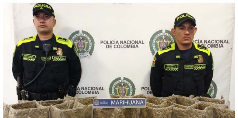
La marihuana fue entregada a la Fiscalía General con el fin de que se haga la investigación correspondiente.