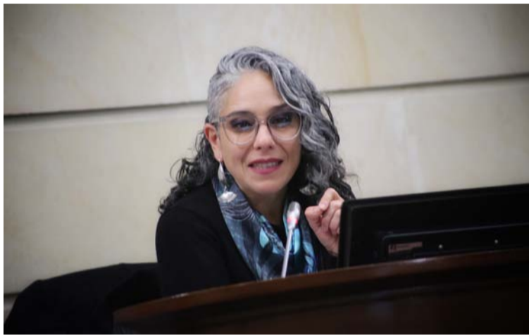
La senadora María José Pizarro es la presidenta de la Comisión para la Equidad de la Mujer en el Congreso.