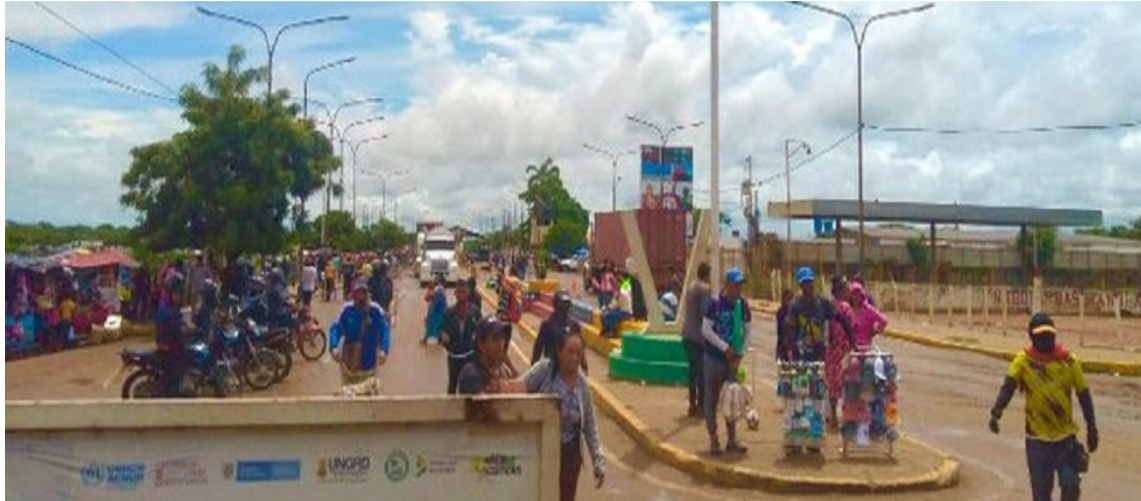
Los pasajeros provenientes de territorio venezolano deben quedarse en La Raya.

Entre los requisitos que exige el Ministerio de Transporte de Colombia para permitir el paso vehicular desde Venezuela hacia territorio nacional, está que los vehículos no tengan más de 20 años de circulación, estar debidamente registrados en una empresa, contar con la habilitación de la misma, tener vigente el Seguro Obligatorio de Ac-