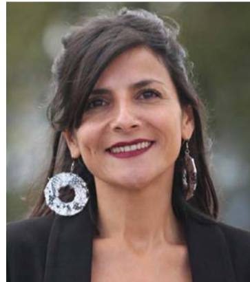
Irene Vélez, ministra de Minas y Energía.

Dijo que adicionalmente se tendrá un aumento en la sobretasa del 12.53%, por lo que el galón estará muy cerca a los once mil pesos.