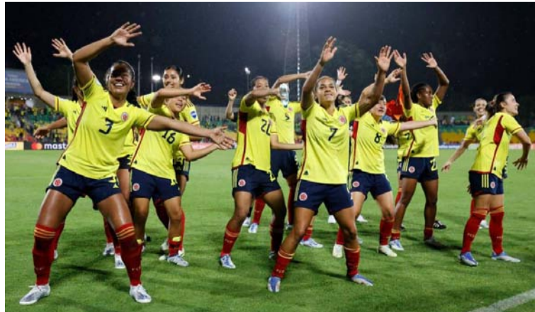
Los seleccionados femeninos de fútbol de Colombia son conformados en su mayoría por jugadoras del medio local.

no sabe de dónde salen rumores de que no se hará una liga corta, pues enfatizó que uno de los objetivos del Gobierno del presidente