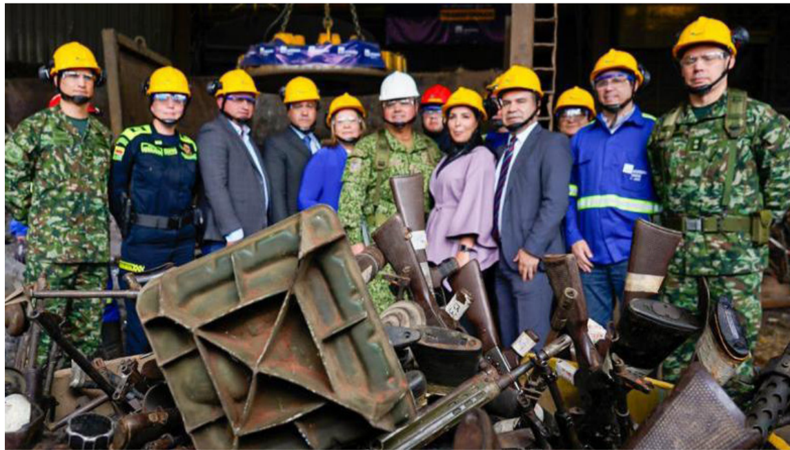
El armamento fue incautado en operaciones contra grupos armados y delincuencia común.