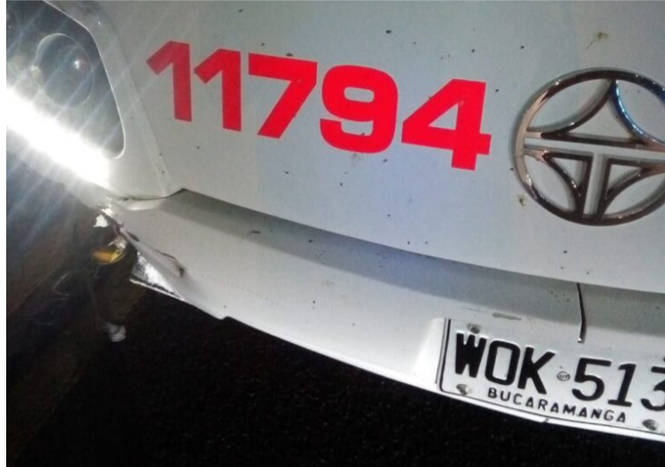
El bus cubría la ruta Barranquilla- Maicao cuando colisionó contra la moto en la que se desplazaba el policía.

El accidente tuvo lugar la mañana de ayer viernes cuando el uniformado adscrito a la vigilancia del cuadrante del barrio Los Laureles, fue embestido por el vehículo de pasajeros.