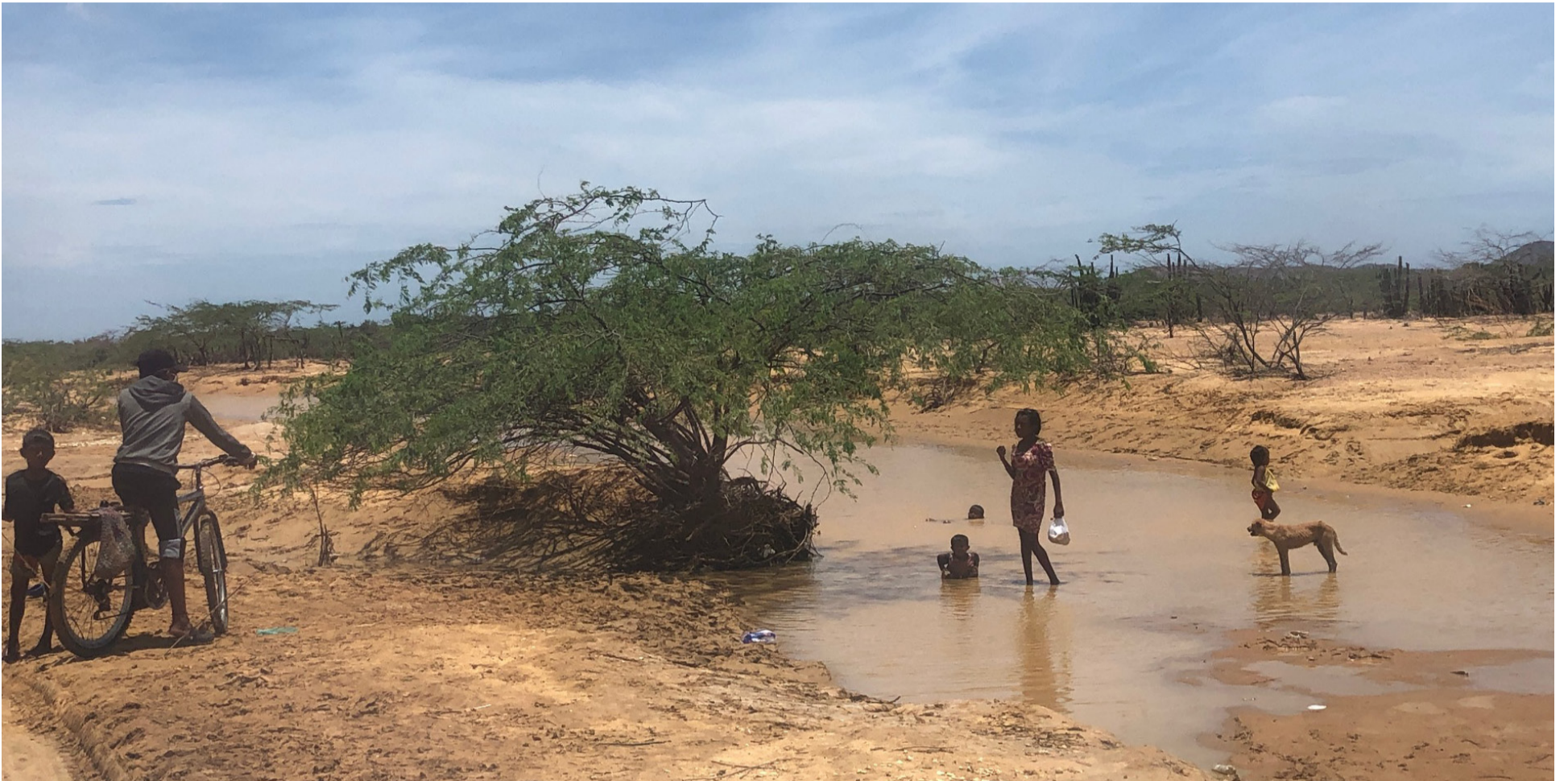
El Gobierno, como solución a la problemática de la desnutrición en nuestro Departamento, presenta como fórmula una 'Gerencia para La Guajira'.

Existen mecanismos jurídicos para hacer valer nuestros derechos