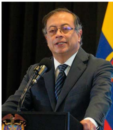
Gustavo Petro, presidente de Colombia.

Mientras tanto, el presidente Gustavo Petro ordenó el envío de una comisión especial del Instituto Colombiano de Bienestar Familiar –Icbf– y de la Presidencia de la República, con el fin de atender las denuncias, y afirmó que se deben adelantar todas las investigaciones pertinentes para dar con los