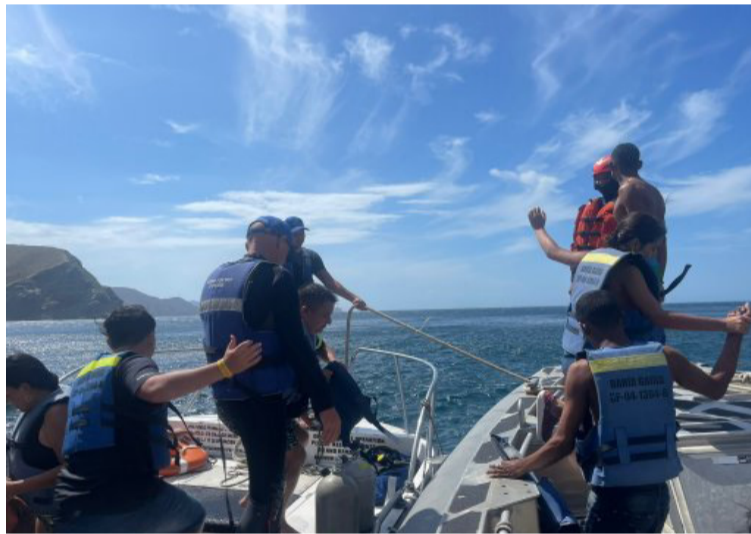
La operación de búsqueda y rescate inició tras recibir el llamado por parte de la embarcación 'Bukarú'.

La operación de búsqueda y rescate inició tras recibir el llamado por VHF Marino al Sistema de Control de Tráfico y Vigilancia Marítima de Santa Marta por parte de la embarcación 'Bukarú', informando la emergencia, luego de quedar a la deriva al parecer por fallas de la maquinaria, con ingreso de agua.