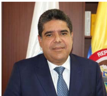
Carlos Hernán Rodríguez, contralor de la República.

Se conoció que se trata de una serie de investiga-