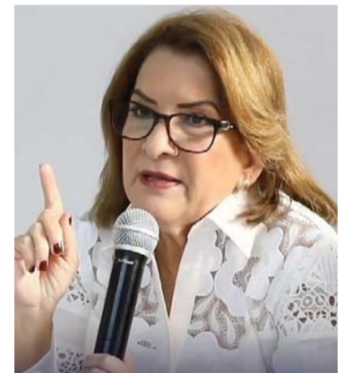
Margarita Cabello, procuradora General.

“Por esta razón, un equipo nacional de las Delegadas para la Niñez y para la Mujer han venido adelantado esta semana una labor especial de verificación de