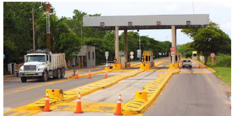
El ministro de Transporte, Guillermo Reyes, aclaró que los peajes a los que se refiere son de carácter nacional.

“Vamos a revisar cuáles son los que han subido, pero no hay incremento, tendrán que regresar al valor actual. Cuando hablamos de los peajes de la ANI hablamos básicamente de los peajes de concesiones viales. Hay unos peajes que tie-