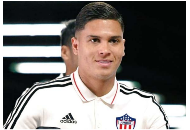
Juan Fernando Quintero retorna al fútbol colombiano defendiendo los colores del Junior de Barranquilla.

Ahora, es importante que este sí que ha sido un caso aparte en materia de fichajes en el fútbol colombiano,