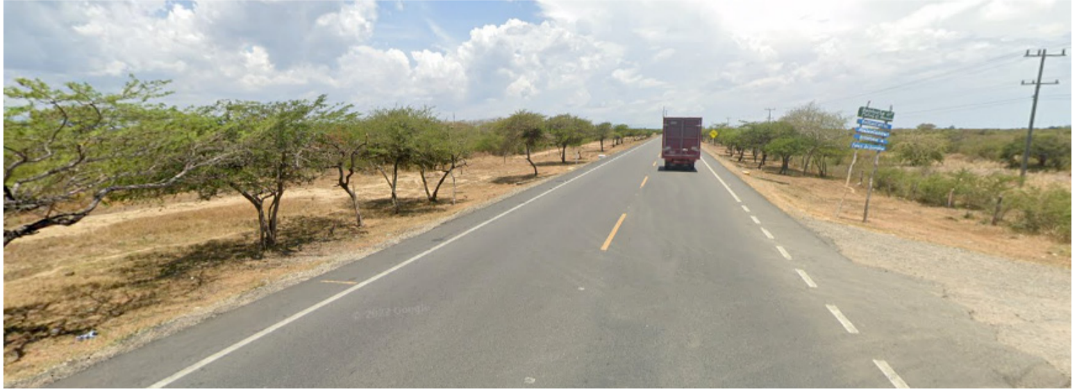
El macabro hallazgo fue alertado por una persona que transitaba por la entrada de la comunidad Puerto Caracol.