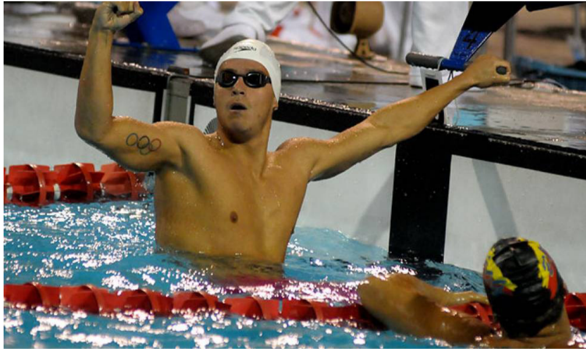
Según la Contraloría, las obras de los Juegos Nacionales presentan un retraso del 77%.

acerca de los juegos nacionales fueron las siguientes: