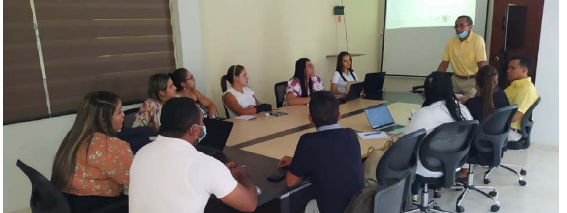
El encuentro se llevó a cabo en la sala de juntas del Palacio Municipal de San Juan.

Asimismo, manifestó su intención de ejecutar acciones que permitan mejorar la calidad de vida de los habitantes de las zonas urbana y rural.