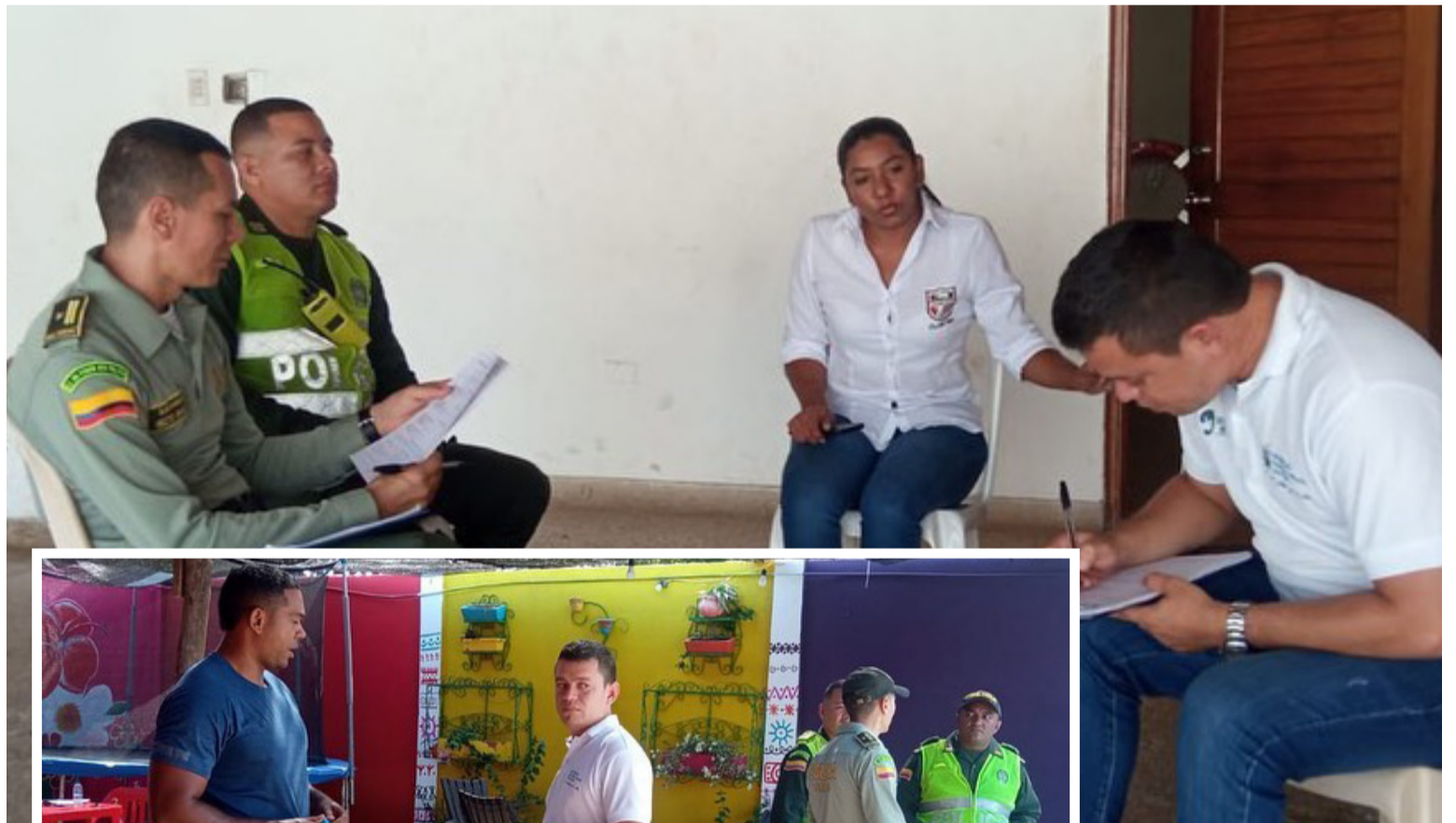
Policía de Turismo durante las visitas a los establecimientos con servicio de piscina.

Durante el desarrollo de la campaña de prevención, se les indicó a los administradores de los establecimientos que se está trabajando en pro de un turismo seguro y saludable.