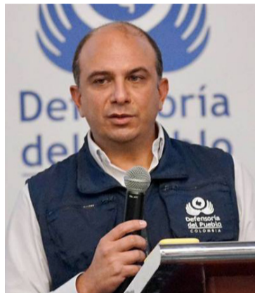
Carlos Camargo, defensor del Pueblo.

Al respecto, la directora general del Icbf, Concepción Baracaldo, manifestó que “es repudiable y doloroso que este tipo de situaciones que afectan y atentan con la vida e integridad de la niñez se presente, desde el Gobierno Nacional no escatimaremos en esfuerzos para que la violencia sexual no siga acabando con los