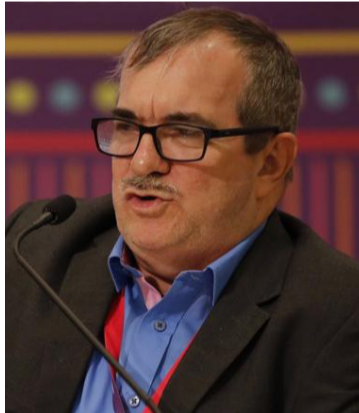
Rodrigo Londoño era ‘Timochenko’ en las Farc.

Londoño, conocido en sus tiempos de guerrillero con el alias de ‘Timochenko’, agregó: “De este modo, estaré presto a conversar con usted, Antonio, si así lo desea, en el lugar y condiciones que el Gobierno del presidente Gustavo Petro y las autori-