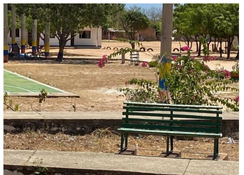
El proyecto de construcción y repotenciación de redes eléctricas entrará en ejecución en los próximos días.