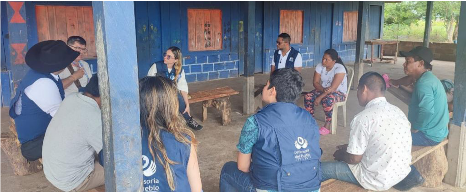
La Defensoría del Pueblo también llamó la atención a entidades del Estado por la falta de respuesta a vulneraciones de comunidades en Guaviare.