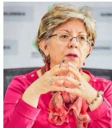
Concepción Alvarado, directora del Icbf.

El Icbf anuncia que se buscará trabajar de manera pronta con la Consejería para las Regiones y con la Fiscalía General de la Nación para esclarecer los hechos ocurridos en el Guaviare.