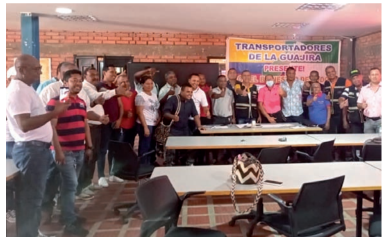
Los transportadores solicitan a las autoridades realizar mesas técnicas para solucionar sus peticiones.

Cabe señalar que la actividad se llevó a cabo en Bogotá D.C. durante los días 12 y 13 de enero de 2023, en las instalaciones del Jardín Botánico José Celestino Mutis.