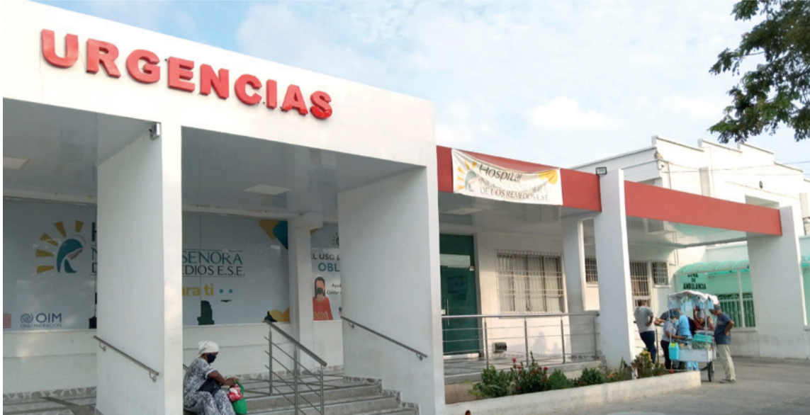
El Hospital Nuestra señora de Los Remedios hace un llamado a extremar las medidas.

El número de casos de dengue ha comenzado a aumentar en comparación al periodo de anualidad anterior, a través del área epi-