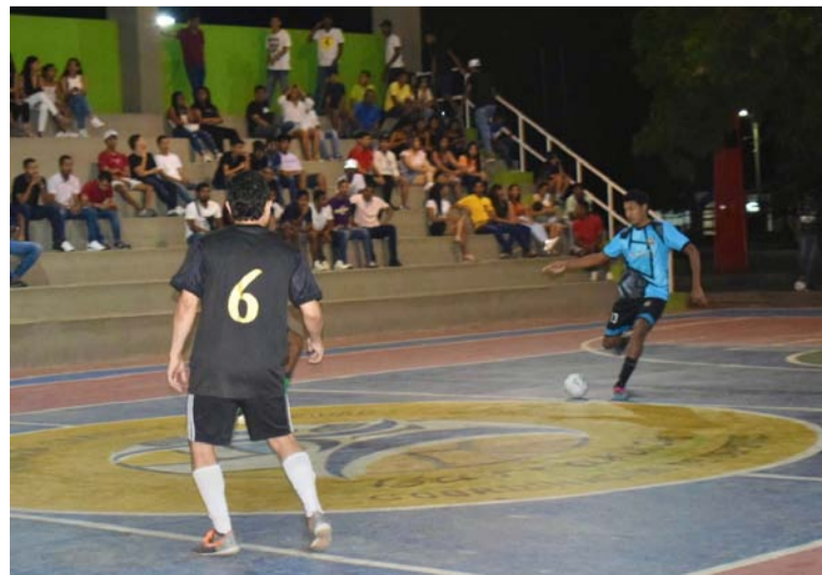
La apertura del primer torneo vacacional de microfútbol 2023 tuvo lugar en el parque Romero Gámez y Redondo.