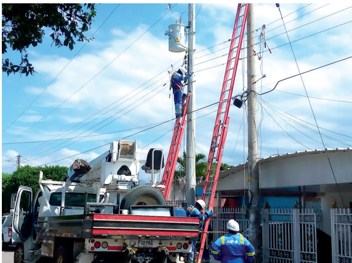
Los trabajos fueron ejecutados en la calle 5 entre carreras 13 y 14 del barrio Las Delicias.

Las cuadrillas de la empresa reemplazaron un transformador y retiraron los de apoyo que se encontraban en mal estado. Asimismo, realizaron mantenimientos en podas de árboles.