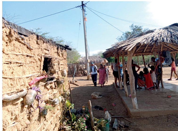
Las llamas consumieron todos los enceres de la casa, como camas, colchones entre otras.

Hasta el sitio llegaron los socorristas de la Defensa Civil y el Cuerpo de Bomberos Voluntarios de Barrancas, a atender la emergencia.