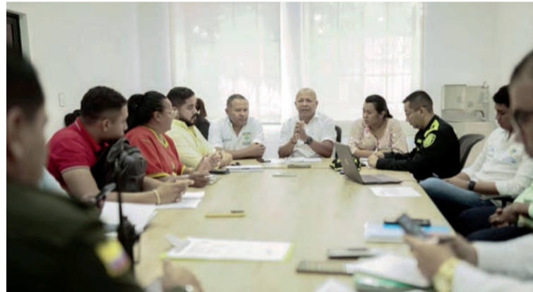
Tras el consejo de seguridad, la Alcaldía y Gobernación ofrecen una recompensa por información de los delincuentes.