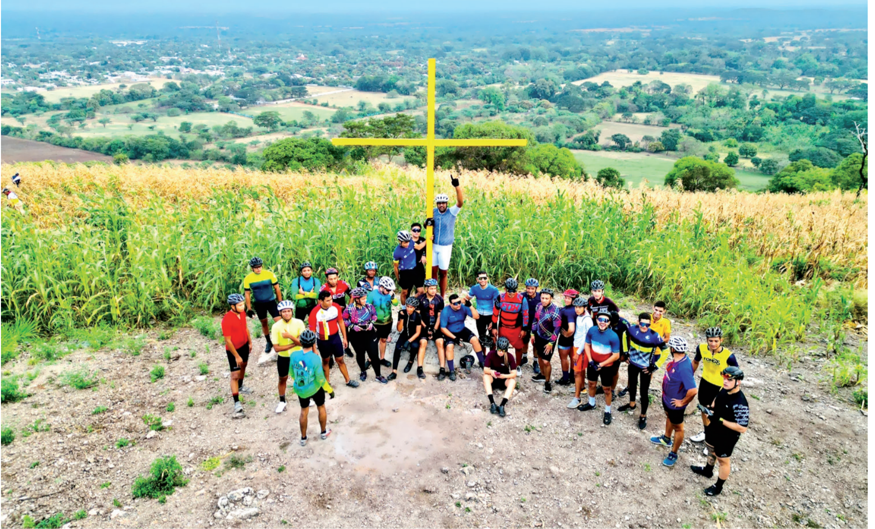
La Cruz Molinera y su entorno son lugares de reflexión para apreciar la obra de la creación y también para la práctica del sano ejercicio.