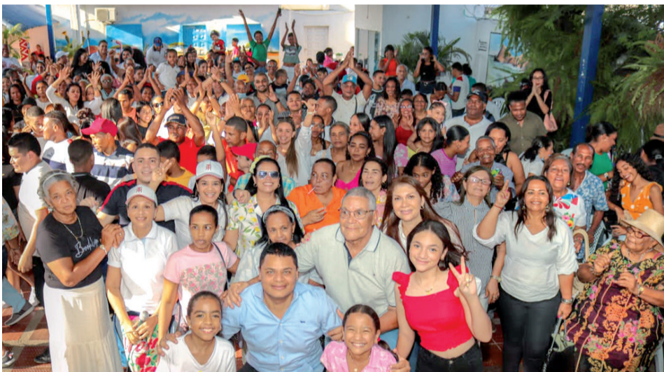
En medio de abrazos y saludos emotivos, se rindió homenaje a los mayores, a los hombres y mujeres que con tesón sacaron adelante a sus hijos.

De la misma manera, la comunidad riohachera ha manifestado empatía con el nombre del cirujano, diciéndole sí a su candidatura para ser elegido alcalde en octubre del presente año.