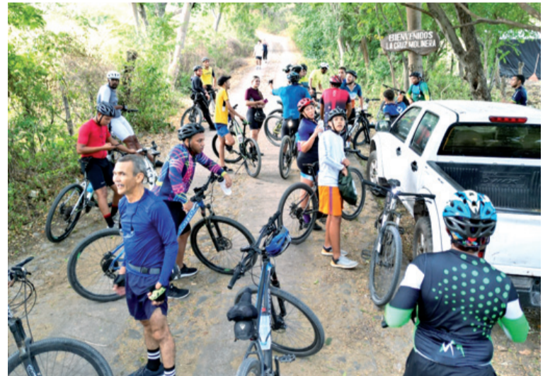
Cientos de turistas semanalmente llegan hasta el cerro guardián del terruño para demostrar su fe.

Este símbolo con el pasar de las semanas se fue convirtiendo en un sitio