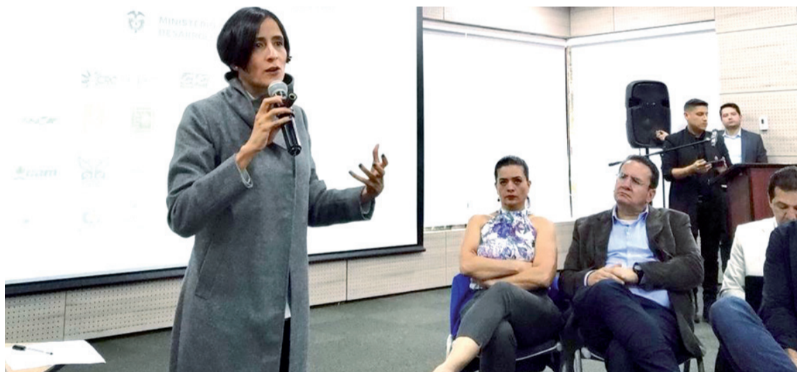
La ministra de Ambiente y Desarrollo Sostenible, Susana Muhamad, lideró el encuentro.

Armonizar y orientar las prioridades previstas en el Plan Nacional de Desarrollo ‘Colombia Potencia Mundial de la Vida 2022 -2026, fue el objetivo principal del primer diálogo interinstitucional del Sistema Nacional Ambiental –Sina– el cual fue liderado por la ministra de Ambiente y Desarrollo Sostenible, Susana Muhamad González.