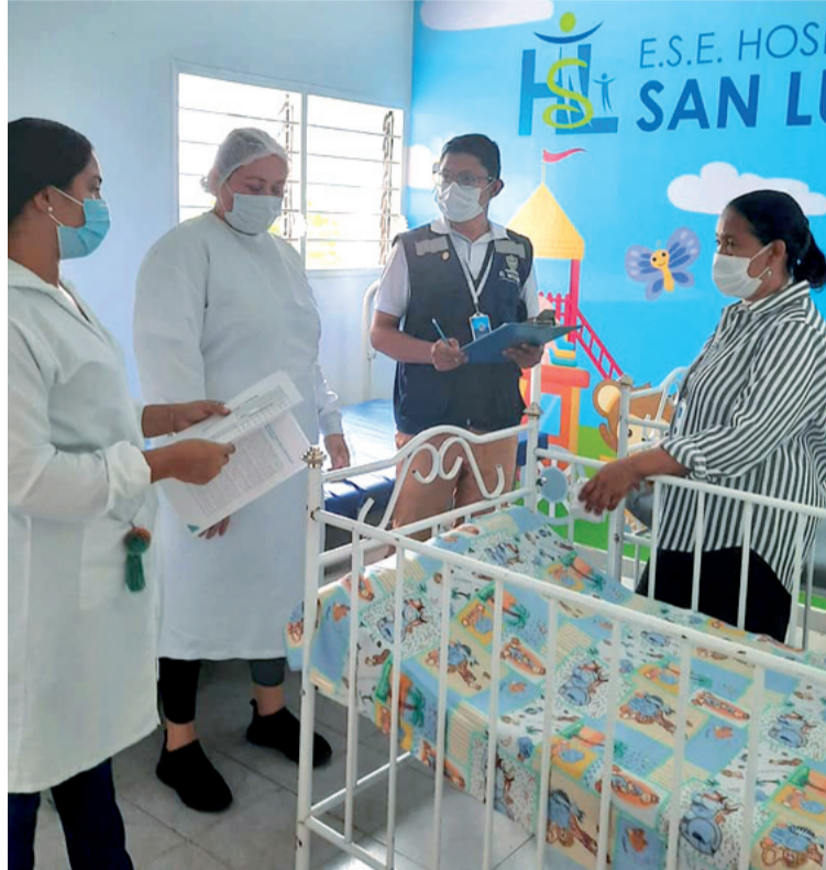
La ejecución de este proyecto, es un arduo trabajo mancomunado durante cerca de cuatro años.