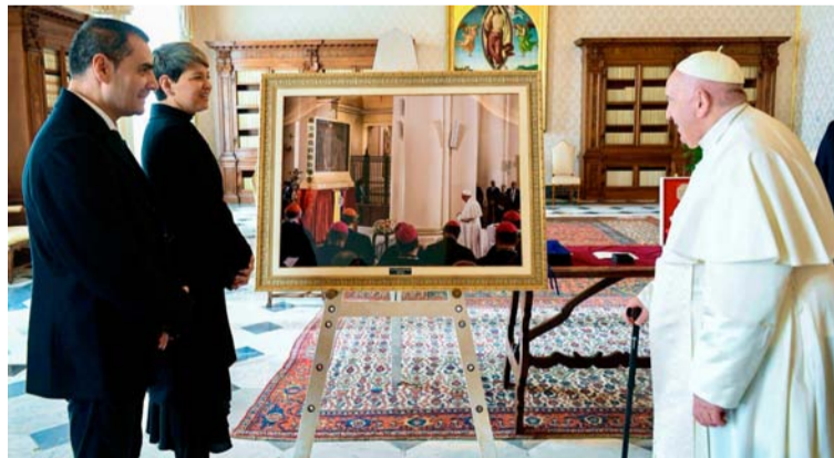
La primera dama también ofreció un ejercicio fotográfico de más de 27 años, del fotógrafo Mauricio Vélez.

La foto muestra al Papa Francisco en actitud reverencial, a unos pocos pasos de un óleo de Nuestra Señora del Rosario de Chiquinquirá, durante su visita a Colombia. Es una instantánea excepcional, captada en septiembre del 2017, en la que se percibe el silencio que reinó en el recinto religioso mientras el Sumo Pontífice expresaba su devoción.