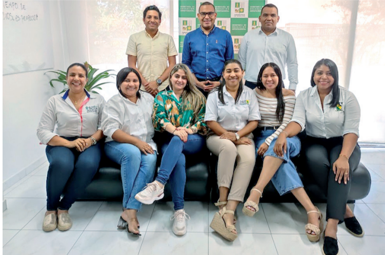
La Gobernación y la Secretaría de Educación Departamental garantizan servicios para los menores guajiros.

la administración departamental contrató como operador de este servicio complementario de educación a la Unión Temporal Costa Caribe, por un costo de 18.953.420.367 millones de pesos.