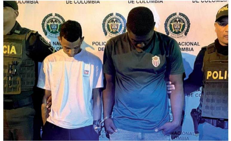
Los capturados fueron dejados a disposición de las autoridades correspondientes por el delito de homicidio.

ción técnica profesional en balística se analizarán los proyectiles de esta arma de fuego para ver la participación en otros hechos presentados en el municipio.