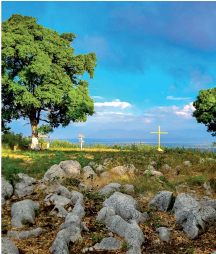
La cruz de metal, de color amarillo, es visible desde algunas calles del área urbana de El Molino.

En medio de ese encanto natural se siente la presencia de El Creador, y se congratula el espíritu con la