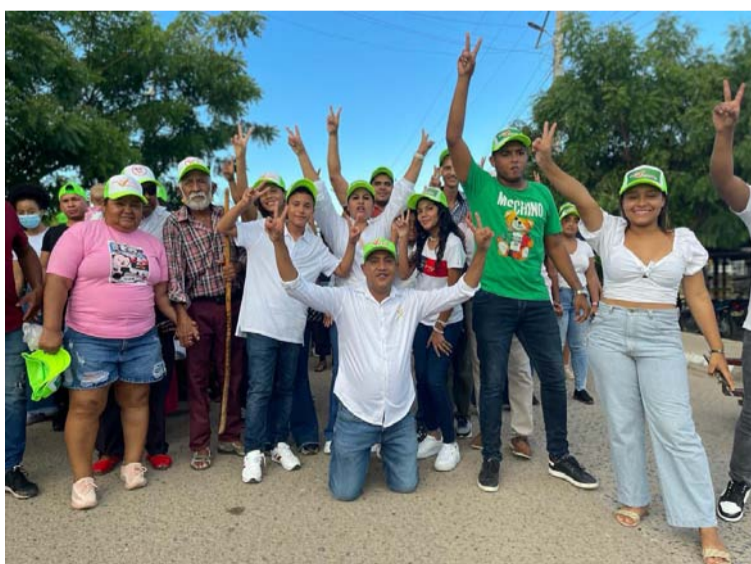
Junto a su familia se trasladó para Albania, donde también se comió las verdes.