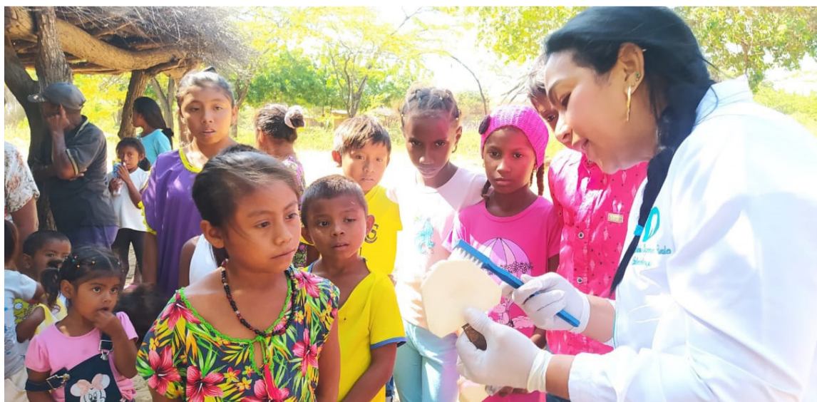
Dos grupos extramurales semanalmente visitan a las comunidades étnicas en Maicao.

La ministra de Salud y Protección Social Carolina Corcho, en coordinación con la Supersalud vienen adelantando seguimiento al trabajo de las entidades de salud en materia de atención a las comunidades wayú de La Guajira.