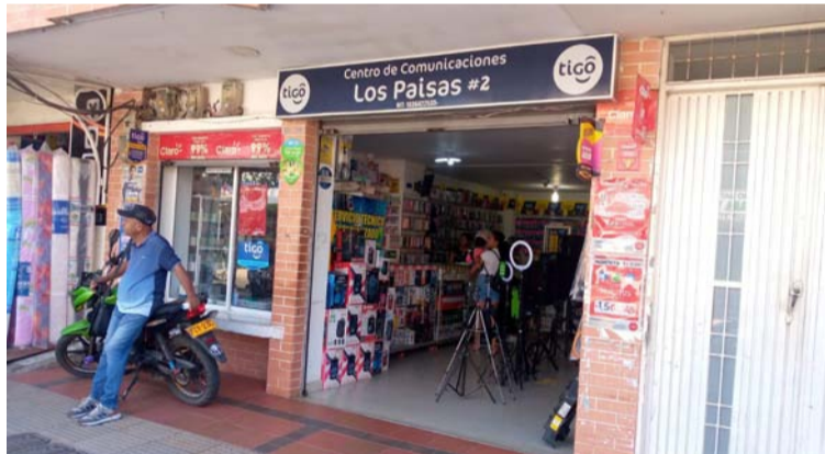
A plena luz del día los delincuentes asaltaron este local de venta de celulares en el municipio de Villanueva.

“Nos duele ver que las autoridades no patrullan el sector comercial