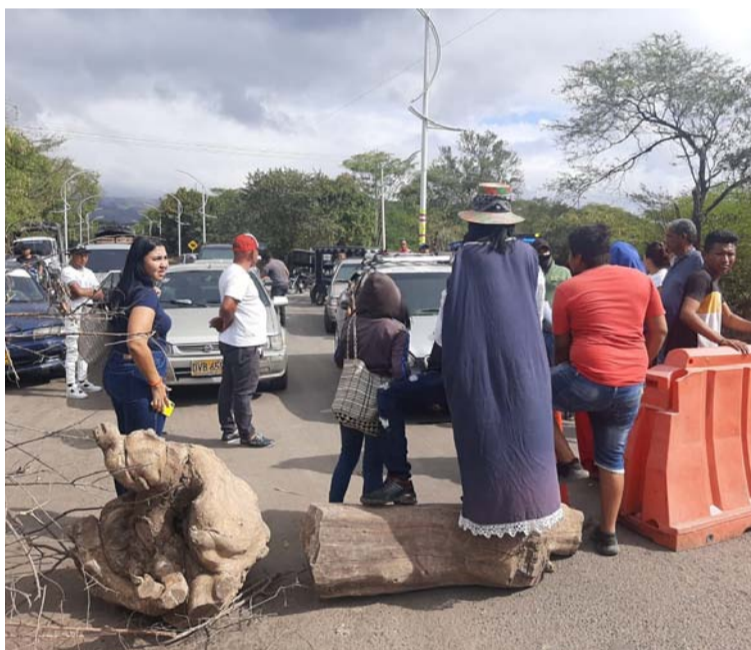
Las comunidades se tomaron las vías en 'La Crítica', Puente Negro y San Francisco, entre Hatonuevo y Barrancas.

de estos dos componentes de la canasta educativa, se ha generado incertidumbre y preocupación en toda la comunidad educativa, preocupación que se viene presentando desde hace varios años sin que los diferentes gobiernos hayan encontrado la solución definitiva.