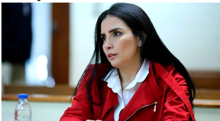
La excongresista Aida Merlano se halla en Venezuela desde 2019 y ya fue pedida su extradición por Colombia.

Merlano, quien se fue a ese país en octubre de 2019 tras un mediático escape, pidió al Gobierno de Gustavo Petro tramitar su extradición desde Venezuela y, desde ese momento, a través de la embajada en Caracas, se