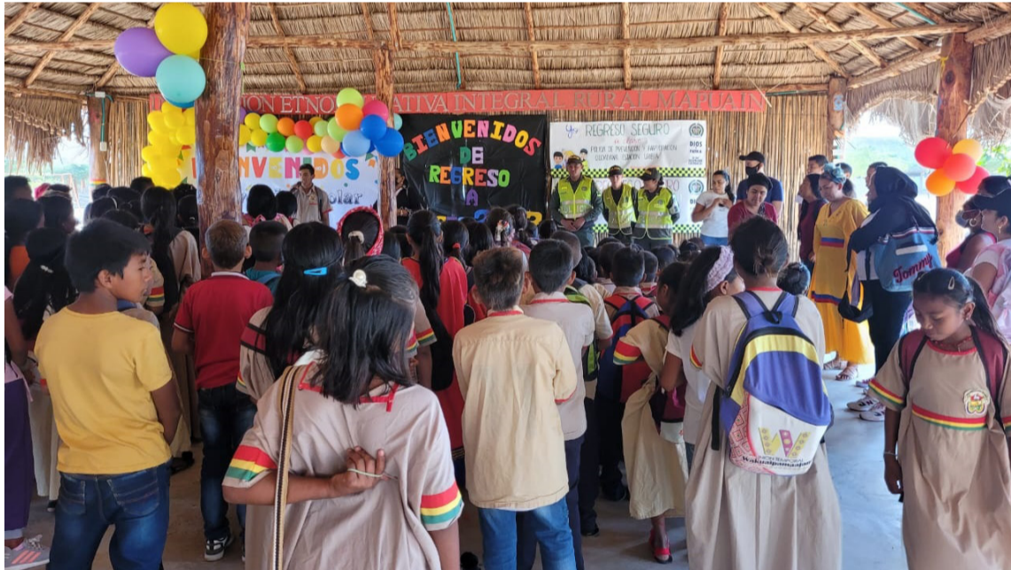
La jornada se realizó en la comunidad Mapuain, sobre el kilómetro 72 vía a Maicao.

La jornada se realizó en la comunidad Mapuain, sobre el kilómetro 72 vía a Maicao, en donde un grupo de policías ofrecieron recomendaciones ante el retorno a clases, como fomentar el