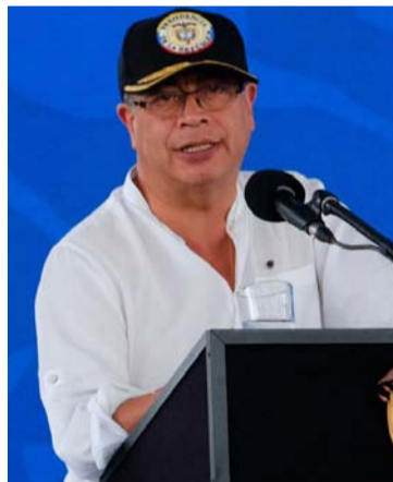
Gustavo Petro Urrego, presidente de Colombia.

“El proyecto tiene un pilar, que tiene varios puntos esenciales, sin el cual no hay un cambio en la salud. Esto no es simplemente mejorar la latonería, no es que entra a latonería y pintura el sistema de salud. Ha entrado como 10.000 veces desde que yo soy congresista. Nunca ha podido salir algo que genere estructu-