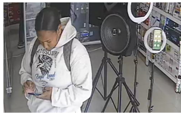
En video quedaron registrados los rostros de los asaltantes al almacén de venta de celulares en Villanueva.