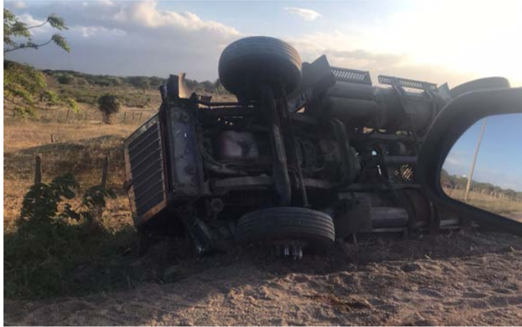
Camión que se volteó ayer en la vía Riohacha-Cuestecita, presumiblemente por el mal estado de la carretera.

“Íbamos pasando por el lugar, vimos como las personas con todo tipo de implementos se estaban llevando el combustible, aún las autoridades policiales no se en-