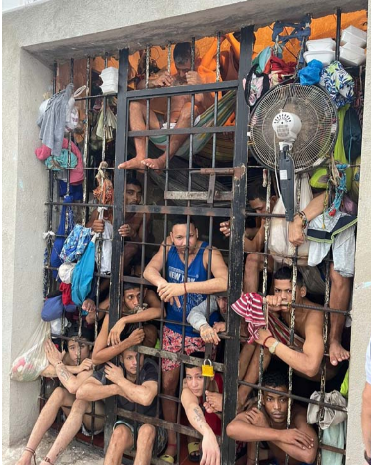
La Estación de Policía de la 19 en Riohacha registra un hacinamiento superior al 2.000 por ciento.

El funcionario del Ministerio Público, como garante de los derechos fundamentales de toda la ciudadanía, acudió a las instalaciones a verificar