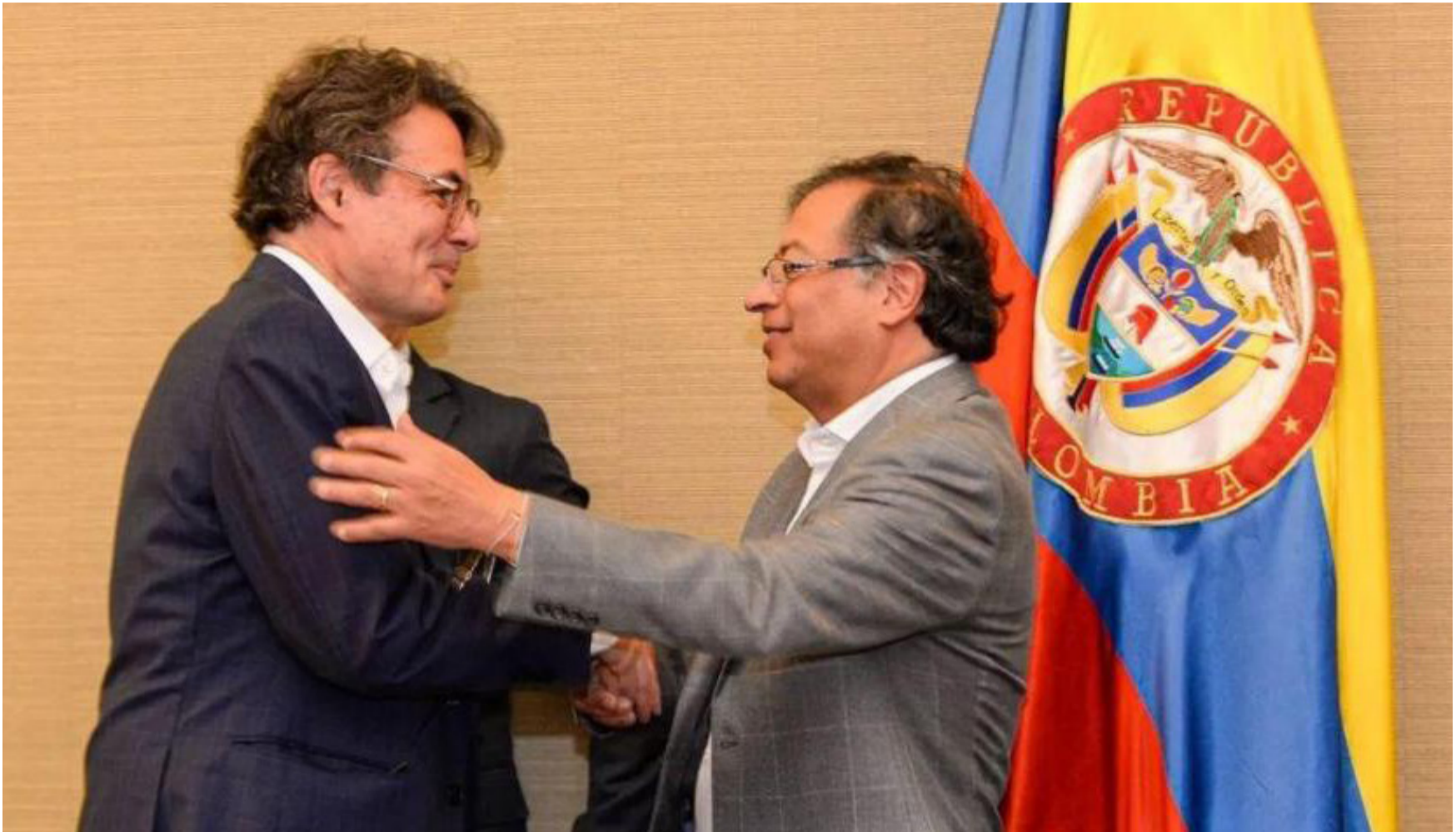
Alejandro Gaviria, ministro de Educación del Gobierno de Gustavo Petro está en discrepancia con la MinSalud, Carolina Corcho.