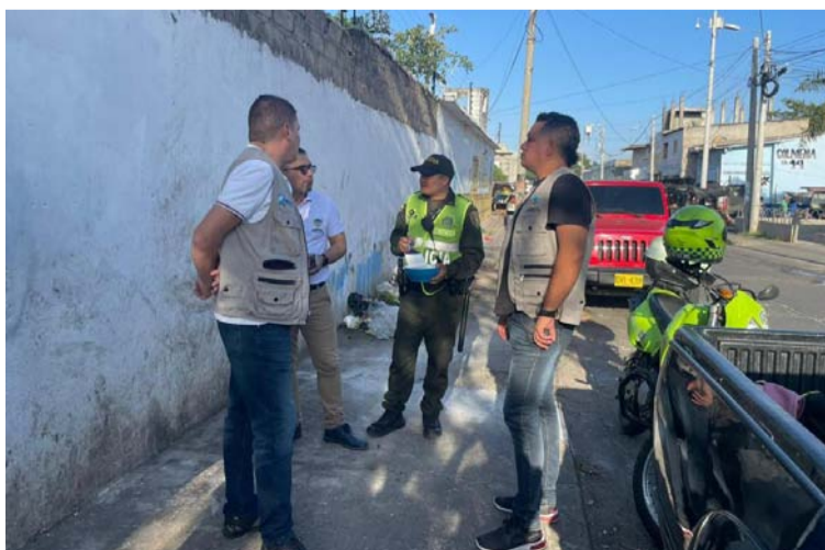
Autoridades participan de las jornadas de limpieza en sector céntrico del Distrito de Riohacha.