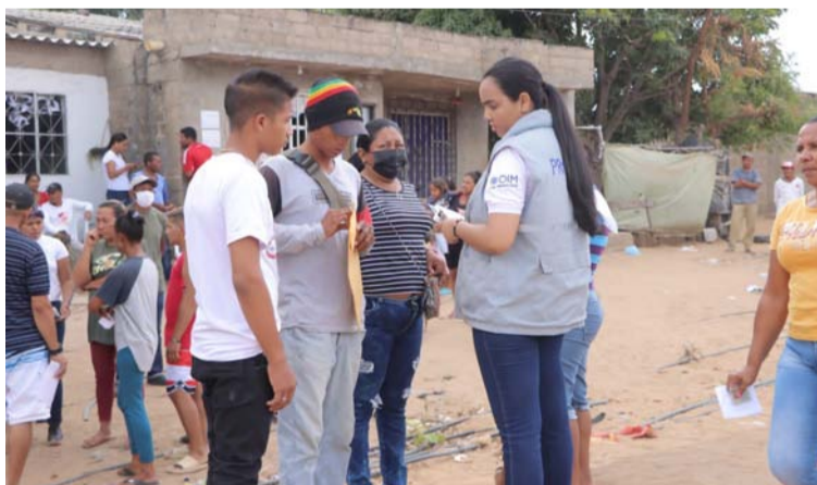
La Feria se realizó al inicio de esta semana en la cancha de Los Trupillos, ubicada en la carrera 12 con calle 77.

Así como también a la atención de Migración Colombia, donde pudieron ade-