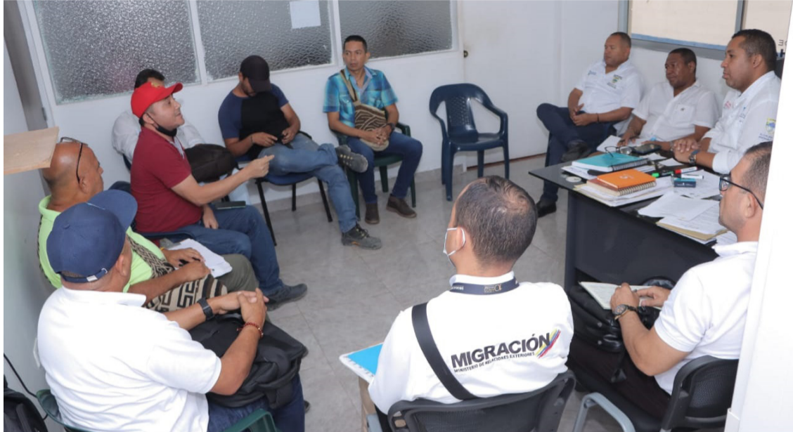
Reunión de la administración distrital con los representantes del gremio de taxistas.

Entre los principales acuerdos están organizar unas tarifas justas que sean de beneficio para el usuario como para los taxistas, ya que la alta inflación existente en La Guajira afecta