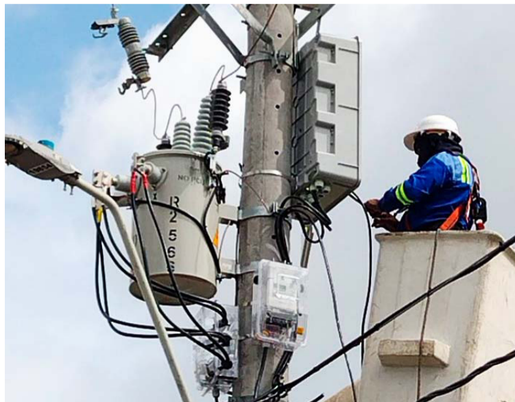
En la línea 529 que suministra energía en los municipios de Uribia y Manaure se realizará lavado de redes.

Por otra parte, atendiendo el llamado de la comunidad con relación a las oscilaciones de voltaje, en el desarrollo de la programación se instalarán nuevos reguladores en la subestación Ballenas. Estos equipos contribuyen a optimizar los niveles de tensión en los