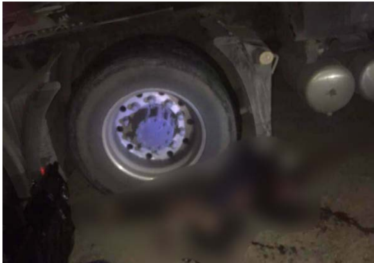
Los hechos se registraron la noche del miércoles, cuando al parecer chocó su motocicleta contra un tractocamión.

Los vehículos involucrados son un tractocamión de placas GUQ454, marca Faw, color blanco, modelo 2020, que era conducido por un hombre de 40 años