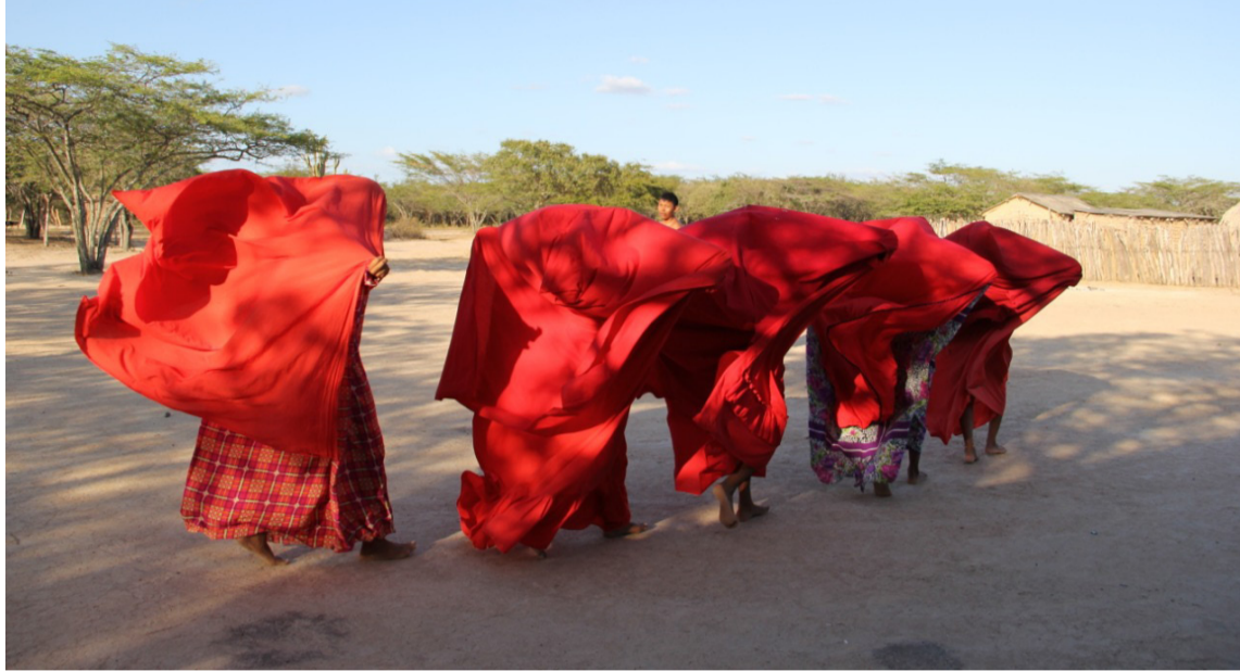
Las mujeres cuidadoras de su territorio son fundamentales en todos los procesos.

Las mujeres cuidadoras de su territorio son fundamentales en todos los procesos, porque es claro que muchas veces, algunas compañías que han hecho presencia en el Departamento, llegan al territorio con una narrativa