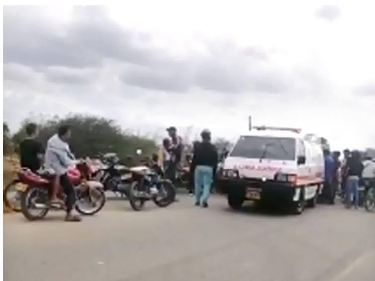
Siete heridos y una persona fallecida en accidentes, producto de la imprudencia y alta velocidad.