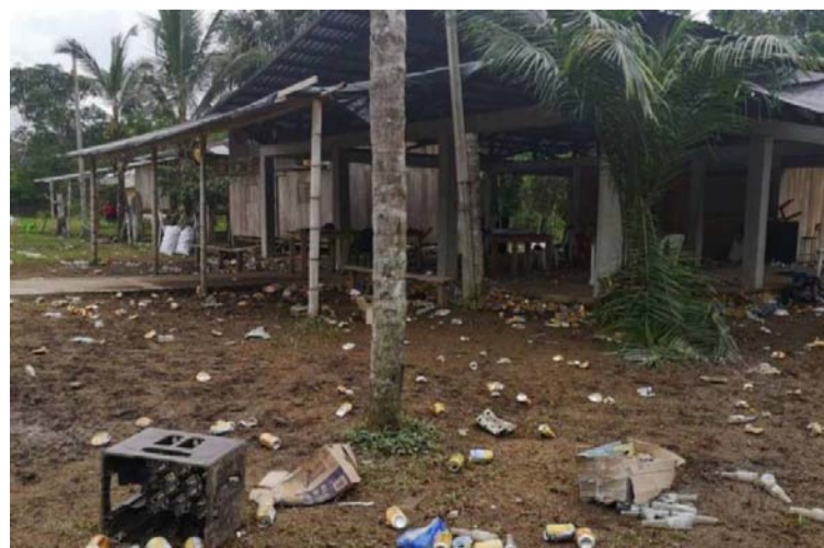
La actuación disciplinaria fue remitida de la Delegada para los Derechos Humanos, a la Sala Disciplinaria de Instrucción.

sido expedidos diferentes autos que ordena la práctica de más pruebas, todas