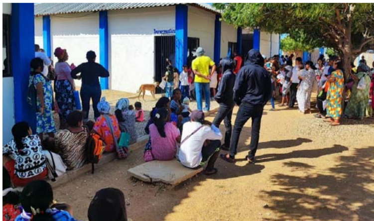
A la fecha, se han realizado 265 trámites de registro civil, 295 a tarjetas de identidad y 100 a cédulas de ciudadanía.

y en los corregimientos de Cabo de la Vela, Cardón, Media Luna y Carrizal, las cuales se extenderán hasta