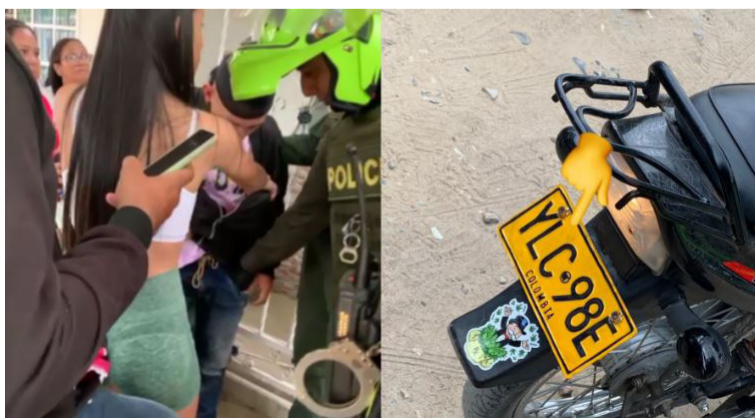
En videos quedó registrado la joven ataca junto a los residentes de la zona al menor, quien aseguraba ser inocente.

El menor fue conducido hasta las instalaciones de la Estación de Policía de la 19 y puesto a disposición de Infancia y Adolescencia.