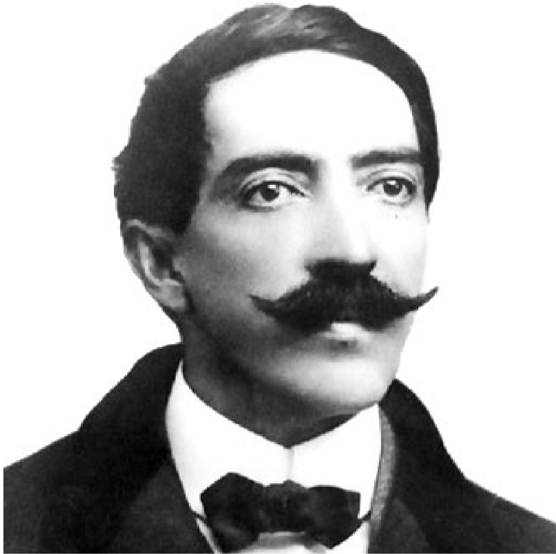
Se dice que, Julio Flórez que fue un poeta llorón, con un léxico reducido, y falta de gusto.

Finalmente, en 1905, el presidente Rafael Reyes terminó “aconsejándole” abandonar el país porque lo consideraban sacrilego, blasfemo y apóstata. Marchó el poeta al exilio, sin dejar de publicar sus poe-