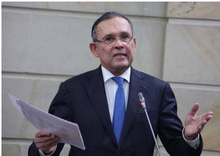
El senador Efraín Cepeda dijo que se requieren las reformas en el país, pero que le preocupan algunos temas.

Conceptuó que si bien hacen parte de la coalición del presidente Gustavo Petro, estudiarán juiciosamente en bancada los proyectos de ley que presente el Gobierno Nacional, y los pronunciamientos deberán nacer