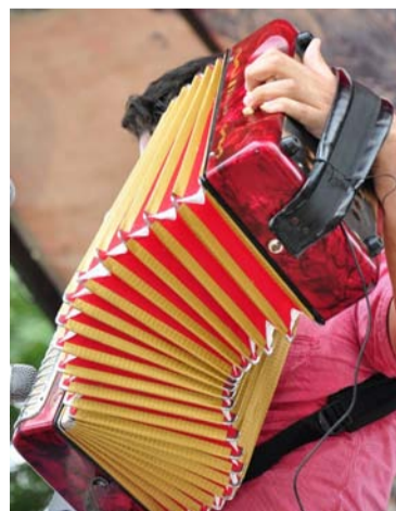
El evento se realizará en Barrancabermeja, Santander.

En esta nueva cita con el vallenato auténtico, se tendrán los concursos de acordeoneros profesionales, aficionados, juveniles, infantiles, canciones inéditas vallenatas y piquería. Como