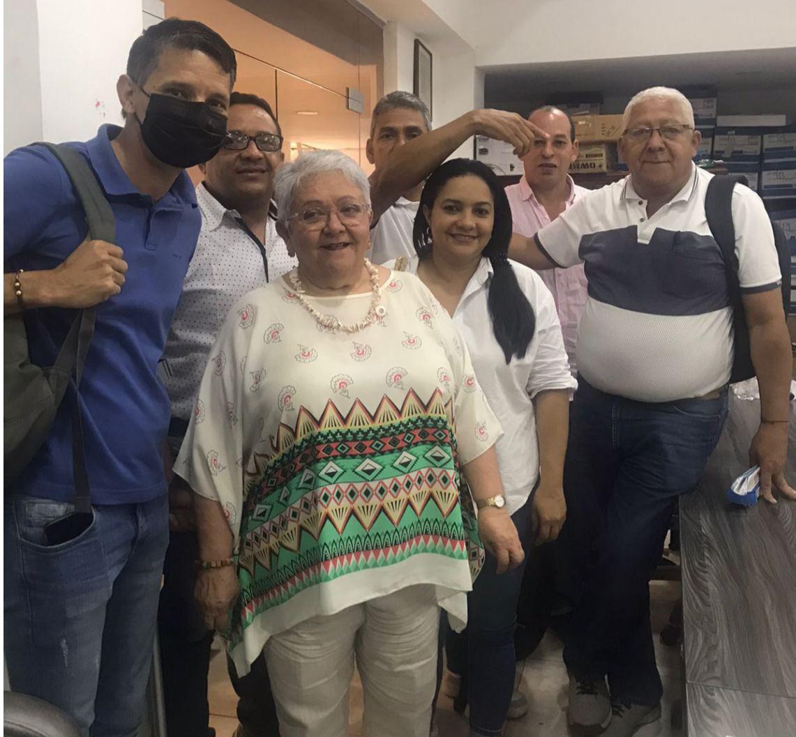
La senadora Imelda Daza se reunió líderes de la Mesa de Diálogo del Sur de La Guajira.

La Mesa de Diálogo le solicitó a la senadora que sea un enlace entre las diferentes instituciones del alto gobierno: Ministerios de Transporte, del Interior, y de Salud; Inviás y demás entidades del Estado que se requieran,