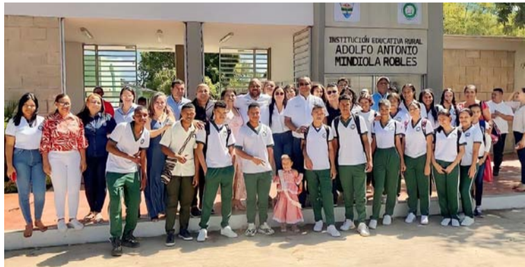
El proyecto incluye servicio de cámaras de seguridad y sistema digital para el control de ingreso de los estudiantes.

600 estudiantes de la Institución Educativa Rural Adolfo Antonio Mindiola Robles, son los directos beneficiados de la obra de encerramiento y entrada de acceso al centro educativo, en donde se invirtieron $1.400 millones, recursos de incentivos a la producción del Ministerio de Minas.