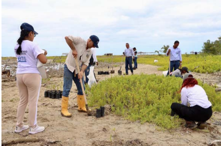
La actividad fue liderada por la Corpoguajira, Elecnorte, GEB, Enlaza, EMS y los guardianes de ambiente y paz.

Adicionalmente precisó que los manglares, además de actuar como una defensa costera natural contra marejadas, el aumento del nivel del mar y la erosión, proporcionan un valioso