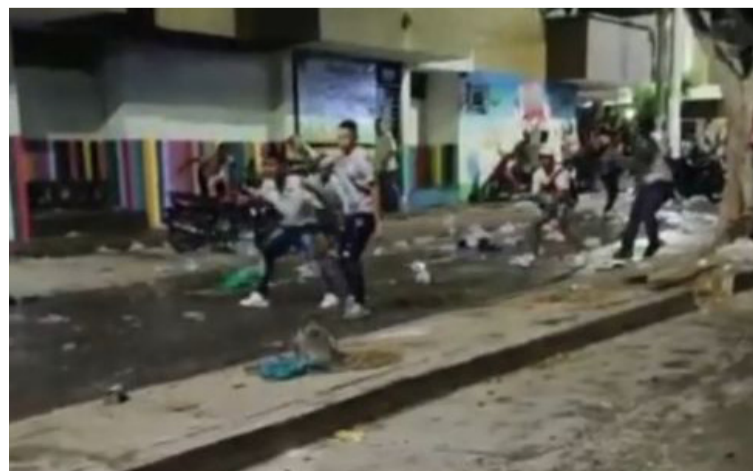
Grupos de desadaptados de diferentes barrios de Maicao se encontraron y armaron una pelea en el Centro.

Se espera que las autoridades policiales continúen haciendo controles permanentes en cada uno de los sectores del municipio para tratar de evitar estos hechos que afectan la sana convivencia.