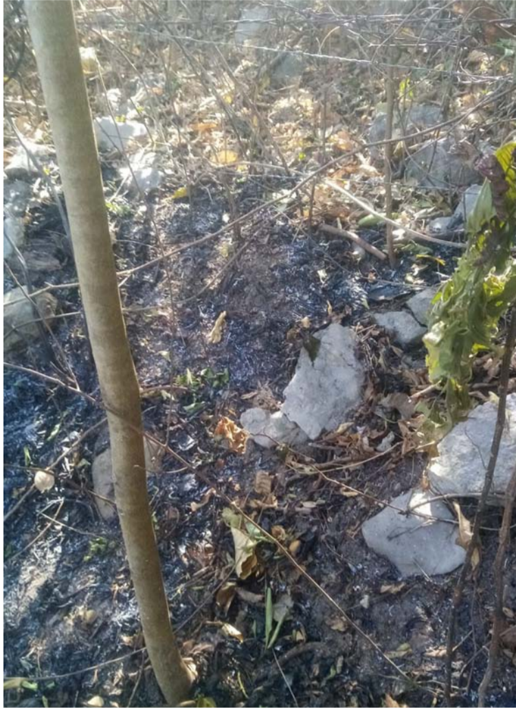
La conflagración se inició desde el pasado domingo sin que se tenga certeza de las causas que la provocaron.