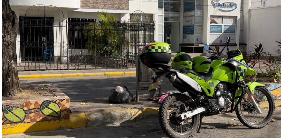
El hallazgo del feto se registró a las 9:00 a.m. en la calle 7 (Ancha) con carrera 11.

indagaciones para verificar que no haya sido alguien de la zona, sin embargo, vecinos indicaron que por ahí no hay nadie que estuviese embarazada.