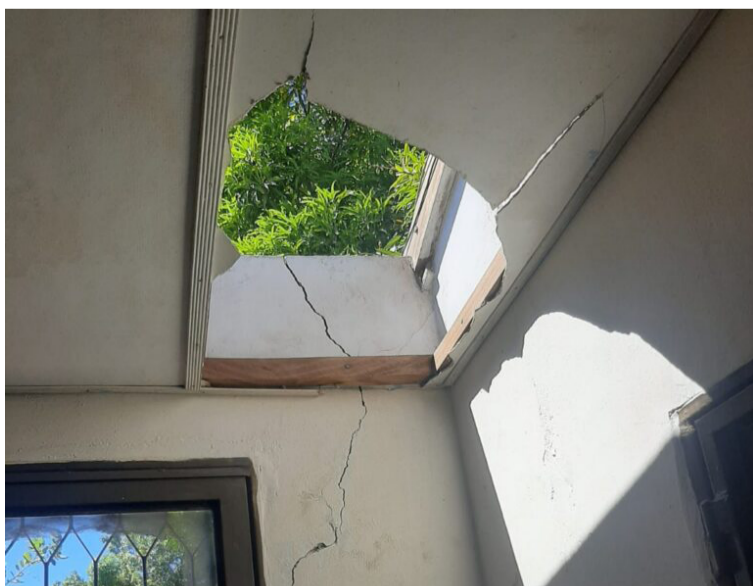
Por este lado de la institución ingresaron los delincuentes y se llevaron los alimentos de los estudiantes.

“No puede ser posible que año tras años pase lo mismo con la sede María Inmaculada; no es posible que teniendo una Estación de Policía y un fuerte militar (Buenavista) los delincuentes hagan lo que se les da la gana. El nivel de atracos va en aumento y sin embargo, nada pasa. Señor alcalde municipal, señor inspector de policía, señores concejales de Distracción, como autoridades civiles representantes directos de la comunidad, es hora de tomar medidas contundentes en contra de estos criminales”, finalizaron.