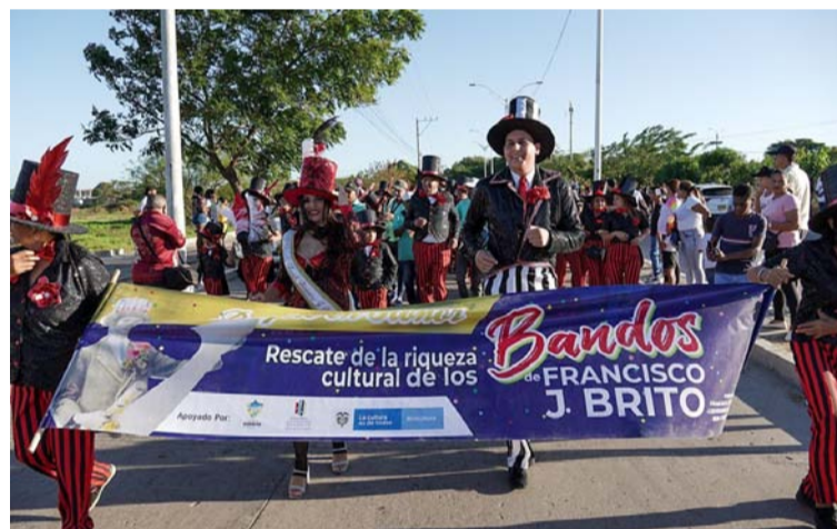
Desfile del Bando Francisco J. Brito, uno de los tradicionales del Carnaval de Riohacha.

Explicó que para su evolución es estrictamente necesario que se asuma como una eficiente empresa, son fiestas eminentemente patrimoniales, por ello la administración del Carnaval debe fusionar patrimonio más alta gerencia e innovación.