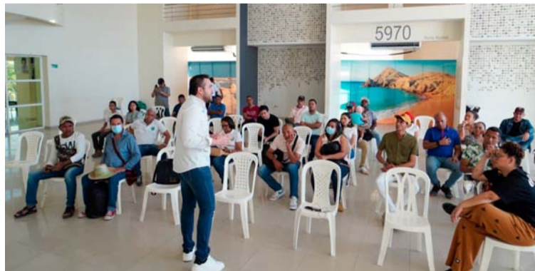
Esta convocatoria de estímulo es liderada por el Fondo Mixto para la Cultura y las Artes y Corpoguajira.

Para Talento Joven, podrán participar niños, niñas y jóvenes entre los 12 y los 17 años de edad que, sin importar su lugar de nacimiento, cursen estudios en una institución educativa pública o privada del departamento,