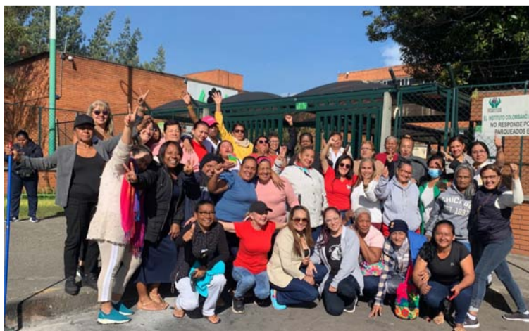
Delegaciones que participaron del diálogo con la cúpula del Icbf en Bogotá en procura de buscar soluciones.