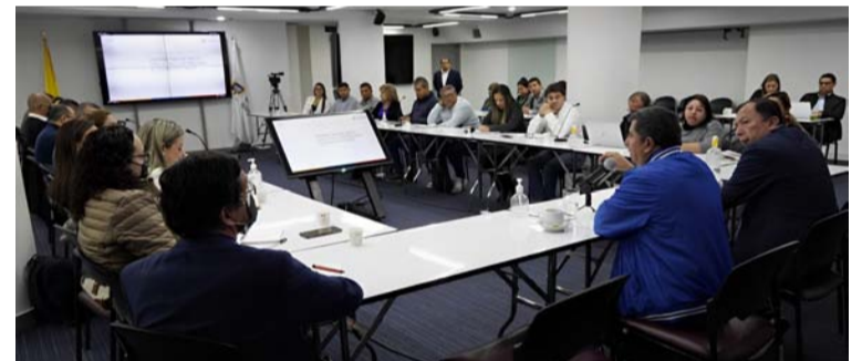
Jefes de Talento Humano de las CAR durante la socialización del Plan de Formalización Laboral.