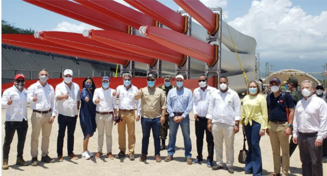
Debido a dificultades, Enel Green anunció cambios en fecha de entrada en operación.

“Ahora las estimaciones las estamos manejando internamente, todavía nada