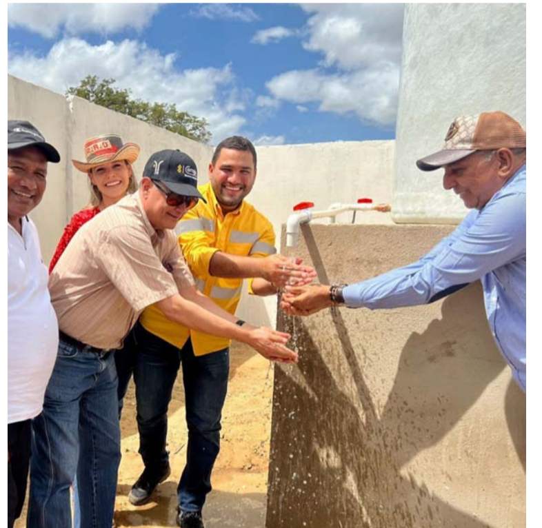
Los proyectos fueron definidos por las comunidades y se enmarcan en infraestructura para soluciones de agua.

Cerrejón y 71 comunidades de su área de influencia han cerrado oficialmente los acuerdos de compensación de la Sentencia T-704 de 2016. Esto quiere decir que se han ejecutado todas las iniciativas que se habían establecido en los procesos de consulta con las comunidades.