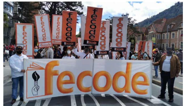
Los maestros saldrán hoy a las calles de las capitales este martes para pedir que se descongele el ascenso.

Sin embargo, los maestros argumentan que este nuevo estatuto solo sirvió