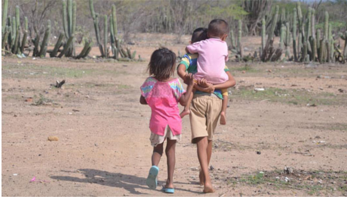
La oferta institucional debe garantizar la participación de las comunidades wayuú.

En primer lugar, se refirió al programa de atención a niños de entre 0 y 5 años (UCA), ofrecido por el Icbf, cuyo planteamiento