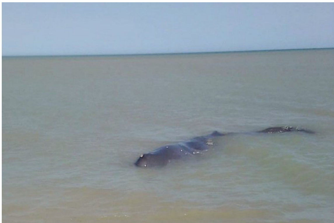
Se presume que la ballena está enferma y que busca un lugar donde morir.

Corpoguajira informó que profesionales del grupo Marinocostero adelantaron las acciones pertinentes para atender con prontitud el cachalote reportado entre las poblaciones de Cardón y Carrizal.