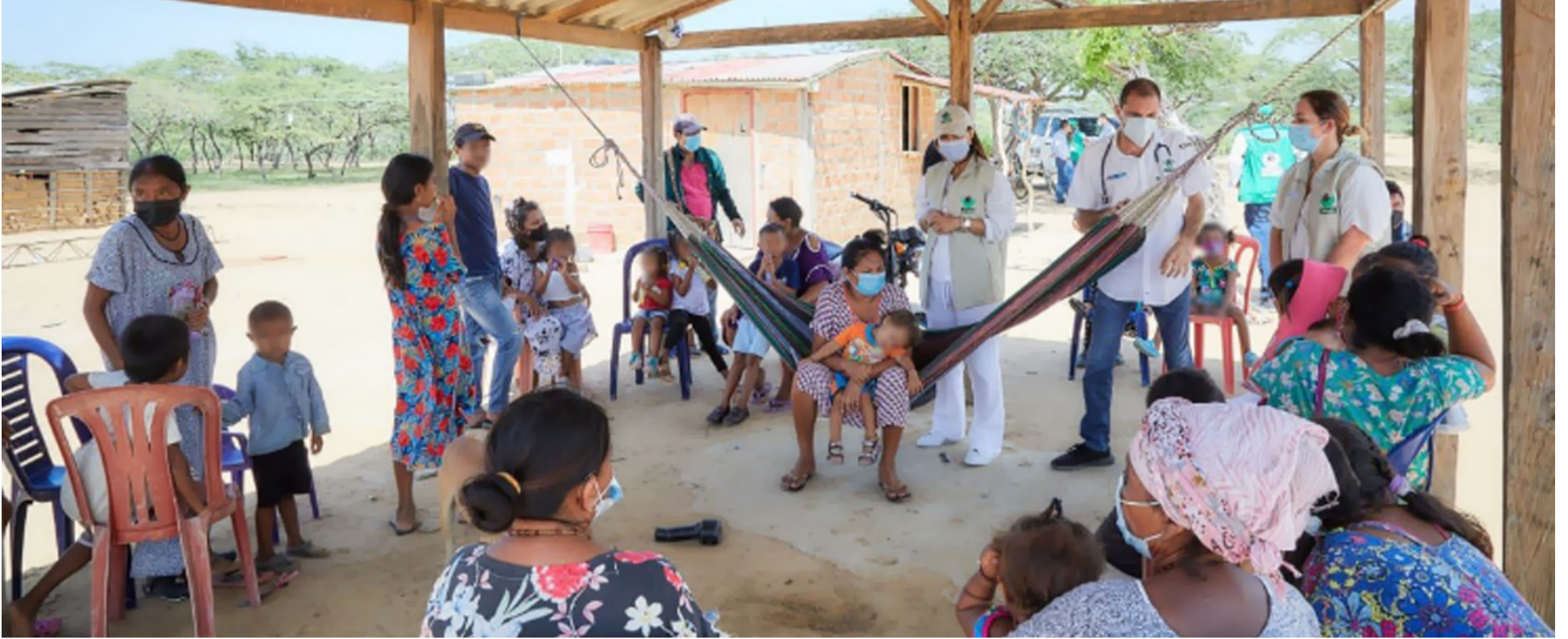
La muerte no da pausa, sigue allí incidiendo en los territorios rurales dispersos del desierto guajiro y de la Sierra Nevada de Santa Marta.

D urante 2022, la muerte de niños entre 0 y 5 años causada por enfermedades que el Instituto Nacional de Salud (INS) determina como eventos prioritizados que incluye la diarrea aguda, la infección respiratoria aguda y desnutrición, se incrementó por encima de lo esperado por parte de las autoridades epidemiológicas colombianas en 33% respecto al 2021.