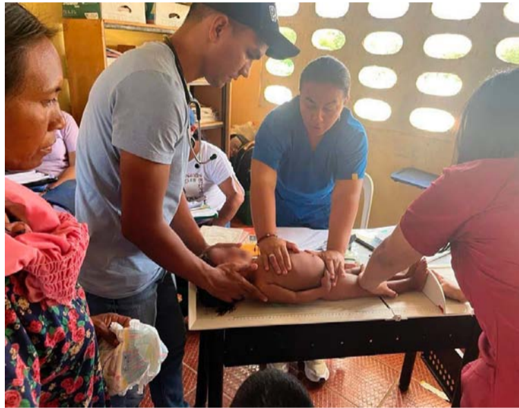
El Gobierno administró el sistema, pero no logró mayores mejoras en la prestación de los servicios de salud.

Es por ello, que La Guajira cerró el 2022 como uno de los peores en materia de morbilidad infantil por desnutrición, muy a pesar de que la Sentencia T-302 de 2017 ordenó a las