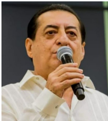
Jorge Oñate dejó un gran legado con sus éxitos.

Canciones como 'Nido de amor', 'El más fuerte', 'Mujer marchita', 'Enamórate', 'El cantor de Fonseca', entre otras, fueron interpretadas por Jorge Oñate, 'El Jilguero de América'.