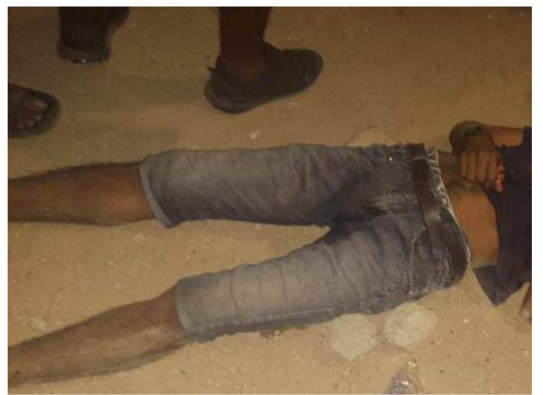
Varias personas atacaron a los sujetos con puños, piedras y palos hasta que los dejaron sin aliento.