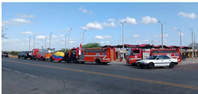
Los Bomberos de La Guajira recorrieron las vías de la península para exigir sus derechos como seguridad social.

Trece estaciones bomberiles de igual número de municipios guajiros, paralizaron sus actividades el día anterior, para exigir a las alcaldías el cumplimiento de los mandatos de la Ley 1575, que obliga a los entes territoriales a contratar la prestación del servicio para