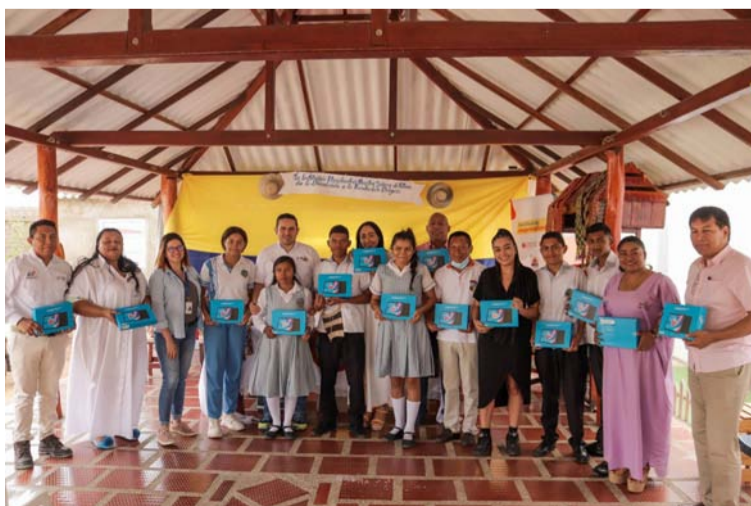
En compañía del gerente de la Mesa estuvieron funcionarios de la Fundación El Origen, docentes y estudiantes.