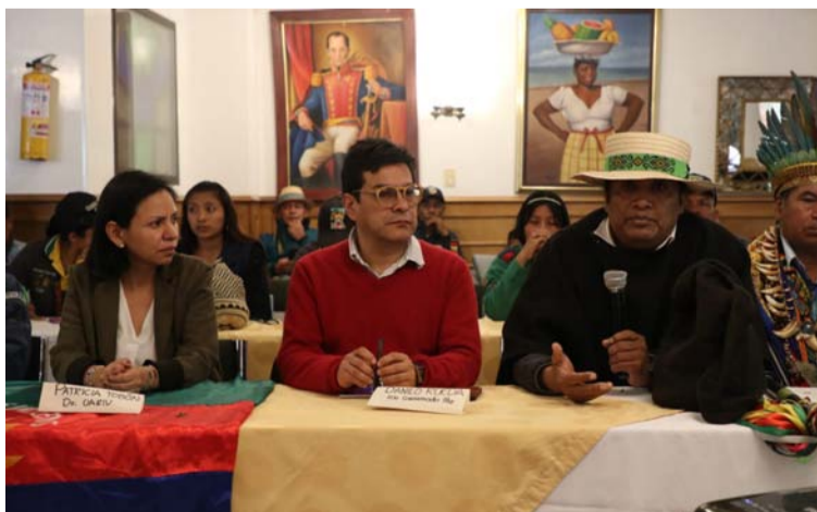
El segundo ciclo de diálogos entre el Gobierno y el ELN se lleva a cabo en Ciudad de México.

Indicaron que estos espacios serán claves para lle-