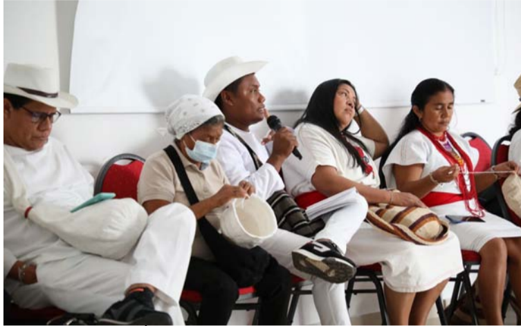
El magistrado Óscar Parra les informó a los familiares de las víctimas el reconocimiento de 135 desapariciones.

“Este es un inicio para explorar escenarios restaurativos y proyectos de sanciones propias para los máximos responsables de los crímenes de guerra y lesa humanidad que ocurrieron aquí”, le manifestó a los familiares de las víctimas, el