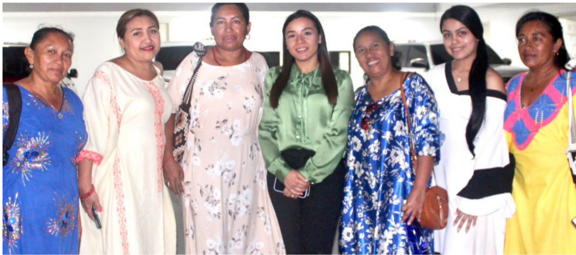
La gobernadora Diala Wilches participó de la reunión que dio solución al transporte.

rantiza la prestación del servicio educativo a las zonas urbanas, rurales e indígenas de los 12 municipios no certificados en educación.