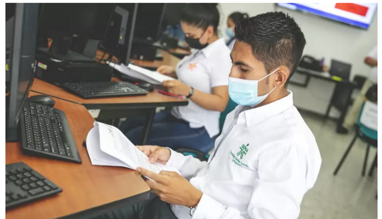
Se ofrecen cerca de 75.000 cupos en lo auxiliar, operario, técnico, tecnólogo y especialización tecnológica.

Para inscripción deben ingresar a: https://www.sena.edu.co/es-