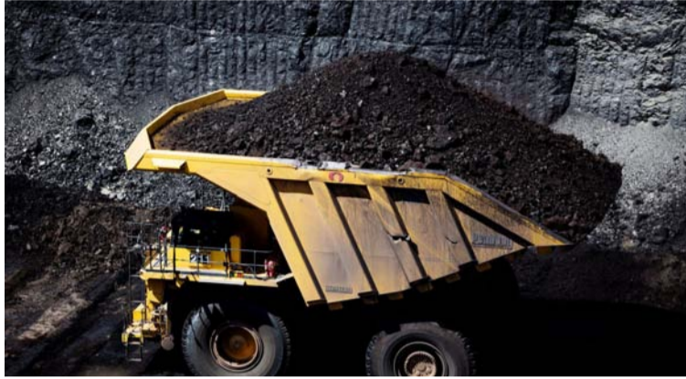
En lo sucesivo, no se entregarán más contratos de gran minería a cielo abierto para el sector del carbón.

Sin embargo, llama la atención que, si bien el proyecto del Plan prohíbe de tajo los nuevos proyectos, no se descartaría que para las actuales iniciativas carboníferas que se desarrollan actualmente en La Guajira