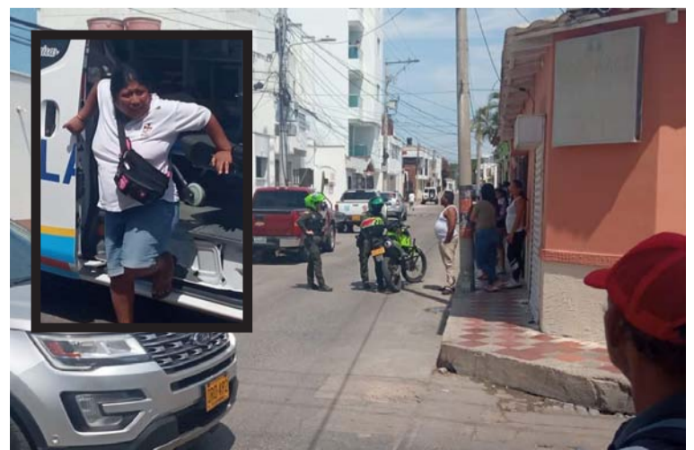
La mujer wayuú no pudo evitar que le hurtaran sus pertenencias y en cambio resultó herida en el atraco.

Los habitantes de barrio Arriba hacen un llamado a las autoridades a ejercer mayores controles para garantizar la seguridad en el Centro de la ciudad.