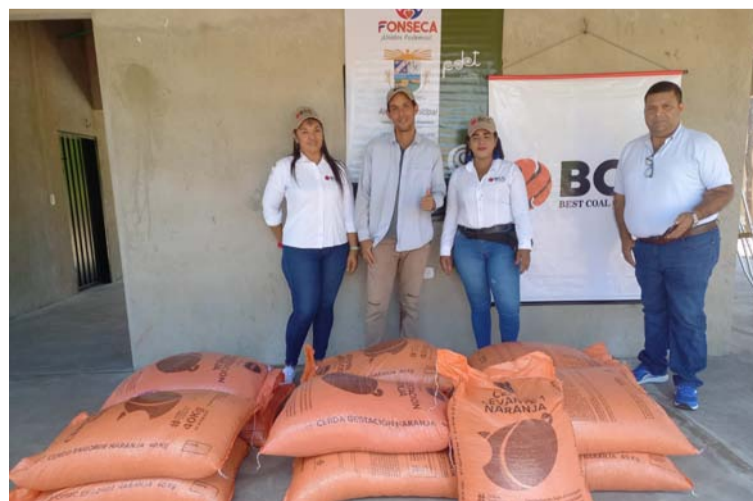
La empresa minera ha apoyado a 97 emprendedores en sus proyectos en San Juan, Fonseca y Distracción.

También se registraron entregas de insumos pecuarios, cerdos, pollo, etc.