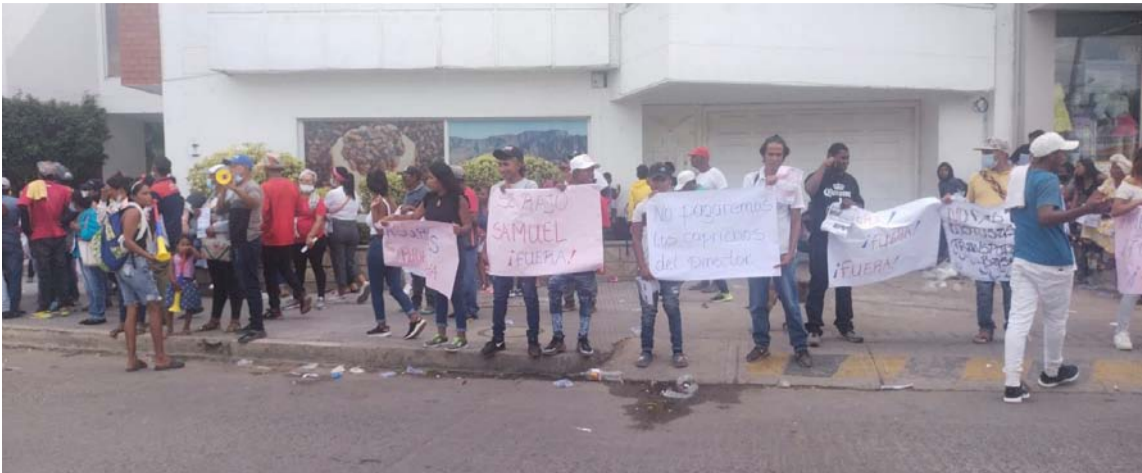
La ciudadanía se tomó las instalaciones de Corpoguajira y en señal de protesta exigía solución al problema de la basura en Riohacha.