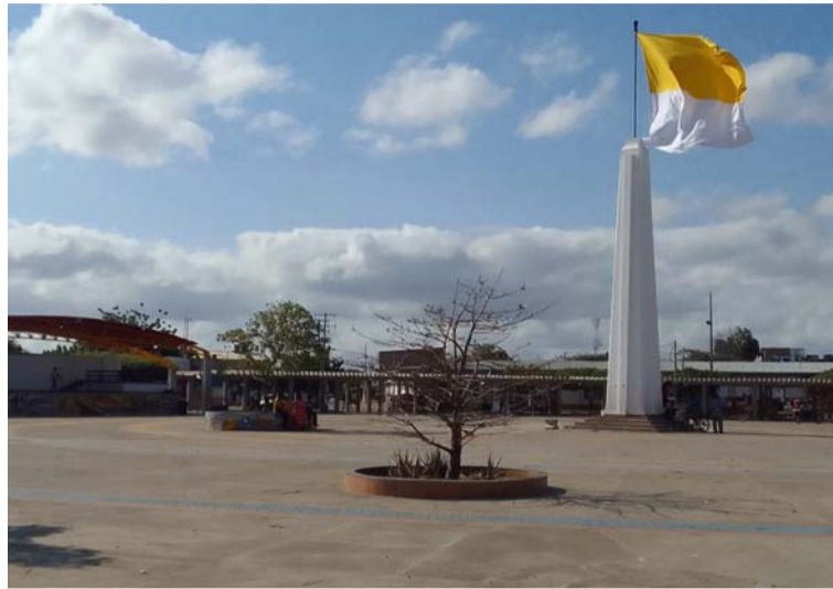
El asesinato del soldado que se encontraba en su día de descanso, se registró en la Plaza Colombia de Uribia.

“Nadie se percató que estaba muerto pensaban que cayó de la borrachera”, rela-