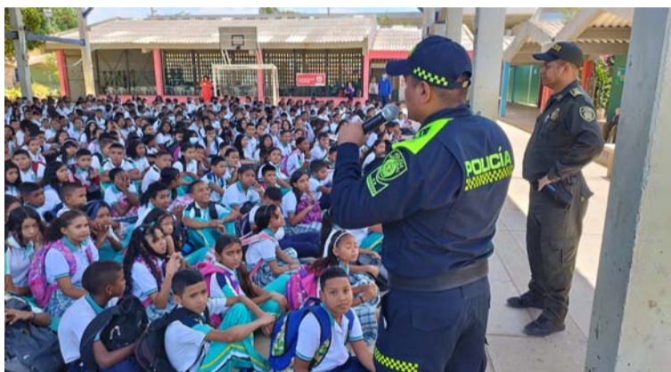
Durante la jornada, a los estudiantes se les brindó una charla para el fortalecimiento de los valores éticos.