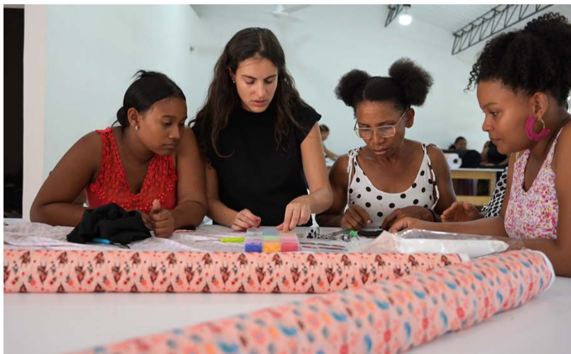
Entre 15 y 71 mujeres se capacitaron en realización de compresas higiénicas reutilizables.

Además, a través de sesiones de formación, participantes entre los 15 y 71