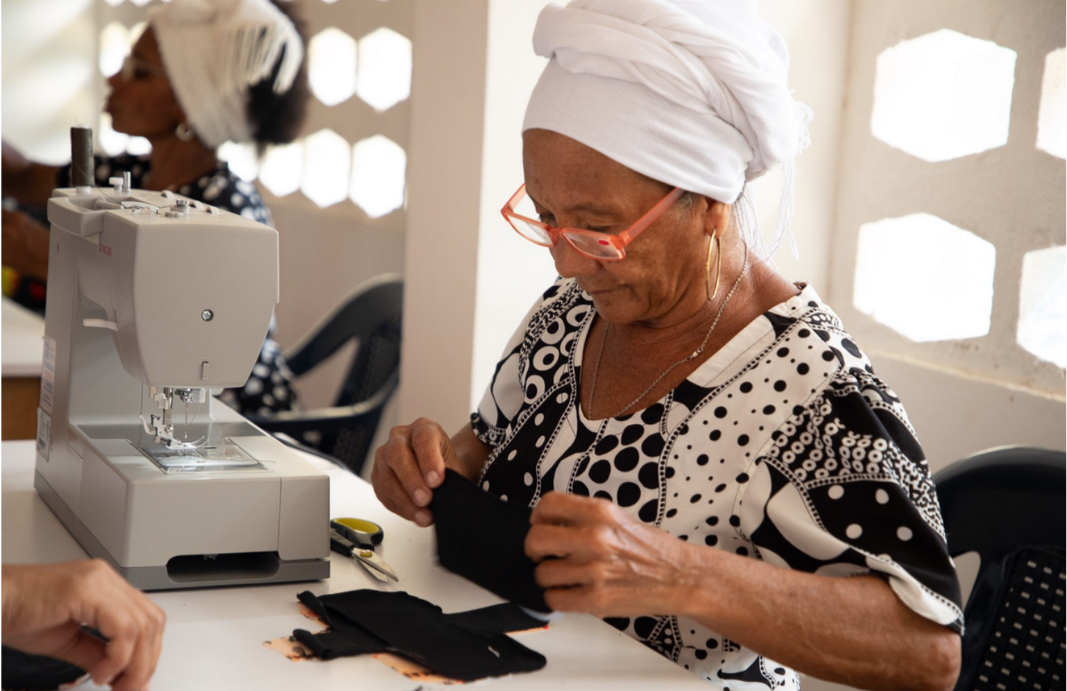
Las mujeres líderes del proyecto enseñan a usar métodos alternativos, económicos y ambientalmente sostenibles.

La iniciativa mejorará la vida de 1.200 participantes