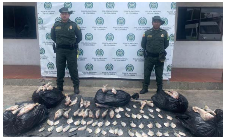
Pescado incautado por la Policía cuando era transportado en un vehículo en el mercado público de Maicao.

La fuente policial reveló que este producto pretendía ser comercializado en esta importante plaza de mercado del municipio fronterizo y que por sus características provenía de Venezuela, quedando claro que este producto marino está avaluado en $1.000.000 en el comercio actual. El producto fue dejado a disposición de la Secretaría de Salud.