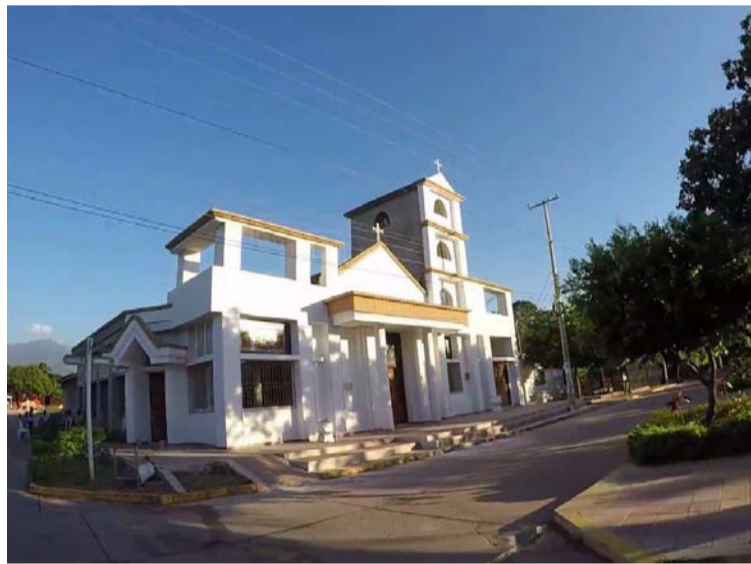
La denuncia de trashumancia en La Jagua del Pilar fue interpuesta a partir del estudio realizado por la MOE.

Además, que las autoridades no hacen nada a pe-