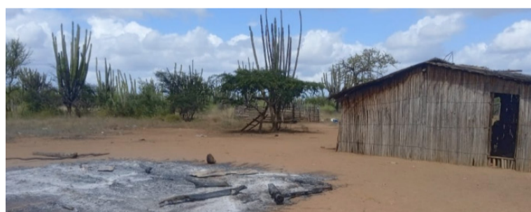
Los menores desplazados desde la Alta Gaujira viven con sus familiares en la Casa Indígena de Riohacha.

Hasta el lugar de los hechos llegaron las autoridades competentes para proceder al levantamiento del cadáver y dar inicio a las investigaciones para determinar las causas del homicidio y la captura del responsable.