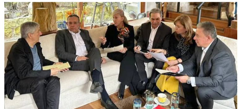
César Gaviria, Efraín Cepeda y Dilian Francisca Toro, directores de los partidos Liberal, Conservador y la U.