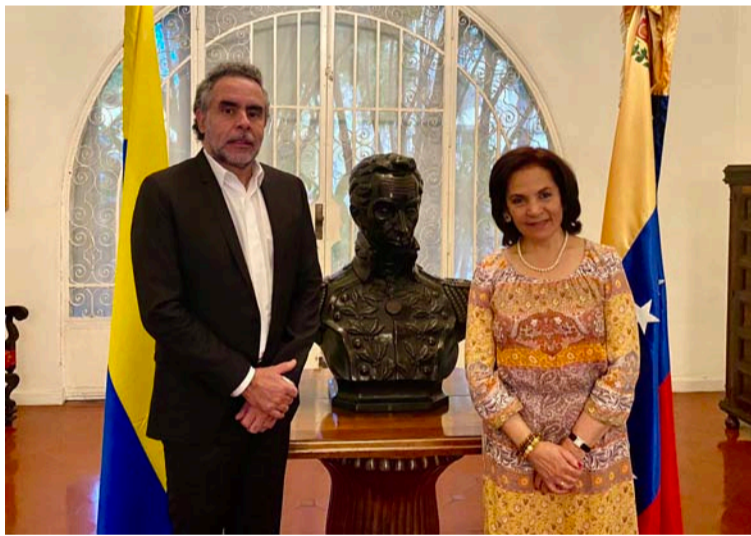
Armando Benedetti, embajador de Colombia en Venezuela, liderará la apertura de consulados en ese país.

La Cancillería afirmó que, en un plazo no mayor a cuatro meses estará nuevamente operando los consulados colombianos en Caracas, Maracaibo, San Antonio de Táchira y San