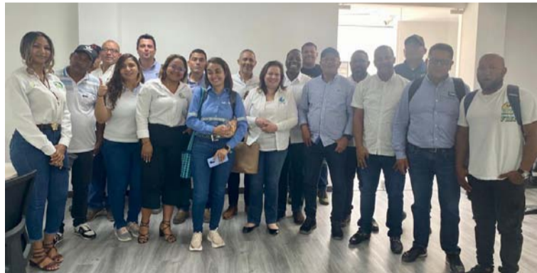
Gremio de metalmecánicos guajiros que piden ser tenidos en cuenta para vinculación laboral.

En la mesa de trabajo, las partes definieron realizar nuevamente las pruebas de ingreso para algunas de las especialidades que solicitaban y que en la primera oportunidad no lograron ser vinculados, esperan ser más cuidadoso y darle la