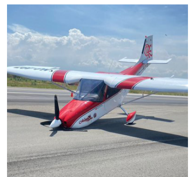
A la aeronave se le partió el tren de aterrizaje.