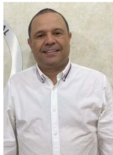
Álvaro Díaz, alcalde del municipio de San Juan.

y las políticas de la autoridad ambiental competente para salvaguardar la biodiversidad, el recurso hídrico y los suelos, especialmente, la reserva fores-