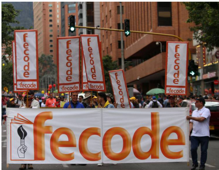
Fecode sigue convocando marchas, no en protestas, sino en apoyo a las reformas que propone el Gobierno.

“También manifestamos nuestro apoyo a la Reforma a la Salud, pues