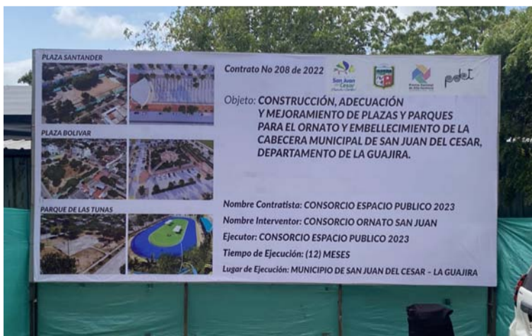
La gobernabilidad institucional jugará un papel importante para el futuro del municipio de San Juan.

explotar carbón y otros minerales en este territorio. Igualmente la suerte de la consulta previa para la explotación o no de las reservas probadas en Cañaverales