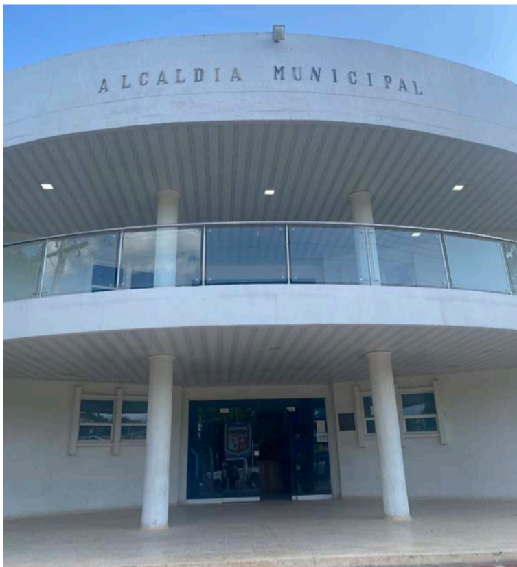
El rol protagónico desde el gobierno territorial será muy importante para el futuro de las generaciones.