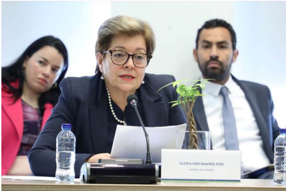
La Reforma Laboral se debe enfocar en fortalecer la calidad de vida de la población.

Es curioso observar a dirigentes de la CUT exhibiendo un borrador de reforma, considerando todavía que las relaciones laborales siguen siendo iguales a las que ocurrían hace más de 50 años.