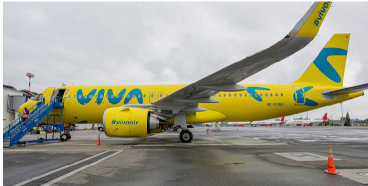
Tras la quiebra de Viva Air los precios de los tiquetes en otras aerolíneas han subido y golpean el bolsillo.

De acuerdo con sus datos, al comparar los precios que estaban disponibles para las fechas entre el 10 de marzo y 10 de abril, partiendo en las dos ciudades con mayor presencia de la aerolínea como lo eran Bogotá y Medellín, se encontró que la capital presenta un mayor aumento en las rutas aéreas hacia la ca-