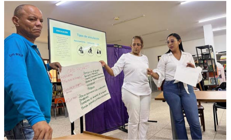
Aspectos de la capacitación que se le viene brindando a los funcionarios de la Alcaldía del municipio de Fonseca.