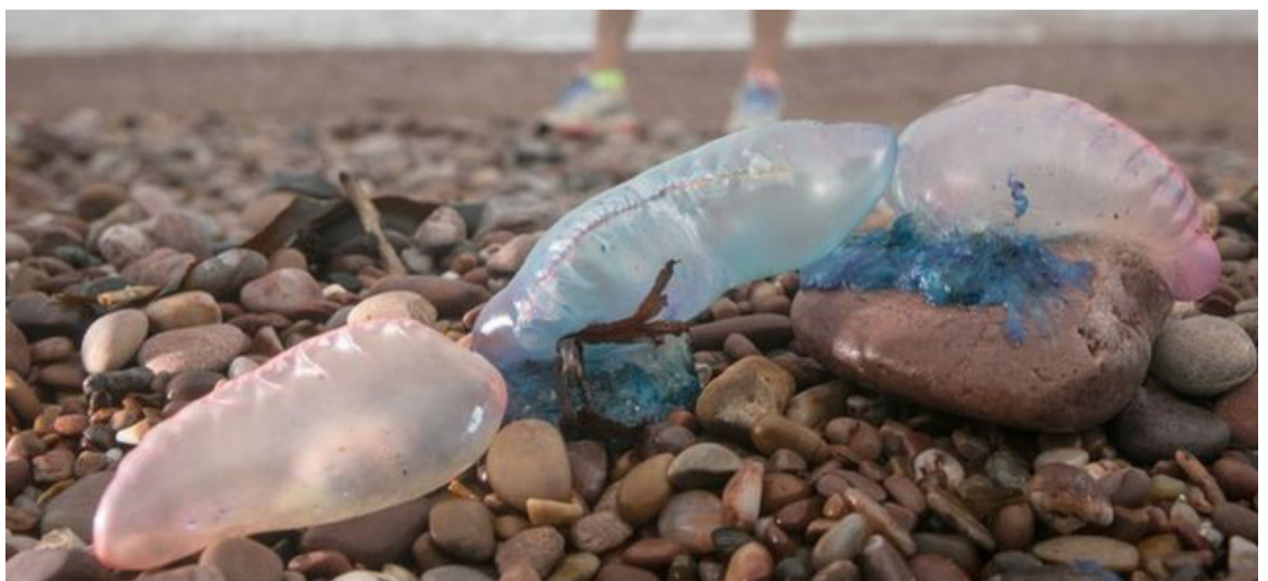
El menor fue picado por el animal y debió ser trasladado de urgencia a centro asistencial.

La lesión que la fragata produce es un dolor intenso como una quemadura y enrojecimiento, por lo que se recomienda lavar de inmediato con agua de mar y retirar restos de tentáculos.