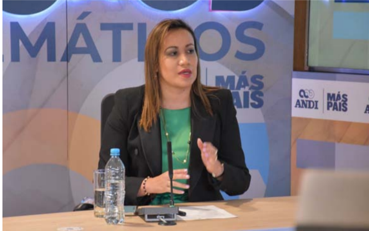
Carolina Corcho, ministra de Salud, señaló en foro ante industriales que la Reforma a la Salud podría ser retirada.

Según la ministra, hay tres temas de la Reforma a la Salud en los que no cederá: que los recursos sean administrados por el Estado a través de la Adres, que se elimine la intermediación