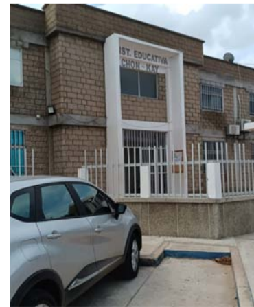
En este lugar se produjo el ataque a la docente.

La situación de inseguridad ya ha sido denunciada por las víctimas del plantel educativo como también por funcionarios del Instituto de Deportes de La Guajira, Iddg, ubicado en frente del Chon Kay, quienes también han sido víctimas.