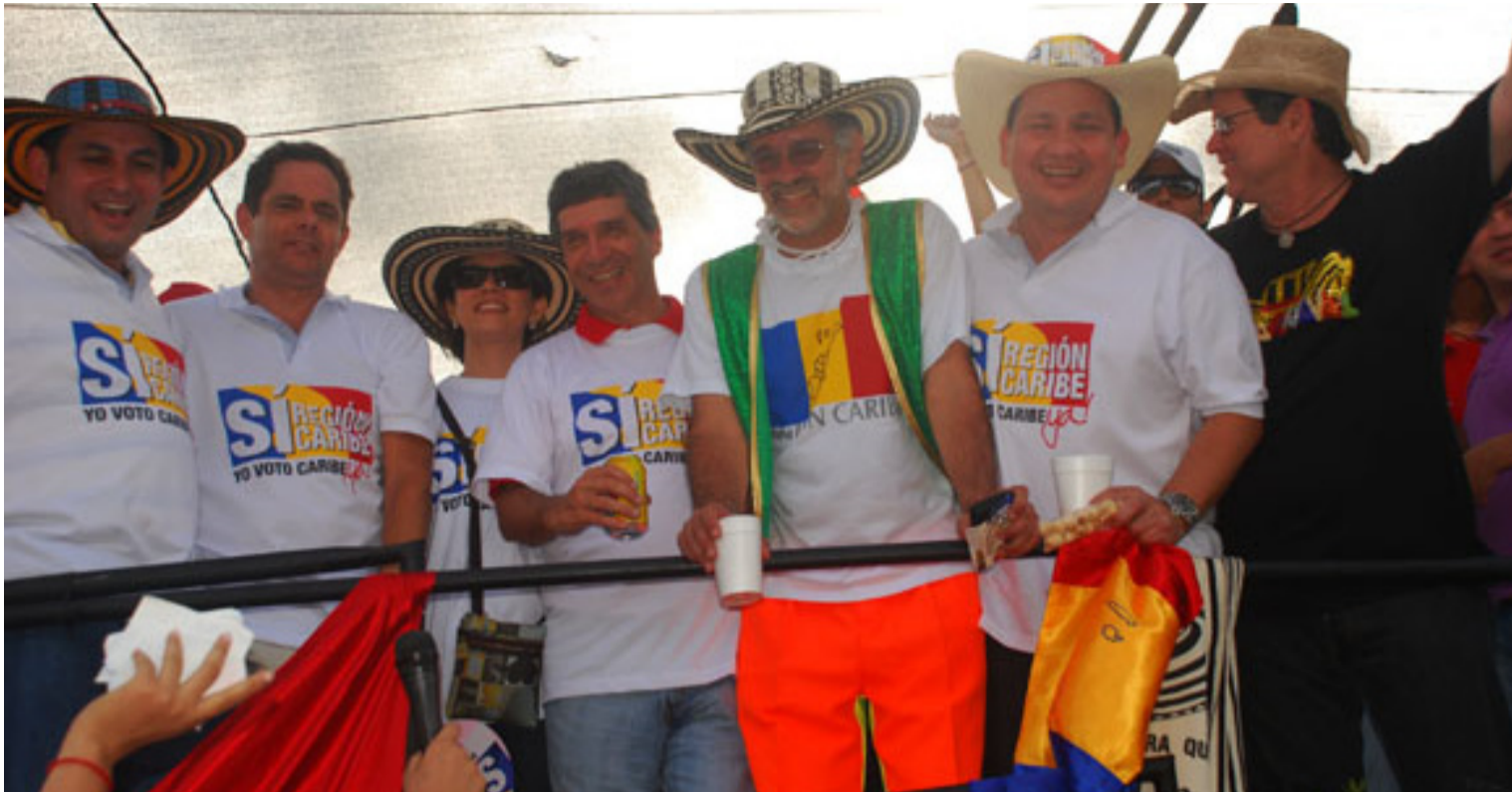
Se hizo posible que las regiones se pudieran constituir como Regiones Administrativas y de Planificación (RAP).

Hemos tenido que esperar 20 años para que se constituyera la RAP