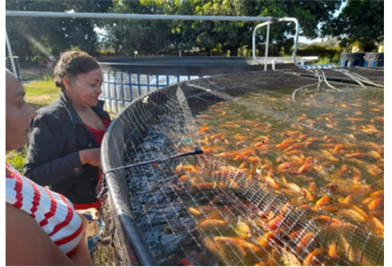
Una de las iniciativas busca fortalecer las capacidades para la innovación en 27 instituciones educativas oficiales.