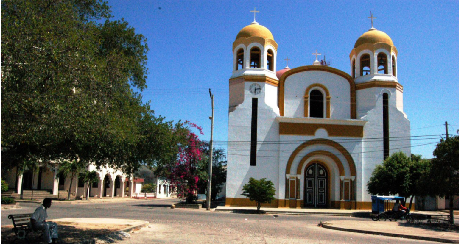
Parroquia de San Juan Bautista, símbolo de San Juan del Cesar, municipio con más de 320 años de historia.

Hay expectativas por un lado, por las 33 solicitudes de concesión minera que hacen tránsito en la Agencia Nacional Minera, para