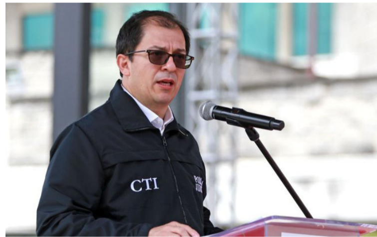
Francisco Barbosa, fiscal General de la Nación, dijo que acata la solicitud del presidente Gustavo Petro.

Así mismo, sostuvo: “Lo que se hace es suspender esas órdenes de captura con fundamento en las facultades constitucionales y lega-