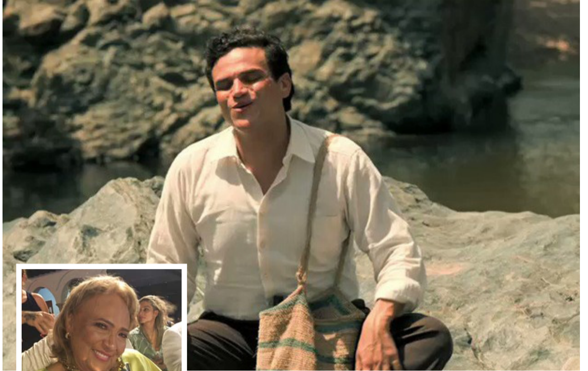
Dangond fue premiado por su interpretación como Leandro.