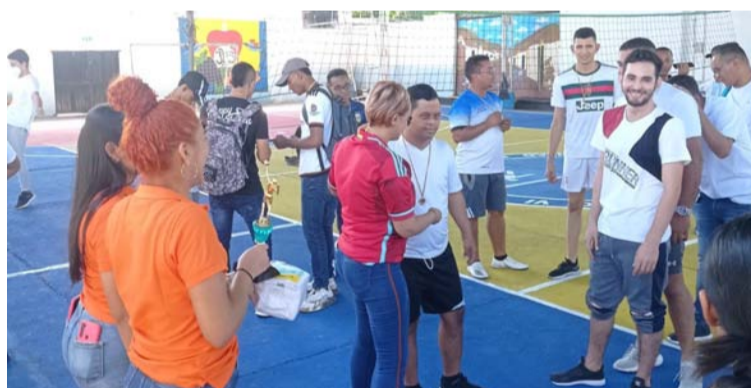
Se estima que uno de cada cinco infantes con Síndrome de Down en La Guajira reciben clases en planteles educativos.