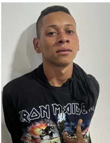
Joven sindicado de atracar a mujer y que fue golpeado.

aproximadamente 20 años, recibió golpes, patadas y pedradas por parte de los vecinos del sector, quienes están cansados de los constantes atracos.