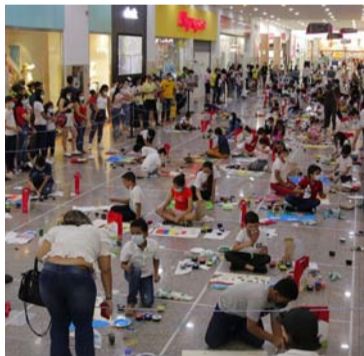
Las inscripciones se reciben hasta el 17 de abril.

Los objetivos fundamentales del concurso son conservar, mantener, fomentar y defender entre las futuras generaciones el Festival de la Leyenda Vallenata, la música tradicional vallenata como Patrimonio Cultural e Inmaterial de la Humanidad y estimular el espíritu creativo de los pequeños artistas aunados al folclor. Además, ser un aliciente educativo desde el género vallenato como mejor tarea diaria.