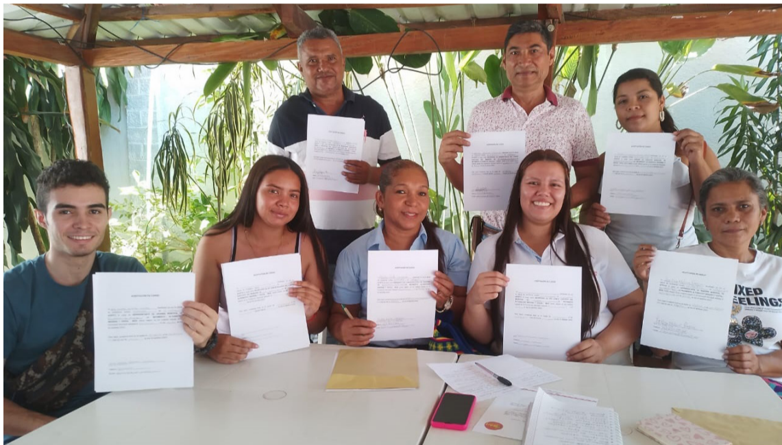
El comité quedó integrado por ocho miembros de la comunidad indígena Cariachil.

El comité municipal quedó conformado por ocho miembros de la comunidad indígena Cariachil y quedó