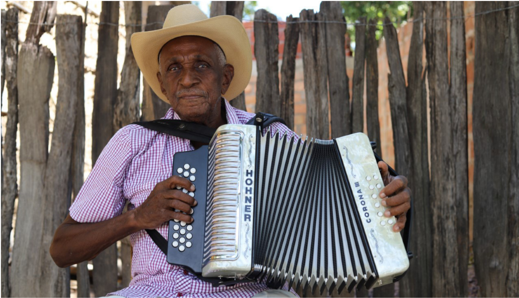
El nonagenario juglar dice que se siente dichoso de haber contribuido para que el folclor vallenato cada día sea más grande.