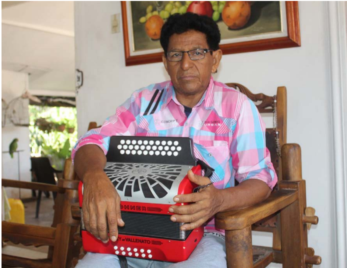
El acordeonero solicitó a Sayco y Acinpro revisar lo que le giran porque no es lo justo.

Relató que posteriormente se devolvieron para El Molino para comprar los medicamentos. “Me los tomé tal cual lo decía la fórmula y nada de mejoría. Luego fui para el neurólogo en el municipio de San Juan del Cesar, conté nuevamente mi situación, me hospitalizaron y la especialista me dice que tenía que ir a la ciudad de Barranquilla. Me fui y allá le conté al médico que una de las cosas que me trae es que no siento gusto, no estoy durmiendo y me llevo la sorpresa que él no era