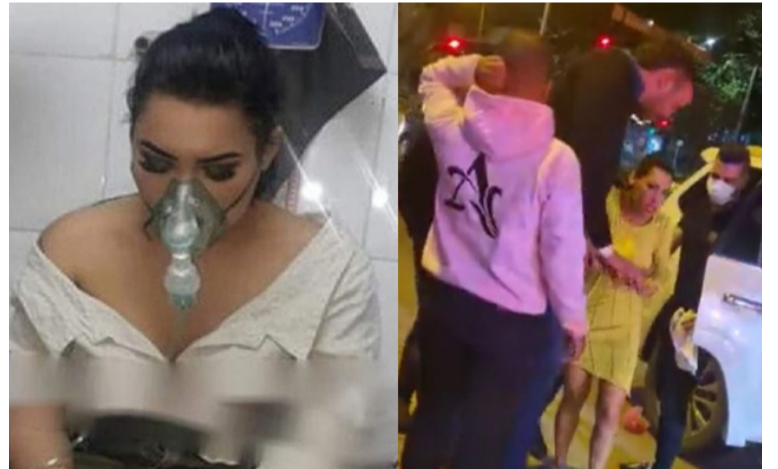
La artista fue asistida por un equipo médico que la llevó en ambulancia hasta una clínica donde recibió atención.

La cantante vallenata fue dada de alta el domingo 26 en horas de la mañana y se encuentra en reposo. En la