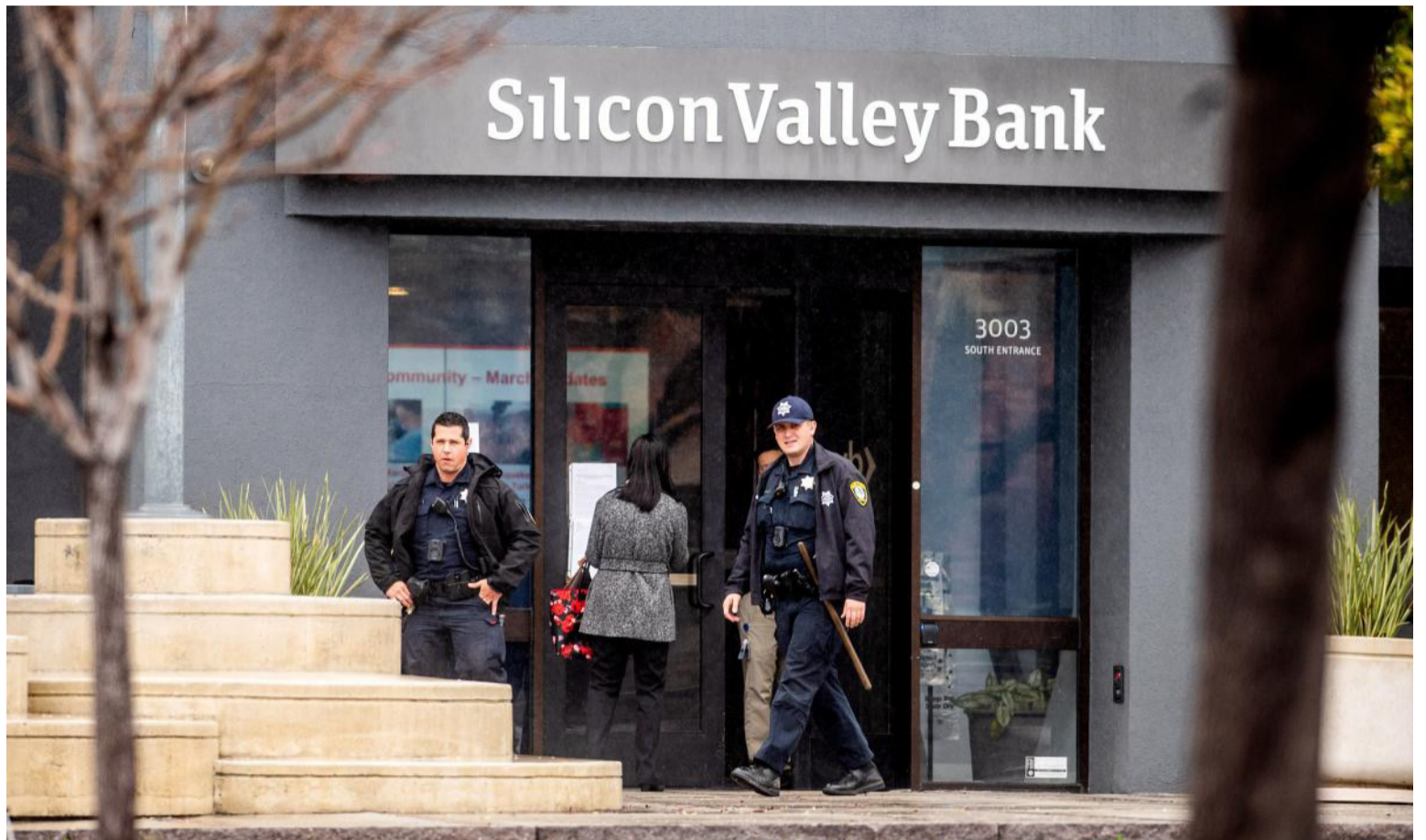
En el régimen de producción capitalista la ganancia está de un solo lado, precisamente del lado de los capitalistas.

La discusión teórica se centra en que las medidas van orientadas a contener la inflación por la vía de la demanda: rebajas esencialmente salariales a la clase trabajadora, otros de corte keynesianos lo adjudican por parte de la oferta: los precios de las mercancías llamadas commodities, esencialmente la energía y los alimentos. Pero en ambos casos hay un beneficiado que incrementa la acumulación, y es, el gran capital: los monopolios, dueños y amos absolutos del mercado de toda índole, y fundamen-