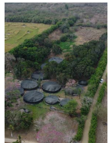
La finca tenía 11 piscinas para la cría de pescado.

Finalmente indicó la compañía que a la fecha lidera con la Fiscalía cerca de 440 investigaciones penales por hurto y defraudación de fluidos. También indicó que han sido capturadas 183 personas por los delitos de defraudación de fluidos y concierto para delinquir.