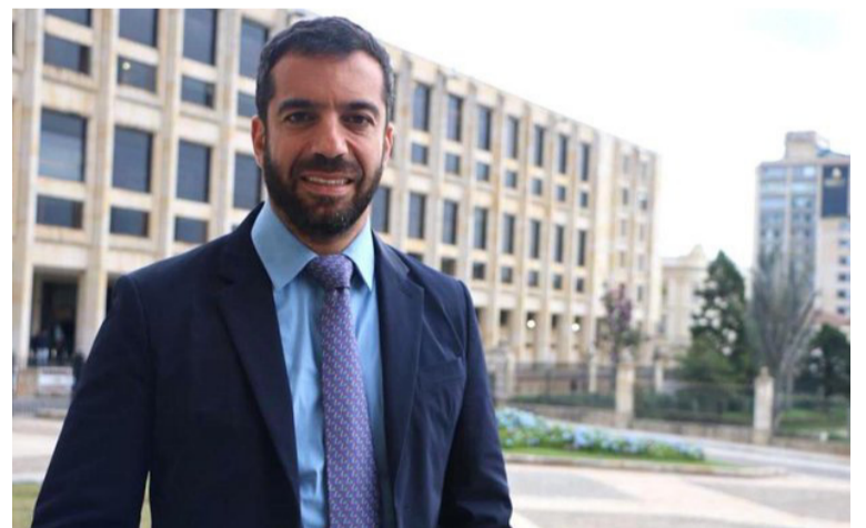
Arturo Char a través de sus abogados había solicitado la nulidad del proceso, lo que fue rechazado por la Corte.

El proceso que se le sigue al expresidente del Congreso está relacionado con las declaraciones de la también excongresista Aida Merlano, quien lo implica en hechos de corrupción.