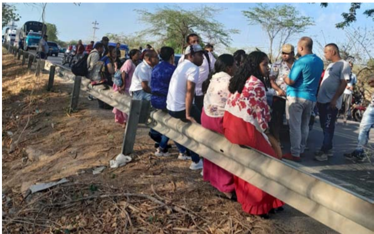
Los wayuú manifestaron que no desistirán de la protesta, ya que “están cansados de las promesas incumplidas”.

Puntos Bloqueados: Sector 4 Vías en Maicao; Alto Pino; vía Paradero – Maicao; entrada a Mayapo; Puente Guerrero; vías Riohacha – Cuestecitas y Payal – Hatonuevo.