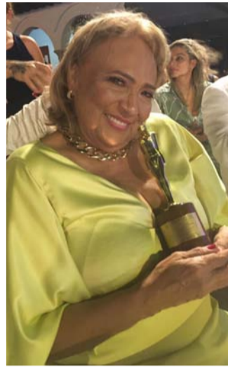
La orgullosa madre del artista con la estatuilla.