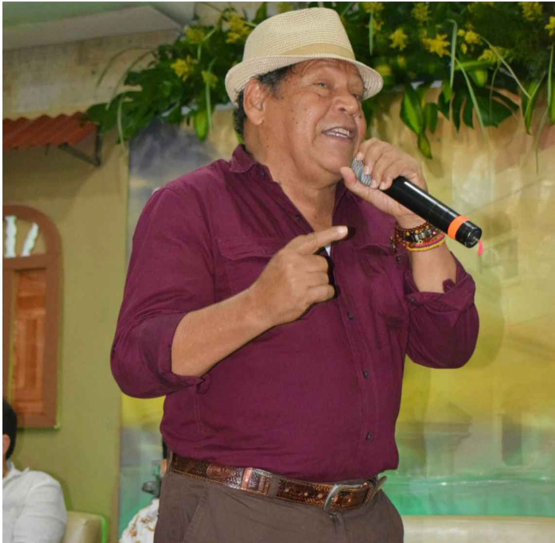
Rosendo Romero es el autor de la canción ‘Copitos de pino’, grabada por El Binomio de Oro en 1983 en la producción ‘Mucha calidad’.

‘Copitos’, melódicamente hablando, tiene un toque especial, fresco como el rocío que te riega la cara frente a una caída de agua; y en cuanto a contenido, a mi juicio, es una canción que no está influenciada, sencilla, muy verdadera, que salió directo del corazón, sin intervención del cerebro, sin premeditar su efecto poético, solo dejando salir el sentimiento en cada verso. O usted cree que decir “Cómo naranja dulce que se ha madurado entre las ramas, te ves bonita sin ser naranja, me causa gusto tenerte a ti”... ¿es pa’ jugá al volteá’o? ¿Eso se respeta! ¿Usted sabe lo que es describir con una melodía divina, el sabor de la mujer que amas? comparándola con el de una naranja que se coge madura de la rama, con ese sabor perfecto, sin el golpe de la caída; de mañana, cuando el frío de la madrugada en la sierra ha hecho su efecto refrigerante. Eso no tiene nombre! ¿Qué nombre se le pone a esa sensación de sentir su redondez fresca en la mano, oler ese frescor exquisito, al quitar la cáscara y devorar cada gajo lleno del más delicioso jugo? ¡Ay Dios mío! Eso solo lo puede describir un poeta consagrado. Y como la imaginación es mía, quiero pensar que mientras ‘Shendo’ se comía la naranja dulce; en otro plano, en una cocina de bahareque, huele a café en ollita, a arepa de queso en parrilla, con brasas suaves pa’ que no se