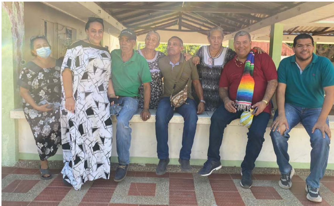
'Santa' ha caído súper bien en la arena política porque conocen de su trascendencia.