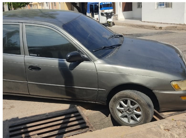
Este adulto mayor y el vehículo se vieron afectados al caer en la rejilla en mal estado en el centro de Barrancas.