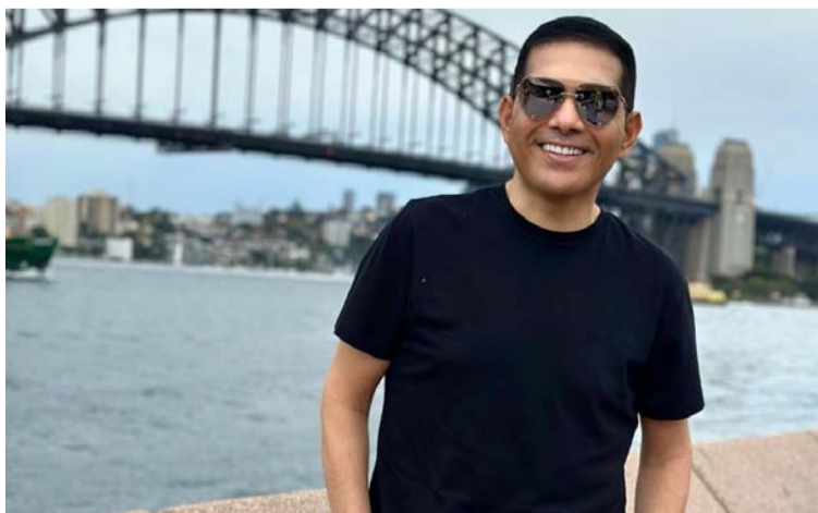
El artista vallenato Peter Manjarrés ya se encuentra en Australia, donde hará tres conciertos para su fanática.