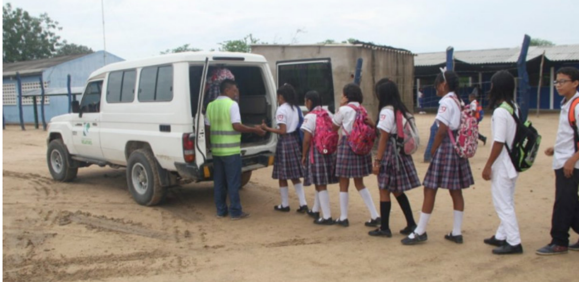
Vehículos deberán ser reemplazados por otros homologados para transporte escolar.

En esta resolución, el tiempo máximo de la au-