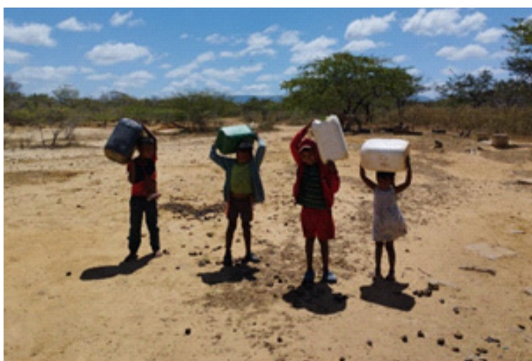
Las comunidades tienen alta población infantil y para acceder al agua tienen que recorrer muchos kilómetros.

condido de Montes de Oca, con cerca de 13 cascadas y algo más de 200 especies de plantas, en su parte baja se vive el conflicto por el agua por la incidencia local del cambio climático.