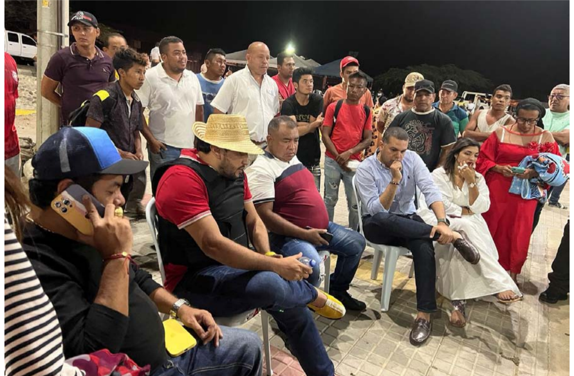
Delegados del MinInterior y la gobernadora Diala Wilches buscan solucionar bloqueos.

na Paradero – Maicao, 4. Km 5 vía Troncal del Caribe, entrada a Mayapo, 5. Km 85 vía Troncal del