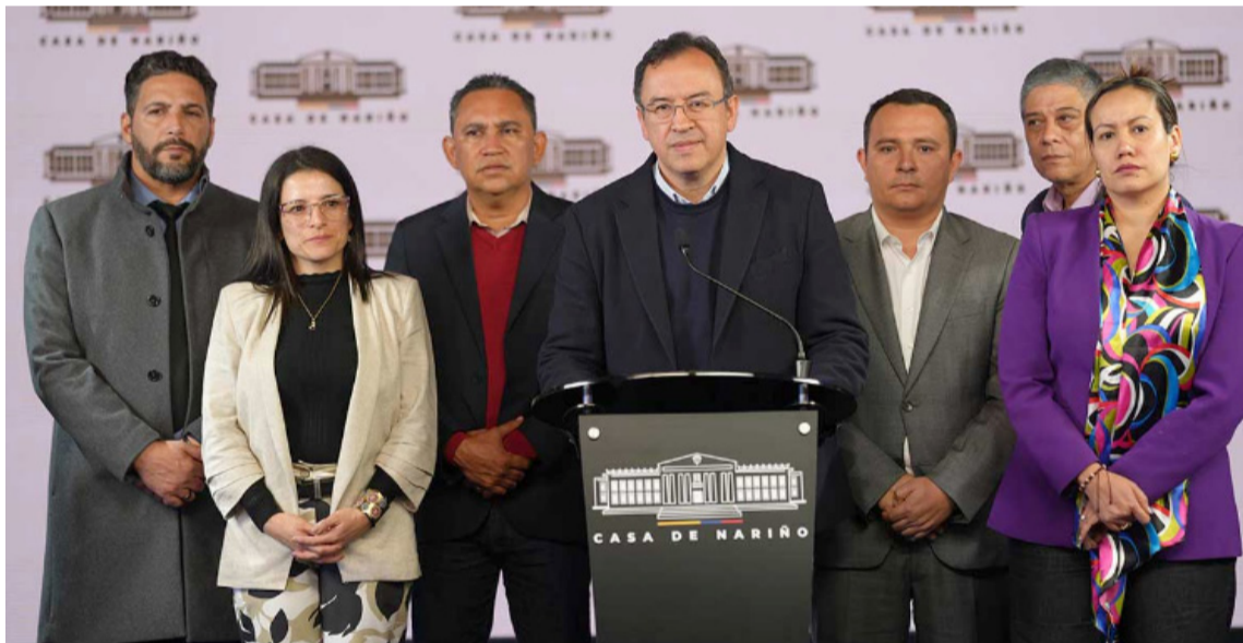
Alfonso Prada, MinInterior, cuando anunciaba el consenso sobre Reforma a la Salud.

El funcionario recordó que, como resultado de la reunión, se acordó preservar un sistema mixto de atención primaria que “pretende llevar la salud muy cerca de las casas”.