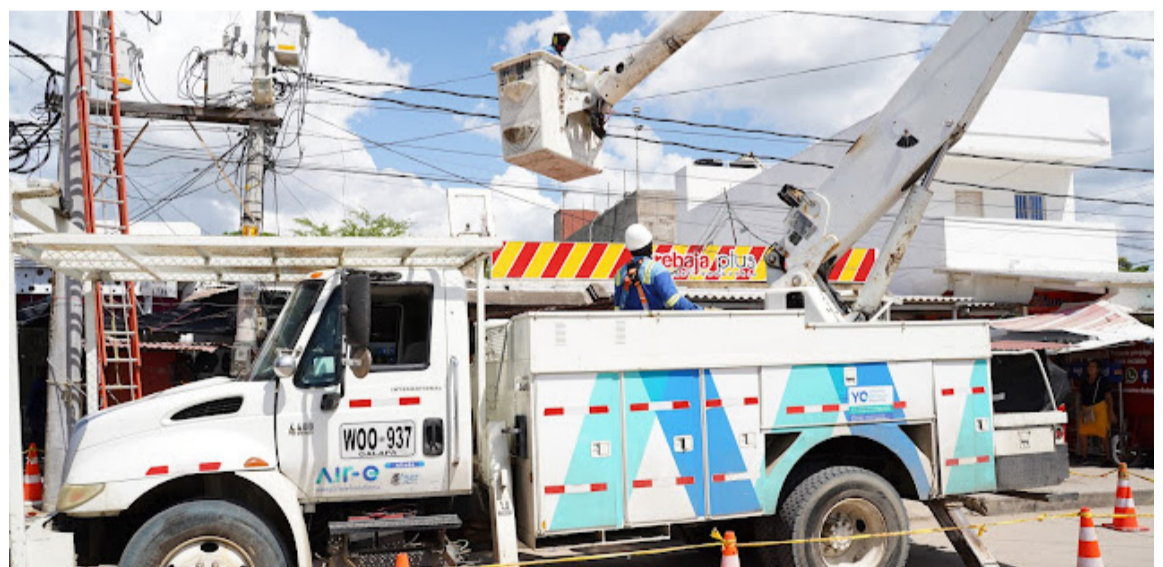
Por bloqueos en vías Air-e no ha podido realizar mantenimientos de la red eléctrica.

Blanco Obregón, se dedicaba a ser zapatero vivía en el barrio Villa Cacho de la Comuna 10 en la capital guajira. El hombre era muy conocido en el mercado nuevo.