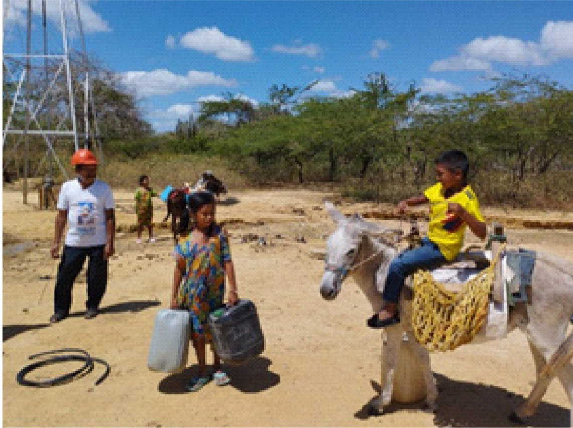
En la dotación de agua, las entidades territoriales no se han involucrado directamente.

Muy a pesar de que en el área se encuentra una reserva natural estratégica, como lo es el paraíso es-