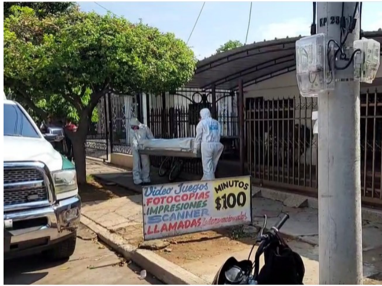
Momento en el cual agentes forenses retiraban el cuerpo de la mujer guajira de la vivienda en Valledupar.

Se presume que el cuerpo de Curvelo Ustáriz se encontraba sin vida desde el pasado domingo, pero solo fue hallado el miér-