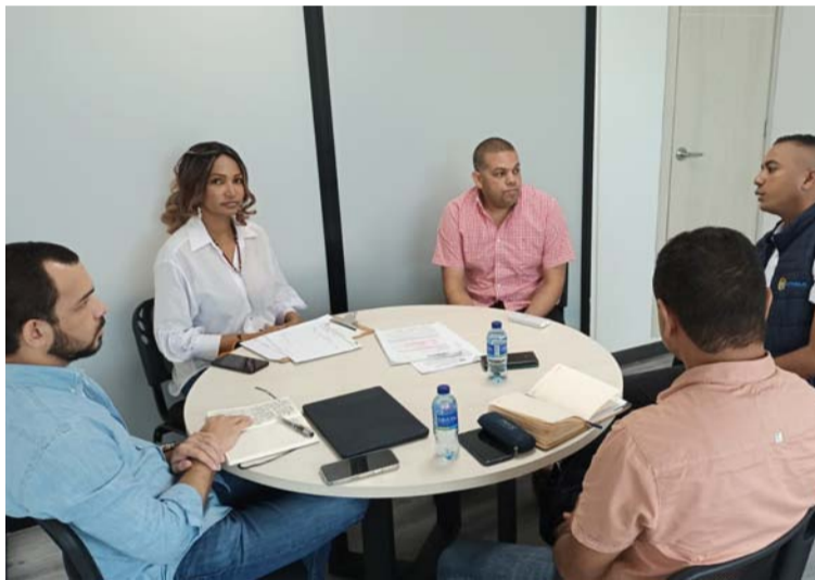
Se analizaron todas acciones para darle respuesta a la mano de obra que se presenta en el Departamento.