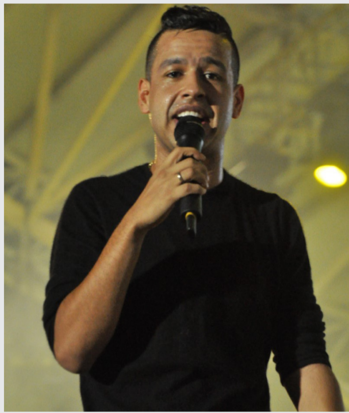
Martín Elías siempre se distinguió por llevar el mejor mensaje musical a sus miles de seguidores.

A los dos Martín Elías los marcó su amor por el vallenato, por su familia, por las cosas sencillas, pero de gran valor, cumpliendo el mismo ciclo de vida, 26 años, que es el número de la fecha de nacimiento de Diomedes Díaz, 26 de mayo de 1957.