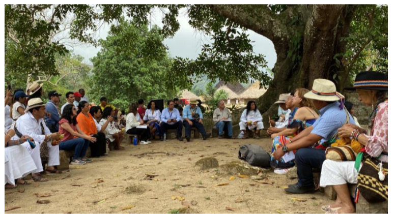
El fallo establece que el Igac y la Orip de Riohacha deberán actualizar la información catastral de los predios.

las cuencas de los ríos Ancho y San Salvador.