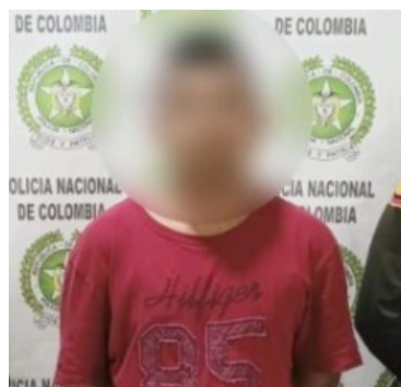
La identidad del hombre guajiro no fue revelada.

Al llegar al lugar, los uniformados se acercaron sigilosamente hacia el sospechoso que salía del inmueble. El sujeto de 28 años al parecer se puso nervioso e intentó llevar sus manos al machete y el cuchillo que portaba, pero no lo consiguió porque los policías lograron reducirlo y detenerlo.