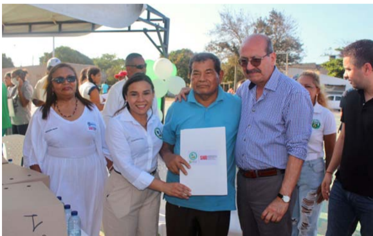
En el barrio El Prado, la Gobernación entregó 17 títulos prediales para mujeres y 13 para hombres.