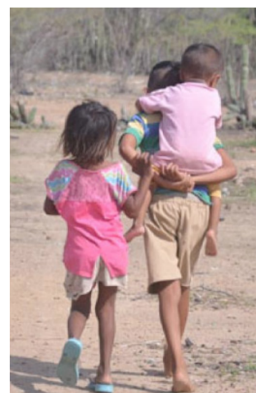
Se trata de un comunidad wayúu de 500 familias.

Acción Contra el Hambre, World Visión, SaveChildren, Fundación Baylor, WFP, Ejército Nacional. Para la actividad se contó con tres equipos médicos con medicamentos, servicio de odontología con kit odontológico, y entrega de mercados, fórmulas terapéuticas de consumo inmediato especiales para mujeres gestantes desnutridas, niños entre 6 y 59 meses desnutridos, paquetes nutricionales canasta