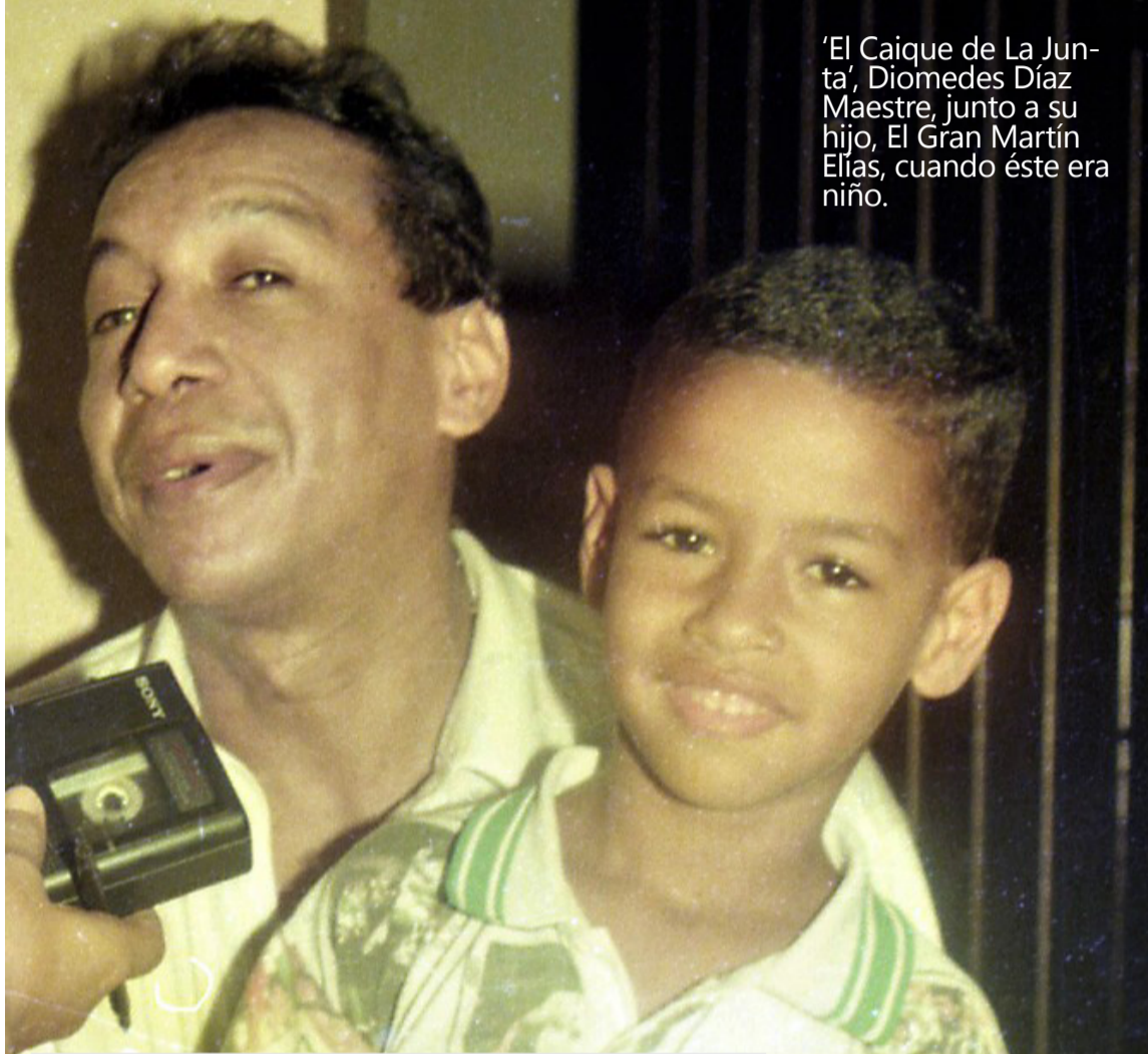
'El Caique de La Junta', Diomedes Díaz Maestre, junto a su hijo, El Gran Martín Elías, cuando éste era niño.

A mi me duele papá porque se fue de mi lado, no me voy a preocupar porque allá nos encontramos.