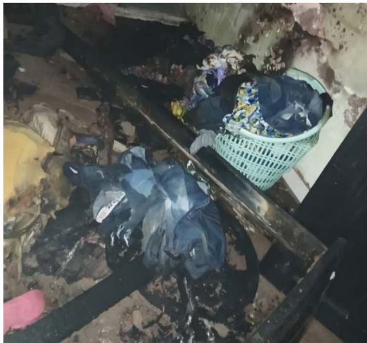
El fuego destruyó numerosos enseres en la vivienda y los daños materiales se estiman en 8 millones de pesos.

Luego de apagarse las llamas, la familia residente en la vivienda trataba de rescatar entre los escombros algunos elementos que pudieran salvarse de este lamentable incendio.