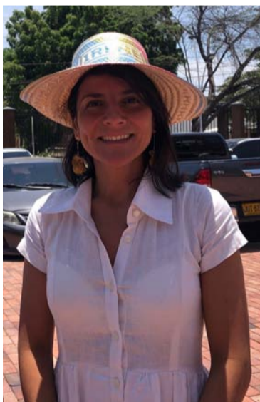
Ministra de Minas y Energía, Irene Vélez.