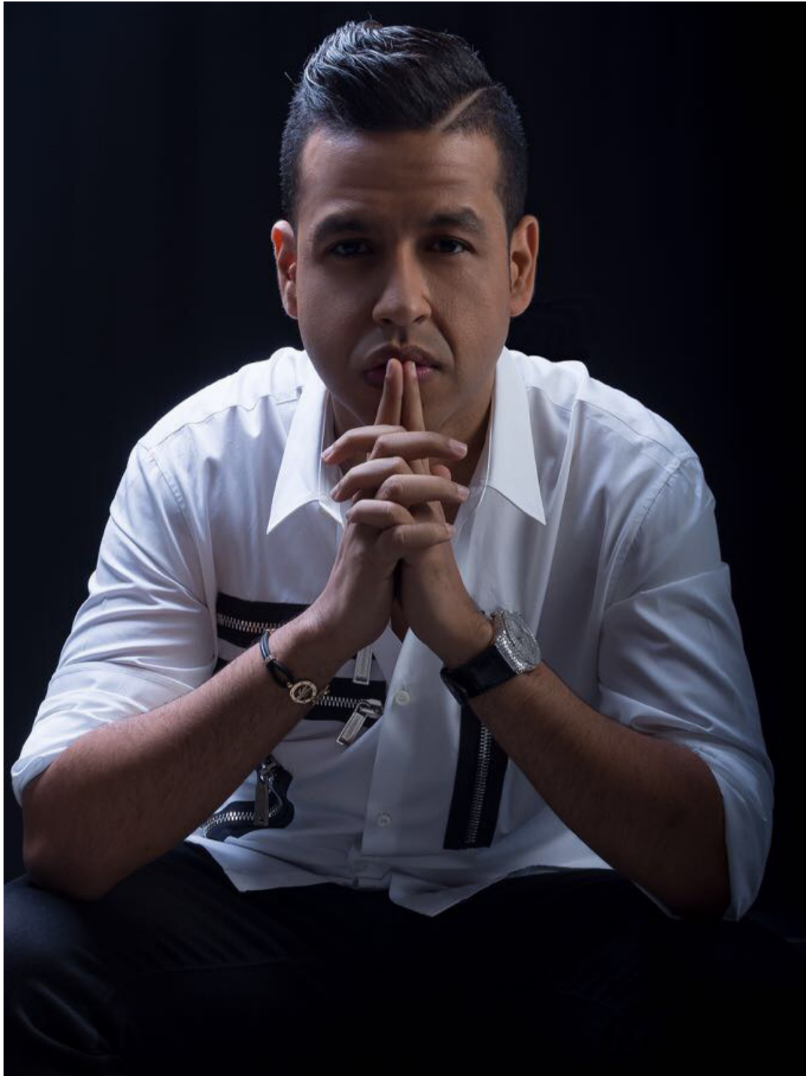
Martín Elías vivió una década de éxitos y en cada producción discográfica aumentaba la velocidad en su carrera musical para llegar a la cima de los famosos.