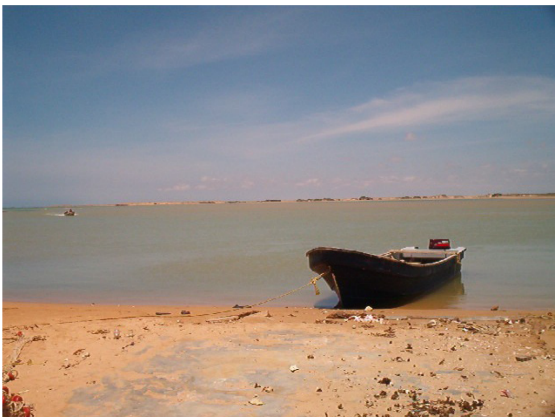
Se dice que la bahía es desconocida para los colombianos y ha sido muy poco estudiada.

Las expediciones Tres son las expediciones científicas que impulsa en el país, el ministerio de Ciencia, Tecnología e Innovación, que tiene como objetivo conocer el estado actual de los territorios colombianos, como también descubrir las especies ocultas de las zonas más biodiversas e identificar nuevas alternativas productivas proveniente de los recursos naturales.