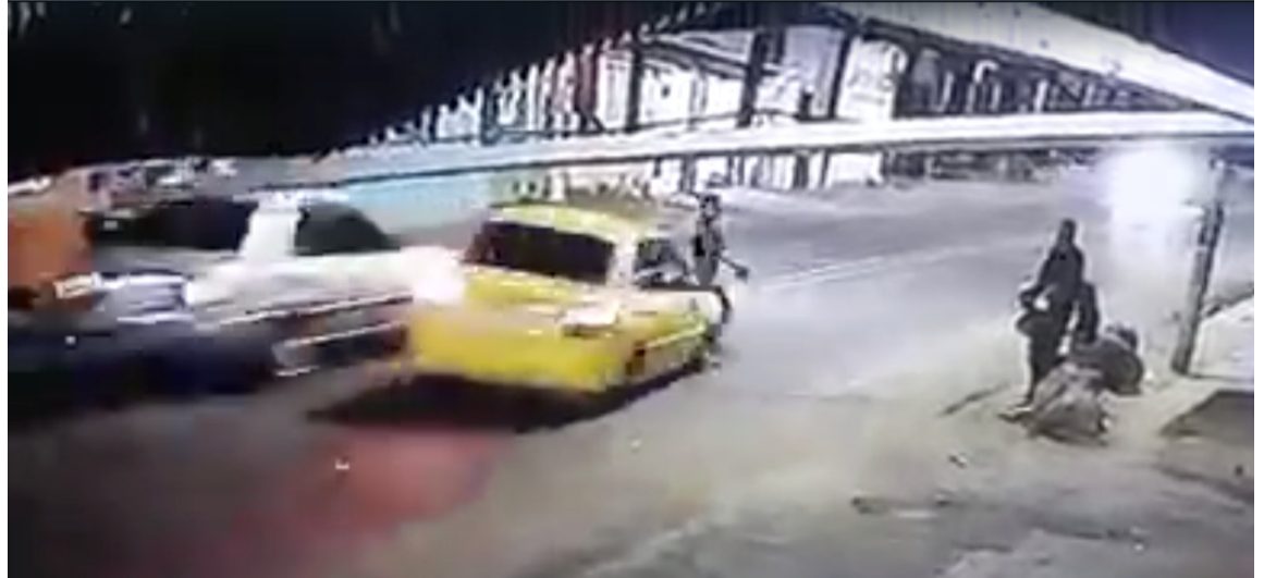
En video quedó registrado el instate en que la mujer fue arrollada por el taxi en Maicao.

Las autoridades competentes, al parecer iniciaron las investigaciones para dar con el paradero del conductor del taxi de color amarillo para que responda por lo sucedido.