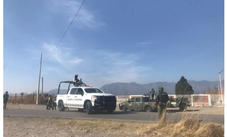
El vehículo se desplazaba por la carretera número 54, en el kilómetro 197, estado mexicano de Zacatecas.

Los fallecidos son dos personas de Colombia y dos de México, quienes murieron en el lugar de los hechos.