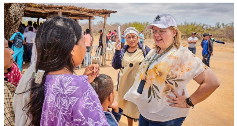
El recorrido permitió reiterar la importancia de promover entornos protectores con enfoque diferencial.

Por último, Cáceres resaltó la puesta en marcha de las zonas de recuperación nutricional, donde se contará con los Centros de Atención Primaria.