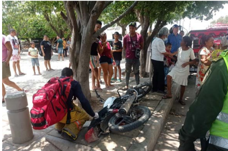
Tanto la mujer como el hombre fueron llevados al Hospital San Agustín de Fonseca, quedando bajo observación.

En la caída llevó la peor parte la copiloto de nombre