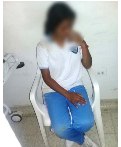
Los lesionados del accidente fueron llevados hasta el centro hospitalario San Rafael de la cabecera municipal, donde recibieron las atenciones.

Se quejan por falta de transporte escolar