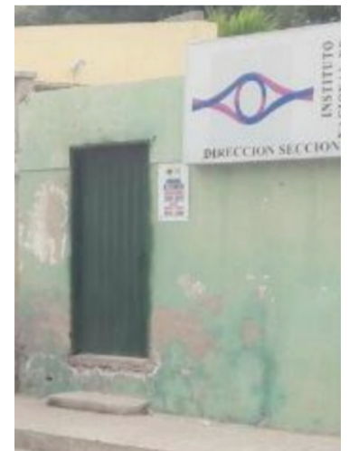
Vecinos hallaron el cuerpo de esta persona en su casa.

A los pocos minutos llegó la Policía a realizar la inspección técnica del cadáver y notaron que se trató, al parecer, de un suicidio.