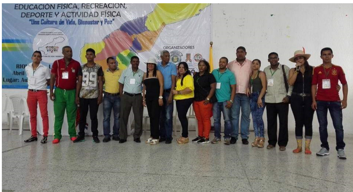
En el congreso podrán participar médicos, deportistas, entrenadores, árbitros, entre otros.

En el aula múltiple de la I.E. Almirante Padilla de Riohacha se llevará a cabo el III Congreso Departamental y II Internacional de Educación Física y Deporte, liderado por la Asociación de Profesores de Educación Física en La Guajira.