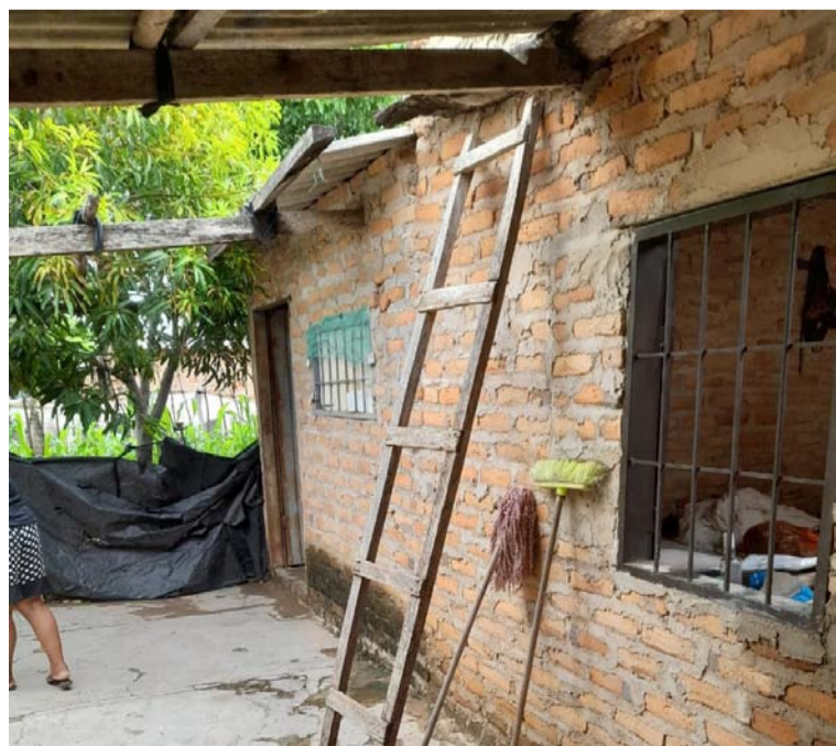
Se presume que cayó de lo más alto al encontrarse en el patio una escalera por donde subió al techo.

La Policía inició las investigaciones de rigor.