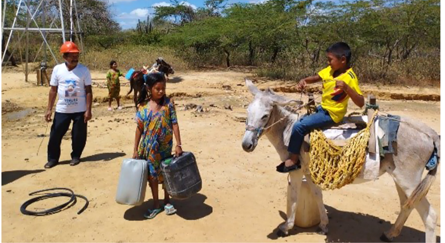
Con la fase de producción minera, el Ranchería ha resultado impactado y se encuentra inmerso en una crisis sin precedentes

Tiene que llover fuertemente y por largo tiempo, para verlo aparecer, pero también para verlo morir cuando ella termina. Sin embargo, su presencia es necesaria, ya que es vital para conservar los estuarios, como resultado de la dinámica del intercambio