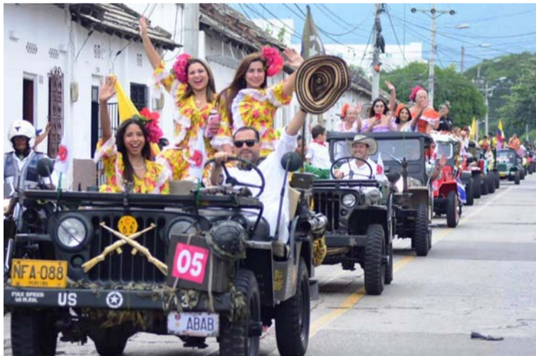
Más de 137 vehículos engalanaron esta fiesta andante que da apertura al 56° Festival de la Leyenda Vallenata.

Con mujeres vestidas de pioneras, llamativos colores y originales decoraciones, más de 137 vehículos engalanaron esta fiesta andante que da apertura al 56° Festival de la Leyenda Vallenata, en homenaje al juglar Luis Enrique Martínez, 'El Pollo Vallenato'.