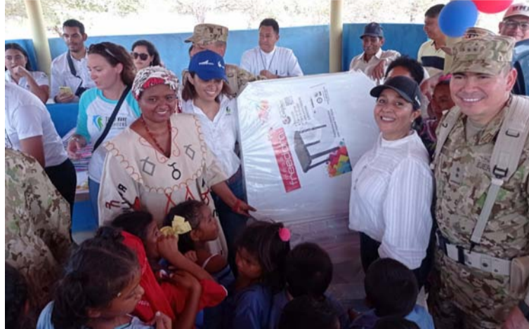
Miembros de La Cachaca 3 manifestaron su omplacencia por el apoyo recibido de parte del Ejército Nacional.

“Con la adecuación de la infraestructura del colegio, los niños tendrán un ambiente propicio para desarrollar la enseñanza del aprendizaje de manera satisfactoria. Nos sentimos muy agradecidos con la labor que el Ejército Nacional ha realizado en beneficio de nuestra comunidad; sigan contribuyendo al futuro