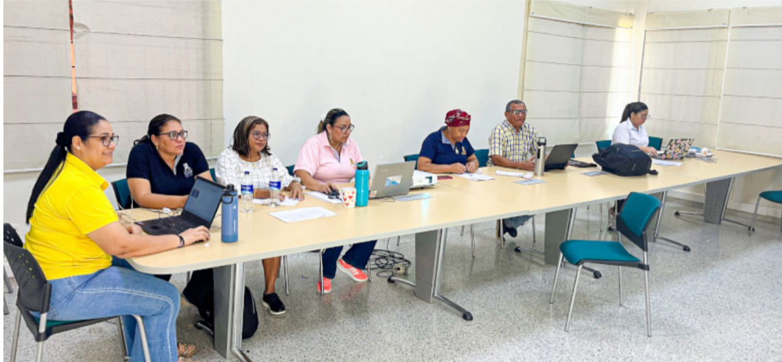
La formación académica tiene que responder a la interculturalidad para fortalecer los valores.