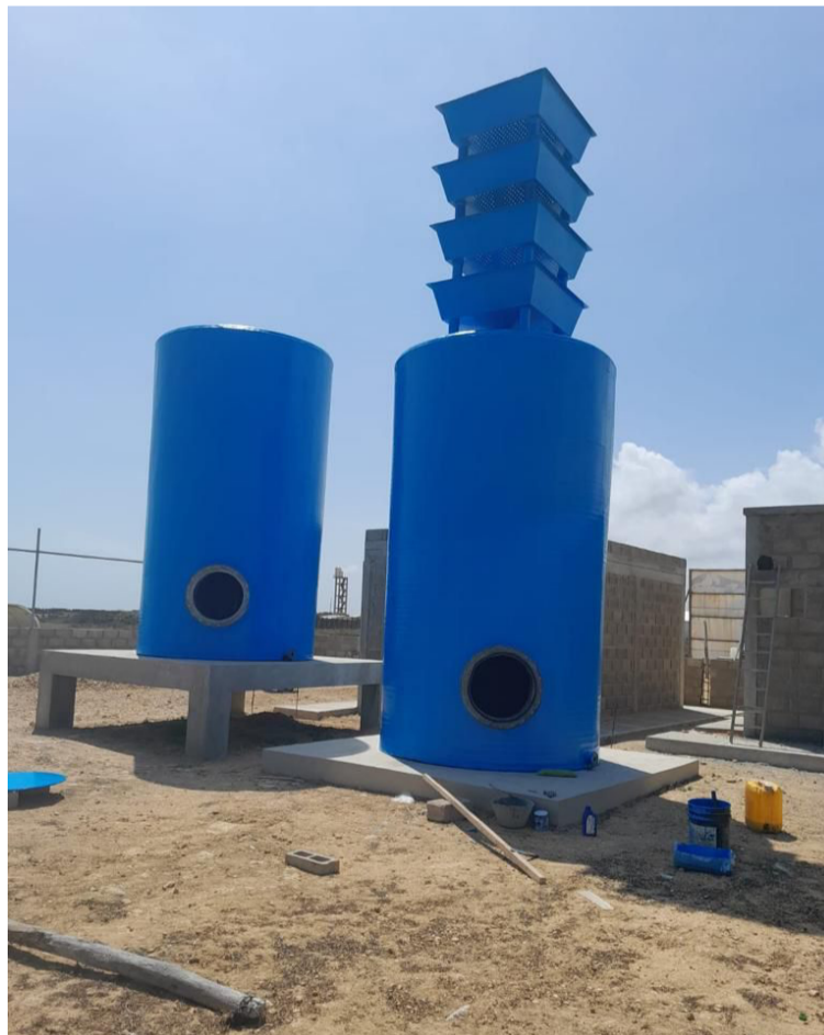
La inspección de la Corte sirvió para saber que las autoridades se encuentran de espaldas a necesidades de las comunidades.

En relación con la represa, esta se mantiene como un elefante blanco desde su inauguración en el 2010. Tiene una capacidad de alrededor de 198 millones de metros cúbicos de agua con los que se podría abastecer sistemas de acueductos, pero que este momento y como lo informó el Ministro de Agricultura, se adelantan estudios para utilizarla en el distrito de riego del