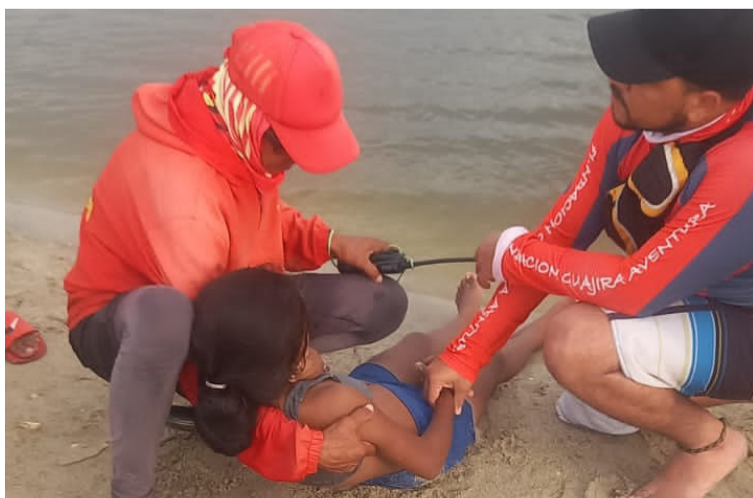
La menor venezolana fue socorrida en El Riíto por los salvavidas de la Fundación Guajira Aventura.

El suceso se registró la tarde del pasado lunes en el sector de las playas de Riohacha, en la desembocadura del río, cuando en un aparente descuido de