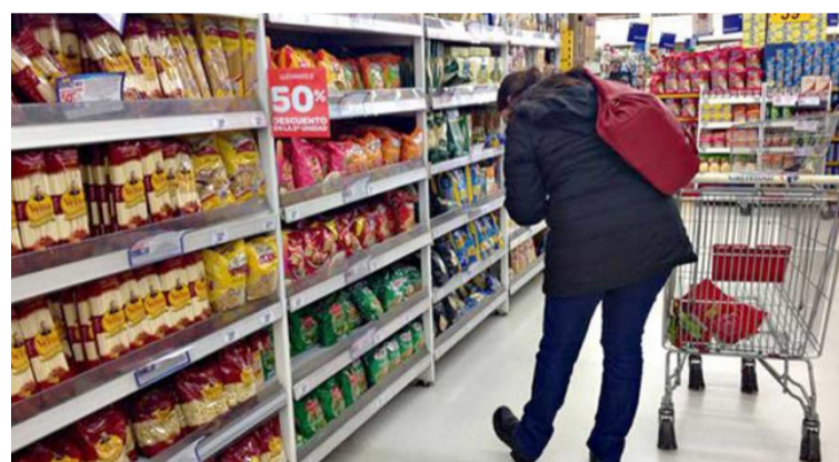
Por ahora se suman a la ‘guerra’ de precios bajos, el Grupo Éxito, Tiendas Ara y Supertiendas Olímpica.

ARA anunció también una reducción de precios en más de 200 productos que se comercializan en sus establecimientos. Entre los que se encuentran huevos, arroz, aceite, frijol, pastas, chocolate de mesa, avena, leche en polvo, productos de aseo para el hogar y aseo personal.