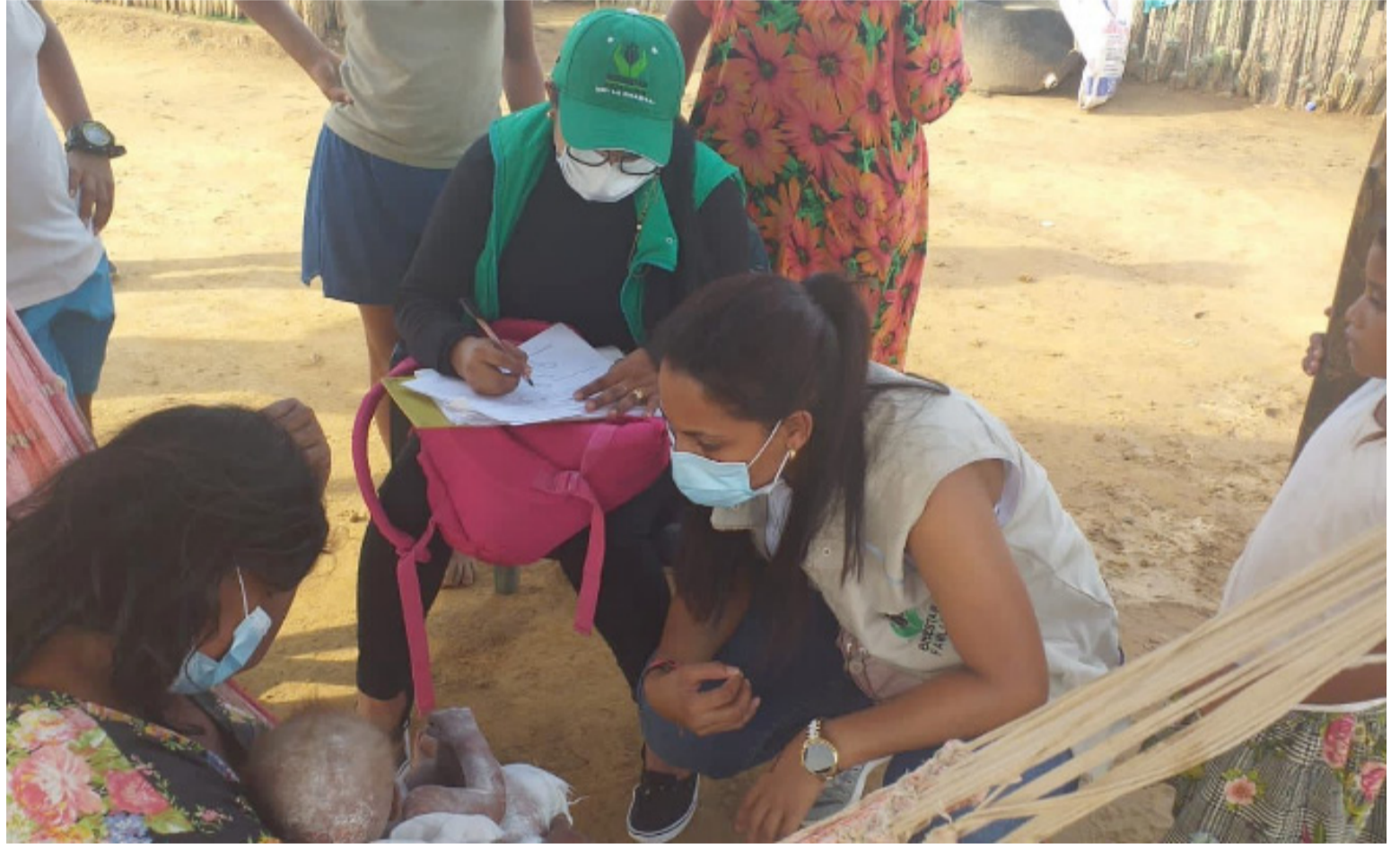
En el pilar de educación básica y media, La Guajira ganó un puesto, paso del 26 al 25 con 5,46.

En materia de pobreza, los datos más recientes a 2021, indican que la proporción de la población que se encontraba en condición de pobreza monetaria se redujo en 3,2 puntos porcentuales (p.p.), y se ubicó en 39,3 %. Algo similar se observó en pobreza multidimensional, con una caída anual de 2,1 p.p., y se situó en una