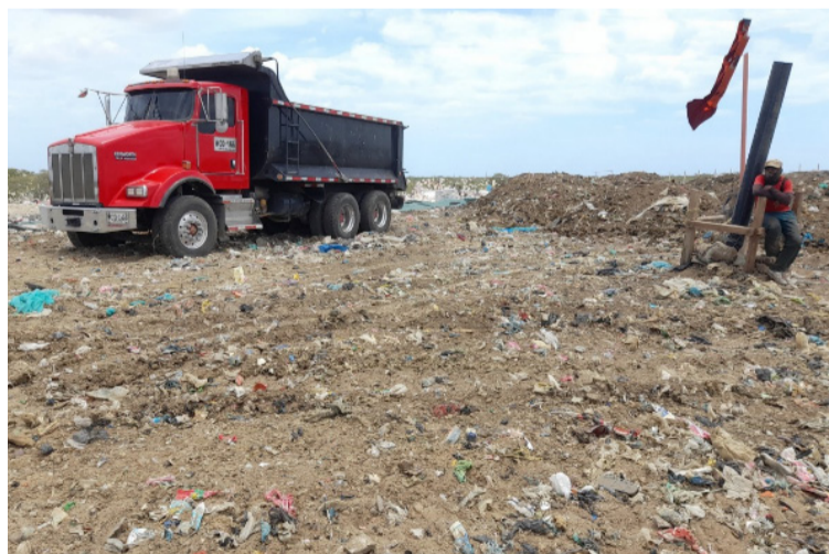
La proporción de población que se encontraba en condición de pobreza monetaria se redujo en 3,2 puntos porcentuales.

Si bien, los resultados mencionados resultan favorables, persisten aún algunos elementos que podrían poner en riesgo los logros alcanzados en los últimos dos años. En primer lugar, la inflación, que afecta la capacidad adquisitiva de la población, en especial de la más vulnerable, cerró en 2022 en una tasa de 13,12 %, la más alta en los últimos 24 años. Y aunque, en abril de este año registró