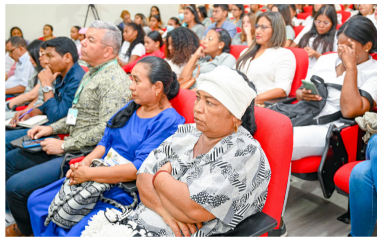
La jornada contó con una variedad de conferencias que abordaron temas para la atención intercultural en salud.

Este logro no solo es fundamental para la formación de nuevos profesionales, sino también para fomentar y promover la investigación en este tema, lo que contribuirá al desarrollo de la sociedad y a mejorar la calidad de la atención en salud.