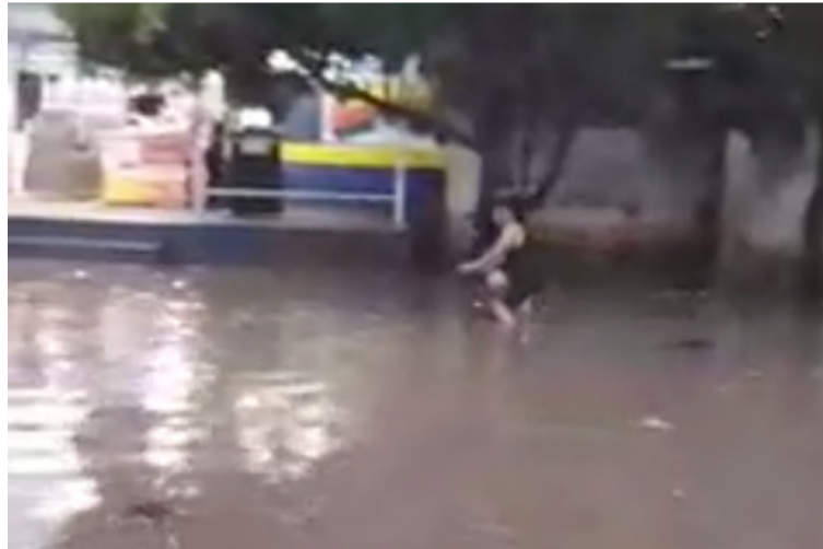
Aspecto de la inundación en las calles del barrio La Loma tras el primer aguacero caído este año en Riohacha.

“Es apenas la primera lluvia, no nos queremos imaginar las que venga, estamos ya cansados de esta situación de las malas acciones de los gobiernos de turno, toda la calle 27 está inundadas las vivien-