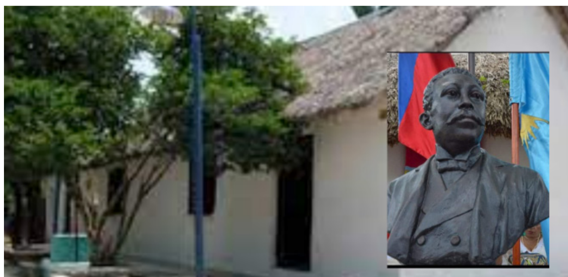
Robles fue un abogado y político, y primer afrocolombiano en llegar al Congreso.

Así mismo, fue el primer afrodescendiente en ser rector de una universidad, La Republicana, de donde nació la Universidad Libre.