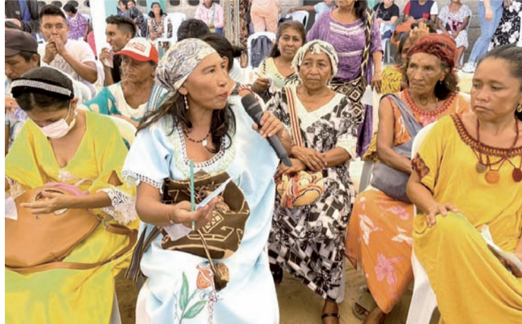
El Icbf busca sumar esfuerzos para acompañar el crecimiento de la generación para la vida y la paz en La Guajira.

Con este intercambio de experiencias, el Icbf busca sumar esfuerzos para acompañar el crecimiento de la generación para la vida y la paz en La Guajira.