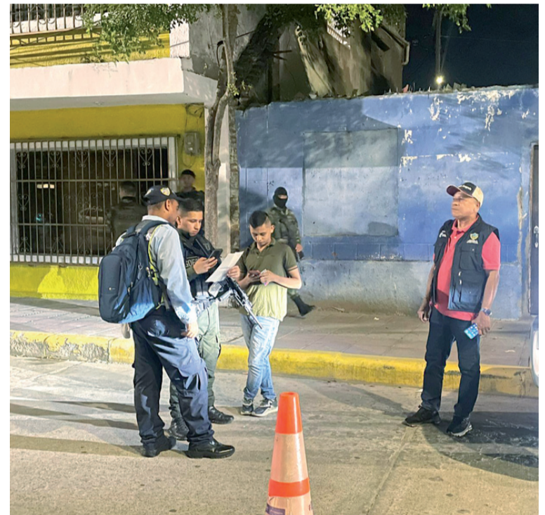
En la jornada se realizaron planes de requisa, control y verificación de documentos a personas y vehículos.

Daños ocasionados ascienden a $7 millones