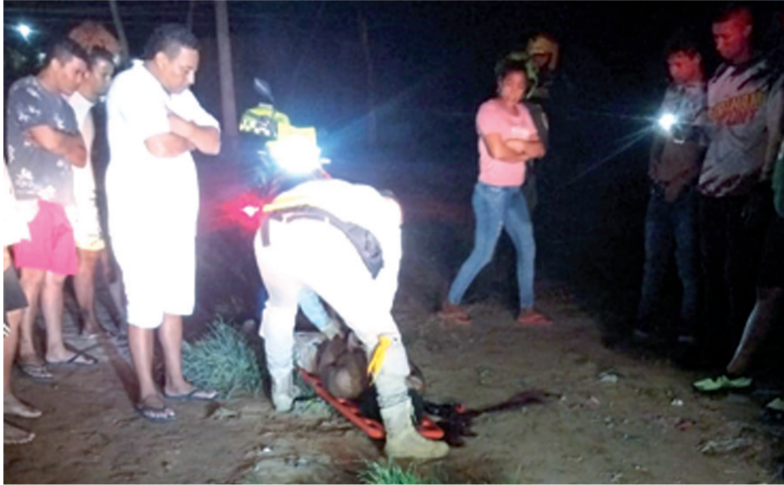
En extrañas circunstancias, resultó herido un habitante de calle de un tiro en el cuello.

Informó la Policía que el habitante de calle fue trasladado en una ambulancia hacia el Hospital Nuestra Señora de los Remedios, donde fue atendido y su estado de salud, al parecer es delicado.