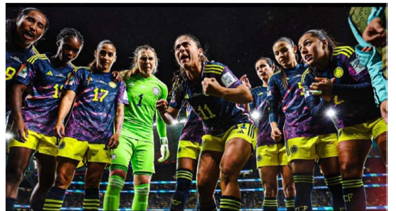
Las 'Chicas Superpoderosas' tuvieron victoria 2-1 ante Alemania, en desarrollo de la segunda fecha del grupo H.

Alemania no perdía en fase de grupos de un torneo orbital de selecciones mayores desde 1995, lo que demostró la im-