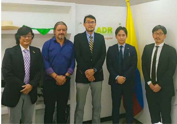
El proyecto promueve la paz con legalidad y busca llegar a los territorios afectados por el conflicto armado.

El proyecto promueve la construcción de paz con legalidad y busca llegar a los territorios afectados por el conflicto armado, reforzando