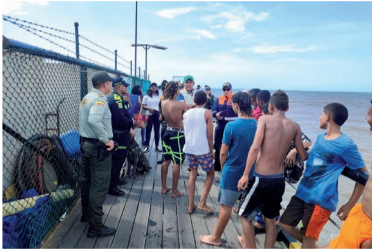
Las acciones son desarrolladas para hacer énfasis en la protección de la vida, bienes y honra de los ciudadanos.

La campaña de prevención estuvo liderada por el Departamento de Policía Guajira, a través de Policía de Turismo, Infancia y Adolescencia, Carabineros, Gaula de la Policía, Secretaría de Turismo y Salud del Distrito, la Dimar y los salvavidas de la Fundación Guajira, quienes ofrecieron toda la información necesaria para fomentar el buen compor-