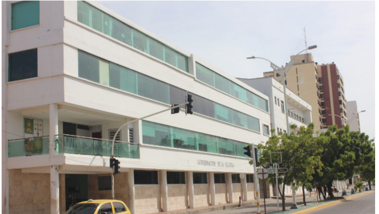
Los guajiros esperan disfrutar de unas elecciones tranquilas, donde prime el respeto por las ideas y los programas.

Se desempeñó como profesional especializada de la