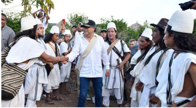
Petro hizo el llamado en el lanzamiento de la estrategia 'Tejido de Paz', un programa de apoyo a la construcción de paz.

"Ahora se trata de ver cómo esas comunidades indígenas que hoy viven en muchas partes del territorio nacional, bajo el miedo, bajo