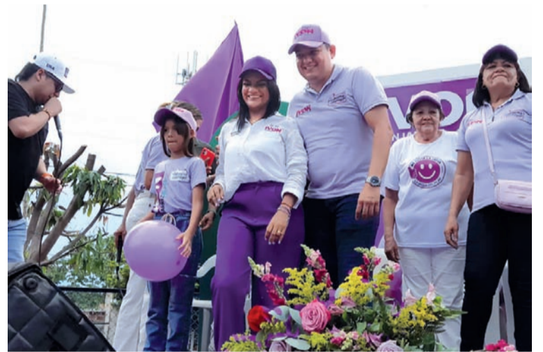
Ivón Manjarrez indicó que su gobierno buscará aprovechar la parte agropecuaria, fortalecer el campo y a los campesinos.