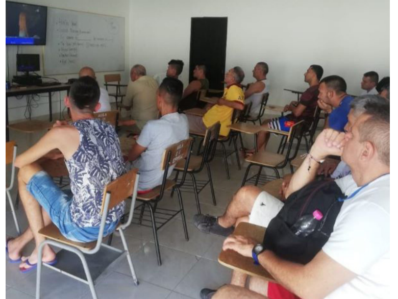
Este ciclo de entregas audiovisuales hace parte de la estrategia de circulación 'Maleta de la Diversidad'.

estrategias muy importantes en cuanto a la preparación para la libertad a través de la cultura. Buscamos los mejores escenarios para que la población privada de la libertad aproveche el tiempo libre y pueda generar espacios de capacitación