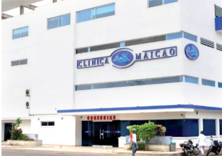
Dos hombres en motocicleta abordaron a la víctima y sin mediar palabras, le dispararon en varias oportunidades.