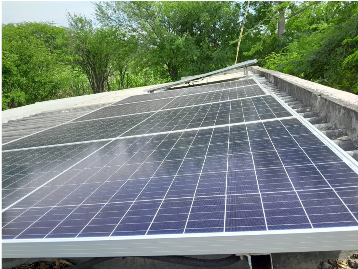
Este es el equipo instalado en la parcela Villa Jayo, corregimiento de Río Seco, jurisdicción de Valledupar, donde acceden a energía eléctrica de fuentes limpias.

Después de sortear dificultades y estudiar propuestas, Arregocés Montero tomó la decisión de apostarle a la energía solar teniendo en