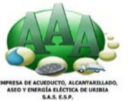
TARIFAS 2 SEMESTRE AÑO 2023

Además de ser la hija del 'Cacique de La Junta', Diomedes Díaz, 'Lily' en los últimos años se ha convertido en influencer en las redes sociales con la creación de contenidos.