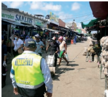
La colisión solo dejó daños materiales por $7 millones.

Este accidente ocurrió la tarde del sábado en la calle 12 con carrera 11 esquina, cerca al mercado público del municipio de