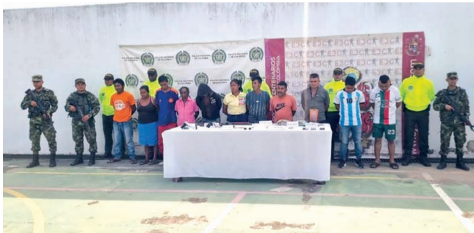
El Ejército desvertebró una red de microtráfico que al parecer delinquía en diferentes zonas del municipio de Becerril, Cesar.