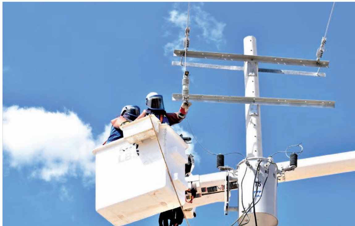
La empresa invita a los usuarios a consultar en su factura, el circuito al que pertenecen.

El servicio de energía será suspendido este lunes en la zona urbana y rural de Urumita, La Jagua del Pilar y el Circuito Villanueva 2, por los trabajos de adecuaciones que se estarán adelantando.