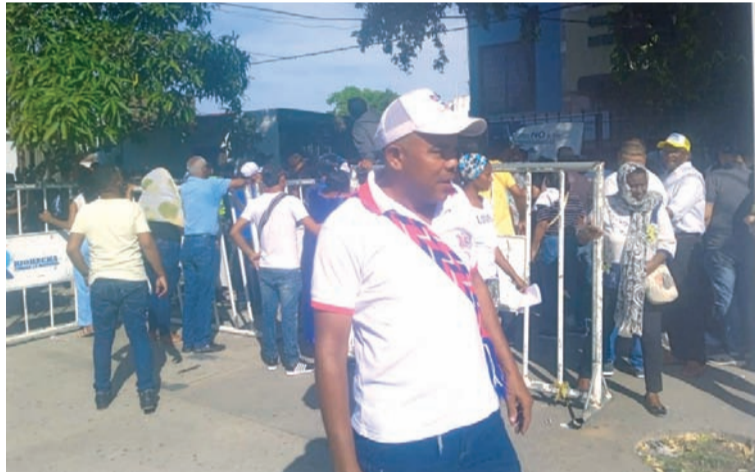
Candidatos a edil en Maicao denunciaron que en la Registraduría hubo mucha demora en el último día de inscripción.

Los candidatos a ediles de los corregimientos de la zona rural del Distrito de Riohacha, denunciaron que