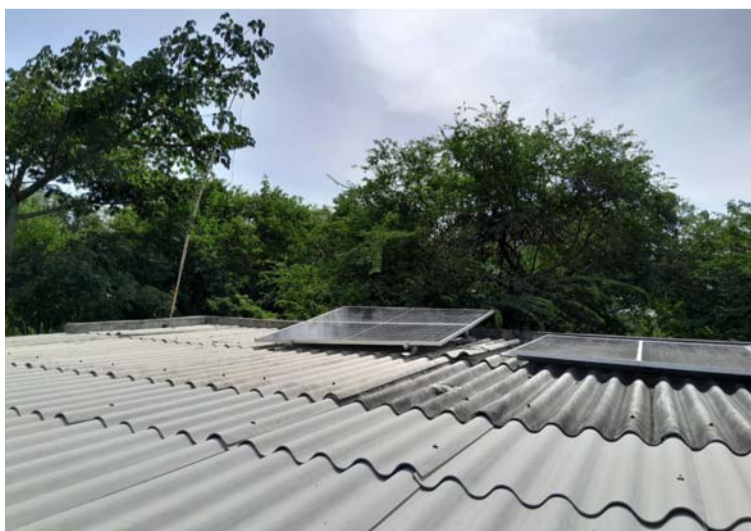
Los paneles en el techo donde captan la energía solar, y la noche en Villa Jayo con su sistema de energía solar.

la microlocalización Villa Jayo. Eso sí, en cuatro horas instalaron el novedoso “sistema fotovoltaico”.